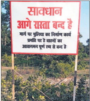
मार्ग बंद होने का लगा बोर्ड।