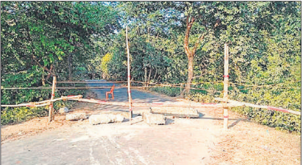
गोला-कुकरा मार्ग पर जंगल के पास लगाई गई बैरिकेडिंग।

सामान्य तौर पर गोला से कुकरा की दूरी करीब 10 किलोमीटर है, लेकिन मार्ग बंद होने के बाद लोगों को अब 25 किलोमीटर तक का फेरा लगाना पड़ रहा है। इससे समय, ईंधन और पैसे की बर्बादी हो रही है। सबसे ज्यादा असर गरीब और मध्यम वर्गीय परिवारों पर पड़ रहा है, जो रोजमर्रा के कामों के लिए इस मार्ग पर निर्भर थे। गोला की ओर से आने पर जंगल के पास बैरिकेडिंग कर मार्ग