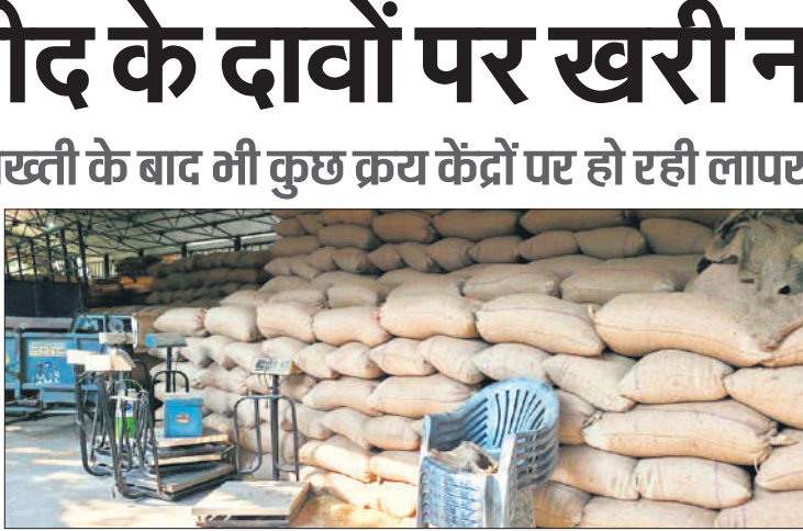
मंडी समिति पीलीभीत स्थित एक क्रय केंद्र पर कुछ इस तरह थे हालात।