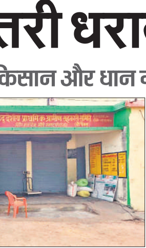
सराय सुंदरपुर क्रय केंद्र पर शनिवार दोपहर पसरा सन्नाटा।

अमृत विचार : माधोटांडा क्षेत्र में शनिवार सुबह उस समय दहशत फैल गई, जब एक बाघ गोशाला में जा घुसा। बाघ के घुसने से गोशाला के पशुओं में भगदड़ मच गई। माजरा देखकर केयर टेकर समेत अन्य ग्रामीणों ने शोर-शराबा किया, तब कहीं जाकर बाघ गोशाला से निकलकर जंगल सीमा पर लगी तार फेंसिंग को फांदकर जंगल की ओर भाग निकला। घटना के बाद से ग्रामीणों में खासी दहशत है। घटना माधोटांडा के परशुरामपुर में शनिवार सुबह हुई। यहां जंगल से सटे इलाके में गोशाला स्थापित की गई है। वर्तमान में यहां करीब 50 से अधिक पशु संरक्षित हैं। गोशाला में तीन केयर टेकर भी रहते हैं। शनिवार