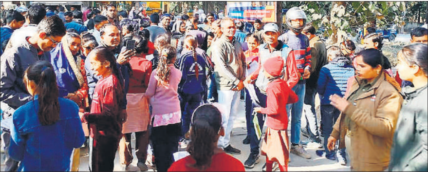
बच्चों का इंतजार करते अभिभावक।

जनपद में शनिवार को शहर ब्लॉक के राजकीय बालिका इंटर कॉलेज, सनातन धर्म बांके बिहारी राम इंटर कॉलेज, लिटिल एंजेल्स स्कूल, अंगूरी देवी बालिका इंटर कॉलेज, ड्रमंड राजकीय इंटर कॉलेज, चिरौजी लाल वीरेंद्र पाल इंटर कॉलेज, वीरांगना अवंती इंटर कॉलेज, हाफिज रहमत खां इंटर कॉलेज में जवाहर नवोदय इंटर कॉलेज की प्रवेश परीक्षा कराई गई, जबकि पूरनपुर में तीन सरस्वती विद्या मंदिर इंटर कॉलेज, सनातन धर्म इंटर कॉलेज, गुरुनानक इंटर कॉलेज और बीसलपुर में सरस्वती विद्या मंदिर इंटर कॉलेज, बालाजी