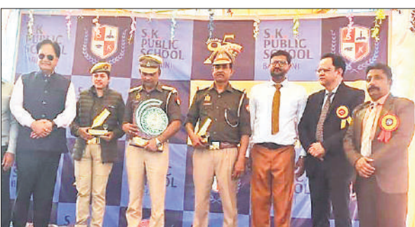
समारोह में मौजूद शिक्षक व अन्य।

शैक्षणिक एवं सह-शैक्षणिक गतिविधियों में उत्कृष्ट प्रदर्शन करने वाले सभी विद्यार्थियों के लिए सम्मानित किया गया। पब्लिक स्कूल के प्रधानाचार्य जीवन