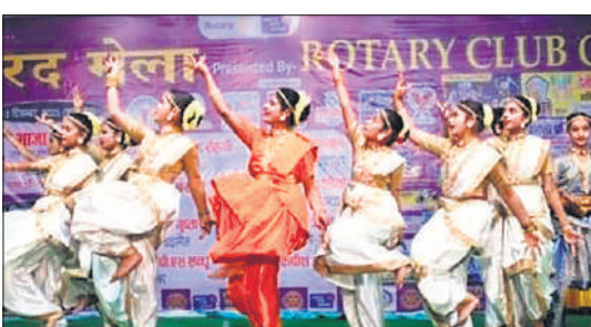
सांस्कृतिक कार्यक्रम में भाग लेते प्रतिभागी।