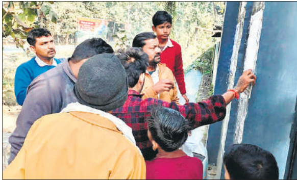
परीक्षा केंद्र के बाहर सूची देखते परीक्षार्थी व अभिभावक।

वीरांगना अवंती बाई इंटर कॉलेज में 126 अनुपस्थित रहे। परीक्षा की निगरानी के लिए उड़नदस्ता में प्रशासनिक अधिकारियों को