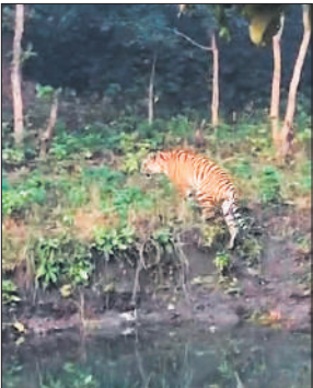
वाटर होल में पानी पीता टाइगर।