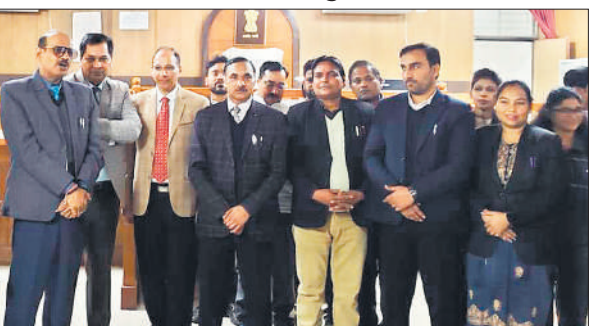
राष्ट्रीय लोक अदालत में मौजूद न्यायिक अधिकारी व अन्य।