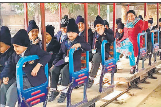
शहीद उद्यान में ट्रेन का आनंद लेते बच्चे।