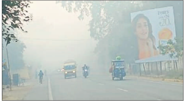
कोहरे में लाइट जलाकर जाते वाहन चालक।

नलकूप को ठीक कराने का कार्य कराया जा रहा है और जल्द ही समस्या का समाधान कर आपूर्ति बहाल कर दी जाएगी।