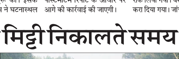
बहगुल नदी किनारे घटना स्थल पर जांच करती जैतीपुर पुलिस।