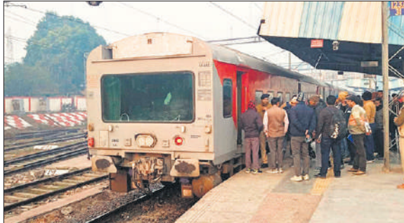
मुरादाबाद तक विंडो निरीक्षण करते डायरेक्टर जनरल सेफ्टी।