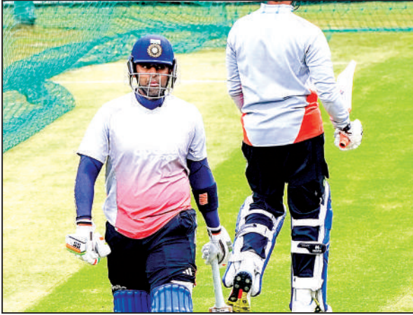
अभ्यास सत्र के दौरान कप्तान सूर्यकुमार यादव।

हैदराबाद : अर्जेंटीना के महान फुटबॉलर लियोनेल मेसी 'जीओएटी भारत दौरा 2025' की कोलकाता में खराब शुरुआत के बाद दूसरे चरण के लिए शनिवार की शाम को यहां पहुंच गए। निजामों के शहर में उनके कार्यक्रम की शुरुआत शाम सात बजकर 50 मिनट पर हुई। तेलंगाना के मुख्यमंत्री ए रेवंत रेड्डी और लोकसभा में विपक्ष के नेता राहुल गांधी ने मुलाकात की।