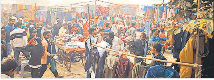
साप्ताहिक बाजार में खरीदारी को जुटी भीड़।

अमृत विचार : कस्बा इस्लामनगर में बिल्सी मार्ग पर हर शनिवार को लगने वाली साप्ताहिक बाजार अब आम लोगों के लिए परेशानी का कारण बनती जा रही है। बाजार के चलते मुख्य मार्ग पर घंटों जाम की स्थिति बनी रहती है। इससे राहगीरों, स्कूली वाहनों, ऍंबुलेंस व अन्य जरूरी सेवाओं के लिए खासी दिक्कत का सामना करना पड़ता है। बताया जा रहा है कि प्रशासन की अनुमति के बाद लगभग एक महीने से बाजार का लगना शुरू हुआ है, लेकिन बाजार का नैमेनजेंट कर रहे लोगों द्वारा यातायात व्यवस्था को लेकर कोई ठोस इंतजाम नहीं किए