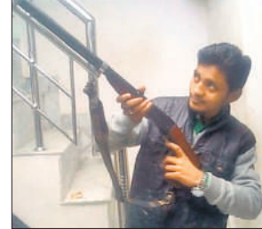
बंदूक के साथ युवक का फोटो।

कुंवरगांव, अमृत विचार : कुंवरगांव थाना क्षेत्र के एक गांव निवासी युवक का बंदूक के साथ फोटो सोशल साइट्स पर वायरल हो रहा है। किसी ने फोटो एक्स हैंडलर पर शेयर कर दिया। लिखा कि बंदूक के साथ टशन में युवक क्षेत्र में दहशत फैला रहा है। पुलिस ने पोस्ट का संज्ञान लिया।