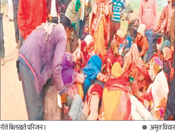
रोते बिलखते परिजन।

परीक्षा देने के लिए फर्रुखाबाद जा रहे थे तीनों दोस्त, मदनापुर के पास गंगा एक्सप्रेस वे पर हुआ हादसा