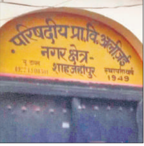
जर्जर विद्यालय अलीजई नगर क्षेत्र।

● शिकायतों के बाद अभी तक नहीं हो सका जीर्णोद्धार