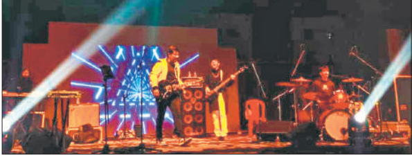
मेडिकल कॉलेज में सांस्कृतिक कार्यक्रम प्रस्तुत करते कलाकार।