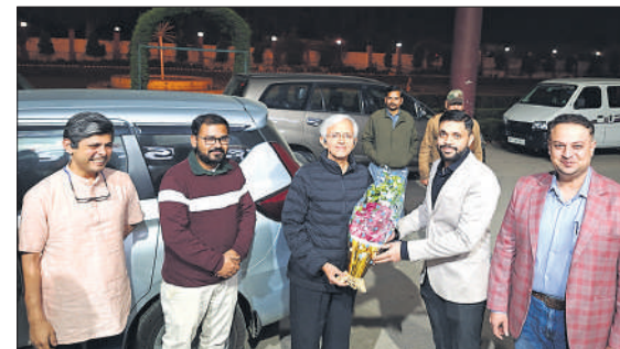
वरुण अर्जुन मेडिकल कॉलेज में अतिथि का स्वागत करते कॉलेज के अधिकारी।

यह सत्र विशेष रूप से उन चिकित्सकों, पोस्ट ग्रेजुएट छात्रों और स्वास्थ्य पेशवरों के लिए आयोजित किया गया था, जो ग्रामीण और शहरी क्षेत्रों में स्पाइनल टीबी जैसी गंभीर बीमारी