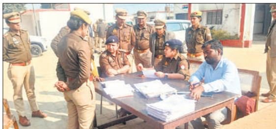
समाधान दिवस के दौरान जनसुनवाई करते पुलिस और प्रशासनिक अधिकारी।

थाना समाधान दिवस के दौरान क्षेत्र से आए नागरिकों की शिकायतों को अधिकारियों ने सुना। शिकायतों के निस्तारण के निर्देश अधिकारियों ने संबंधित अधिकारियों का दिए। कार्यक्रम के दौरान अपर पुलिस अधीक्षक ग्रामीण ने थाना