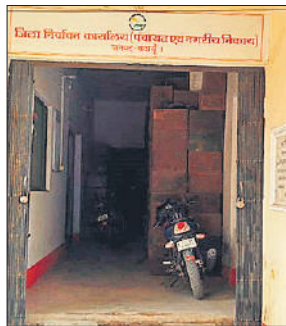
पंचायत एवं नगरीय निर्वाचन कार्यालय।

आगामी वर्ष 2026 मई जून माह के दौरान त्रिस्तरीय पंचायत चुनाव होने हैं। जिले में एक तरफ मतदाता सूची के पुनरीक्षण का कार्य पूरा हो गया है तो दूसरी तरफ छपाई के बाद लखनऊ से मतपत्र प्रदेश के सभी जिलों में भेजे जा रहे हैं। जिले में बनाए गए 3150 मतदेय स्थलों पर