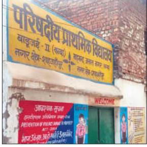
जर्जर परिषदीय विद्यालय बाड़ूजई द्वितीय।

जिले में 2716 प्राथमिक विद्यालय हैं, इनमें लगभग साढ़े तीन लाख छात्र पढ़ रहे हैं। बेसिक