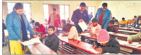
राजकीय कन्या इंटर कॉलेज में निरीक्षण करती सचल दल की टीम।

जनपद की तहसील बिसौली के विकासखंड आसफपुर के गांव सीकरी में स्थापित नवोदय विद्यालय में कक्षा 6 में प्रवेश के लिए शनिवार को प्रशासन की ओर से बनाए गए 12 केंद्रों पर प्रवेश परीक्षा संपन्न हुई। परीक्षा के लिए 4077 ने आवेदन किया था। जिसमें से 3,225 बच्चे उपस्थित रहे। 852 बच्चे अनुपस्थित रहे। मदनलाल इंटर कॉलेज बिसौली में पंजीकृत 517 बच्चों के सापेक्ष 395, एनए इंटर कॉलेज बिल्सी 572 में 472, राजकीय कन्या इंटर कॉलेज