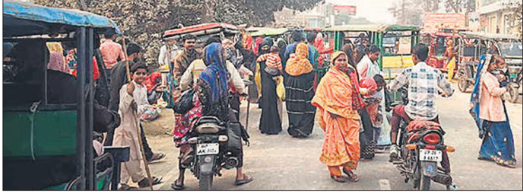
● अमृत विचार

अग्निशमन यंत्र उपलब्ध हैं और न ही किसी प्रकार की सतर्कता बरती जा रही है। जो किसी बड़े हादसे को न्योता दे सकती है। इसके अलावा जाम की स्थिति को नियंत्रित करने के लिए थाना स्तर से भी पुलिस की तैनात नहीं किए जाते हैं। पुलिस की