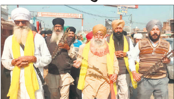
नगर कीर्तन में शामिल संगत के लोग।