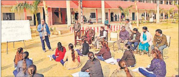
प्रशिक्षण के दौरान मौजूद प्रशिक्षु।