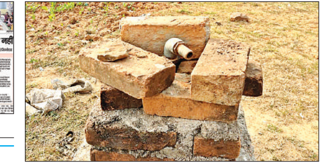
बिना बिजली तीन साल से सूखा पड़ा बोर।