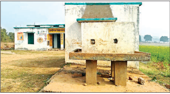
पानी की सूखी पड़ी टंकी।