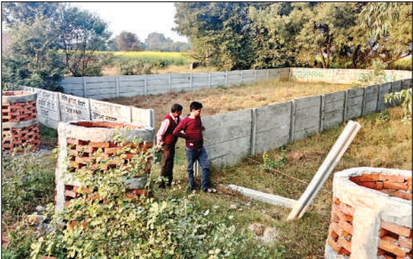
अवैध जमीन पर कब्जा हटवाते जिम्मेदार।

इस दौरान तहसील औरैया के ग्राम कस्बा खानपुर ,बरीपुर माफी, जरूहौलिया , पढीन , माल्हेपुर , दूधियाखेडा, सेहुद , कंजरी, परधईपुर में वर्षों पुराने कुल 22 मामलों को मिशन समाधान के अन्तर्गत राजस्व व पुलिस से चकमार्ग, नाली/कूल, तालाब, खेल का मैदान व बंजर भूमि आदि की पैमाइश कर निशान देही कराते हुए अवैध कब्जा हटवाया गया। इसके साथ-साथ आपसी विवादित मामलों का भी निस्तारण किया गया। इस दौरान तहसील अजीतमल के ग्राम अमावता, बाबरपुर, मुरुदना, तेज