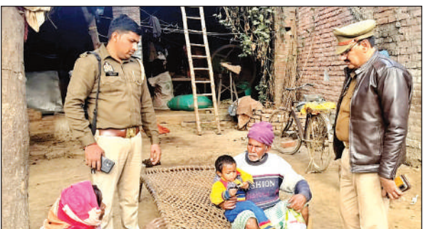
बच्चों को परिजनों के सुपुर्द करते पुलिसकर्मी।

सुंदरकांड पाठ 16 को फफूंद (औरैया)। हिन्दू युवा मोर्चा संघ के तत्वाधान में दिनांक 16 दिसंबर दिन मंगलवार को पांचवा सुंदर काण्ड का आयोजन स्थान काली माता मंदिर जैतपुर फफूंद के प्रांगण में सुंदर कांड का आयोजन किया जा रहा है। श्री काली माता मंदिर जैतपुर फफूंद में होगा। सुंदर कांड 3 बजे से प्रारम्भ कर दिया जाएगा।