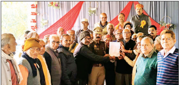
झापन सौंपते संगठन के पदाधिकारी।