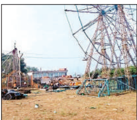
मेले में सज रही दुकानें व झूले।