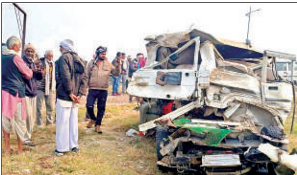
एक्सप्रेस-वे पर क्षतिग्रस्त वाहन।

एक ही परिवार के लोग महोबा से अस्थियां विसर्जन को बोलेरो से जा रहे थे प्रयागराज