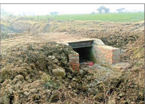
पुलिया निर्माण को डाले गए डोल।