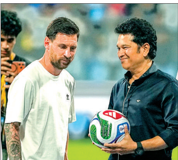
मुंबई के वानखेड़े स्टेडियम में पूर्व क्रिकेटर सचिन तेंदुलकर के साथ अर्जेंटीना के महान फुटबॉलर लियोनेल मेसी।

तेंदुलकर ने भारत की वनडे विश्व कप जीत का जिक्र करते हुए यह बात कही जिसमें उन्होंने बड़ी भूमिका अदा की थी। उन्होंने कहा मैंने यहां कुछ अविवशनीय पल बिताए हैं। जैसा कि हम कहते हैं, मुंबई सपनों का शहर है। और इस जगह पर कई सपने पूरे हुए हैं। और आपके समर्थन के बिना, हम 2011 में इस मैदान पर उन सुनहरे पलों को कभी नहीं देख पाते। उन्होंने कहा और आज, इन तीन महान हस्तियों का यहां होना वाकई मुंबई, मुंबईवासियों और भारत के लिए एक सुनहरा पल है। जिस तरह से आपने