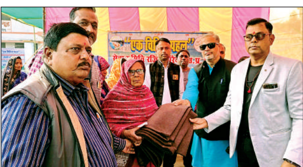
जरूरतमंदों के लिए खोला गया वस्त्र बैंक।

मामलों का भी निस्तारण किया गया। इस दौरान तहसील बिधूना के विभिन्न ग्रामों में वर्षों पुराने कुल 61 मामलों को मिशन समाधान के अन्तर्गत राजस्व व पुलिस की टीमों ने आवासीय पट्टों, चकमार्ग, चकरोड, बंजर भूमि , नाली/कूल, बंजर भूमि आदि के विभिन्न मामलों को पैमाइश कराते हुए कब्जा मुक्त कराने के साथ-साथ आपसी विवादित मामलों का भी निस्तारण किया गया। इस मौक पर कई लोग मौजूद रहे।