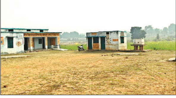
बिना बाउंड्री वॉल के संचालित हो रहा स्कूल।