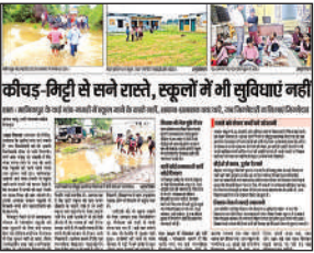
‘अमृत विचार’ में प्रकाशित समाचार।

■ स्कूल के कमरों में लगे पंखों में जंग लगने लगी है। बिजली के बोर्ड भी दम तोड़ते नजर आ रहे हैं। जिन रास्तों से बच्चे स्कूल आते जाते हैं, वह भी बदतर है। स्कूल बिना बाउंड्री का है। गौरतलब है कि बीते दिनों हुई एक महत्वपूर्ण बैठक में जिलाधिकारी पुलकित गर्ग ने बिजली विभाग के अधिकारियों को स्कूलों में जल्द से जल्द कनेक्शन देने के निर्देश दिए हैं। बैठक में बीएसए ने बताया था कि दो वर्ष पहले ही 79 विद्यालयों को कनेक्शन के लिए धनराशि विभाग को दी जा चुकी है। अब देखना यह होगा कि अब इन स्कूलों को बिजली मिल पाती है।