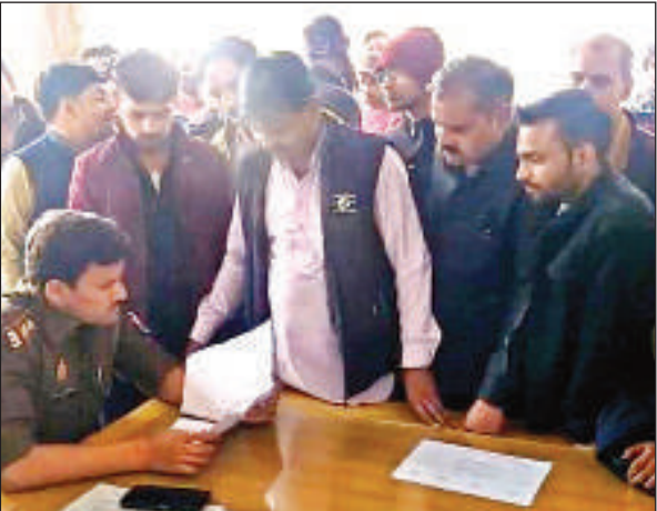
कोतवाली में शिकायत करने पहुंचे स्वर्णकार समाज के लोग।