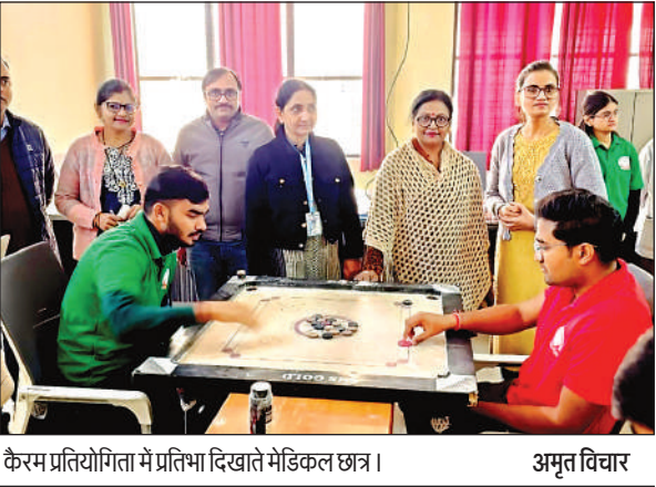
कैरम प्रतियोगिता में प्रतिभा दिखाते मेडिकल छात्र।