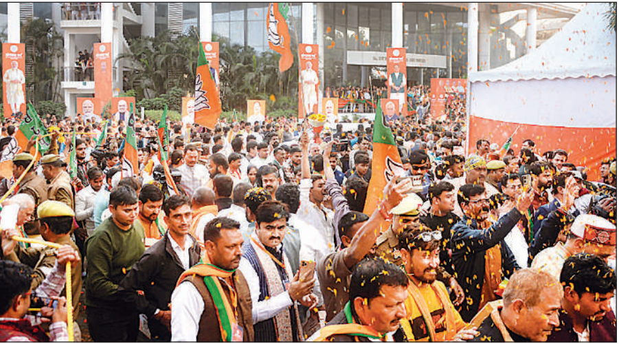
लखनऊ के डॉ. राम मनोहर लोहिया विधि विश्वविद्यालय परिसर में प्रदेशभर से पहुंचे भाजपा कार्यकर्ताओं की भीड़ । अमृत विचार

8 प्रदेश उपाध्यक्ष और 3 प्रदेश महामंत्री बनाए जा सकते हैं। ऐसे में नई टीम का ढांचा लगभग तय माना जा रहा है और अब सवाल सिर्फ नामों को लेकर है। संविधान के अनुसार श्रेणी-3 की कार्यकारिणी में कम से कम 35 महिलाएं और 9 अनुसूचित जाति/जनजाति वर्ग के सदस्य होना अनिवार्य है। यही कारण है कि नई टीम के चयन में केवल राजनीतिक अनुभव नहीं, बल्कि सामाजिक और क्षेत्रीय संतुलन को भी विशेष महत्व दिया जाएगा। पश्चिम यूपी, पूर्वांचल, बुंदेलखंड और अवध- चारों क्षेत्रों से प्रतिनिधित्व सुनिश्चित करने की