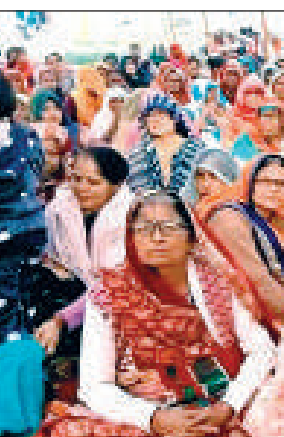
भागवत कथा का श्रवण करते श्रद्धालु।