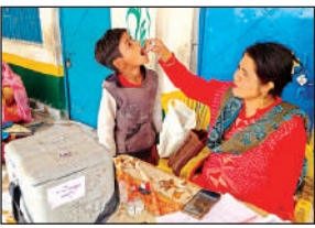
बच्चे को पोलियो ड्रॉप पिलाती एएनएम।