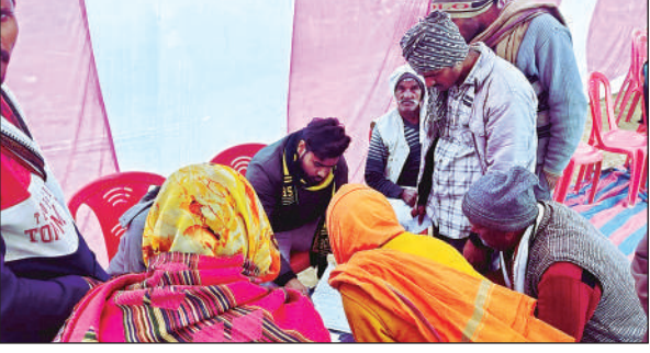
सगवारा में लगे नेत्र परीक्षण शिविर में जांच कराते ग्रामीण।