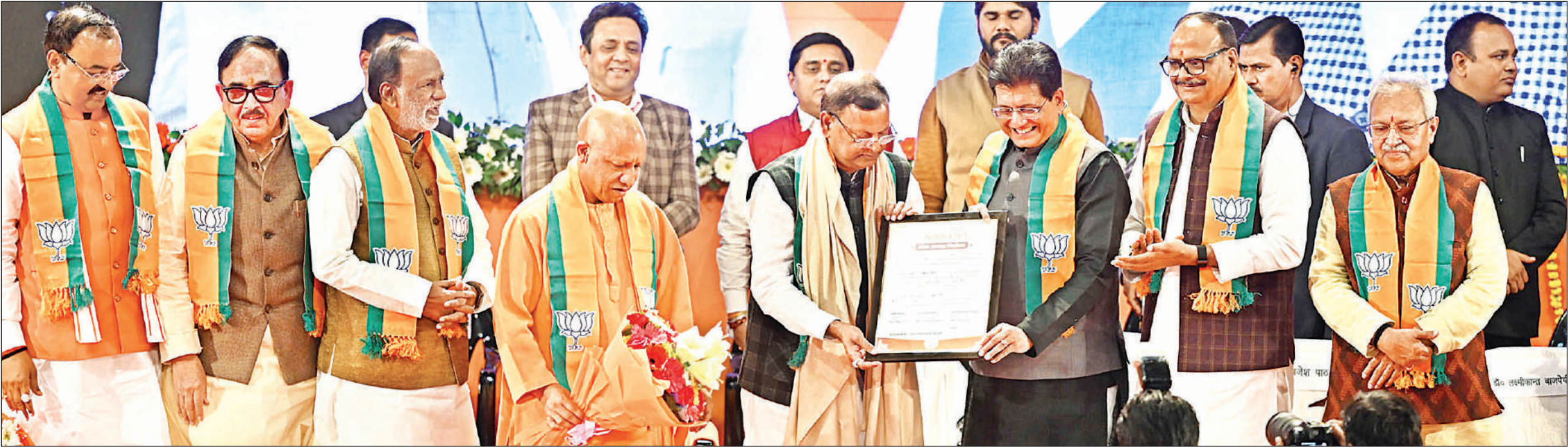
लखनऊ : राम मनोहर लोहिया विधि विश्वविद्यालय के सभागार में भाजपा के संगठन पर्व कार्यक्रम के दौरान पंकज चौधरी को यूपी के नए प्रदेश अध्यक्ष का प्रमाण पत्र देकर सम्मानित करते हैं केंद्रीय मंत्री पीयूष गोयल, साथ में मुख्यमंत्री योगी आदित्यनाथ व अन्य ।