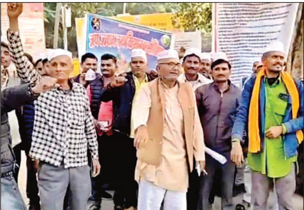
विरोध-प्रदर्शन करते किसान।

जय जवान, जय किसान संगठन के बैनर तले सदर तहसील में किसानों ने इफको टोकियो कंपनी के खिलाफ नारेबाजी कर विरोध