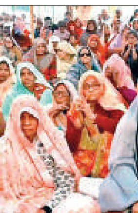
भागवत कथा का श्रवण करते श्रद्धालु।