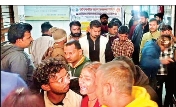
सीएचसी में रोते-बिलखते परिजन।

यहां डाक्टरों ने उसे मृत घोषित कर दिया। रविवार को अचानक थाना परिसर में हुए हादसे की खबर सुनते ही मृतक के परिजन मौके पर पहुंचे और रोने पीटने लगे। प्रभारी निरीक्षक व अन्य पुलिस कर्मियों ने परिजनों को ढांढस बंधाते हुए शव का पंचनामा भर पोस्टमार्टम के लिए भेजने की तैयारी की, लेकिन परिजनों ने मैकेनिक के पिता के बाहर से आने के बाद ही पोस्टमार्टम