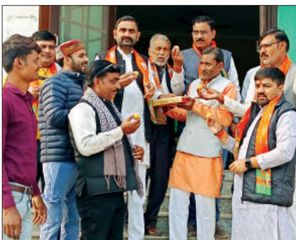
एक दूसरे को लहू खिलाते भाजपा कार्यकर्ता।