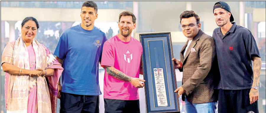
नई दिल्ली के अरुण जेटली स्टेडियम में दिल्ली की मुख्यमंत्री रेखा गुप्ता, उरुग्वे के फुटबॉलर लुइस सुआरेज, अर्जेंटीना के फुटबॉलर लियोनेल मेसी, आईसीसी चेयरमैन जय शाह और अर्जेंटीना के फुटबॉलर रॉड्रिगो डी पॉल।

अरुण जेटली क्रिकेट स्टेडियम इस दौरान फुटबॉल जगत के लिए मुख्य अकर्षण का केंद्र था। मेसी के दीवानों ने उस शख्स का दीदार किया जो मैदान पर अक्सर 'बेजोड़' प्रदर्शन करता है। मेसी ने जब माइक संभाला और दिल्ली की मुख्यमंत्री रेखा गुप्ता, आईसीसी अध्यक्ष जय शाह और पूर्व भारतीय फुटबॉल कप्तान बाइचुंग भूटिया समेत कई अन्य लोगों की मौजूदगी में प्रशंसकों को संबोधित किया उनके प्रति दीवानगी चरम पर