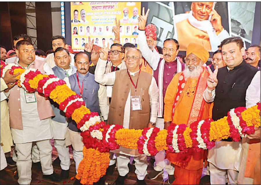
लखनऊ : अखिल भारतीय लोधी राजपूत कल्याण महासभा के प्रथम स्थापना दिवस कार्यक्रम में उपस्थित उप मुख्यमंत्री केशव प्रसाद मौर्या, पूर्व सांसद राजवीर सिंह राजू भैया, सांसद साक्षी महाराज, साथ में अन्य।

अमृत विचार, लखनऊ : पूर्व प्रधानमंत्री भारत रत्न अटल बिहारी वाजपेयी की जयंती श्रद्धाभाव से मनाई जाएगी। 24 दिसंबर को जयंती समारोह की पूर्व संध्या पर कवि डॉ. कुमार विश्वास द्वारा अटल का काव्य पाठक का आयोजन किया जाएगा। प्रदेश भर के गणमान्य व्यक्ति समारोह में जुटेंगे। पूर्व प्रधानमंत्री को श्रद्धासुमन अर्पित करेंगे। सोमवार को समारोह की तैयारियों को लेकर उप मुख्यमंत्री ब्रजेश पाठक के राजभवन कॉलोनी स्थित आवास में अटल बिहारी वाजपेयी मेमोरियल फाउंडेशन की बैठक हुई। ब्रजेश पाठक ने बताया कि केजीएमयू के अटल बिहारी वाजपेयी साइंटिफिक कन्वेंशन सेंटर में शाम पांच बजे आयोजन होगा। कार्यक्रम में मुख्य अतिथि रक्षामंत्री राजनगथ सिंह, मुख्यमंत्री योगी आदित्यनाथ होंगे।