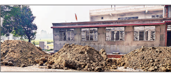
रोड किनारे डाली गई खनन की मिट्टी।

वापस मुड़वाना शुरू किया। इससे देखते ही देखते हरदोई पुल पर वाहनों की कतारें लग गईं। हरदोई पुल पर जाम लगने से कचहरी पुल