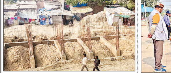
स्टेशन के पीछे निर्माणाधीन रिटेनिंग वॉल।

शुक्लामंज। अमृत स्टेशन योजना के अंतर्गत गंगाघाट रेलवे स्टेशन के कार्यालय का कार्य तेजी से चल रहा है। स्टेशन को आधुनिक सुविधाओं से लैस करने के उद्देश्य से हो रहे विकास कार्यों के तहत स्टेशन के पीछे राजीव नगर खती की ओर सुरक्षा दीवार व रिटेनिंग वॉल का निर्माण हो रहा है। अब तक करीब 50 प्रतिशत कार्य पूरा हो चुका है। बता दें कि गंगाघाट रेलवे स्टेशन को आधुनिक स्वरूप देने के लिए वर्ष-2023 में विकास कार्यों की शुरुआत हुई थी। योजना के तहत प्लेटफार्म का चौड़ीकरण, पार्किंग क्षेत्र का विस्तार, स्टेशन परिसर का सौंदर्यकरण, नया वेटिंग हॉल निर्माण व यात्री सुविधाओं में इजाफा करने से जुड़े कई कार्य प्रस्तावित हैं।