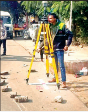
जरीब चौकी पर चिन्हित स्पांट पर मशीन से सर्वे करता कर्मी। गोलचौराहा के पास सर्वे के लिए मशीन को सेट करता कर्मी।

अमृत विचार। अनवरगंज से लेकर मंधना तक एलिवेटेड रेलवे ट्रैक निर्माण के संबंध में सोमवार को शासन से सर्वे टीम शहर पहुंची और जरीबचौकी से लेकर हर ढाई किलोमीटर पर स्पांट बनाए। मशीन लगाकर चिन्हित जगहों की स्थितियों को परखा और रेलवे ट्रैक का मानक, सुरक्षा की स्थिति व सड़क से दूरी आदि का अध्ययन किया। करीब एक सप्ताह में सर्वे टीम ड्रोन से एलिवेटेड रेलवे ट्रैक के लिए चिन्हित जगह का सर्वे करेगी और पूरी रिपोर्ट तैयार कर शासन को भेजेगी। अनवरगंज से मंधना तक करीब 17 किलोमीटर लंबा एलिवेटेड रेलवे ट्रैक का निर्माण 1115 करोड़ रुपये से होना है, जिसका निर्माण कार्य वर्ष