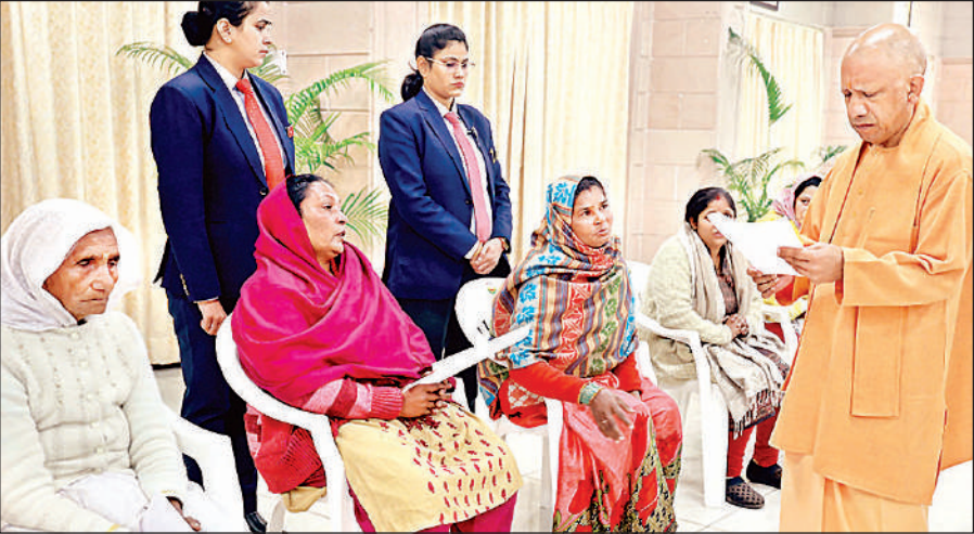
लखनऊ : कालिदास मार्ग स्थित अपने आवास पर जनता दर्शन कार्यक्रम में लोगों की समस्याएं सुनते मुख्यमंत्री योगी आदित्यनाथ।

को निर्देशित किया कि क्रय केंद्रों पर तौल, भुगतान और बैठने जैसी मूलभूत व्यवस्थाएं सुनिश्चित हों। किसानों को अनावश्यक चक्कर न लगाने पड़ें और भुगतान समय से किया जाए। किसी भी स्तर पर गड़बड़ी की शिकायत मिलने पर जिम्मेदार अधिकारियों के खिलाफ कार्रवाई तय होगी। मुख्यमंत्री योगी आदित्यनाथ ने जनता दर्शन के दौरान प्रदेश के विभिन्न जनपदों से आए फरियादियों से एक-एक कर मुलाकात की। सभी की समस्याएं सुनीं और उनके प्रार्थना पत्र संबंधित अधिकारियों को सौंपते हुए,