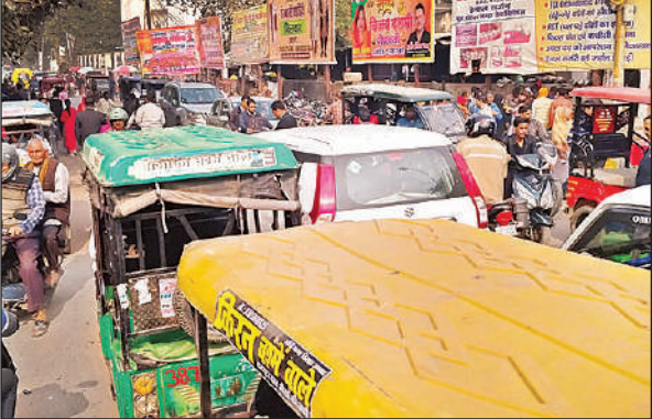
कचहरी जाने वाले मार्ग पर लगा जाम।

बता दें कि बीते रविवार कोतवाली क्षेत्र के मटरिया गांव के पास लखनऊ-आगरा एक्सप्रेस-वे की सर्विस लेन व ऊंचाद्वारा में दिनदहाड़े कई जगह डंपरों से मिट्टी का गिरान हो रहा था। जिसे देख ग्रामीणों ने एसडीएम हसनगंज को सूचना दी थी। एसडीएम ने क्षेत्रीय लेखपाल को भेजकर जांच की। कोतवाली प्रभारी निरीक्षक कहो थी। उधर, कस्बा मोहान में सई नदी पुल का निर्माण हो रहा है