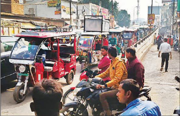
कचहरी पुल पर लगा जाम।

सीएमओ ऑफिस के बाहर सोमवार जिले की आशा व आशा संगिनियों ने अपनी लंबित मांगों को लेकर घेराव कर धरना देकर मांग की कि वर्षों से मानदेय, प्रोत्साहन राशि व विभिन्न अभियानों