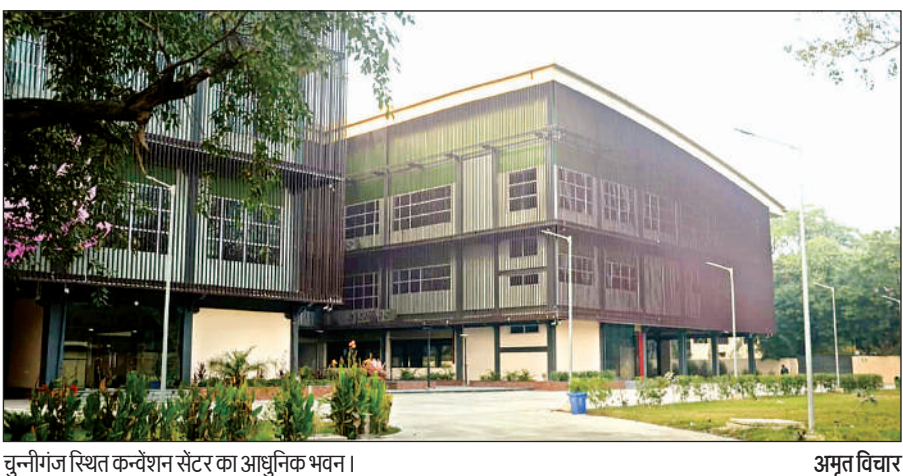
चुनीगंज स्थित कन्वेंशन सेंटर का आधुनिक भवन।