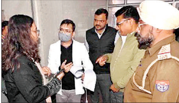
तबीयत के बारे में जानकारी लेते अधिकारी।