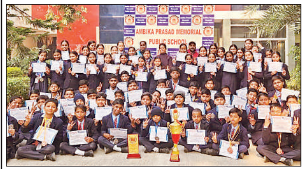
विजयी मुद्रा में बैठे अंबिका के छात्र।

शुक्लामंज। अमृत स्टेशन योजना के अंतर्गत गंगाघाट रेलवे स्टेशन के कार्यालय का कार्य तेजी से चल रहा है। स्टेशन को आधुनिक सुविधाओं से लैस करने के उद्देश्य से हो रहे विकास कार्यों के तहत स्टेशन के पीछे राजीव नगर खती की ओर सुरक्षा दीवार व रिटेनिंग वॉल का निर्माण हो रहा है। अब तक करीब 50 प्रतिशत कार्य पूरा हो चुका है। बता दें कि गंगाघाट रेलवे स्टेशन को आधुनिक स्वरूप देने के लिए वर्ष-2023 में विकास कार्यों की शुरुआत हुई थी। योजना के तहत प्लेटफार्म का चौड़ीकरण, पार्किंग क्षेत्र का विस्तार, स्टेशन परिसर का सौंदर्यकरण, नया वेटिंग हॉल निर्माण व यात्री सुविधाओं में इजाफा करने से जुड़े कई कार्य प्रस्तावित हैं।