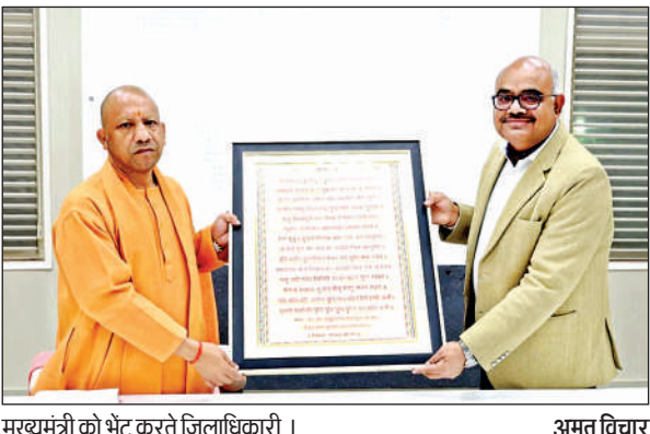
मुख्यमंत्री को भेंट करते जिलाधिकारी।