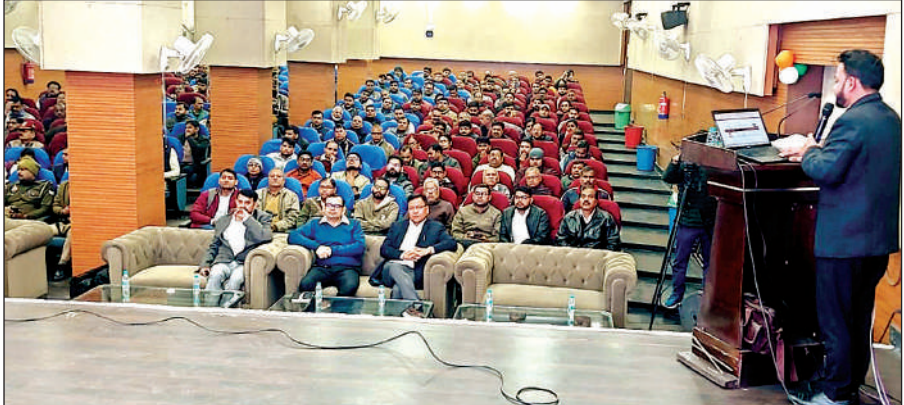
केडीए के प्रेक्षागार कक्ष में ई-लॉटरी में एकत्र अधिकारी व प्रतिभागी।