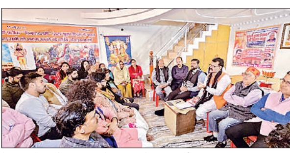
बैठक करते नर सेवा नारायण सेवा समिति के पदाधिकारी।