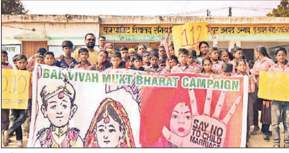
रैली के लिए प्रस्थान करते छात्र-छात्राएं व शिक्षक।