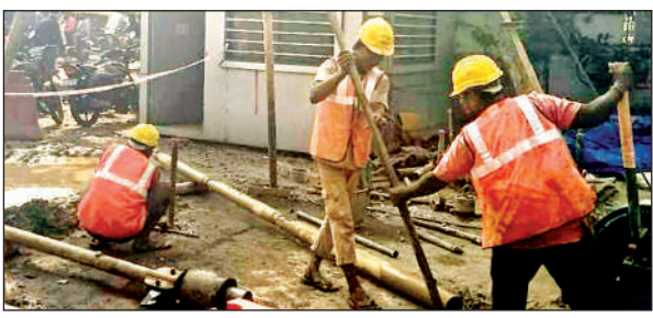
जरीबचौकी क्रासिंग पर मिट्टी परीक्षण के लिए बोरिंग करते जलकल विभाग के कर्मी।

अमृत विचार। जरीबचौकी क्रासिंग पर फ्लाईओवर के निर्माण के लिए संबंधित क्षेत्र की मिट्टी की स्थिति का आकलन करने के लिए सेतु निगम ने जलकल विभाग को बोरिंग करने के लिए पत्र लिखा और मिट्टी परीक्षण की मांग की थी। जिसकी शुरुआत सोमवार को हो गई है। जलकल विभाग को 18 जगहों पर 200 फीट बोरिंग करनी है। सोमवार को जलकल विभाग की टीम ने सेतु निगम की मांग पर जरीबचौकी क्रासिंग के पास मिट्टी परीक्षण के लिए बोरिंग करने का कार्य शुरू कर दिया गया है। सेतु निगम के एक अधिकारी के मुताबिक जरीबचौकी क्रासिंग से गुमटी की ओर 10 जगह और अफीमकोठी की ओर आठ जगहों पर बोरिंग कराई जानी है। बताया कि मिट्टी परीक्षण से नौव की मजबूती पता चलेगी और