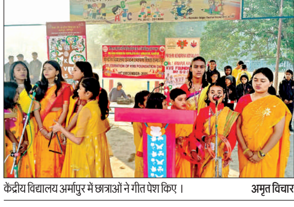
केंद्रीय विद्यालय अर्मापुर में छात्राओं ने गीत पेश किए ।