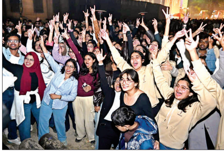
मेडिकल छात्र-छात्राओं ने जमकर मस्ती की ।