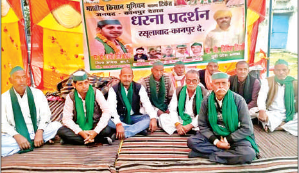
धरनेपर बैठे भाकियू महात्मा टिकैत गुट के पदाधिकारी व कार्यकर्ता।