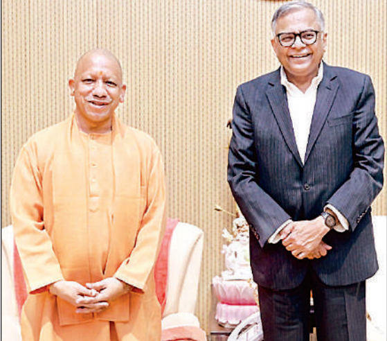
मुख्यमंत्री योगी आदित्यनाथ से मुलाकात करते टाटा ग्रुप के चेयरमैन एन. चंद्रशेखरन।

बैठक में टाटा समूह ने राजधानी लखनऊ में 'एआई सिटी' विकसित करने का प्रस्ताव रखा। यह एआई सिटी स्टार्टअप्स, रिसर्च, इनोवेशन और हाई-एंड टेक्नोलॉजी इकोसिस्टम का केंद्र बनेगी। इसके साथ ही गोरखपुर में सेंटर ऑफ़ एक्सिलेंस स्थापित करने का प्रस्ताव भी रखा गया, जिससे पूर्वांचल के युवाओं को अत्याधुनिक तकनीकों में प्रशिक्षण मिलेगा। टाटा समूह ने बताया कि आईआईटी कानपुर के साथ हुए एमओयू के तहत 48 करोड़ रुपये के निवेश से युवाओं को एआई, साइबर सिक्योरिटी, डेटा साइंस, ड्रोन, 3डी प्रिंटिंग और स्पेस टेक्नोलॉजी में