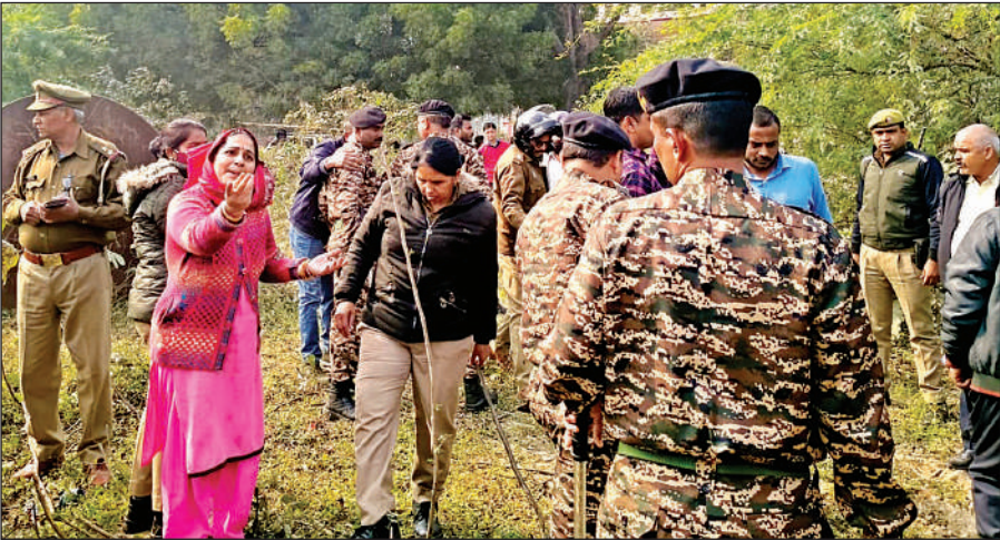
विरोध कर रही महिलाओं को रोकती पुलिस व आवास विकास का दस्ता।