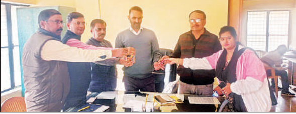
खंड विकास अधिकारी के पास डोंगल जमा करते सचिव।