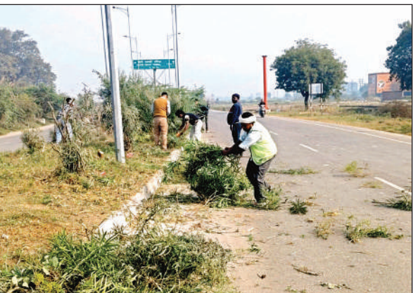
चकरी हाइवे पर डिवाइडर पर उगी घास और पौधों को हटाया गया। अमृत विचार