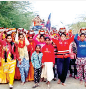
कलश को जल लेने जाती युवतियां।