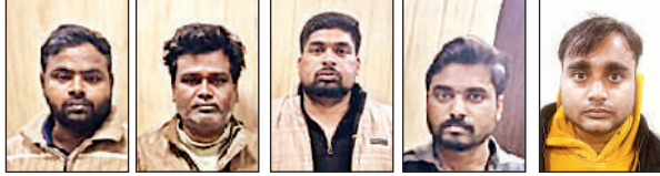
जीएसटी चोरी के आरोप में पकड़े गए अंतरराज्यीय गिरोह के सदस्य।