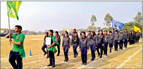
कार्यक्रम के दौरान मार्च पास्ट का प्रदर्शन करते बच्चे।

कार्यक्रम की शुरुआत में प्राचार्य ने केंद्रीय विद्यालय संगठन की 63 वर्षों की गौरवपूर्ण यात्रा, विद्यालय की उपलब्धियों, शैक्षिक गुणवत्ता तथा विद्यार्थियों के सर्वांगीण विकास में खेलों की महत्वपूर्ण भूमिका पर प्रकाश डाला। उन्होंने कहा कि केन्द्रीय विद्यालय संगठन शिक्षा की सुरक्षित और समृद्ध धारा