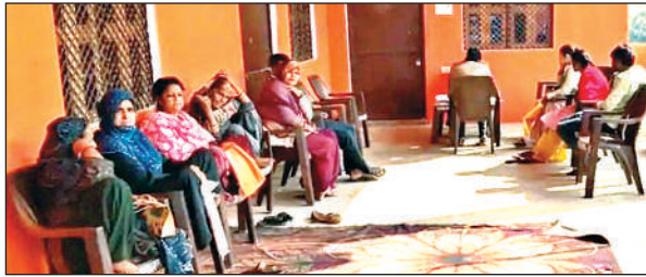
धर्मगढ़ बाबा मंदिर परिसर में शिविर में पहुंचे लोग।

अमृत विचार: कस्बा स्थित धर्मगढ़ बाबा मंदिर परिसर में प्रावी ग्लोबल आईवीएफ कानपुर द्वारा एक नि:शुल्क बांझपन ( इन्फर्टिलिटी ) जागरूकता शिविर का आयोजन किया गया। इस शिविर में प्रावी ग्लोबल आईवीएफ के अनुभवी एवं विशेषज्ञ चिकित्सकों ने दंपतियों को बांझपन से जुड़ी भांतियों, कारणों और आधुनिक उपचार विकल्पों की विस्तृत जानकारी प्रदान की। शिविर के दौरान डॉक्टरों ने बताया कि वर्तमान समय में बदलती जीवनशैली, तनाव, अनियमित खानपान, देर से विवाह, हार्मोनल असंतुलन और कुछ चिकित्सकीय कारणों से बांझपन की समस्या बढ़ रही है। उन्होंने जोर दिया कि समय पर जांच और सही परामर्श से इस समस्या का प्रभावी उपचार संभव है। चिकित्सकों ने आईयूआई और आईवीएफ जैसी आधुनिक