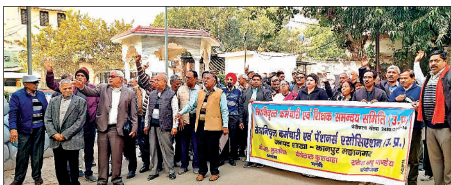
जिलाधिकारी कार्यालय के बाहर प्रदर्शन करते पेंशनधारी