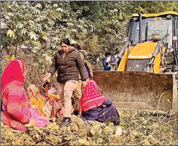
बुलडोजर के सामने बैठी महिलाएं।

अमृत विचार। आवास विकास परिषद ने सोमवार को हिंदुस्तान पेट्रोलियम कारपोरेशन को आवंटित की गई 7597 वर्गमीटर जमीन विरोध के बीच खाली करा दी। अवैध कब्जेदार काफी समय से यहां बसे थे, जिससे आवास विकास मूल आवंटों को कब्जा नहीं दे पा रहा था। सोमवार को जैसे ही आवास विकास का बुलडोजर पहुंचा अनाधिकृत रूप से रह रहे लोगों ने विरोध शुरू कर दिया, कुछ महिलाएं दस्ते से भिड़ गई, और बुलडोजर के सामने बैठ गई। इस दौरान दस्ते के साथ पुलिस ने मोर्चा संभाला और विरोध करने वालों को खदेड़ दिया। आवास विकास परिषद कानपुर की अम्बेडकरपुरम योजना संख्या 3 में संस्थागत भूखण्ड संख्या 2/आईएनएस-1 हिंदुस्तान पेट्रोलियम कारपोरेशन को आवंटित की गई थी। 7597 वर्गमीटर जमीन पर अनाधिकृत रूप से कब्जेदार रह रहे थे। जिससे परिषद आवंटों को जमीन का कब्जा नहीं दे पा रहा था।