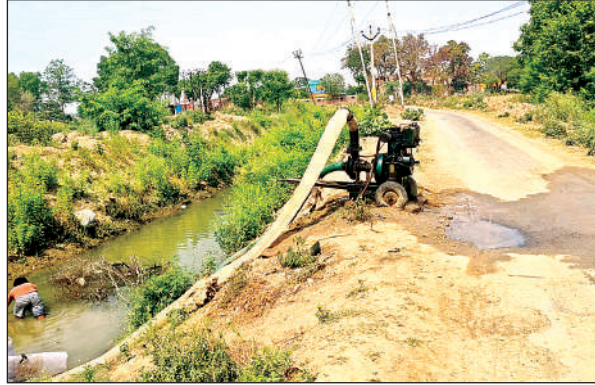
बुधौली माइनर में पंपिंग सेट से फसल की सिंचाई करता किसान।

अमृत विचार: माइनरों में पानी न आने से फसलों की सिंचाई प्रभावित हो रही है। वर्तमान में किसानों को गेहूं, जौ, सरसों व आलू आदि फसलों को सिंचाई की जरूरत है, लेकिन सिकन्दरा क्षेत्र में रजबहे, माइनरें सूखी होने के कारण किसान सिंचाई नहीं कर पा रहे हैं। कुछ किसान पंपिंग सेट से फसलों की सिंचाई कर रहे हैं। इससे खेती की लागत बढ़ रही है। ऐसे में किसान फसलों की सिंचाई को लेकर चिंतित है। क्षेत्रीय किसानों का कहना है कि माइनरों रजबहों में पिछले दो माह से पानी न आने से किसान परेशानी भुगत रहे हैं। फसल सींचने को पानी