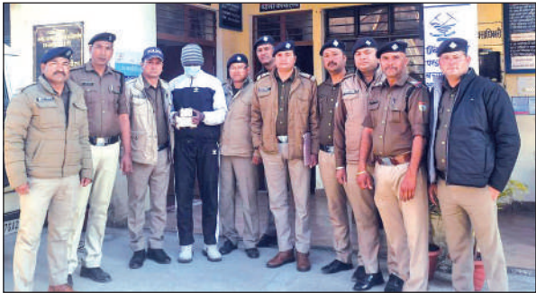
पुलिस की गिरफ्त में हत्यारोपी पीआरडी जवान।