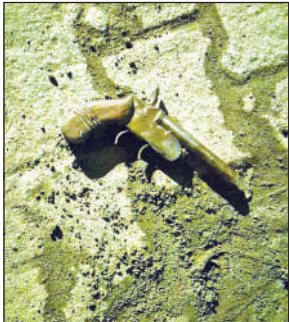
घटनास्थल पर पड़ा तमंचा।