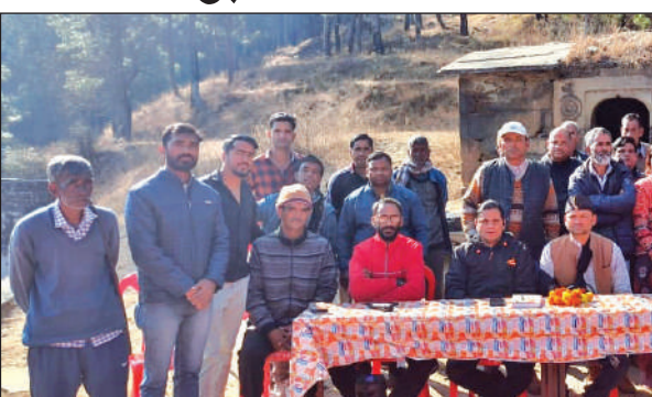
भैंसियाछाना के पेटशाल में विभिन्न ग्राम पंचायतों की बैठक हुई। ● अमृत विचार

दिलाने आदि की मांग उठाई गई। पेटशाल में आयोजित बैठक में बचाओ- उत्तराखंड जन चेतना मंच का गठन किया गया। वहीं, बैठक में नैणी, बंजेली, देवड़ा, पूनाकोट, दूगड़ी, चितई, सिराड़, पेटसाल आदि गांवों के लोग शामिल हुए।