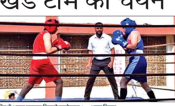
रिंग में अपना दमखम दिखाते मुक़ेबज।