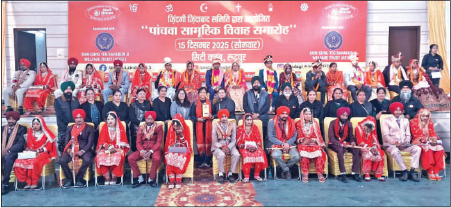
सामूहिक विवाह समारोह में वर-वधु के साथ जिंदगी जिंदाबाद की टीम। ● अमृत विचार

के सिटी क्लब में सामूहिक विवाह को लेकर जिंदगी जिंदाबाद की टीम मुस्तैद थी और 18 निर्धन कन्याओं के विवाह की तैयारी पूर्ण कर चुके