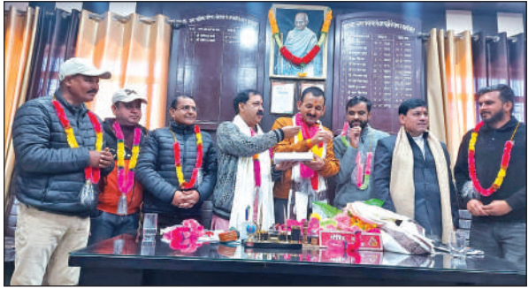
चम्पावत में मिठाई खिलाते भाजपा कार्यकर्ता।