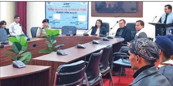
रानीखेत महाविद्यालय में विधिक जागरूकता कार्यक्रम में मौजूद लोग।