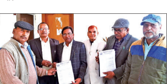
राज्यपाल को ज्ञापन भेजते मूल निवासी संघ के पदाधिकारी।