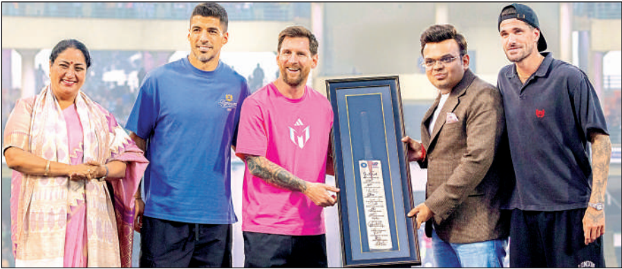
नई दिल्ली के अरुण जेटली स्टेडियम में दिल्ली की मुख्यमंत्री रेखा गुप्ता, उरुग्वे के फुटबॉलर लुइस सुआरेज, अर्जेंटीना के फुटबॉलर लियोनेल मेसी, आईसीसी चेयरमैन जय शाह और अर्जेंटीना के फुटबॉलर रॉड्रिगो डी पॉल।

अरुण जेटली क्रिकेट स्टेडियम इस दौरान फुटबॉल जगत के लिए मुख्य आकर्षण के केंद्र था। मेसी के दीवानों ने उस शख्स का दीदार किया जो मैदान पर अक्सर 'बेजोड़' प्रदर्शन करता है। मेसी ने जब माइक संभाला और दिल्ली की मुख्यमंत्री रेखा गुप्ता, आईसीसी अध्यक्ष जय शाह और पूर्व भारतीय फुटबॉल कप्तान बाइचुंग भूटिया समेत कई अन्य लोगों की मौजूदगी में प्रशंसकों को संबोधित किया उनके प्रति दीवानगी चरम पर