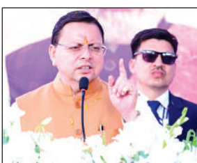
मुख्यमंत्री पुष्कर सिंह धामी।

उत्तराखण्ड पर्यटन निदेशालय के माध्यम से कुमाऊं मण्डल विकास निगम द्वारा तैयार आगणन को जिला स्तरीय तकनीकी समिति से संस्तुति प्राप्त होने के उपरान्त