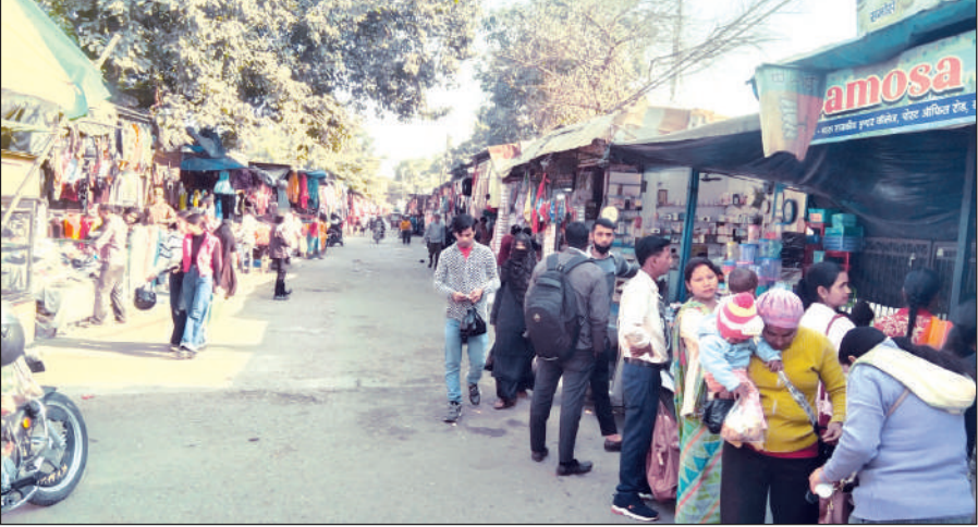
खटीमा के आजाद मार्केट की दुकानें दो दिन बाद खुलने के बाद हुई चहल-पहल। ● अमृत विचार

विधायक बेहड़ ने कहा कि 10 चार पहिया वाहनों के साथ बड़ी संख्या में कांग्रेसियों की सहभागिता से यह रैली ऐतिहासिक रही। उन्होंने दावा किया कि इस विशाल जनसमर्थन से कार्यकर्ताओं में नई ऊर्जा आई है और लोकतंत्र की रक्षा के लिए चेतना जागृत हुई है। उन्होंने विश्वास जताया कि इस सफल आयोजन का प्रभाव आने वाले चुनावों पर पड़ेगा।