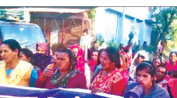
रामनगर में जनसंपर्क करते संघर्ष समिति के लोग।