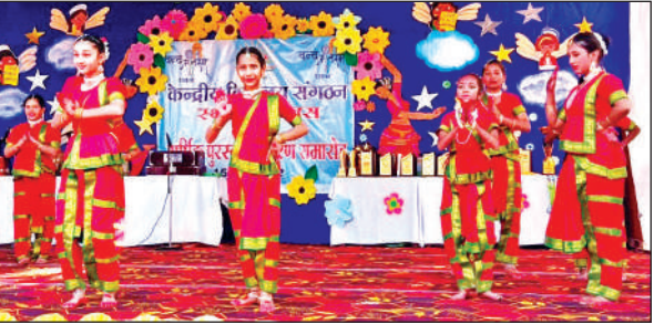
आर्मी कैंट स्थित केंद्रीय विद्यालय में सांस्कृतिक कार्यक्रम प्रस्तुत करती छात्राएं।