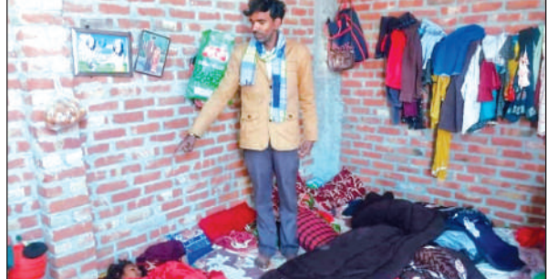
चोरी के बाद बिखरा सामान दिखाता मकान स्वामी।

की भांति वह खाना खाकर परिवार के साथ दो मंजिला टिनशेड में सोने चला गया। जिसका फायदा उठा कर चोरों ने मुख्य गेट का ताल तोड़कर अंदर प्रवेश किया और अलमारी में रखी 20 हजार की नगदी,मोबाइल और बाइक संख्या यूके06 एएस 5333 को चोरी कर लिया। सुबह चार बजे जब मकान