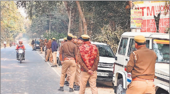
मैगलगंज मार्ग पर घटना स्थल के पास मौजूद पुलिस।

पंचायत सचिव और ग्राम विकास अधिकारियों का कहना है कि ऑनलाइन हाजिरी प्रणाली लागू होने के साथ सरकार कर्मचारियों ने गैर विभागीय कार्य कराती है। इससे काफी दिक्कतों का सामना करना पड़ता है। समस्याभाव के कारण उनके सरकारी काम भी छूट जाते हैं और समय से नहीं हो पाते। इसका खामियाजा भी उन्हें भुगतना पड़ता है। नेटवर्क आदि की समस्या के कारण ऑनलाइन अटेंडेंस भी काफी सिरदर्द बनी हुई है। इसका सभी कर्मचारियों पिछले काफी समय से