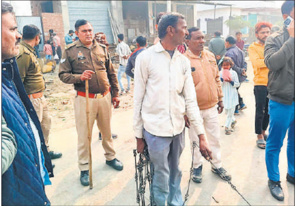
कुकरा में अवैध अतिक्रमण कर सीमांकन करते कर्मचारी।