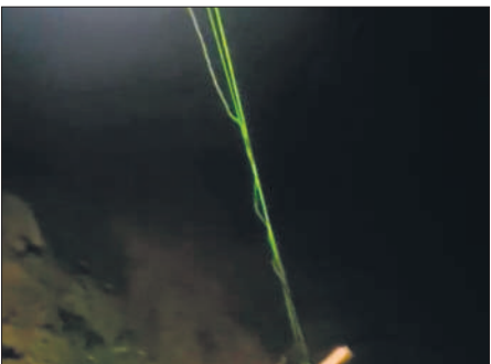
खेत में गड़े गन्ने से बंधी हाईटेशन लाइन पर डाली गई रेशम की रस्सी।

से शिकार किया जाता था, वहीं अब हाईटेशन लाइन से करंट उतारकर बेहद खतरनाक तरीका अपनाया जा रहा है।