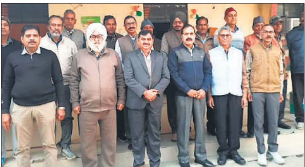
गोला की बैठक में मौजूद पूर्व सैनिक।