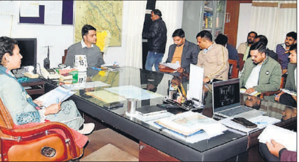
समीक्षा बैठक करतीं डीएम दुर्गा शक्ति नागपाल।

डीएम ने निर्देश दिए कि जिन योजनाओं में वितरण प्रणाली का कार्य पूरा हो चुका है, उनकी ज्वाइंटिंग टर्मिंंग कर 22 दिसंबर तक जलापूर्ति सुनिश्चित की जाए। संचालन से जुड़ी शिकायतों को टॉप प्रायोरिटी पर लेते हुए समयबद्ध और गुणवत्तापूर्ण निस्तारण के आदेश दिए गए। डीएम ने दो टूक कहा कि जल जीवन मिशन सरकार की फ्लैगशिप योजना है, इसमें हिलाई, लापरवाही और बहानेबाजी कतई बर्दाश्त नहीं होगी। फील्ड स्तर पर नियमित निरीक्षण, योजनाओं की वास्तविक