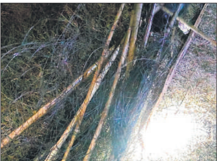
गांव महाराजनगर के पास खेत में शिकार के लिए लगाया गया जाल।