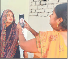
लाभार्थी का चेहरा प्रमाणीकरण करती आंगनबाड़ी कार्यकर्ता।

लाभार्थियों के चेहरा प्रमाणीकरण एवं ई-केवाईसी कार्य में प्रदेश स्तर पर जिला प्रथम स्थान पर है। नवंबर माह में यह कार्य 85 फीसदी के आसपास था। इस कार्य की लगातार समीक्षा की जा रहा है। शेष बचे लाभार्थियों का भी फेस ऑथेंटिकेशन और ई-केवाईसी का कार्य पूरा करने को निर्देशित किया गया है।