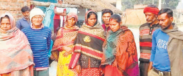
कोरियानी में मजदूरों के गमजदा परिजन।