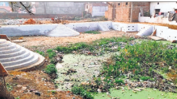
मैलानी में मारवाड़ी कॉलोनी में बन रहा तालाब।