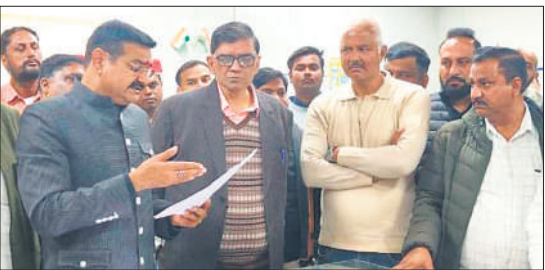
निर्माण कार्यों के संबंध में जानकारी लेते राज्यमंत्री संजय सिंह गंगवार।