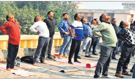
सीएमओ कार्यालय में योग करते कर्मचारी।