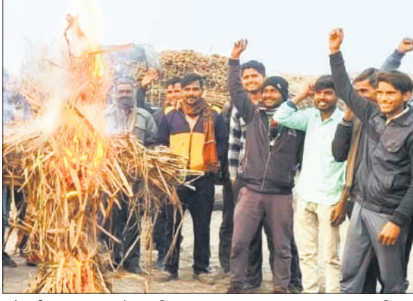
नारेबाजी कर पुतला फूंकते गन्ना किसान।

अमृत विचार: बैगास खत्म होने से चीनी मिल की पेराई रविवार रात आठ बजे से बंद हो गई। गन्ने की तौल ना होने पर गुस्साए ग्रामीणों ने नारेबाजी कर प्रधान प्रबंधक का पुतला फूंका। किसान भवन में पहुंचकर हंगामा किया। किसानों ने उग्र आंदोलन की चेतावनी दी है। किसान सहकारी चीनी मिल में रविवार रात करीब आठ बजे से गन्ने की पेराई बंद हो गई। इसके बाद गन्ने की ताल भी बंद कर दी गई। ग्रामीणों ने जब हंगामा किया तो मिल अधिकारियों द्वारा उन्हें बताया गया कि बैगास खत्म हो गई है इसीलिए चीनी मिल नहीं चल पा रही है। बैगास आने का ग्रामीण सोमवार शाम पांच बजे तक इंतजार करते रहे। किसानों को टोकन भी जारी नहीं हुए। उनकी पत्नियां जमा कराई गई। परेशान ग्रामीणों ने याद