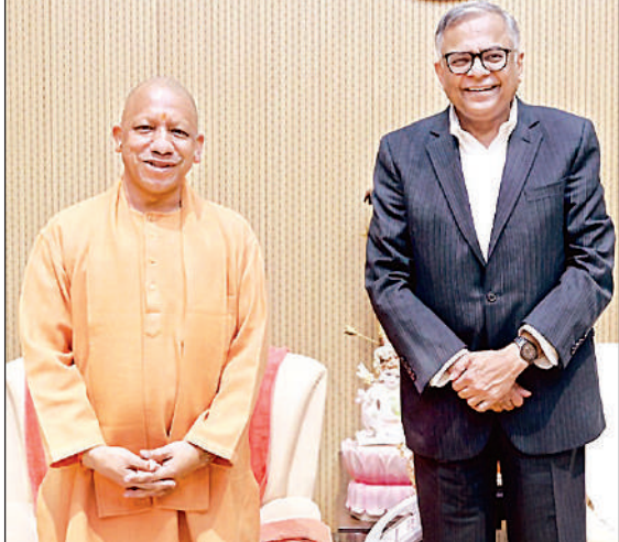
मुख्यमंत्री योगी आदित्यनाथ से मुलाकात करते टाटा ग्रुप के चेयरमैन एन. चंद्रशेखरन।

अमृत विचार: प्रदेश को तकनीक, औद्योगिक विकास और वैश्विक निवेश का हब बनाने की दिशा में सरकार ने एक और बड़ा कदम बढ़ाया है। मुख्यमंत्री योगी आदित्यनाथ और टाटा समूह के चेयरमैन एन. चंद्रशेखरन के बीच सोमवार को हुई उच्चस्तरीय बैठक में राज्य में एआई सिटी, सेंटर ऑफ़ एक्ससीलेस, डिफेंस कॉरिडोर, इलेक्ट्रॉनिक्स मैनुफैक्चरिंग, ऊर्जा, ईवी और हॉस्पिटैलिटी क्षेत्र में बड़े निवेश प्रस्तावों पर सहमति बनी। यह बैठक उत्तर प्रदेश की डिजिटल अर्थव्यवस्था, रोजगार सृजन और 5 ट्रिलियन डॉलर इकोनॉमी के लक्ष्य को गति देने वाली मानी जा रही है।