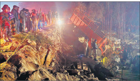
माधोटांडा रोड पर निर्माणाधीन पुलिया के गड्ढे में गिरी डीसीएम।

बता दें कि पीलीभीत से करखा माधोटांडा की दूरी करीब 28-30 किमी है। इस मार्ग पर 20 हजार के आसपास राहगीर प्रतिदिन