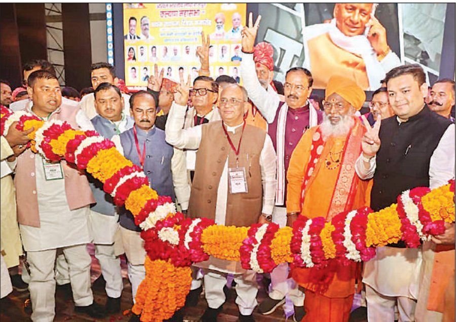
लखनऊ : अखिल भारतीय लोधी राजपूत कल्याण महासभा के प्रथम स्थापना दिवस कार्यक्रम में उपस्थित उप मुख्यमंत्री केशव प्रसाद मौर्या, पूर्व सांसद राजवीर सिंह राजू भैया, सांसद साक्षी महाराज, साथ में अन्य।

अमृत विचार, लखनऊ : पूर्व प्रधानमंत्री भारत रत्न अटल बिहारी वाजपेयी की जयंती श्रद्धाभाव से मनाई जाएगी। 24 दिसंबर को जयंती समारोह की पूर्व संध्या पर कवि डॉ. कुमार विश्वास द्वारा समारोह की तैयारियों को लेकर उप मुख्यमंत्री ब्रजेश पाठक के राजभवन कोलौनी स्थित आवास में अटल बिहारी वाजपेयी मेमोरियल फाउंडेशन की बैठक हुई। ब्रजेश पाठक ने बताया कि केजीएमयू के अटल बिहारी वाजपेयी साइंटिफिक कन्वेंशन सेंटर में शाम पांच बजे आयोजन होगा। कार्यक्रम में मुख्य अतिथि रक्षामंत्री राजनगथ सिंह, मुख्यमंत्री योगी आदित्यनाथ होंगे।