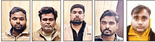
जीएसटी चोरी के आरोप में पकड़े गए अंतरराज्यीय गिरोह के सदस्य।