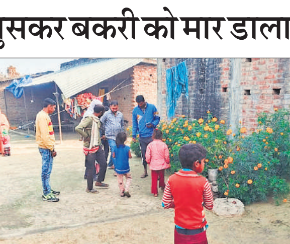
घर के बाहर बने तेंदुए के पगचिह्न देखते ग्रामीण।