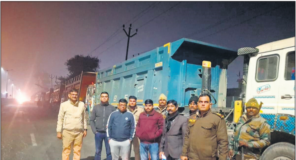
पकड़े ट्रकों के साथ प्रशासन, परिवहन व खान विभाग के अधिकारी।