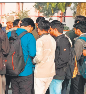
इसी खाने में निकला तार।