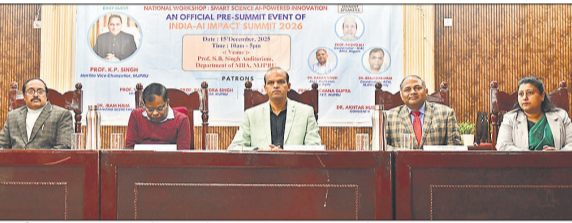
राष्ट्रीय कार्यशाला में मौजूद रुहेलखंड विश्वविद्यालय के शिक्षक व अतिथि।