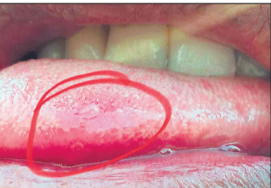
छात्र के जीभ में लगा तार।