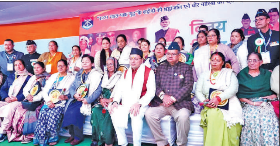
राजधानी के गांधी पार्क में आयोजित श्रद्धांजलि व सम्मान समारोह में वीर नारियों के साथ मुख्यमंत्री पुष्कर सिंह धामी।