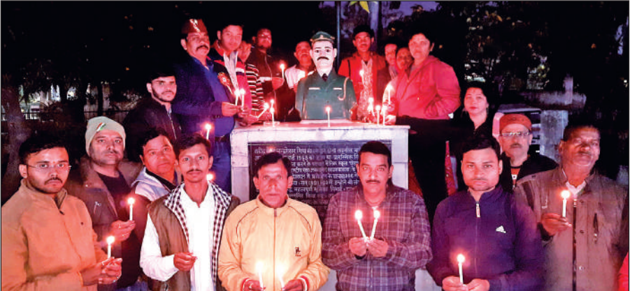
विजय दिवस पर शहीद चंद्रशेखर मिश्रा पार्क में कैडल जलाकर श्रद्धांजलि देते एक समाज श्रेष्ठ समाज के सदस्य।