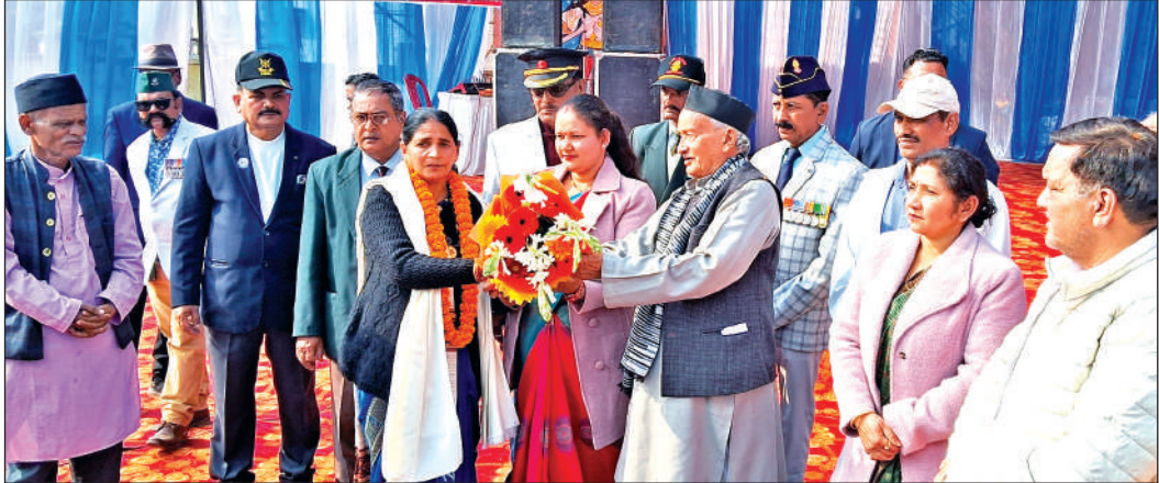
शहीदों के परिजनों को सम्मानित करते पूर्व मुख्यमंत्री व राज्यपाल भगत सिंह कोश्यारी