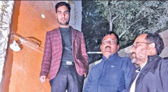
कृष्णा स्टोन क्रशर को सील करते अधिकारी। ● अमृत विचार

अमृत विचार: ग्रामीणों की शिकायत के बाद मौके पर पहुंची जिला प्रशासन की टीम ने अवैध खनन एवं मानकों की अनदेखी कर ध्वनि प्रदूषण फैलाने के मामले में हल्द्वचौड़ के नारायणपुरम स्थित कृष्णा स्टोन क्रशर को सील कर दिया जिला प्रशासन को लंबे समय से स्टोन क्रशर परिसर में अवैध खनन एवं मानकों की अनदेखी की शिकायतें मिल रही थीं। जिस पर राजस्व विभाग एवं खनन विभाग की संयुक्त टीम ने औचक निरीक्षण करते हुए क्रशर परिसर में छापेमारी की। टीम ने परिसर में खोदे गए गड्ढे की पैमाइश की तथा गड्ढा खोदने से संरक्षण अनुमति एवं अभिलेख मांगें। क्रशर संचालक आवश्यक दस्तावेज प्रस्तुत करने में असमर्थ