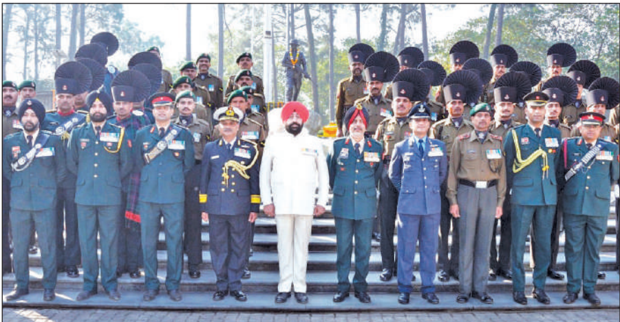
विजय दिवस के अवसर पर राजधानी देहरादून में शौर्य स्थल पर सैन्य अधिकारियों व सैनिकों के साथ राज्यपाल गुरमीत सिंह।