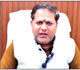
पत्रकारों को जानकारी देते महापौर।