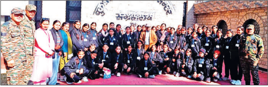
कुमाऊं रेजिमेंटल सेंटर संग्रहालय रानीखेत में अतिथियों व वार्डन के साथ छात्राएं ।