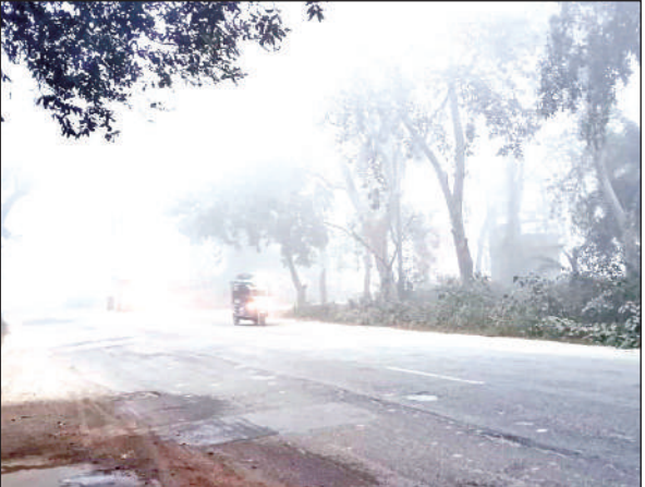
काशीपुर में घने कोहरे के बीच से होकर लाइट जलाकर गुजरते वाहन।

जलाकर चलते नजर आए। कुछ स्थानों पर दृश्यता इतनी कम थी कि वाहन चालकों को धीमी गति से वाहन चलाने पड़े। कोहरे के चलते खासतौर पर नेशनल हाईवे 309 और मुख्य सड़कों पर परेशानी अधिक देखी गई। सुबह स्कूल जाने वाले बच्चों, कार्यालय जाने वाले कर्मचारियों और जरूरी काम से निकलने वाले लोगों को भी परेशानी हुई। सुबह अधिकतम तापमान 13 डिग्री