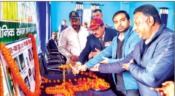
खटीमा में आयोजित कार्यक्रम का शुभारंभ करते एसडीएम सैनी व पूर्व सैनिक।

रक्षा कर रहे हैं। उन्होंने कहा कि 1971 में जो युद्ध हुआ था उस युद्ध में हिन्दुस्तान की विजय हुई थी, लेकिन उसमें हमारे अनेक सैनिक