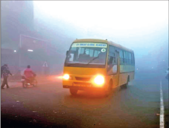
बाजपुर में कोहरे की वजह से दिन में भी लाइट जलाकर जाती स्कूली बसें।

घने कोहरे के चलते मुख्य सड़कों, ग्रामीण संपर्क मार्गों और हाईवे पर वाहनों की रफ्तार काफी धीमी रही। वाहन चालक बेहद सतर्क होकर वाहन चलाते नजर आए। कई स्थानों पर वाहन रंगते हुए चलते दिखाई दिए। कोहरे की वजह से आगे का रास्ता साफ नजर न आने से दुर्घटना की आशंका बनी रही, हालांकि समाचार लिखे जाने तक किसी बड़े हादसे की सूचना नहीं मिली। कोहरे के साथ ठंड का प्रकोप भी बढ़ गया है। तापमान में गिरावट आने से सुबह और शाम के समय ठिठुरन बढ़ गई। लोग ठंड से बचने के लिए गर्म कपड़ों, स्वेटर, जैकेट, मफलर और शाल