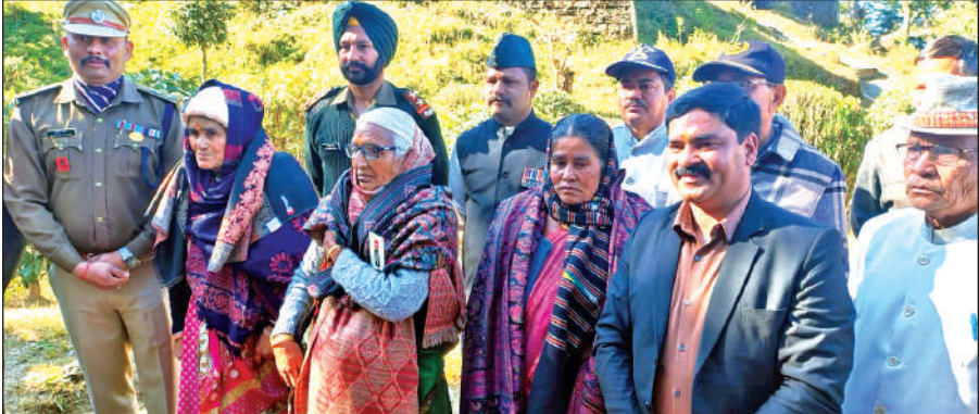
अल्मोड़ा में विजय दिवस पर वीरंगनाओं को किया सम्मानित । ● अमृत विचार

साहस एवं बलिदान से पाकिस्तानी फौज को पराजित किया था । इस युद्ध में अल्मोड़ा के 25 जवानों ने