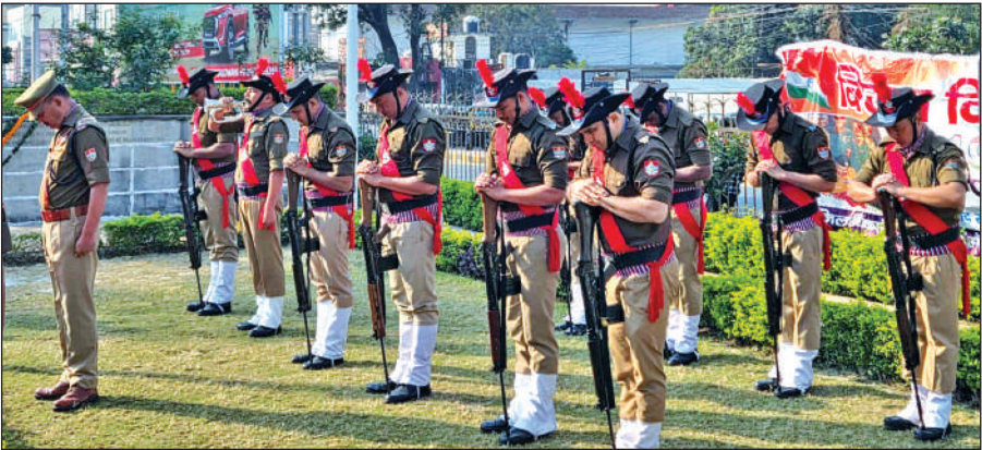
शहीद पार्क में संगीनें झुकाकर अमर शहीदों को श्रद्धांजलि अर्पित करते पुलिस जवान।

16 दिसंबर 1971 को देश सेवा के लिए वीर जवानों ने अपने प्राण न्योछावर करते हुए न केवल दुश्मनों के इरादों को पस्त कर तिरंगे को शान से लहराया, बल्कि युद्ध में भारत की जीत के साथ पूर्वी पाकिस्तान आजाद होकर बांग्लादेश बना। वक्ताओं ने कहा, वीर शहीदों के त्याग और बलिदान से प्रेरित होकर हमें देश के लिए जीना चाहिए। हर नागरिक को नियमों का पालन करते हुए देश की प्रगति और उन्नति सहयोग देना चाहिए। इस दौरान युद्ध में शहीद सैनिकों को पुष्पचक्र अर्पित कर श्रद्धांजलि दी गई। पुलिस सम्मान गार्ड ने शोक सलामी दी। शहीदों की स्मृति में दो मिनट का मौन रखा गया और वीरंगनाओं व शहीद सैनिक आश्रितों को शॉल व प्रतीक चिन्ह भेंटकर सम्मानित किया गया।