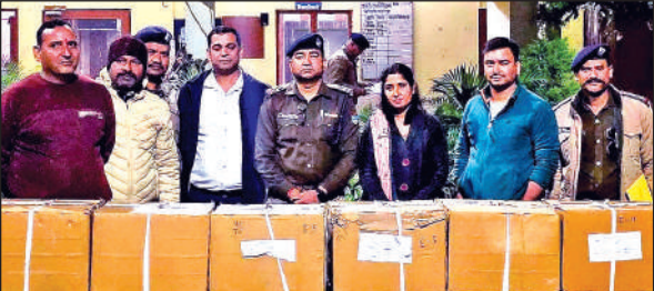
काशीपुर में बरामद माल के साथ पुलिस टीम ।