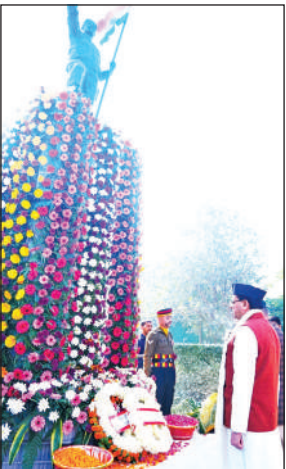
शहीद स्मारक पर श्रद्धांजलि देते सीएम।