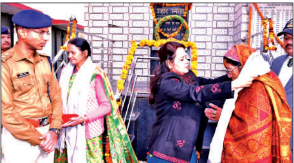
बागेश्वर में शहीदों के परिजनों को सम्मानित करतीं जिलाधिकारी ।