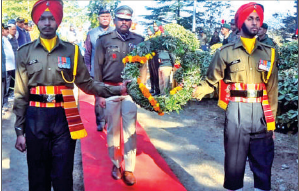
अल्मोड़ा में विजय दिवस पर शहीद स्मारक पर पुष्प चक्र अर्पित करते एसएसपी ।

अमृत विचार : मेडिकल कॉलेज अल्मोड़ा के अधीन बेस अस्पताल में लचर स्वास्थ्य व्यवस्था को लेकर लोगों ने मोर्चा खोल दिया है । मंगलवार को लोगों ने अस्पताल परिसर में धरना दिया । अस्पताल के जन औषधी केंद्र में मिल रही दवाओं और डॉक्टरों की कार्यप्रणाली पर सवाल उठाए । मंगलवार को बड़ी संख्या में स्थानीय लोग बेस अस्पताल परिसर पहुंचे । यहां उन्होंने बदहाल स्वास्थ्य व्यवस्थाओं को नाराजगी जताते हुए कॉलेज प्रशासन के खिलाफ प्रदर्शन किया । कहा कि बेस अस्पताल में लोगों को सुविधा मिले इसके लिए जन औषधि केंद्र की स्थापना की गई है, लेकिन लोगों का इसका