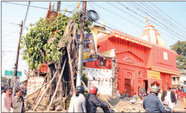
कालू सिद्ध मंदिर स्थित पुराना पीपल का वृक्ष। ● अमृत विचार

जिला प्रशासन, लोनिवि ने मंगल पड़ाव से रोडवेज स्टेशन तक सड़क चौड़ीकरण किया था। इसमें सड़क के दोनों तरफ 12-12 मीटर