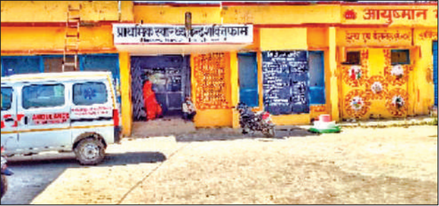
प्राथमिक स्वास्थ्य केंद्र शक्तिफार्म।