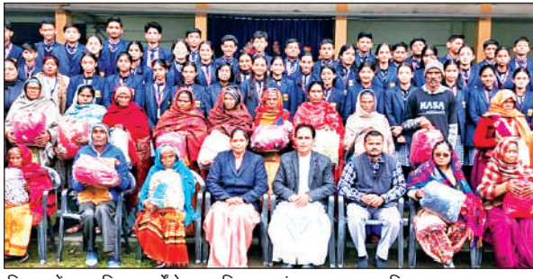
किच्छा में सम्मानित बुजुर्गों के साथ शिक्षक एवं छात्र ।● अमृत विचार

लाई जाएगी। नियम तोड़ने वालों पर जुर्माना और कानूनी कार्रवाई सुनिश्चित की जाएगी। महापौर ने नागरिकों से अपील की कि घरों और व्यावसायिक प्रतिष्ठानों के कूड़ा नगर निगम की कूड़ा गाड़ी में ही डालें। सड़कों, नालियों और सार्वजनिक स्थानों पर कूड़ा फेंकना पूरी तरह प्रतिबंधित है।