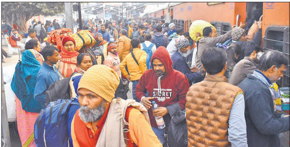
बरेली जंक्शन पर ट्रेन में चढ़ने के लिए मारामारी करते यात्री।

बरेली जंक्शन पर मंगलवार को 13:251 सियालदाह एक्सप्रेस 1 घंटा, 12454 राज्यरानी आधा घंटा, 15128 काशी विश्वनाथ 5 घंटा, 12392 श्रमजीवी एक्सप्रेस तीन घंटा 30 मिनट, 14308 प्रयागराज संगम एक्सप्रेस 2 घंटा 20 मिनट, 22446 अमृतसर सुकरफास्ट एक्सप्रेस सवा घंटे लेट रही। अवध आसाम जब 4 घंटे की देरी से बरेली जंक्शन पर पहुंची तो उसमें जगह पाने के लिए यात्रियों की भीड़