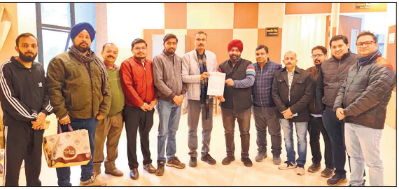
नगर निगम में ज्ञापन देने पहुंचे भारतीय उद्योग व्यापार मंडल के पदाधिकारी।

जिलाध्यक्ष ने कहा कि शहर के स्थायी दुकानदार करोड़ों रुपये की पूंजी लगाकर व्यापार कर रहे हैं और नियमित रूप से जीएसटी, नगर निगम कर, बिजली बिल व अन्य वैधानिक शुल्क जमा कर रहे हैं, जबकि अवैध व्यापारी बिना किसी वैध लाइसेंस, बिना दुकान किराया, बिना नगर निगम