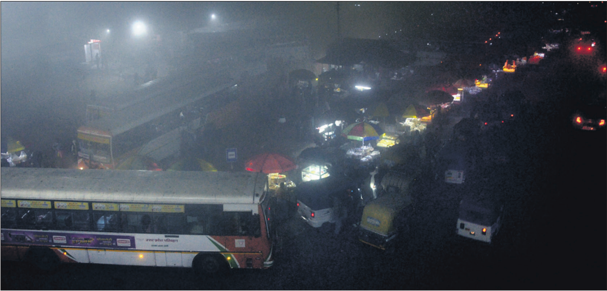
घने कोहरे की वजह से मंगलवार रात सेटेलाइट बस अड्डे के आसपास अंधेरे में दिखाई देना बंद हो गया। वाहन रंगते हुए नजर आए।

जिले के अधिकतम तापमान में दो दिन में उल्लेखनीय गिरावट हुई है। दो दिन पहले 14 दिसंबर को अधिकतम तापमान 23.3 डिग्री सेल्सियस रिकॉर्ड किया गया था, इसके बाद सोमवार को 19.1 और मंगलवार को 16.3 डिग्री सेल्सियस रिकॉर्ड किया गया। वहीं न्यूनतम तापमान में बढ़ोत्तरी दर्ज की गई है और यह 10.4 डिग्री सेल्सियस से रिकॉर्ड किया गया। वहीं बरेली एयरफोर्स पर दृश्यता शून्य और