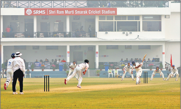
कूच बिहार ट्रॉफी के तहत एसआरएमएस क्रिकेट ग्राउंड में भिड़ती यूपी और बंगाल की टीमें।