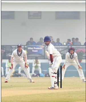
शॉट मारता बंगाल का खिलाड़ी।