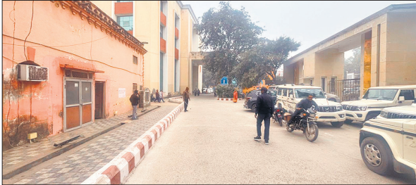
नगर निगम में ठंड के कारण नजर नहीं आए फरियादी।

कार्यालय संवाददाता, बरेली, अमृत विचार : जिले में मंगलवार सुबह इस सर्दी का सबसे ठंडा दिन दर्ज किया गया, जिसका असर सरकारी कार्यालयों में साफ दिखाई दिया। कलेक्ट्रेट, विकास भवन, नगर निगम समेत अन्य विभागों में आम दिनों की तुलना में फरियादी काफी कम आए। कोहरा और कड़ाके की ठंड ने लोगों को घर में रहने के लिए मजबूर कर दिया। सरकारी कार्यालयों का आलम यह था कि अधिकारी से लेकर कर्मचारी हीटर का सहारा लेकर खुद को गर्म रखने की कोशिश करते दिखे। वहीं, कलेक्ट्रेट और लोक निर्माण विभाग में कर्मचारी अलाव जलाकर बैठे थे। सुबह के समय कई कार्यालयों में कर्मचारी देर से पहुंचे, फरियादियों की संख्या भी कम थी, जिससे कार्यालयों में सुबह का समय अपेक्षाकृत खाली नजर आया। अधिकारियों ने भी कहा कि ठंड के इस मौसम में आम लोगों की आमद में गिरावट स्वाभाविक है, लेकिन कार्यालयों में कामकाज सुचारु रूप से चल रहा है। वहीं, दोपहर 12 बजे के आसपास जब धूप निकली तो सरकारी विभागों के कर्मचारियों और आने वाले फरियादियों को थोड़ी राहत मिली। कई कर्मचारियों ने