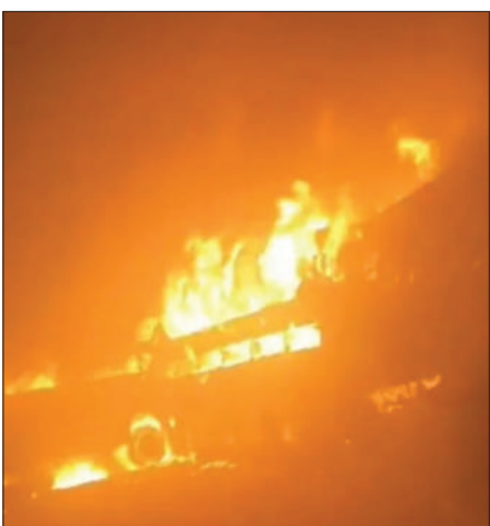
मथुरा में यमुना एक्सप्रेसवे पर धुंधू कर जलती बसें।