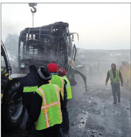
हादसे के बाद राहत कार्य में जुटे कर्मचारी।