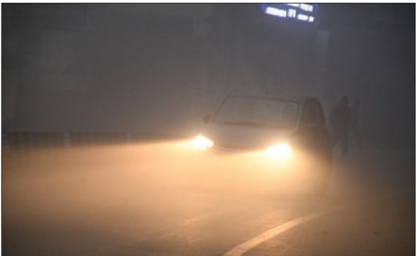
कोहरे के बीच निकलती गाड़ी ।

अमृत विचार: ठंड बढ़ने के साथ ही कोहरा गहराने लगा है । राजधानी ही नहीं सूबे के ज्यादातर ‘‘हाइवे’’, ‘‘एनएच’’ और ‘‘फोरलेन’’ दिन ढलते ही कोहरे के आगोश में समा जाते हैं । देर शाम तक धुंधलके की यह चादर इस कदर गहरा जाती है कि मार्गों पर दृश्यता (विजिबिल्टी) बहुत कम हो जाती है । ऐसे में रफ्तार भरने का जोखिम न उठाएं । वाहन की गति नियंत्रित कर लें और मार्ग पर लंबी दूरी तक दृश्यता स्पष्ट होने का इंतजार करें और तब गाड़ी को धीरे-धीरे आगे बढ़ाएं । मामूली लापरवाही आपके परिवार को न भूलने वाला ऐसा दंश दे जाती है जिसकी भरपाई संभव नहीं । बीते साल 2024 में कोहरे के दौरान 9,075 हादसों में 4,845 लोगों ने जान गंवाई थी । बीते तीन साल के आंकड़ों का अवलोकन करें तो ग्राफ लगातार बढ़ रहा है । ऐसे में जब बहुत जरूरी हो तभी वाहनों से दूर