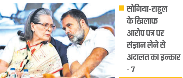
■ सोनिया-राहुल के खिलाफ आरोप पत्र पर संज्ञान लेने से अदालत का इन्कार - 7