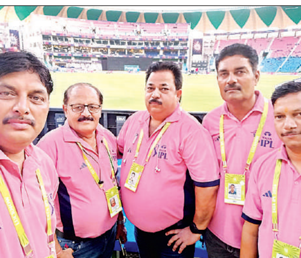
भारत-दक्षिण अफ्रीका मैच के लिए बुने गए स्कोरर।