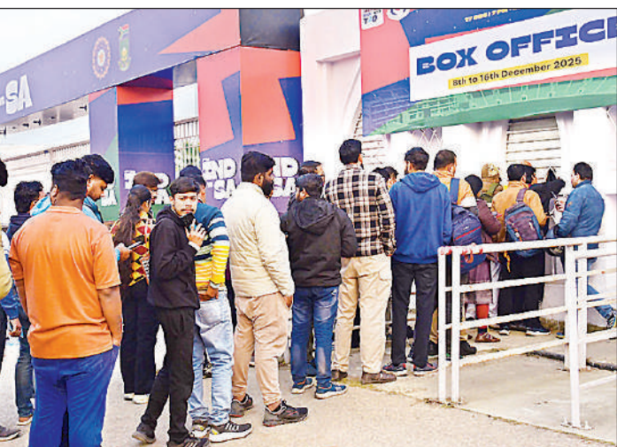
अटल बिहार वाजपेयी इकाना स्टेडियम के बाहर मैच के टिकट के लिए लगी लाइन।

■ भारतीय टीम के कप्तान सूर्यकुमार यादव का फार्म में लौटना बेहद जरूरी है। पिछले तीन मैचों में वह सिर्फ 29 रन ही बना सके हैं। एशिया कप टी-20 के बाद दिलीप ट्रॉफी में भी वह बड़ी पारी नहीं खेल पाए हैं, जिससे टीम प्रबंधन की चिंता बढ़ी है। सलामी जोड़ी के रूप में शुभमन गिल और अभिषेक शर्मा से एक बार फिर तेज शुरुआत की उम्मीद होगी, हालांकि अभी तक दोनों आक्रमक बल्लेबाजी में पूरी तरह सफल नहीं हो सके हैं। ऑलराउंडर हार्दिक पांड्या और शिवम दुबे ने अब तक दमदार प्रदर्शन कर मध्यक्रम को मजबूती दी है।