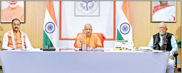
सीएम डैस बोर्ड की बैठक में मुख्यमंत्री योगी आदित्यनाथ, उप मुख्यमंत्री केशव प्रसाद मौर्या और वित्त मंत्री सुरेश खन्ना।

मुख्यमंत्री योगी मंगलवार को एनेक्सी में सीएम डैशबोर्ड व वित्तीय स्वीकृतियों की समीक्षा कर रहे थे। उन्होंने कहा कि वर्ष 2016-17 में उत्तर प्रदेश की जीएसडीपी जहां 12.5 लाख करोड़ रुपये थी, वह 2024-25 में बढ़कर 29.78 लाख करोड़ रुपये तक पहुंच चुकी है। 2025-26 में इसके 36 लाख करोड़ रुपये से अधिक होने