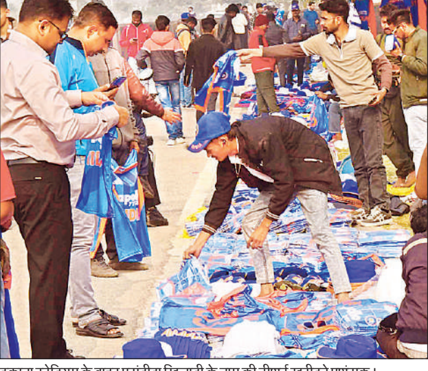
इकाना स्टेडियम के बाहर पसंदीदा खिलाड़ी के नाम की टीशर्ट खरीदते प्रशंसक।

■ जैसेपी कानून-व्यवस्था ने बताया कि दर्शकों के लिए प्रवेश मैच शुरू होने के तीन घंटे पहले ही खोल दिया जाएगा। गेट नंबर-एक व दो से नार्थ पवेलियन और जनरल स्टैंड के दर्शक प्रवेश कर सकेंगे। गेट नंबर-3 केवल वीआईपी, खिलाड़ियों और साउथ हॉस्पिटैलिटी पास धारकों के लिए आरक्षित रहेगा। वहीं, गेट नंबर 4-5 साउथ पवेलियन, प्रेसिडेंशियल गैलरी व अन्य दर्शकों के लिए होगा।