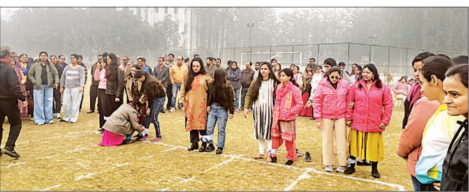
श्री रामस्वरूप कॉलेज में प्रतियोगिता में भाग लेते शिक्षक और कर्मचारी।