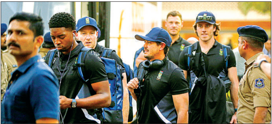
अहमदाबाद में सरदार वल्लभभाई पटेल एयरपोर्ट पर पहुंचे पर दक्षिण अफ्रीका के विक्टन डी कॉक ( मध्य) व टीम के अन्य सदस्य।

गिल का छोटे प्रारूप में नहीं चल पाना भी भारत के लिए अगले साल के शुरू में होने वाले टी20 विश्व कप से पहले चिंता का विषय होगा। वह पिछले मैच में अभ्यास के दौरान चोटिल हो गए थे जिससे उनका अंतिम मैच में खेलना संदिग्ध है। भारतीय टीम किसी