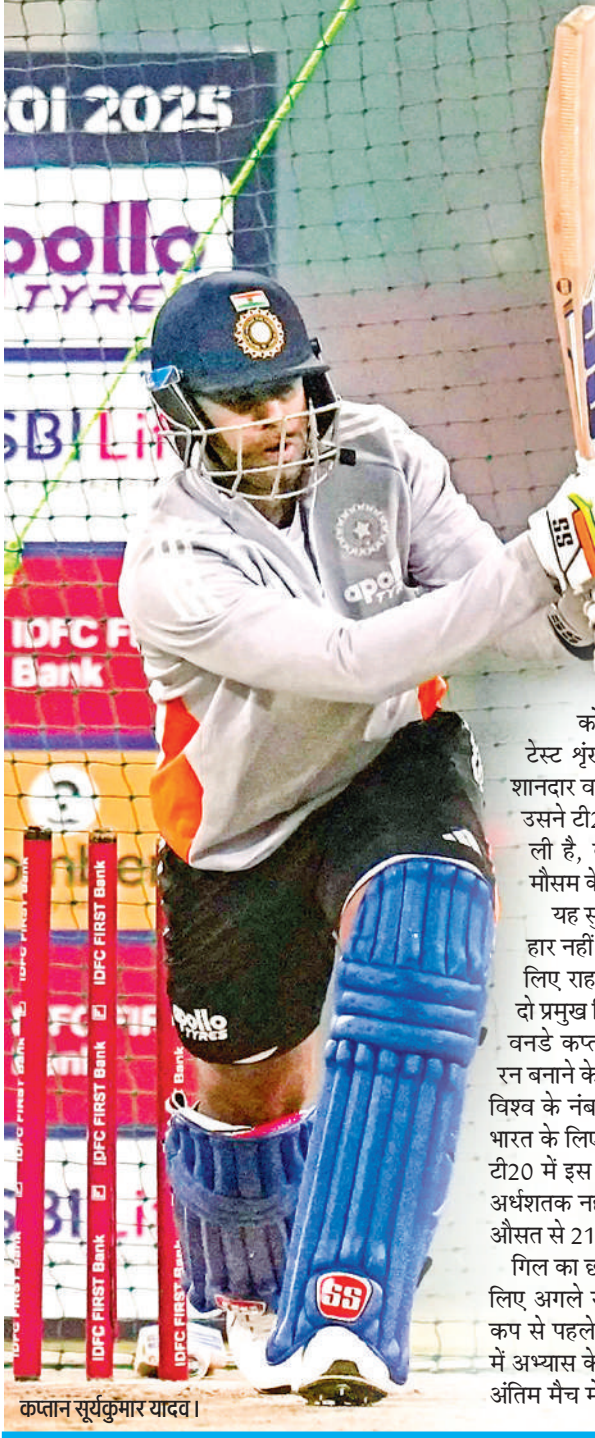
कप्तान सूर्यकुमार यादव।

सुमित नागल और पाउला बाडोसा के शानदार प्रदर्शन से इंगल्स ने बृहस्पतिवार को यहां काइट्स को हराकर विश्व टेनिस लीग (डब्ल्यूटीएल) में फाइनल की ओर मजबूत कदम बढ़ाए। नागल