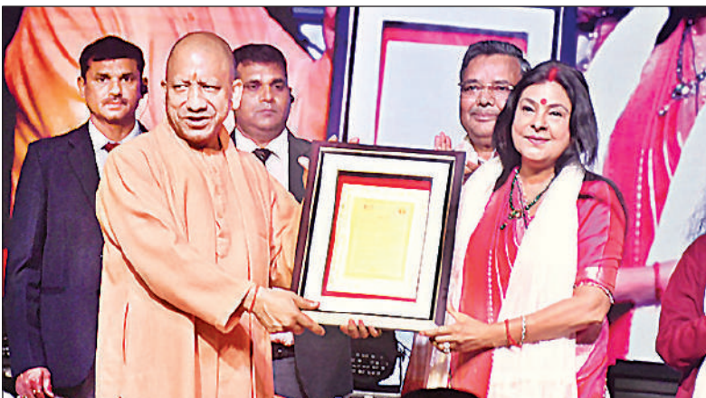
भातखंडे विवि की पूर्व छात्रा पद्मश्री मालिनी अवस्थी को सम्मानित करते मुख्यमंत्री योगी आदित्यनाथ ।

मुख्यमंत्री ने कहा कि सरकार कलाकारों को सुरक्षित, सम्मानित और सशक्त वातावरण देने के लिए प्रतिबद्ध है। भातखण्डे संस्कृति विश्वविद्यालय इस दिशा में सरकार का महत्वपूर्ण साझेदार है। उन्होंने विश्वविद्यालय के नए प्रस्तावित परिसर, आधुनिक ऑडिटोरियम, ओपन थिएटर और पुराने परिसर को संग्रहालय के रूप में विकसित करने की योजना की भी जानकारी दी। इस अवसर पर 100 वर्षों की यात्रा पर आधारित कौंफी टेबल बुक ‘ए लिगेसी ऑफ़ एक्सिलेंस’, डाक विभाग के विशेष आवरण और अंतरराष्ट्रीय सम्मेलन का शुभारंभ किया गया।