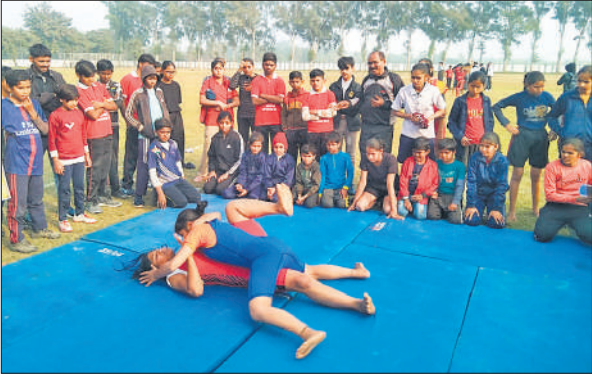
कुश्ती में दांव लगाती खिलाड़ी।