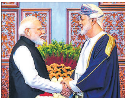
ओमान के सुलतान हैसम बिन के साथ प्रधानमंत्री मोदी।

सामान सहित भारत के 98 प्रतिशत निर्यात को ओमान में शुल्क-मुक्त पहुंच मिलेगी। इसे आधिकारिक तौर पर