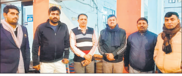
बैठक के दौरान संगठन के पदाधिकारी।