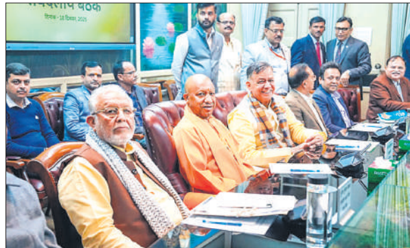
सर्वदलीय बैठक में उपस्थित मुख्यमंत्री योगी व अन्य।

किया। इस दौरान सदन की कार्यवाही के निर्बाध संचालन के लिए सभी दलों से सहयोग का आश्वासन मिला। विधानसभा अध्यक्ष ने कहा कि सभी के सहयोग से ही सदन चलता है। विधानसभा के विगत सत्र में अनेक महत्वपूर्ण मुद्दा पर सकारात्मक चर्चा परिचर्चा हुई। सभी दलों के सहयोग से जनोपयोगी मुद्दों पर ताकिक, तथ्यपरक एवं गुणवत्तापूर्ण चर्चा के माध्यम से जनसमस्याओं का सार्थक समाधान किया जा सकता है। नेता सदन योगी आदित्यनाथ ने कहा कि सदन