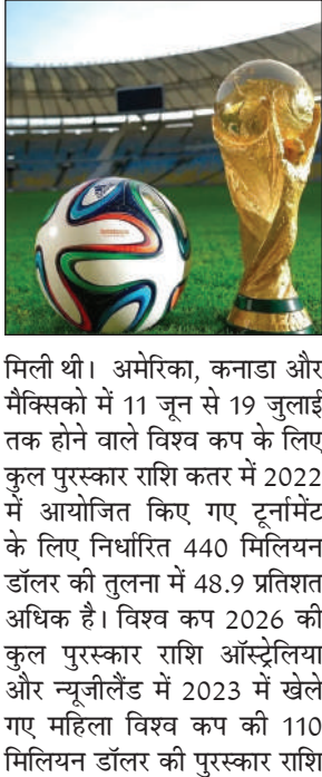
मिली थी। अमेरिका, कनाडा और मैक्सिको में 11 जून से 19 जुलाई तक होने वाले विश्व कप के लिए कुल पुरस्कार राशि कतर में 2022 में आयोजित किए गए टूर्नामेंट के लिए निर्धारित 440 मिलियन डॉलर की तुलना में 48.9 प्रतिशत अधिक है। विश्व कप 2026 की कुल पुरस्कार राशि ऑस्ट्रेलिया और न्यूजीलैंड में 2023 में खेले गए महिला विश्व कप की 110 मिलियन डॉलर की पुरस्कार राशि

क्लब विश्व कप की कुल पुरस्कार राशि एक अरब डॉलर थी। चेलसी को चौपियन बनने पर 125 मिलियन डॉलर की पुरस्कार राशि