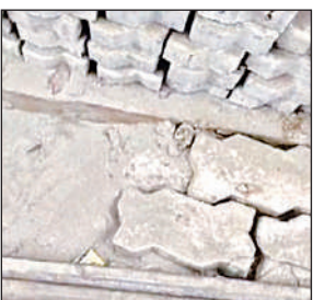
वार्ड नंबर-5 में हो रहा इंटरलॉकिंग कार्य।

शिकायती पत्र में उन्होंने आरोप लगाया कि नगर पालिका के वार्ड नंबर 5 मोहल्ला पश्चिम तरफ में कराए जा रहे इंटरलॉकिंग कार्य में मानकों की खुलेआम अनदेखी की जा रही है। कार्य में किसी प्रकार की गिड्डी नहीं डाली जा रही है, जिससे सड़क की गुणवत्ता पर सवाल खड़े हो रहे हैं। इसके अलावा यह कार्य समय से भी पूरा नहीं किया गया है