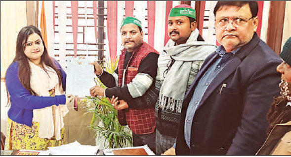
एसडीएम करनैलगंज को मांग पत्र देते किसान संगठन के पदाधिकारी।

ज्ञापन में मांग की गई कि तहसील मुख्यालय पर किसानों की मासिक बैठकों के लिए एक स्थायी स्थल का चयन किया जाए। साथ ही खुदरा दुकानदारों द्वारा उर्वरकों की मनमानी कीमतों पर विक्री पर तत्काल अंकुश लगाए जाने की आवश्यकता जताई गई। किसानों ने बढ़ती ठंड को देखते हुए तहसील परिसर एवं अन्य सार्वजनिक स्थलों