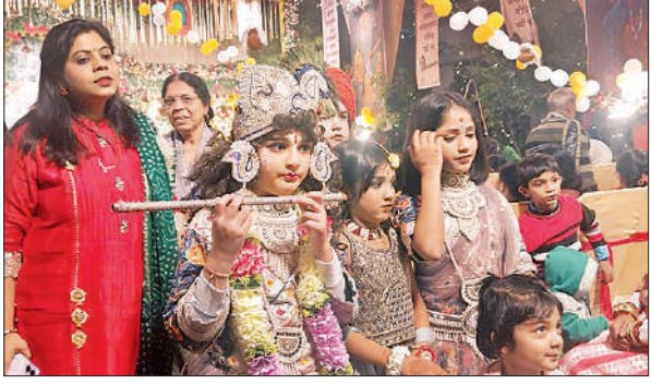
भागवत कथा के दौरान सजायी गयी भगवान श्रीकृष्ण की झांकी।