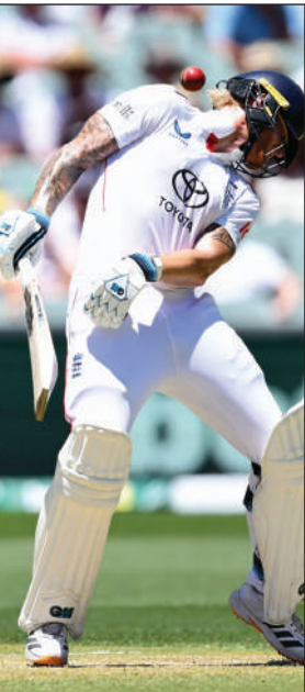
इंग्लैंड के कप्तान बेन स्टोक्स।

और लियोन (09) को पगबाधा आउट करके पारी में पांच विकेट पूरे किए। स्कॉट बोलैंड 21 गेंदों पर 14 रन बनाकर नाबाद रहे। लियोन ने