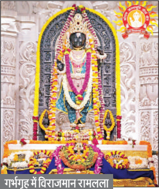
गर्भगृह में विराजमान रामलला