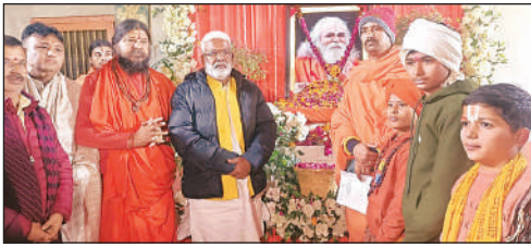
जल शक्ति मंत्री स्वतंत्र देव सिंह ने ब्रह्मलीन डॉ. रामविलास वेदांती को दी श्रद्धांजलि।

अमृत विचार : डॉ. राममनोहर लोहिया अवध विश्वविद्यालय के कौटिल्य प्रशासनिक सभागार में नैक मूल्यांकन की तैयारी को लेकर गुरुवार को कुलाधिपति एवं राज्यपाल आनंदीबेन पटेल की अध्यक्षता में समीक्षा बैठक हुई। एट्रीब्यूट एक (मानदंड) से लेकर केएट्रीब्यूट 11 तक के सभी महत्वपूर्ण बिन्दुओं का पॉवर पॉइंट्स प्रेजेंटेशन के माध्यम से सभी मानकों के अटैचमेंट को कुलाधिपति द्वारा परखा गया। उन्होंने नैक मूल्यांकन को लेकर सभी मानदंडों को मानकों के अनुरूप करने के लिए निर्देश दिए। विभिन्न