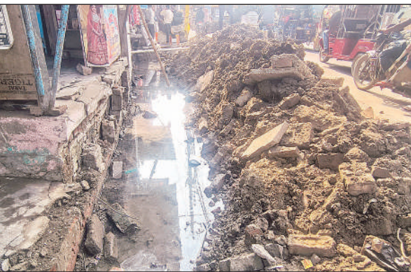
उतरोला नगर में हो रहा मानकविहीन नाले का निर्माण।

नगर पालिका द्वारा नाली की लंबाई बस स्टेशन से नेहरू क्रासिंग तक बताई जा रही है, जबकि मौके पर निर्माण कार्य बस स्टेशन से पहले स्थित पुलिया से नेहरू क्रासिंग तक ही कराया जा रहा है। स्थानीय लोगों के अनुसार इसकी लंबाई लगभग 115 कदम के आसपास है। आरोप है कि पहले से बने नाले को और संकरा कर नाली का रूप दिया जा रहा है, जिससे क्षेत्र में यह मज्जाक का विषय बन गया है कि नाले के नाम पर नाली बनाई जा रही है।