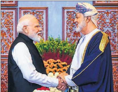
ओमान के सुलतान हैसम बिन के साथ प्रधानमंत्री मोदी।

सामान सहित भारत के 98 प्रतिशत निर्यात को ओमान में शुल्क-मुक्त पहुंच मिलेगी। इसे आधिकारिक तौर पर