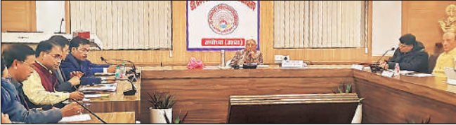
अवध विश्वविद्यालय के कौटिल्य प्रशासनिक भवन में नैक मूल्यांकन को लेकर बैठक करतीं कुलाधिपति राज्यपाल आनंदीबेन।