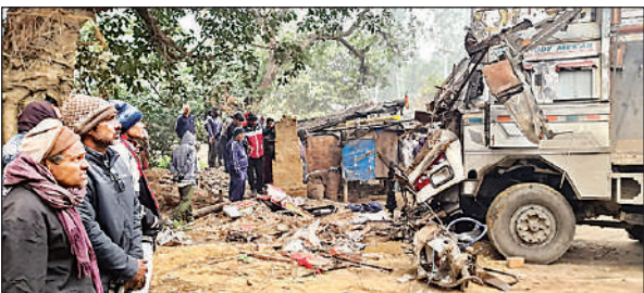
दुर्घटनाग्रस्त ट्रक और मौके पर मौजूद ग्रामीणों की भीड़।