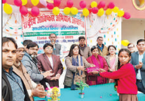
छात्राओं को सम्मानित करते प्रधानाचार्य व साथ में मौजूद अन्य।