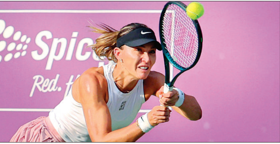
बेंगलुरु में डब्ल्यूटीएल में शॉट लगाती इंगल्स की पाउला बाडोसा।