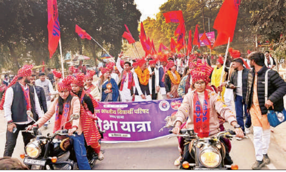
शोभायात्रा निकालते अखिल भारतीय विद्यार्थी परिषद के कार्यकर्ता।