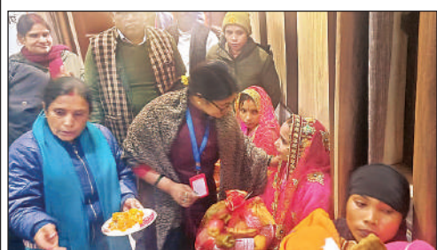
गर्भवती महिला की गोद भराई करती महिला आयोग की सदस्या।