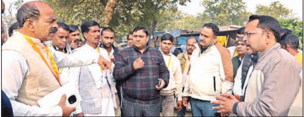
ग्राम पंचायत पलिया लोहानी का निरीक्षण करते मध्य प्रदेश से आए जनाप्रतिनिधि व अधिकारी।