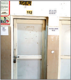
जिला महिला अस्पताल में अल्ट्रासाउंड कक्ष में लटक रहा ताला।