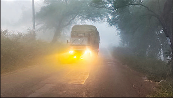
कोहरे के बीच हेडलाइट जलाकर जाता वाहन।

है। कड़ाके की सर्दी और ठिठुरन के बीच बच्चे स्कूल पहुंच रहे हैं। बढती ठंड में बच्चों के बीमार