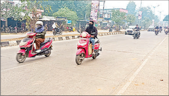
ठंड के चलते सड़कों पर कम दिखे वाहन।

तब्दील हो गया। उस पर पछुआ हवा ने मुश्किलें और बढ़ा दीं। कड़ाके की ठंड के कारण सुबह करीब 11 बजे तक लोगों को भारी परेशानियों का सामना करना पड़ा। ठंड और गलन के चलते अधिकांश लोग घरों में दुबके रहे, जबकि जरूरी काम से निकलने वालों को