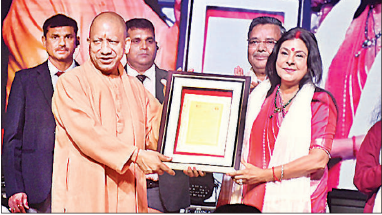
भातखंडे विवि की पूर्व छात्रा पद्मश्री मालिनी अवस्थी को सम्मानित करते मुख्यमंत्री योगी आदित्यनाथ ।

प्रतिष्ठा भी दिलाई। उन्होंने स्पष्ट किया कि एक संस्कृति कर्मी भी राष्ट्र निर्माण में उतना ही योगदान देता है, जितना कोई अन्य क्षेत्र का नागरिक। इस अवसर पर उन्होंने संस्थान के संस्थापक पं. विष्णु नारायण भातखण्डे को श्रद्धांजलि अर्पित की। मुख्यमंत्री योगी ने वर्ष 1940 में