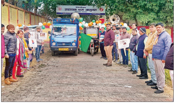
वाहन रैली को हरी झंडी दिखाकर रवाना करते सहायक श्रम आयुक्त।