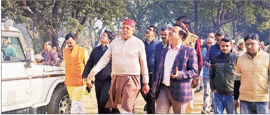
किसान पाठशाला में भाग लेने के बाद फसल देखने जाते कृषि मंत्री सूर्य प्रताप शाही।

किसान पाठशाला का शुभारंभ करते हुए कृषि मंत्री शाही ने कहा कि सरकार द्वारा किसानों के हितार्थ