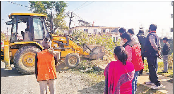
पचपेड़वा नगर में अतिक्रमण पर चल रहा बुलडोजर।