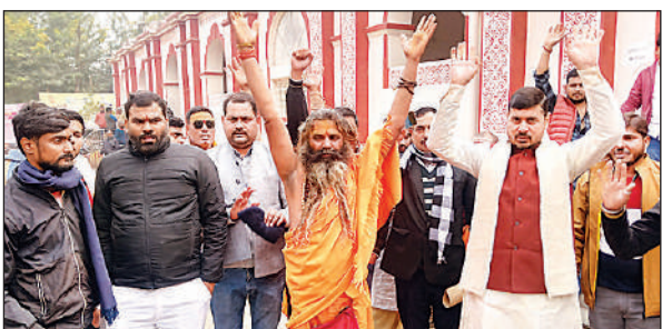
कलेक्ट्रेट में प्रदर्शन करते भगवा वाहिनी गऊ सेवा मिशन के पदाधिकारी।

मिशन के राष्ट्रीय अध्यक्ष ने बताया कि वह अपनी गौ सेवा टीम के साथ बुधवार को घासीपुर स्थित गो आश्रय स्थल पर पहुंचे। जहां देखा कि गो वंश चारे व इलाज के अभाव दम तोड़ते नजर आये। कुछ