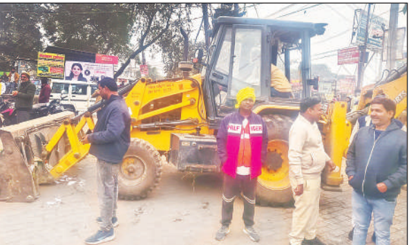
उतरोला नगर में अतिक्रमण हटवाते नगर पालिका के अधिकारी व कर्मचारी।