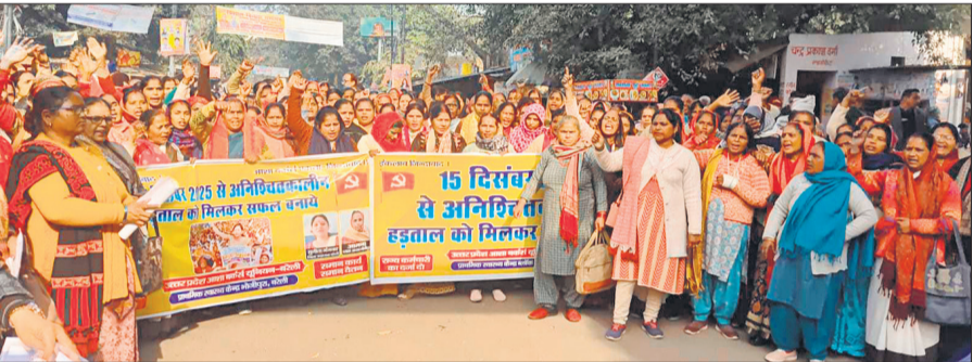
कलेक्ट्रेट गेट पर प्रदर्शन करतीं उत्तर प्रदेश आशा वर्कर्स यूनियन से जुड़ी आशा कार्यकर्त्रियां।

इससे पहले आशा कार्यकर्त्रियों ने सेठ दामोदर स्वरूप पार्क से कलेक्ट्रेट गेट तक रैली निकालते हुए प्रदर्शन किया। मुख्यमंत्री को संबोधित ज्ञापन नगर मजिस्ट्रेट को सौंपते हुए स्पष्ट किया कि उनकी अनिश्चितकालीन हड़ताल है, यदि मांगें नहीं मानी गईं तो 23 दिसंबर के बाद लखनऊ