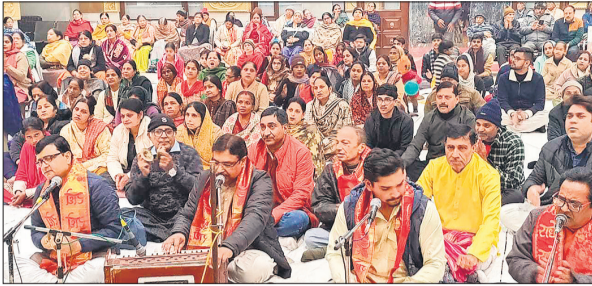
बांके बिहारी मंदिर में भजन-कीर्तन करते श्रद्धालु।