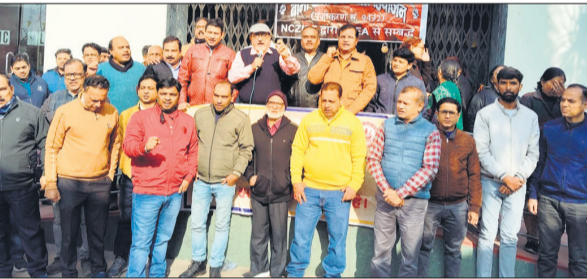
मंडलीय कार्यालय के बाहर प्रदर्शन करते पदाधिकारी।

अमृत विचार : बरेली ट्रेड यूनियंस फेडरेशन ने डीडीपुरम स्थित जीवन बीमा निगम के मंडलीय कार्यालय पर लंच के बाद सभा की, जिसमें बीमा कानून संशोधन विधेयक 2025 के विरोध में बैंक बीमा कर्मचारियों और अधिकारी संगठनों ने विरोध किया।