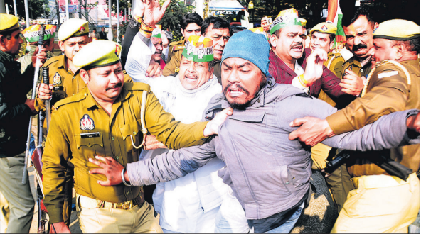
भाजपा कार्यालय का घेराव करने जाते हुए कांग्रेसियों को गिरफ्तार करती पुलिस।

कि इन तथ्यों से यह स्पष्ट होता है कि भाजपा सरकार विपक्ष के नेताओं को बिना किसी ठोस आधार के कानूनी रूप से फंसाने का निरंतर प्रयास कर रही है। प्रांतीय नेतृत्व के आह्वान पर गुरुवार को जिला एवं महानगर कांग्रेस ने महात्मा गांधी पार्क में धरना देकर विरोध प्रदर्शन किया गया। इसके बाद कांग्रेसियों ने भाजपा कार्यालय पर जाने का प्रयास किया तो पुलिस बल ने उन्हें रोकने का प्रयास किया। आरोप है कि पुलिस की धक्का-मुक्की में कई कांग्रेसी भी घायल हो गए। पुलिस ने प्रदर्शन कर रहे कांग्रेसियों को हिरासत में लेकर पुलिस लाइन ले