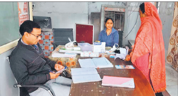
एनसीडी क्लीनिक में मौजूद मरीज और स्टाफ।

बताया कि टंड के चलते अचानक से दर्द और बेचैनी की समस्या हो रही है। ऐसे में दिन में एक बार ब्लड प्रेशर की दवा लेने वाले बुजुर्ग मरीजों की डोज को बढ़ाकर दो बार किया गया है। उन्होंने बताया कि हार्टअटैक