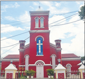
क्राइस्ट मेथोडिस्ट चर्च।

मेथोडिस्ट चर्च के संस्थापक पादरी जौन वैंसली के समर्थक और सिद्धांतों का अनुसरण करने वाले पादरी विलियम बटलर ने अमेरिका