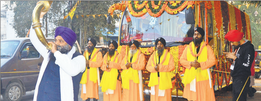
नगर कीर्तन में पंज प्यारों के साथ गुरुग्रन्थ साहिब की पालकी।

गुरुद्वारा श्री गुरु नानक सत्संग सभा कोहाड़ापीर से नगर कीर्तन श्री गुरु ग्रंथ साहिब एवं पंज प्यारों की अगुआई में दोपहर 1 बजे शुरू हुआ। जो प्रेमनगर धर्मकांडा, राम जानकी मंदिर, गुरुद्वारा जनकपुरी, शील चौराहा, डीडीपुरम, कुष्ठ आश्रम, हरि मंदिर होता हुआ रात 8 बजे गुरुद्वारा श्री गुरु सिंह सभा मॉडल टाउन पर पहुंचकर संपन्न हुआ। नगर कीर्तन में विशेष रूप से नानकमता साहिब से श्री गुरु ग्रंथ साहिब जी की विशेष पालकी बस