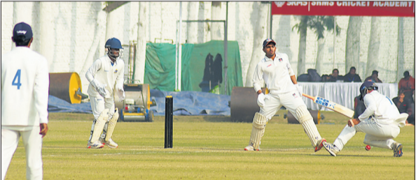
श्रीराम मूर्ति स्मारक क्रिकेट स्टेडियम में मैच खेलती यूपी और बंगाल की टीम।

उत्तर प्रदेश क्रिकेट एसोसिएशन के निदेश पर बरेली क्रिकेट एसोसिएशन की ओर से श्रीराम मूर्ति स्मारक क्रिकेट स्टेडियम में चल रही कूच