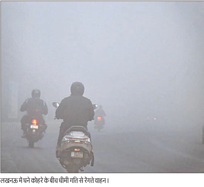
लखनऊ में घने कोहरे के बीच धीमी गति से रेंगते वाहन ।