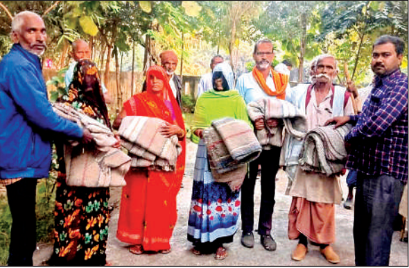
गरीबों और बुजुर्गों को कंबल वितरित करते प्रधान व प्रतिनिधि।