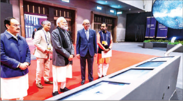
प्रदर्शनी में उपस्थित प्रधानमंत्री मोदी, डब्ल्यूएचओ के महानिदेशक टेड्रोस अधानोम व अन्य ।