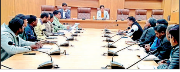
सफाई व्यवस्था को लेकर बैठक करतीं डीएम।

जिलाधिकारी ने ईओ को निर्देश दिए कि रोस्टर के आधार पर सफाई का पर्यवेक्षण किया जाए। पर्यवेक्षण में लगाए गए विभिन्न विभागों के अवर अभियन्ताओं को निर्देश दिए कि प्रतिदिन सुबह सात बजे सफाई की निगरानी करें और अनुपस्थित सफाई कर्मचारियों