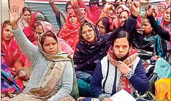
नारेबाजी करतीं धरने पर बैठी आशा बहुएं।

उत्तर प्रदेश आशा वर्कर्स एसोसिएशन के बैनर तले आयोजित इस धरने में आशा बहुओं ने भीषण सर्दी के बावजूद अपनी उपस्थिति बनाए रखी। न्यूनतम तापमान 11 डिग्री सेल्सियस होने के बावजूद उन्होंने धरना स्थल पर ही चूल्हे पर चाय बनाकर पी। आशा कार्यकर्ताओं की प्रमुख मांगों में उन्हें राज्य कर्मचारी घोषित करना, 20 हजार रुपये मासिक मानदेय देना और स्थायीकरण शामिल है।