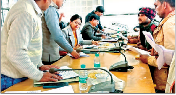
किसानों के अभिलेख जांचतीं डीएम और अन्य अधिकारी।

● बैठक में 51 किसानों के अभिलेखों की जांच कर बीमा एप्रूव कराने निर्देश