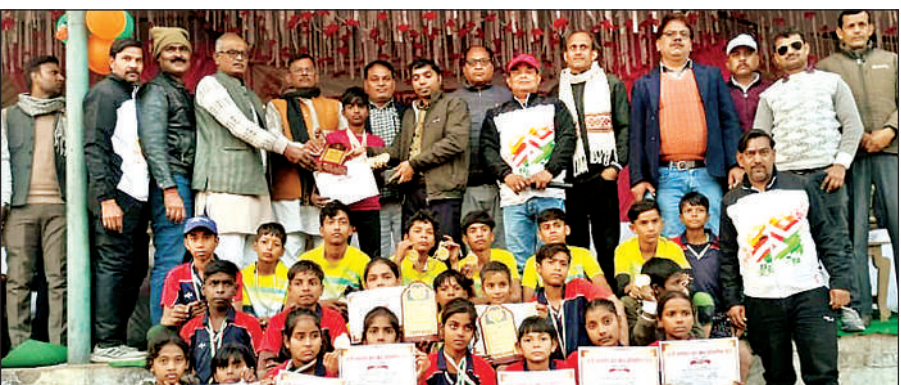
प्रमाण पत्र के साथ विजेता टीम मुख्य अतिथि व अन्य लोग।

खोखो प्राथमिक स्तर में व जूनियर वर्ग बालक व बालिका में अछल्दा की टीम विजेता रही। खोखो फाइनल अछल्दा और सहार के बीच खेला गया जिसमें अछल्दा