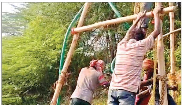
दिल्ली से आई टीम जांच करती हुई।

बुधवार और गुरुवार देर शाम से इंजीनियरिंग टीम गांव में डेरा डाले हुए हैं, जबकि इस कार्य में करीब 60 से अधिक मजदूर लगे हुए हैं। बताया जा रहा है कि नवंबर माह में ड्रोन सर्वे के दौरान मिले संकेतों के बाद इस क्षेत्र में कच्चे तेल की की