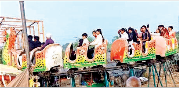
झाड़ू बाबा मंदिर के मेले में झूले का आनंद लेते बच्चे।