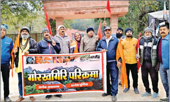
गोरखगिरि की परिक्रमा लगाते श्रद्धालु।

● मुख्यमंत्री के ड्रीम प्रोजेक्ट के तहत गोरखगिरि के चारों ओर निर्माण होने पर जताई चिंता