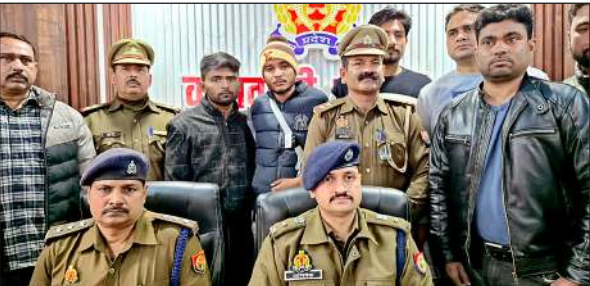
पुलिस की गिरफ्त में आरोपी।

उपलब्ध कराएं। समीक्षा के दौरान जिलाधिकारी ने अधिशासी अभियंता विद्युत को निर्देश दिए कि वह अपने-अपने संबंधित फीडरों की विद्युत आपूर्ति की सूचना प्रतिदिन उपलब्ध कराएं। साथ ही यह भी सुनिश्चित करें कि अन्नदाताओं को निर्धारित शेड्यूल के तहत विद्युत आपूर्ति हो जिससे उन्हें फसलों की सिंचाई हेतु परेशान न होना पड़े। इसी प्रकार नहरों द्वारा सिंचाई हेतु मिलने वाले पानी की उपलब्धता सुनिश्चित किए जाने के लिए अधिशाषी अभियंता सिंचाई नहर को निर्देशित किया कि नहरों