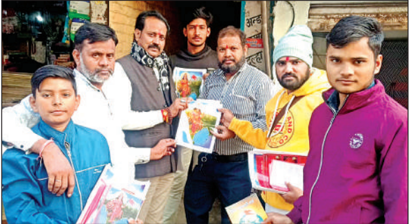
अभियान के दौरान पत्रक बताते कार्यकर्ता।

बताया गया कि कार्यक्रम का मुख्य उद्देश्य स्वयंसेवकों के माध्यम से हर घर तक पहुंचना, संघ की विचारधारा, उसकी 100 वर्षों की यात्रा, उपलब्धियों और सामाजिक कार्यों जैसे सामाजिक समरसता, पर्यावरण संरक्षण तथा नागरिक कर्तव्यों की जानकारी देना है। कार्यक्रम में बड़ी संख्या में लोगों ने हिस्सा लिया। इसके माध्यम से