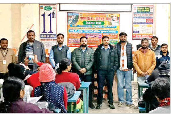
रोजगार मेले में उपस्थित छात्र व कंपनियों के अधिकारी।