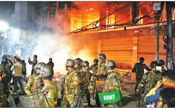
आगजनी के बाद मामले को संभालते सेना के जवान ।