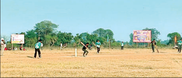
मैच के दौरान शॉट लगाने की कोशिश करता खिलाड़ी।

पहले मुकाबला शिवम् क्लब और दीपक क्लब के मध्य खेला गया। टींस जीते हुए शिवम् क्लब ने पहले बल्लेबजी करने का कप्तान ने फैसला लिया और अपने ओपनर बल्लेबाजों को मैदान पर उतारा। दोनो ही बल्लेबाजों ने अच्छी शुरुआत करते हुए गेंदबाजों की जमकर धुनाई की और पांच ओवर में 52 रन की साझेदारी की। शिवम क्लब ने निर्धारित 12 ओवर में पांच विकेट खोकर 139 रन बनाए। लंच के बाद टीम ने फील्डिंग सजाई और दीपक क्लब ने अपने बल्लेबाजों को भेजा। अम्यायर के