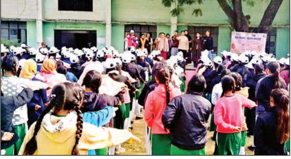
छात्राओं को बाल विवाह मुक्त भारत की शपथ दिलाई गई।

इस दौरान वक्ताओं ने बताया कि बाल विवाह एक सामाजिक बुराई है। 18 वर्ष से कम उम्र की बालिका व 21 वर्ष से कम उम्र का बालक का विवाह, बाल विवाह के अंतर्गत आते हैं। जो बाल विवाह निषेध अधिनियम 2006 के तहत कठोर दंड का प्रावधान है। जिसमें दो साल की कैद व एक लाख रुपये का जुर्माना हो सकता है।