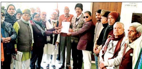
अपर जिलाधिकारी को ज्ञापन सौंपते संगठन के पदाधिकारी।