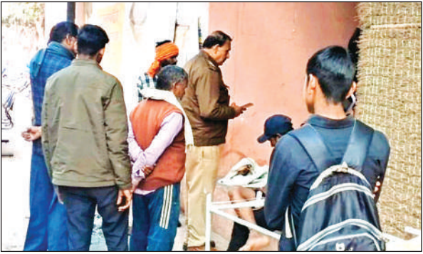
हादसे के बाद मौदहा सीएचसी पहुंचे परिवार के लोग।

● मौदहा करखे से खाद लेकर बाइक पर लौट रहे थे चाचा-भतीजा