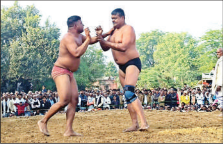
दंगल में दांव-पेच दिखाते पहलवान।