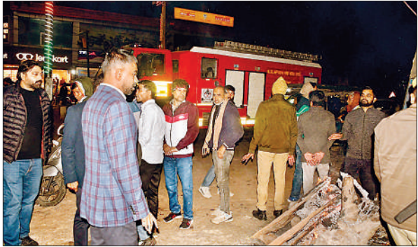
अलाव का निरीक्षण करते सीडीओ।