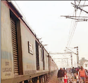
बघौली रेलवे क्रॉसिंग पार करते यात्री।

अमृत विचार। हरदोई-लखनऊ रेल मार्ग पर बघौली स्टेशन के यार्ड में शुक्रवार को उस समय अफरा-तफरी का माहौल बन गया, जब एक एक्सप्रेस ट्रेन खाली कोच लेकर धनबाद की ओर जा रही थी और अचानक उसका पावर फेल हो गया। पावर फेल होते ही ट्रेन बीच रास्ते में ही रुक गई और बघौली रेलवे फाटक संख्या 263-बी पर खड़ी हो गई। ट्रेन के फाटक पर खड़े हो जाने से सड़क यातायात पूरी तरह ठप हो गया और दोनों ओर वाहनों की लंबी कतारें लग गईं। रेलवे फाटक बंद रहने के कारण आम लोगों को भारी परेशानी का सामना करना पड़ा। खासकर स्कूल जाने वाले छात्र-छात्राएं, कार्यालय जाने