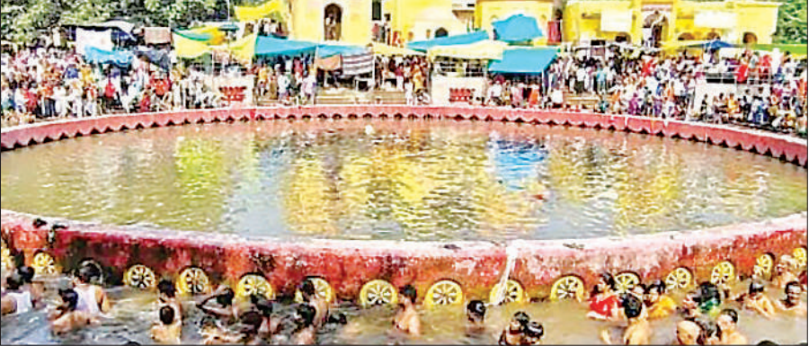
चक्रतीर्थ में स्नान करते श्रद्धालु।

नैमिषारण्य, सीतापुर, अमृत विचार : पौष माह की अमावस्या के अवसर पर शुक्रवार को पौराणिक तीर्थ नैमिषारण्य में श्रद्धालुओं की भारी भीड़ उमड़ी। तड़के सुबह से ही श्रद्धालुओं ने पवित्र चक्रतीर्थ और गोमती नदी में आस्था की डुबकी लगाई और विधि-विधान से दर्शन-पूजन किया। स्नान के बाद श्रद्धालुओं ने सूर्यदेव को अर्घ्य दिया और पितरों की शांति के लिए तर्पण किया। हिंदू धर्म में अमावस्या तिथि का विशेष महत्त्व माना गया है। धार्मिक मान्यताओं के अनुसार, यह तिथि भगवान विष्णु को समर्पित होती है। पौष अमावस्या को अत्यंत पुण्यकारी माना जाता है। इस दिन किए गए दान-