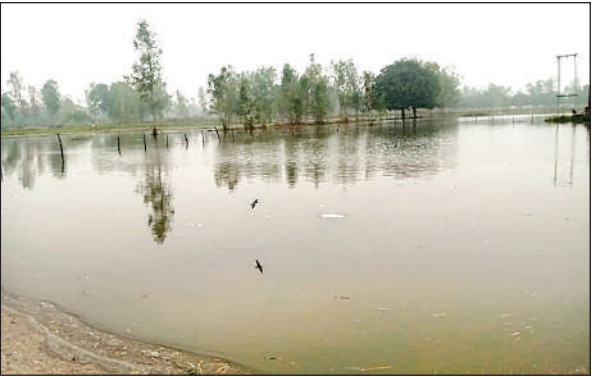
केवलपुर—बरेथा माइनर कटने से खेतों में भारी पानी।