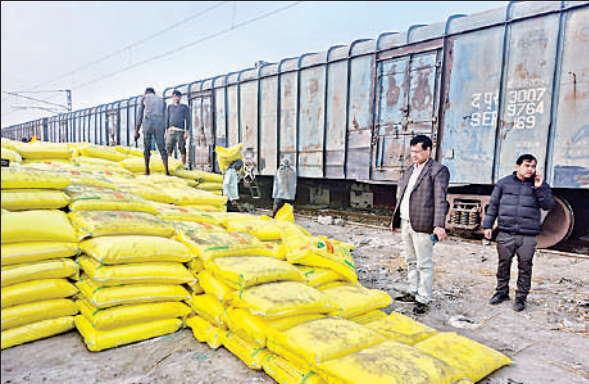
मालगाड़ी से यूरिया व डीएम की रैक उतरते समय मौजूद जिला कृषि अधिकारी।