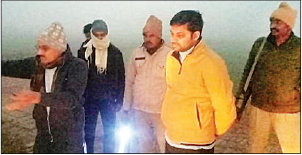
खनन अधिकारी को घटना की जानकारी देते लोग।