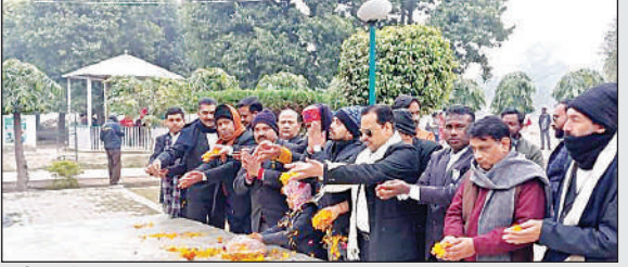
शहीद ज्योति स्तंभ पर पुष्प अर्पित करते अधिवक्ता परिषद के लोग।