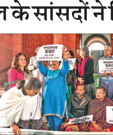
मनरेगा में बदलाव के खिलाफ शुक्रवार रात संसद परिसर में धरना देते तृणमूल सांसद।

मुफ्ती ने कोठीबाग के थाना प्रभारी को दी गई शिकायत में कहा, जबनर नकाब हटाना न सिर्फ मुस्लिम महिला पर क्रूर हमला था, बल्कि हर भारतीय महिला की स्वायत्तता, पहचान और गरिमा पर भी हमला है। घटना सोमवार को पटना में मुख्यमंत्री सचिवालय में हुई, जहां आयुष चिकित्सक अपने नियुक्ति पत्र प्राप्त करने पहुंचे थे। मुफ्ती ने कहा कि यह घटना और भी चिंताजनक है क्योंकि यह पूरे भारत में मुसलमानों को अलग-थलग करने और राजनीतिक और आर्थिक रूप से कमजोर करने की कोशिशों के बीच घटी है।