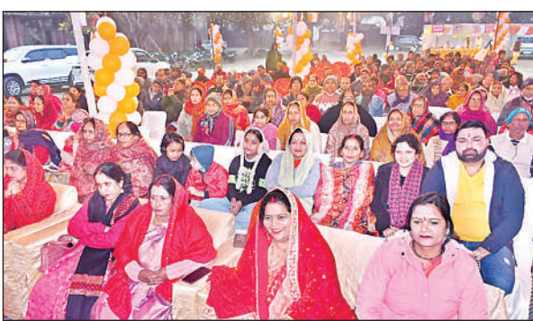
श्रीमद्भागवत कथा सुनते भक्त।