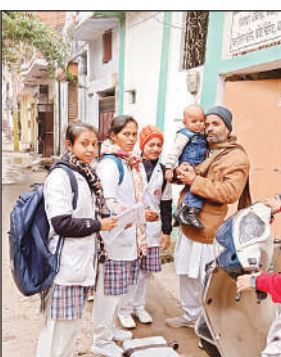
डोर टू डोर पोलियो की खुराक पिलाती मेडिकल छात्राएं।

14 दिसंबर से पोलियो अभियान की शुरुआत बूथों पर की गई थी लेकिन अगले ही दिन आशा वर्कर्स मांगों को लेकर हड़ताल पर चली गई। इसके कारण सोमवार से शुक्रवार तक चलने वाला पांच दिवसीय डोर-टू-डोर अभियान प्रभावित हो गया। प्राथमिक स्वास्थ्य केंद्र व अर्बन हेल्थ सेंटर के चिकित्सकों ने मेडिकल स्टॉप व स्वयंसेवी संस्थाओं की मदद से अभियान आगे बढ़ाया लेकिन लगभग 56 हजार बच्चों को पोलियो