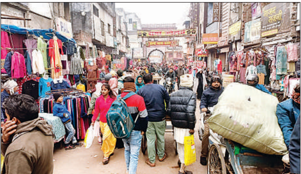
लालबाग बाजार में उमड़ी लोगों की भीड़।

दिन भर छायी धुंध के बीच लालबाग बाजार में बड़ी संख्या में लोगों ने की खरीदारी