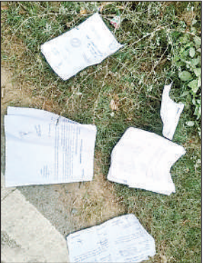
सोशल मीडिया पर वायरल सड़क किनारे पड़े सम्मन व नोटिस संबंधी कागजात।

अमृत विचार। जगतपुर थाना क्षेत्र के विन्न्वा गांव के पास सड़क किनारे पुलिस से संबंधित सम्मन और नोटिस पड़े मिलने का मामला सामने आया है। जिसकी तस्वीरें सोशल मीडिया पर वायरल हो रही है। स्थानीय लोगों के अनुसार सड़क किनारे पड़े ये दस्तावेज जरूरी कानूनी प्रक्रिया से जुड़े बताए जा रहे हैं। लोगों का कहना है कि यदि सम्मन और नोटिस समय पर तामील नहीं होते तो न्यायिक प्रक्रिया प्रभावित हो सकती है। फिलहाल यह स्पष्ट नहीं हो सका है कि ये सम्मन और नोटिस किसके हैं। इसको लेकर पुलिस विभाग की कार्यप्रणाली पर सवाल खड़े हो रहे हैं। थाना