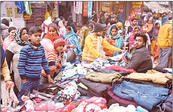
धवन रोड पर गर्म कपड़ों की खरीदारी करते लोग।

शहर के सदर बाजार, धवन रोड व स्टेशन रोड में सुबह से ही ग्राहक पहुंचने लगे। यही स्थिति ग्रामीण क्षेत्रों के बाजारों में भी देखने को मिली। दुकानदारों का कहना है कि बीते कुछ दिनों से बिक्री सुस्त थी लेकिन अचानक पारा गिरने से बाजार में तेजी आई है। ठंड