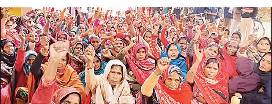
विरोध-प्रदर्शन करतीं संगतिन मजदूर संगठन की सदस्य।

मजदूरों ने कहा कि पिछले 20 वर्षों में मनरेगा ने उनकी जिंदगी बदल दी। विधवा, बूढ़े, कमजोर या बच्चों वाली