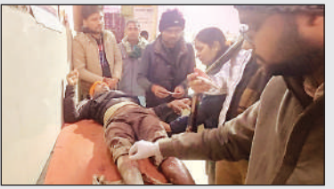
सीएचसी में घायल का उपचार करते स्वास्थ्य कर्मी।