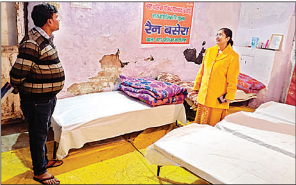
रैन बसेरा का निरीक्षण करती एडीएम।