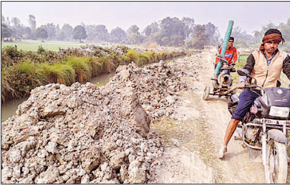
रजबहा की सर्विस पटरी पर मिट्टी के बगल से निकलते लोग।

जैसेबी से सिल्ट सफाई करके जगह-जगह ढेर लगा दिए जाते हैं, डौला नहीं बनाया जाता है, जिसके चलते हर बार जगह-जगह रजबहा कटने से किसानों की गेहूं और धान की फसल जलमग्न हो