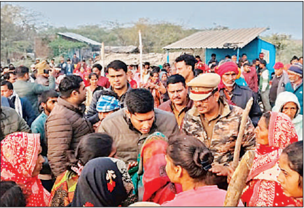
सड़क पर प्रदर्शन करते आक्रोशित परिजनों से बातचीत करती पुलिस।