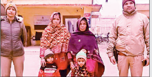
बच्चे को परिजनों को सुपुर्द करती पुलिस।