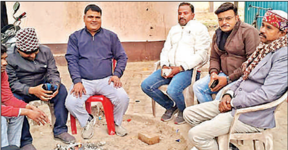
भीषण ठंड से बचने के लिए आग तापते लोग।

गिने-चुने स्थानों पर ही जल रहे अलाव: शाहाबाद: नगर पालिका परिषद द्वारा अलाव के नाम पर केवल खानापूतों की जा रही है। गिने-चुने स्थानों पर ही अलाव की व्यवस्था उपलब्ध कराई गई है जिससे आम आदमी और निचले तबके का वर्ग परेशान है। तीन दिन से ठंड लगातार बढ़ती जा रही है।