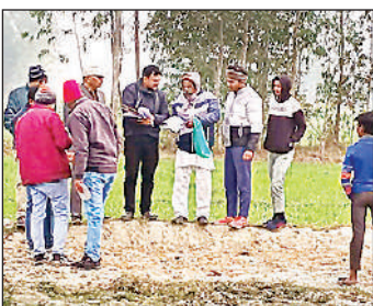
मवईभान में जांच करती टीम।