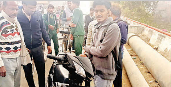
दुर्घटना के बाद मौके पर लगी लोगों की भीड़।