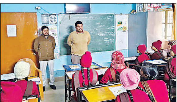
बच्चों को प्रोत्साहित कर शैक्षणिक कार्यों की जानकारी लेते डीएम।