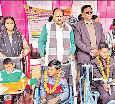
दिव्यांग बच्चों को ट्राई साइकिल वितरित करते विशिष्ट अतिथि।