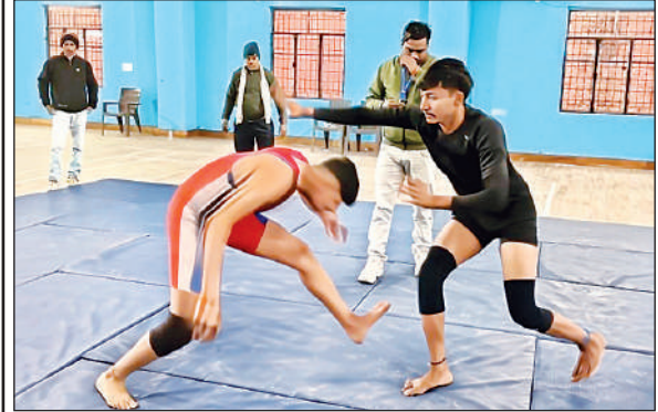
प्रतियोगिता में प्रतिभाग करते खिलाड़ी।

शुक्लामांज। गंगाघाट रेलवे स्टेशन पर अमृत स्टेशन योजना के तहत चल रहे निर्माण कार्य में गंभीर लापरवाही सामने आई है। कार्यदायी एजेंसी द्वारा की गई गहरी खुदाई के कारण रेलवे के महत्वपूर्ण सिग्नल केबल बिना किसी सुरक्षा के खुले में पड़ी हैं, जिससे रेल संचालन के लिए गंभीर खतरा पैदा हो गया है। स्थिति अधिक चिंताजनक इसलिए है क्योंकि खुली पड़ी इन केबलों से छेड़छाड़ या क्षति होने का सीधा असर रेल यातायात की सुरक्षा पर पड़ेगा, जो किसी बड़ी दुर्घटना का कारण बन सकता है। विशेषकर मौजूदा सर्दी और कोहरे के मौसम में, सिग्नल व्यवस्था में कोई भी गड़बड़ी गंभीर परिणाम दे सकती है।