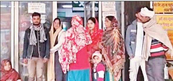
मेडिकल कालेज में मौजूद प्रसूता के परिजन।