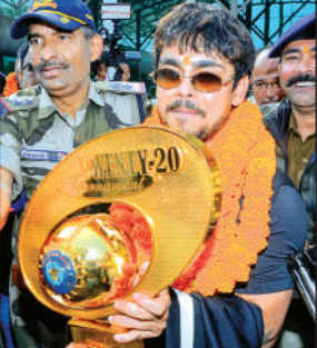
झारखंड क्रिकेट टीम के कप्तान ईशान किशन सैयद मुश्ताक अली ट्रॉफी के साथ।

किशन ने शुक्रवार को रांची हवाईअड्डे पर जोरदार स्वागत के बाद कहा बहुत अच्छा खेले, बहुत