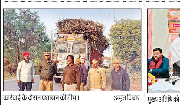
कार्रवाई के दौरान प्रशासन की टीम।

बिसवां, अमृत विचार : तहसील प्रशासन ने बड़ी कार्रवाई करते हुए ग्राम पुरेना स्थित 432 बीघा शत्रु संपत्ति को अवैध कब्जाधारकों से मुक्त कराया। करीब 10 करोड़ रुपये मूल्य की इस भूमि को कब्जामुक्त कर सरकारी अभिलेखों में सुरक्षित दर्ज किया गया है। बिसवां तहसील क्षेत्र के ग्राम पुरेना में राजस्व विभाग की टीम ने मौके पर पहुंचकर लगभग 432 बीघा भूमि को कब्जामुक्त कराया। कार्रवाई के दौरान कानूनी, लेखपाल सहित राजस्व विभाग के अधिकारी व कर्मचारी मौके पर मौजूद रहे।