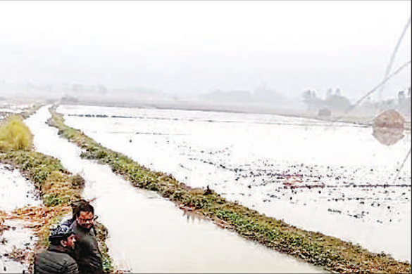
नहर की पटरी कटने से खेत में भरा पानी।

जानकारी के मुताबिक नहर का पानी खेतों में भरने से गेहूं, सरसों और अन्य रबी की फसलें पूरी तरह डूब गई हैं। प्रभावित किसानों ने बताया कि फसलें अब पकने और तैयार होने की स्थिति में थीं, लेकिन जलभराव के कारण पौधों से सड़ने का खतरा पैदा हो गया है। जल निकासी की कोई उचित व्यवस्था न होने के कारण खेतों में कई फीट पानी जमा रहा, जिससे फसलों को बचाने का कोई रास्ता नहीं बचा। शुक्रवार की सुबह जब किसान खेतों में गए तब पानी भरा हुआ