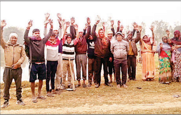
माइनर कटने से खेतों में पानी भरने पर प्रदर्शन करते आक्रोशित किसान।