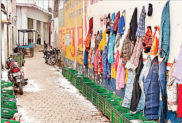
शांती नगर में दीवार पर जरूरतमंदों के लिए रखे गए गर्म कपड़े।