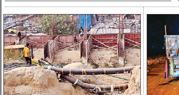
स्टेशन के पीछे खुली पड़ी सिग्नल केबल।