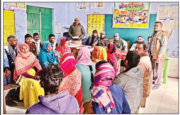
ग्रीन चौपाल में शामिल किसान व अन्य लोग।