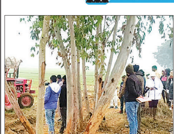
कब्जा की गयी भूमि को मुक्त कराती प्रशासनिक टीम।