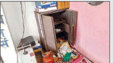
सराफा की दुकान में तोड़ा गया लॉकर।

जाती है। इस बार भी बैंती रजबहा की सफाई के नाम पर सिर्फ खिलवाड़ किया गया है। जैसीबी मशीन से सिल्ट सफाई करके सर्विस पटरी पर जगह-जगह ढेर लगा दिए गए हैं, न ही डौला बनाया गया है और न ही सिंचाई विभाग ने लगे सिल्ट के ढेरों को बराबर कराना मुनासिब समझा। रजबहा की सर्विस पटरी जहां ऊंचा खाली एवं गड्ढों में तब्दील है वहीं दूसरी पटरी पर बड़ी-बड़ी घास, झाड़ियां और मिट्टी के ढेर लगे हैं। सर्विस पटरी दर्जनों गांवों को आपस में