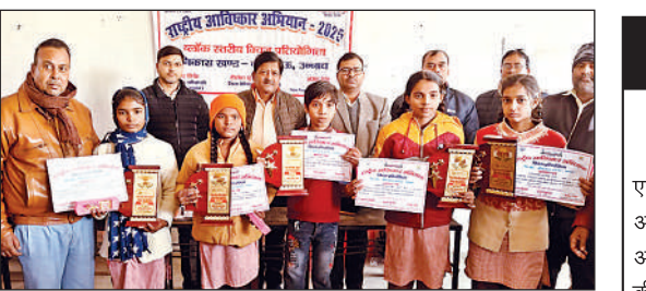
पुरस्कार व प्रमाण-पत्र के साथ मौजूद खिलाड़ी व अन्य।