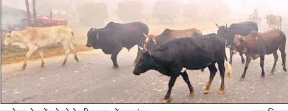
मझोला क्षेत्र में कोहरे के बीच पशुओं का झुंड।

श्रीकृष्ण की शरण में चले जाते हैं। अपने अपराध की क्षमा मांगते हैं। भगवान उसको क्षमा कर देते हैं।