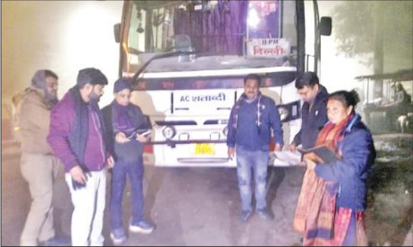
नौगावां चौराहा पर निजी बस के खिलाफ कार्रवाई करते एआरटीओ व एआरएम।