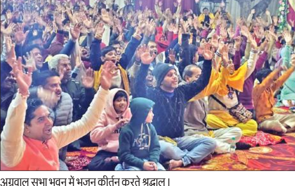
अग्रवाल सभा भवन में भजन कीर्तन करते श्रद्धालु।

लीला में दिखाया गया कि जहां श्रीकृष्ण की पूजा होनी चाहिए, वहां इंद्रदेव अपनी पूजा करा रहे हैं। कार्तिक प्रतिपदा के दिन सभी बुजवासी पूरा ब्रजमंडल इंद्रदेव की पूजा किया करते थे। यह परंपरा अनाज काल से चली आ रही थी। एक दिन की बात है, माता यशोदा गृह कार्य में लगी हुई थी। अचानक से उन्हें याद आया कार्तिक प्रतिपदा का समय निकट आ चुका है, महज