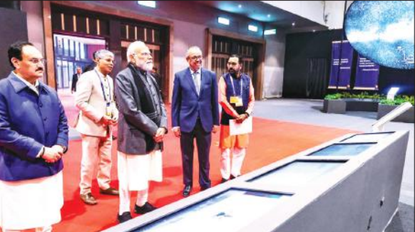
प्रदर्शनी में उपस्थित प्रधानमंत्री मोदी, डब्ल्यूएचओ के महानिदेशक टेड्रोस अधानोम व अन्य।