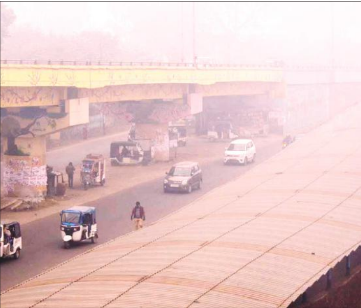
बरेली में शुक्रवार को सुबह 10.30 बजे घने कोहरे के बीच धीमी गति से रेंगते वाहन।