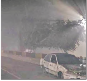
इस तरह दिखाई दिया कोहरा।

● तापमान सात डिग्री तक लुढ़का, शाम होते ही शून्य के करीब सिमत रही दृश्यता