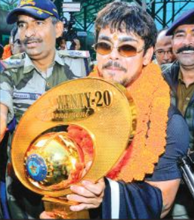
झारखंड क्रिकेट टीम के कप्तान ईशान किशन सैयद मुश्ताक अली ट्रॉफी के साथ।

किशन ने शुक्रवार को रांची हवाईअड्डे पर जोरदार स्वागत के बाद कहा बहुत अच्छा खेले, बहुत