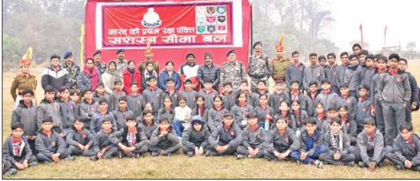
एसएसबी कैंप परिसर के भ्रमण को पहुंचे बच्चे।