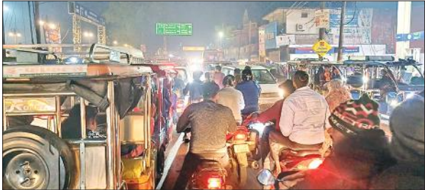
संकटा देवी के पास लगा भीषण जाम।

अमृत विचार: शहर में यातायात व्यवस्था पूरी तरह से बेपटरी हो चुकी है। मुख्य चौराहों पर भी ट्रैफिक सिपाहियों का कोई अता पता नहीं रहता है। देर शाम संकटा देवी पुलिस चौकी से लेकर रेलवे स्टेशन ओवरब्रिज तक भीषण जाम लग गया, लेकिन ट्रैफिक सिपाही नदारद रहे। चौकी पुलिस ने मौके पर पहुंच कर मोर्चा संभाला। वहीं शुक्रवार को गुरुनानक नहर के पास लगे भीषण जाम में घंटो स्कूली बच्चे फंसे रहे। शहर की यातायात व्यवस्था को सुधारने के लिए संकटा देवी चौराहा