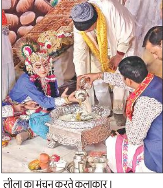
लीला का मंचन करते कलाकार।