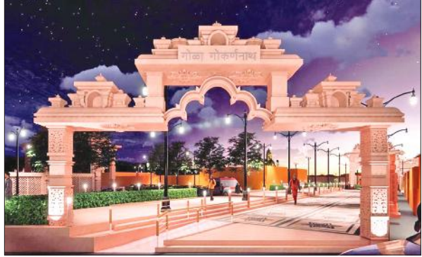
छोटी कौंशी शिव मंदिर कॉरिडोर का द्वार।

किया, जिसमें स्पष्ट हुआ कि अनुबंध के अनुसार कार्य की पूर्णता तिथि 15 मार्च 2026 है। इसके विपरीत, ठेकेदारों द्वारा प्रस्तुत वर्क प्रोग्राम में कार्य अगस्त 2026 तक पूरा करने का प्रस्ताव है, जो अनुबंध की शर्तों के अनुरूप नहीं है।