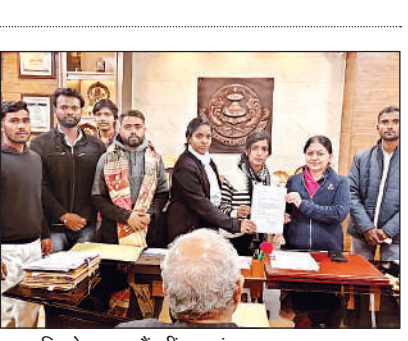
कुलपति को ज्ञापन सौंपती छात्राएं व छात्र।