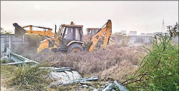
अमौसी में अवैध निर्माण ध्वस्त करीत बुलडोजर।