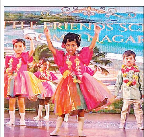
लिटिल फ्रेंड्स स्कूल के वार्षिक उत्सव में प्रस्तुति देते बच्चे।