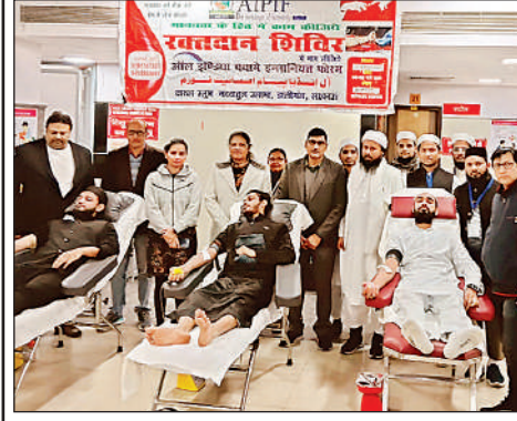
बलरामपुर अस्पताल में रक्तदान करते हुए युवा।

अमृत विचार, लखनऊ : उत्तर प्रदेश ऑटो लोडर संयुक्त कल्याण समिति ने लोडर चालकों की समस्याओं को लेकर मुख्यमंत्री को ज्ञापन सौंपने की मांग को लेकर धरना जारी रखा है। समिति के पदाधिकारियों ने बताया कि 16 दिसंबर को धरने का आह्वान किया गया था, ताकि मुख्यमंत्री को चालकों की समस्याओं से अवगत कराया जा सके। समिति के अनुसार पुलिस प्रशासन ने 17 दिसंबर को आश्वासन दिया था कि 18 दिसंबर को प्रातः 10 बजे मुख्यमंत्री से मुलाकात करारक ज्ञापन दिया जाएगा और उसके बाद धरना समाप्त कर दिया जाएगा। लेकिन 18 दिसंबर को न तो मुख्यमंत्री से मुलाकात कराई गई और न ही ज्ञापन उन्हें सौंपा जा सका। समिति का आरोप है कि उनका ज्ञापन किसी अन्य अधिकारी को दिलवाया गया, जिससे संतोषजनक उत्तर नहीं मिला।