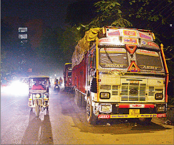
डालीबाग मुख्य मार्ग बहुखंडीय के सामने खड़ा ट्रक। ● अमृत विचार

अमृत विचार: कोहरा अब घना होने लगा है। सभी जानते हैं कि धुंध के मौसम में सड़क पर मामूली अवरोध भी हादसे का सबब बन सकता है। बावजूद इसके राजधानी के प्रमुख इलाकों में ही राजस्व वसूली कर लिए गए ट्रकों को सड़क पर खुलेआम खड़ा कर दिया गया है। एक-दो नहीं 18 ट्रक लाइन से खड़े हैं। यहां पर्याप्त रोशनी तक नहीं है। बंधे की तरफ से अगर कोई वाहन सवार तेज गति में ढाल से उतर रहा है और उससे मामूली सी चूक हो गई तो जान पर भारी पड़ सकती है। दो तस्वीरें हैं जो अफसरों के जिम्मेदारी का अहसास कराने के लिए काफी हैं। वहीं जीएसटी के जिम्मेदार कहते हैं कि खुजौली के पास जमीन देख ली गई है। खाका तैयार कर लिया गया है। इसे डेवलप करने वाली फर्मों से इस्टीमेट मांगा गया है। कुछ माह में ही व्यवस्था ठीक हो जाएगी।