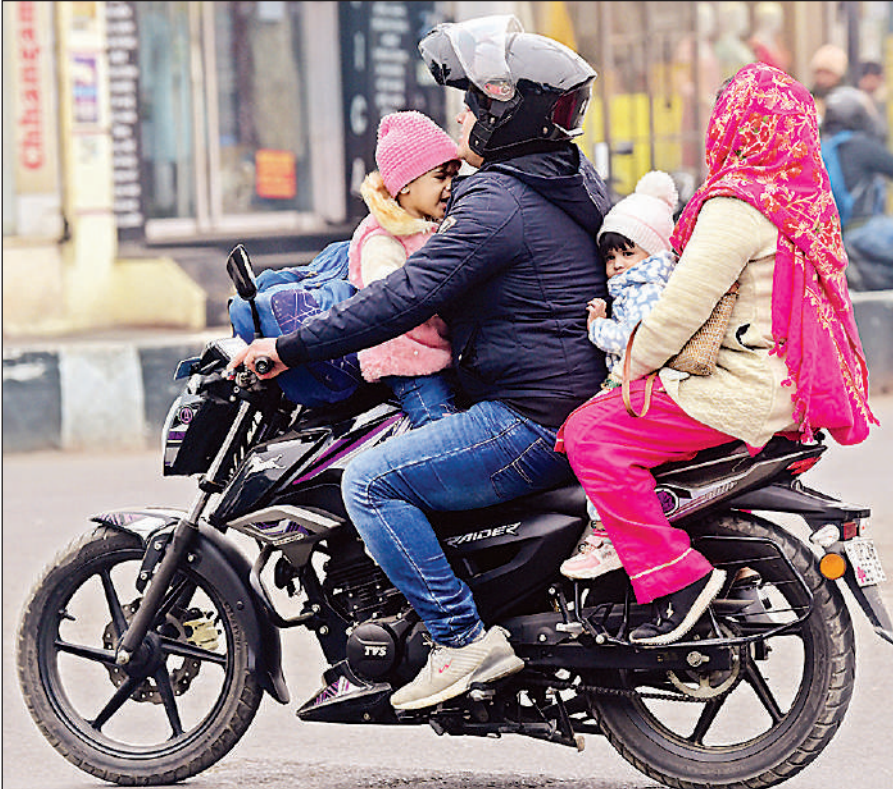
हजरतगंज में कड़ाके की ठंड के बीच मासूमों के साथ बाइक पर जाता युवक।