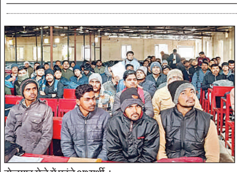
रोजगार मेले में पहुंचे अभ्यर्थी।

अमृत विचार, लखनऊ : लिटिल फ्रेंड्स स्कूल का 35वां वार्षिक उत्सव मैजिक इन द एयर का आयोजन शुक्रवार को संगीत नाटक अकादमी के संत गाडगे प्रेक्षागृह में किया गया। कार्यक्रम में विद्यालय के 260 से अधिक विद्यार्थियों ने शिक्षकों एवं स्टाफ के सहयोग से रंगारंग सांस्कृतिक प्रस्तुतियां दीं। बच्चों ने बाहुबली नाटक, मैजिक इन द एयर, मैक्सिकन गीत, जिंगल बेल डांस, कराटे प्रदर्शन और बंदे मातरम् सहित 15 से अधिक सांस्कृतिक एवं विदेशी गीतों पर आधारित नृत्य प्रस्तुतियां प्रस्तुत कर दर्शकों की भरपूर तालियां बटोरीं। कार्यक्रम में कक्षा 2, 4 और 5 के बच्चों ने नृत्य नाटिका बाहुबली का मंचन किया। इस नृत्य- नाटिका में बच्चों ने वीरता, साहस और आत्मबल को प्रभावशाली अभिनय, समर्पित नृत्य एवं आकर्षक वेशभूषा के माध्यम से जीवंत कर दिया।