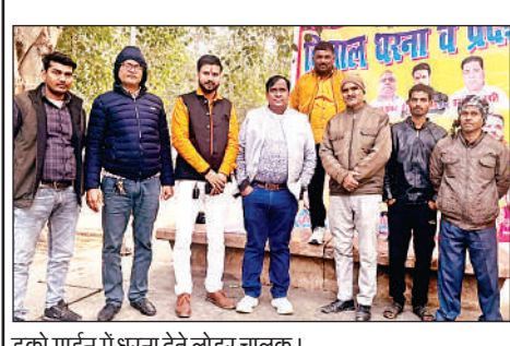
इको गार्डन में धरना देते लोडर चालक।