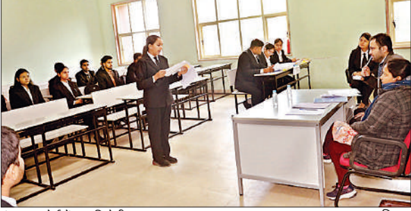
इंद्रा मूट कोर्ट में प्रस्तुति देती छात्रा।