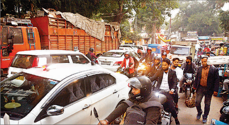
सड़क किनारे ट्रक खड़ा होने के चलते मीराबाई मार्ग स्थित नरही मोड़ तिराहे पर लगा जाम।

से डालीबाग की ओर आता है। ऐसे में कम रोशनी में सड़क पर माल लदे खड़े डेढ़ दर्जन ट्रक किसी बड़े हादसे का सबब बन सकते हैं। इसी मुख्य मार्ग पर वीआईपी नैमिषारण्य