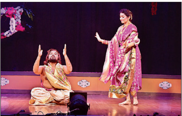
नाट्य प्रस्तुति 'मोहे पिया' का मंचन करते कलाकार।