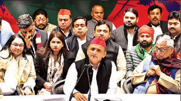
लखनऊ स्थित सपा मुख्यालय में पत्रकार वार्ता करते अखिलेश यादव।

राजधानी स्थित सपा मुख्यालय में प्रेस कॉन्फ्रेंस में उन्होंने कहा कि कफ सिरप मामले में आरोपियों और माफियाओं को मुख्यमंत्री और सरकार का संरक्षण प्राप्त है तथा सरकार कई अहम तथ्यों को छिपा