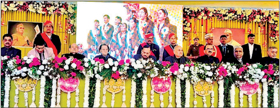
मंच पर मौजूद सीजेआई सूर्यकांत व अन्य गणमान्य लोग।

उन्होंने कहा कि हमने सुप्रीम कोर्ट में 16 भाषाओं में फैसले देने की शुरुआत कर दी है। अदालतों में इतना ज्यादा काम होता है कि साहित्य से दूरियां हो जाती हैं लेकिन हमारी ये कोशिश रहती है कि अगर मौका मिले तो साहित्यिक कार्यक्रम में शिरकत करूं। देश में भाषाओं को लेकर जो संस्थाएं काम कर रहीं है हम सबका दायित्व है कि उन संस्थाओं की मदद करें। उन्होंने कहा कि इटावा संस्कृति की राजधानी के