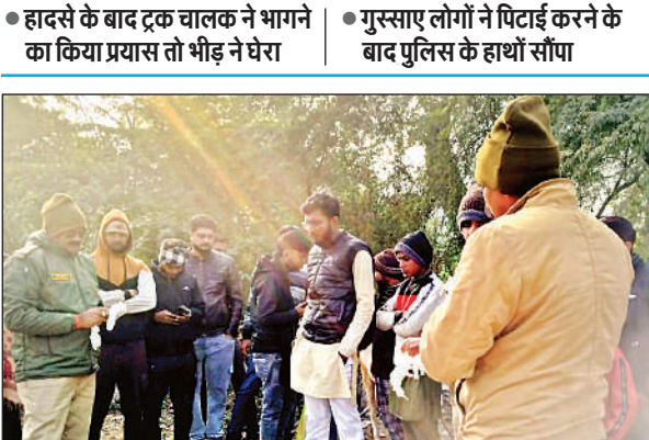
घटनास्थल पर खड़ी पुलिस और ग्रामीण।