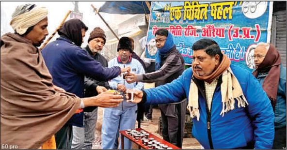
जरूरतमंदों को चाय व नमकीन बांटते संगठन के पदाधिकारी।

इसके लिए किसान खेतों में झुलसा रोग से बचाव के लिए दवाओं का प्रयोग कर रहे हैं। कल जरूर थोड़ी सी धूप निकली थी फिर उसके बाद कोहरा पूरी तरीके से छा गया था। किसान अमृत विचार। ब्लॉक भाग्यनगर के अंतर्गत ग्राम केशमपुर में पिछले तीन-चार दिन से ठंड बढ़ने के कारण कोहरा एवं पाला गिरना शुरू हो गया है। जिस कारण आलू किसानों की चिंता बढ़ गई है। आलू की फसल में झुलसा रोग का खतरा बराबर मंडरा रहा है। इसके लिए किसान खेतों में झुलसा रोग से बचाव के लिए दवाओं का प्रयोग कर रहे हैं। कल जरूर थोड़ी सी धूप निकली थी फिर उसके बाद कोहरा पूरी तरीके से छा गया था। किसान