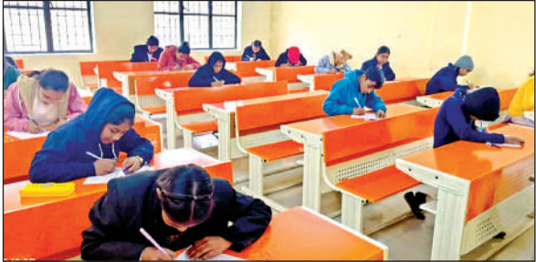
निबंध प्रतियोगिता में भाग लेते छात्र-छात्राएं।

आयोजन में 11 विद्यालयों से छात्र छात्राओं ने भाग लिया निर्णायक मंडल में श्यामलाल खंडेलवाल इंटर कॉलेज विशुनगढ़