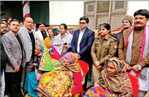
व्यापार मंडल की ओर से कंबल वितरण करते डीएम-एसपी।