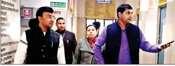
सीएचसी का निरीक्षण करती केंद्रीय टीम।