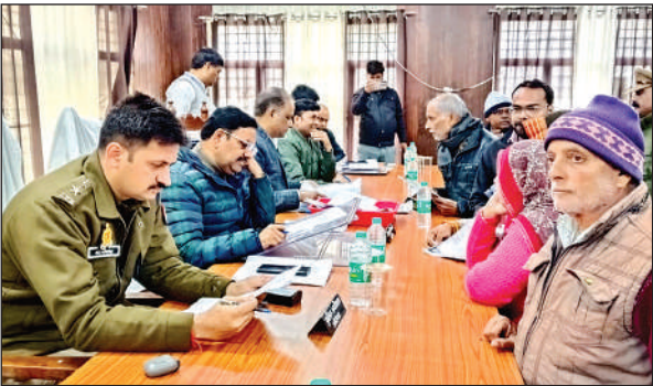
फरियारियों की शिकायतों को सुनेत डीएम वएसपी।

जिलाधिकारी व पुलिस अधीक्षक ने कहा कि दो पक्षीय विवाद होने की स्थिति में दोनों पक्षों के पक्ष व साक्ष्य संकलित करते हुए प्रकरण का निस्तारण किया जाए और यदि आवश्यकता हो तो स्थलीय भ्रमण कर मौके पर दोनों पक्षों को बुलाकर संतुष्टि पूर्ण