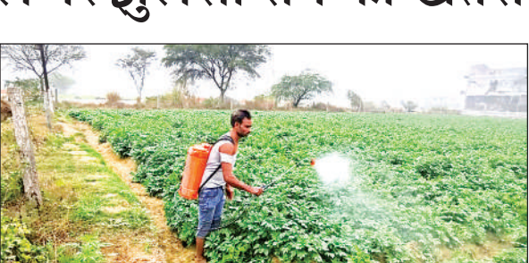
खेत में देवा का छिड़काव करता किसान।