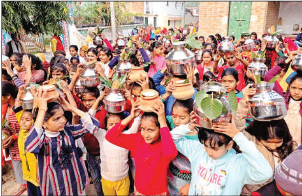
कलश यात्रा में शामिल महिलाएं, युवतियां और बच्चियां।