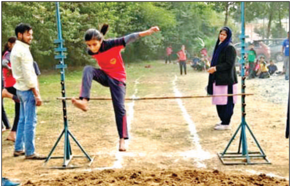
प्रतियोगिता के दौरान लॉंग जंप लगाती छात्रा।