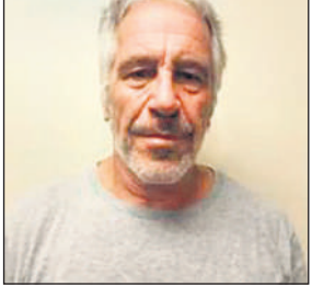
जेफरी एपस्टीन की फाइल फोटो

फाइल जारी करने का आदेश दिया गया था। यह मुद्दा राजनीतिक रूप से संवेदनशील है, और डेमोक्रेट पार्टी के नेताओं द्वारा एक व्यापक अभियान चलाया जा रहा है जिसमें दुनिया के कुछ सबसे प्रभावशाली