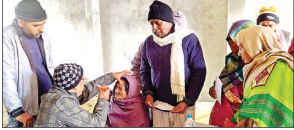
मरीजों के नेत्रों का परीक्षण करते चिकित्सक।