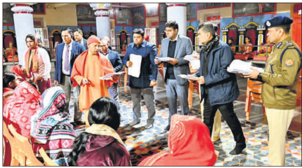
गोरखपुर में जनता दर्शन में लोगों की समस्याओं को सुनते मुख्यमंत्री योगी आदित्यनाथ।

अमृत विचार: मुख्यमंत्री योगी आदित्यनाथ ने विदेश भेजने के नाम पर लोगों से धोखाधड़ी करने वाले एजेंटों के खिलाफ सख्त कार्रवाई के निर्देश दिए हैं। उन्होंने स्पष्ट कहा कि ऐसे फर्जी एजेंटों को चिन्हित कर उनके विरुद्ध कठोर कार्रवाई की जाए और पीड़ितों से ठगी गई पूरी धनराशि हर हाल में वापस कराई जाए। मुख्यमंत्री ने यह निर्देश शनिवार सुबह कड़ाके की ठंड के बीच गोरखपुर स्थित गोरखनाथ मंदिर के महंत दिग्विजयनाथ स्मृति भवन सभागार में आयोजित जनता दर्शन के दौरान दिए।