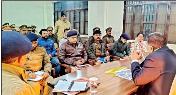
एक्सप्रेस वे की ठठिया थाना पुलिस चौकी में अधिकारियों की बैठक लेते अपर पुलिस महानिदेशक कानपुर जोन व पुलिस उप महानिरीक्षक कानपुर परिक्षेत्र कानपुर।