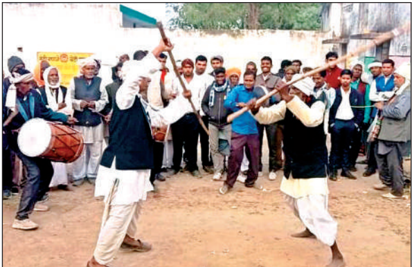
मेले के दौरान दिवारी नृत्य में बुजुर्गों ने दिखाई कलाबाजी।