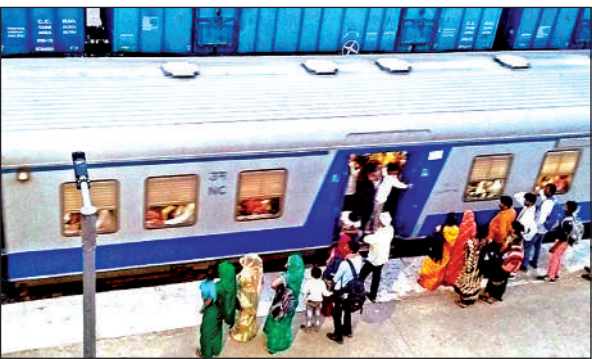
सुमेरपुर स्टेशन में देरी से आई ट्रेन पर सवार होते यात्री।