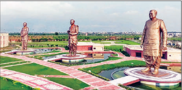
राष्ट्रीय प्रेरणा स्थल का फाइनल फोटो।

और भीड़ प्रबंधन की सभी व्यवस्थाएं उच्चतम मानकों के अनुरूप हों और किसी भी स्तर पर लापरवाही न हो। उन्होंने कहा कि समारोह में दो लाख से अधिक लोगों की उपस्थिति प्रस्तावित है,