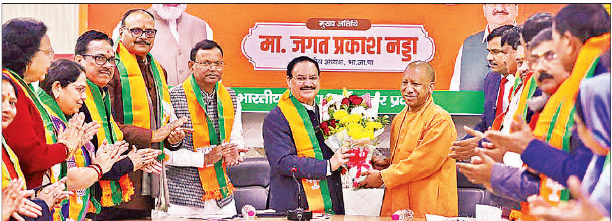
लखनऊ स्थित भाजपा प्रदेश मुख्यालय में आयोजित बैठक में केंद्रीय स्वास्थ्य मंत्री जेपी नड्डा को पुष्प गुच्छ देकर स्वागत करते मुख्यमंत्री योगी, साथ में अन्य पार्टी नेता।

जेपी नड्डा व योगी की मौजूदगी में संगठन और सरकार ने बनाया रोडमैप