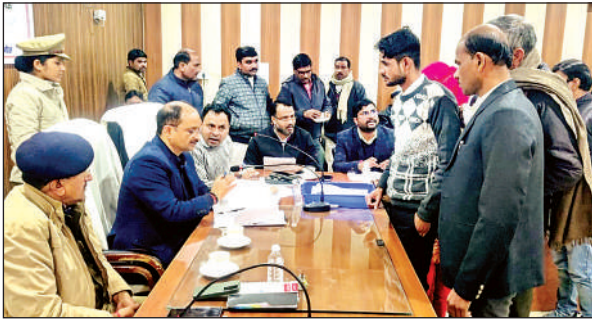
छिब्रामऊ में फरियादियों की शिकायतें सुनते डीएम व एसपी।

अधिकारियों के पास राजस्व की 138, पुलिस की 25, विकास की 06, बिजली की 11 व 18 अन्य मामलों सहित 198 शिकायतें आईं। डीएम ने भूमि विवाद से संबंधित शिकायतों पत्रों का राजस्व व पुलिस अधिकारियों को संयुक्त रूप से मौका मुआयना कर गुणवत्तापूर्ण निराकरण कराने के निर्देश दिए। साथ ही अवैध रूप से सरकारी भूमि