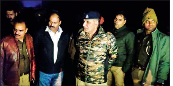
मुठभेड़ के दौरान घटनास्थल पर मौजूद पुलिस ।