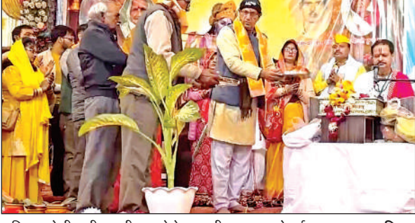
शनिवार को पीठ की आरती उतारने के साथ ही कथा शुरू हो गई।