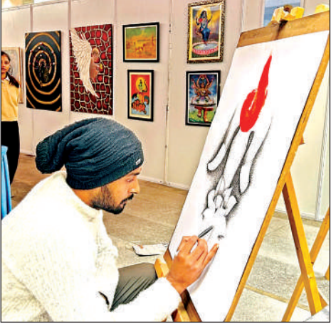
आर्ट बनाता छात्र।