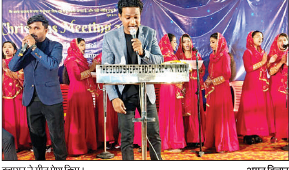
क्वायर ने गीत पेश किए।