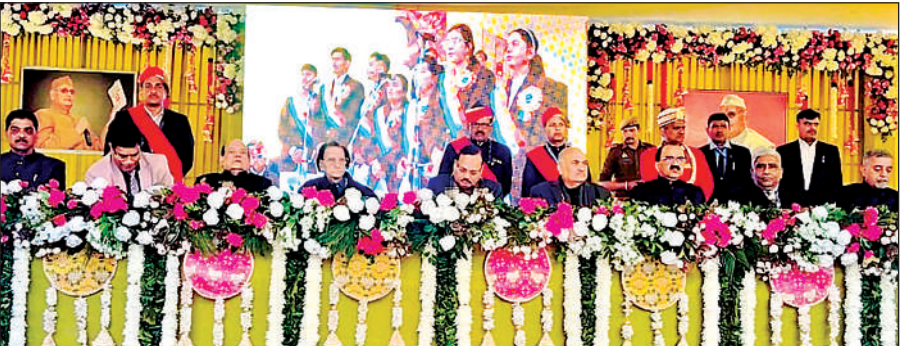
इस्लामिया कॉलेज के मंच पर मौजूद सीजेआई सूर्यकांत और गणमान्य लोग।

उन्होंने कहा कि हमने सुप्रीम कोर्ट में 16 भाषाओं में फैसले देने की शुरुआत कर दी है। अदालतों में इतना ज्यादा काम होता है कि साहित्य से दूरियां हो जाती हैं लेकिन हमारी ये कोशिश रहती है कि अगर मौका मिले तो साहित्यिक कार्यक्रम में शिरकत करूं। देश में भाषाओं को लेकर जो संस्थाएं काम कर रहीं है हम सबका दायित्व है कि उन संस्थाओं की मदद करें। उन्होंने कहा कि इटावा संस्कृति की राजधानी के