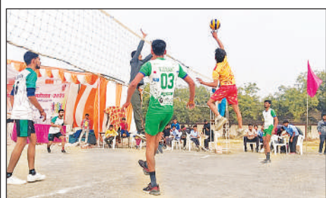
वॉलीबाल प्रतियोगिता में प्रतिभाग करते खिलाड़ी।

उन्नाव । स्पोर्ट्स सर्टेडियम में सांसद खेल महोत्सव के चौथे दिन वॉलीबाल प्रतियोगिता का आयोजन हुआ। जिसमें वॉलीबाल सब जूनियर बालक में बीघापुर ने बिछिया को हराकर जीत दर्ज की। विजयी खिलाड़ियों को अतिथियों ने प्रमाणपत्र देकर सम्मानित किया। खेल महोत्सव के तहत वॉलीबाल सब जूनियर बालक में बीघापुर व बिछिया के बीच मैच हुआ। पहले सेट में 15-10 से बीघापुर ने जीत दर्ज की। दूसरे सेट में बीघापुर 15-11 से जीत दर्ज कर विजेता बनी। जूनियर बालक में बीघापुर बनाम सदर के बीच हुआ। इसमें पहला सेट 25-22 से बीघापुर ने जीता। दूसरा सेट 25-23 से जीतकर बीघापुर विजेता बनी।