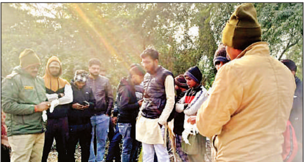
घटनास्थल पर खड़ी पुलिस और ग्रामीण।