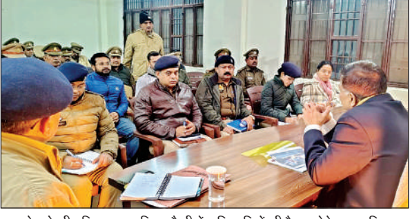
एक्सप्रेस वे की ठठिया थाना पुलिस चौकी में अधिकारियों की बैठक लेते अपर पुलिस महानिदेशक कानपुर जोन व पुलिस उप महानिरीक्षक कानपुर परिक्षेत्र कानपुर।

अपर पुलिस महानिदेशक आलोक सिंह व पुलिस उप महानिरीक्षकर हरीश चन्दर ने शुक्रवार की रात थाना ठठिया क्षेत्र के एक्सप्रेस-वे के पुलिस चौकी पर कोहरे के कारण हो रही दुर्घटनाओं और उनमें होने वाली मृत्यु को कम