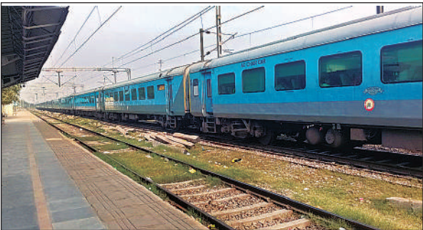
गंगाघाट स्टेशन पर खड़ी शताब्दी।

ठंड के मौसम में कोहरा व धुंध के चलते ट्रेनों की रफ्तार पर