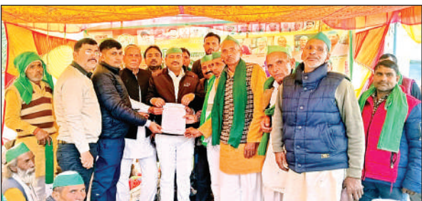
आंदोलनकारी किसानों का ज्ञापन लेते नायब तहसीलदार।