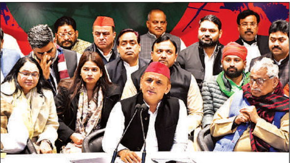
लखनऊ स्थित सपा मुख्यालय में पत्रकार वार्ता करते अखिलेश यादव।

राजधानी स्थित सपा मुख्यालय में प्रेस कॉन्फ्रेंस में उन्होंने कहा कि कफ सिरप मामले में आरोपियों और माफियाओं को मुख्यमंत्री और सरकार का संरक्षण प्राप्त है तथा सरकार कई अहम तथ्यों को छिपा