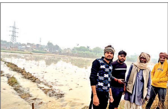
बंबा फटने से खेतों पर भरा पानी, मौके पर जुटे किसान।