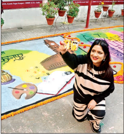
सेल्फी लेती युवती।