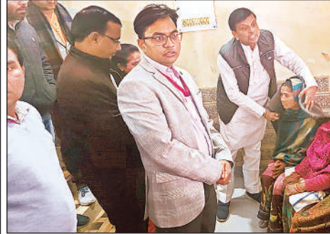
महिला को कंबल देते विधायक व एसडीएम।

उन्नाव । स्पोर्ट्स सर्टेडियम में सांसद खेल महोत्सव के चौथे दिन वॉलीबाल प्रतियोगिता का आयोजन हुआ। जिसमें वॉलीबाल सब जूनियर बालक में बीघापुर ने बिछिया को हराकर जीत दर्ज की। विजयी खिलाड़ियों को अतिथियों ने प्रमाणपत्र देकर सम्मानित किया। खेल महोत्सव के तहत वॉलीबाल सब जूनियर बालक में बीघापुर व बिछिया के बीच मैच हुआ। पहले सेट में 15-10 से बीघापुर ने जीत दर्ज की। दूसरे सेट में बीघापुर 15-11 से जीत दर्ज कर विजेता बनी। जूनियर बालक में बीघापुर बनाम सदर के बीच हुआ। इसमें पहला सेट 25-22 से बीघापुर ने जीता। दूसरा सेट 25-23 से जीतकर बीघापुर विजेता बनी।