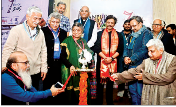
उद्घाटन करते अतिथि।

जिसमें उनके शुरुवाती दिन, सफर और संघर्ष की कहानी दर्शायी गई। दूसरे सत्र में प्रख्यात कवि नरेश सक्सेना और इसके बाद ही चर्चित अभिनेता जीशान अयूब ने फिल्मी अनुभवों को साझा किया। जीशान ने पीयूष मिश्रा के साथ फोन पर