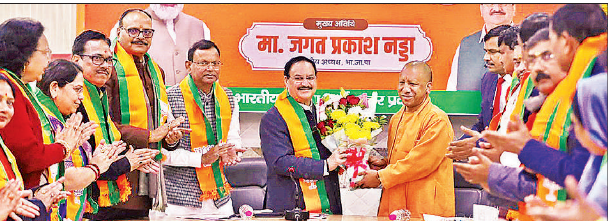
लखनऊ स्थित भाजपा प्रदेश मुख्यालय में आयोजित बैठक में केंद्रीय स्वास्थ्य मंत्री जेपी नड्डा को पुष्प गुच्छ देकर स्वागत करते मुख्यमंत्री योगी, साथ में अन्य पार्टी नेता।

जेपी नड्डा व योगी की मौजूदगी में संगठन और सरकार ने बनाया रोडमैप