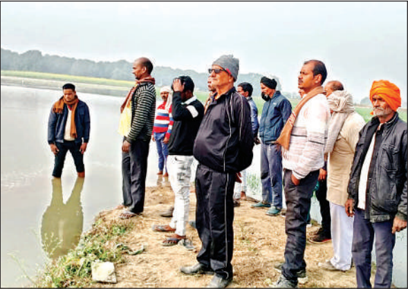
खेतों में भरे पानी को देखते ग्रामीण और अधिकारी।

रामगंगा नहर से शुक्रवार रात सिंचाई के लिए उदयपुर रजबहे में पानी छोड़ा गया था। दहेली गांव के पास रजबहे की पुलिया संकरी होने व कचरा फंस जाने से पुलिया चोक हो गई। जिसकी वजह से रजबहे के दोनों तरफ की पटरियां जल बहाव से कट गईं। इसके चलते आसपास के