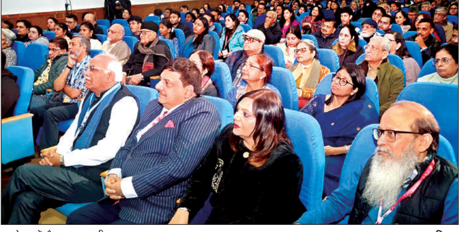
आयोजन में मौजूद शहरवासी।