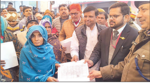
महिला को घरोनी प्रमाणपत्र देते डीएम, विधायक।