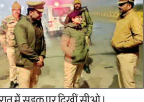
रात में सड़क पर दिखी सीओ।

सीबी ठो पुलिस और थानों के अतिरिक्त बल को सक्रिय किया गया। रात्रिकालीन गश्त और सघन चेकिंग की गई। प्रमुख चौराहों, बाजारों, संवेदनशील स्थानों, रेलवे/बस स्टैंड और अशालक्ष्य संभावित क्षेत्रों में पुलिस तैनात की गई। इस