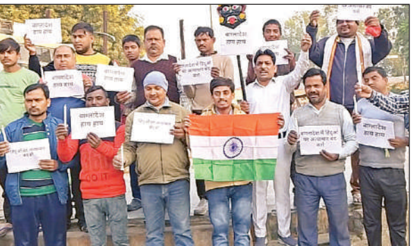
हिंदुओं पर अत्याचार को लेकर प्रदर्शन करते व्यापारी।

समझौता नहीं किया जाएगा और भविष्य में ऐसी लापरवाही मिलने पर सख्त कार्रवाई की जाएगी। अस्पताल के स्टॉक रजिस्टर व स्टॉफ की इयूटी रोस्टर की भी जांच की। मरीजों के इलाज में किसी भी प्रकार की कोताही बर्बरत नहीं की जाएगी और सभी जीवनरक्षक दवाएं अस्पताल में ही उपलब्ध होनी चाहिए।