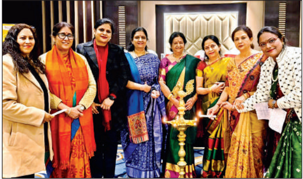
दीप प्रज्जवलन कर कार्यक्रम की शुरुआत करती स्त्री रोग विशेषज्ञ।

स्वरूप नगर स्थित होटल रॉयल क्लिनफेज समिति व कानपुर ओम्बे एंड गायनी समिति ने मोटापा एक वृहद समस्या और इसके समाधान