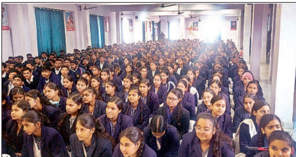
कार्यक्रम के दौरान बैठे एसवीएम के छात्र।