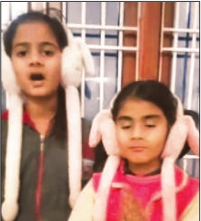
वीडियो में गुहार लगाती बच्चियां।