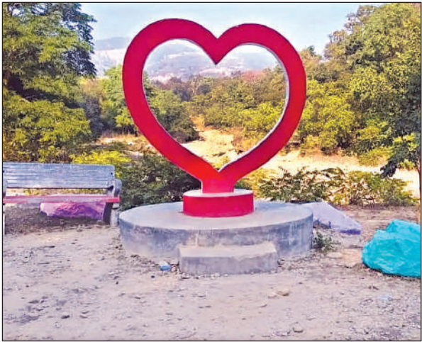
ईको फ्रेंडली पार्क में बना सेल्फी प्वाइंट।