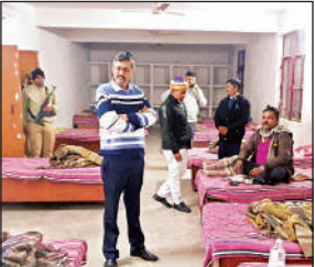
जिला अस्पताल में रैन बसेरे का जायजा लेते डीएम।

इस दौरान यहां आवासित मिले छह लोगों से डीएम ने उनके भोजन पानी आदि के बारे में जानकारी ली। साथ ही निर्देश दिया कि सर्दी एवं शीतलहर में यहां रुकने वालों को कोई दिक्कत न हो, इसका विशेष ध्यान रखा जाए। यहां अलाव की व्यवस्था भी देखा। डीएम ने निर्देश दिया कि रैन बसेरे में आने वाले परिवारों के लिए अलग व अन्य लोगों के लिए अलग ठहरने की व्यवस्था की जाए। इसके अलावा जिले में जहां पर रैन बसेरा बने हैं, उनके लिए मुख्य मार्गों पर साइन बोर्ड लगाया जाए।