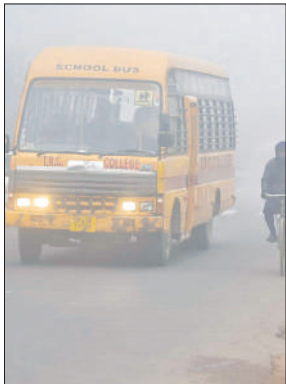
कोहरे के कारण लाइट जलाकर जाता वाहन।