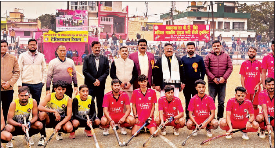
हॉकी हॉकी ग्राउंड पर मैच के दौरान हॉकी टीम के साथ अतिथिगण।