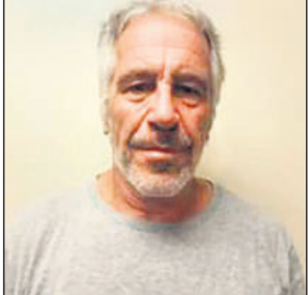
जेफरी एपस्टीन की फाइल फोटो

इससे पहले अमेरिकी राष्ट्रपति डोनाल्ड ट्रंप ने पिछले महीने एक विधेयक पर हस्ताक्षर किए थे जिसमें 30 दिन के भीतर संबंधित