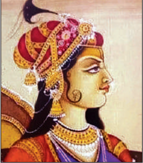
रानी ईश्वरी देवी (फाइल फोटो)।

इतिहासकारों के अनुसार रानी ईश्वरी देवी, जिन्हें तुलसीपुर की झांसी की रानी भी कहा जाता है, ने 1857 की क्रांति में अंग्रेजी हुकूमत के खिलाफ साहसिक संघर्ष किया।