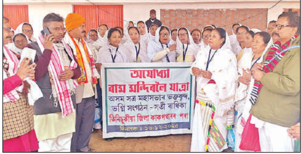
कारसेवकपुरम में मौजूद असम से आया महिलाओं का दल।