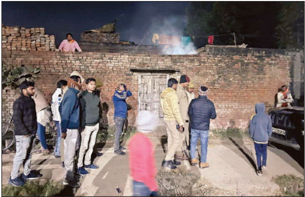
जांच करती पुलिस और जुटे ग्रामीण।