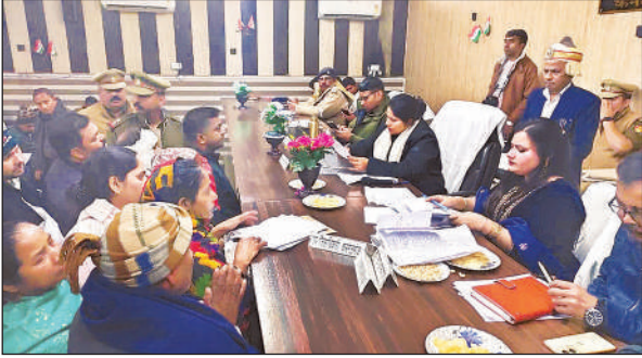
जनसुनवाई करती डीएम व एसडीएम।

करनैलगंज, अमृत विचार : तहसील परिसर में शनिवार को आयोजित तहसील समाधान दिवस में फरियादियों की भारी भीड़ उमड़ पड़ी। हालात ऐसे रहे कि सभागार के बाहर पुलिस बल तैनात करना पड़ा। धक्का-मुक्की के बीच फरियादी अपनी समस्याएं अधिकारियों तक पहुंचाते नजर आए। समाधान दिवस में सबसे अधिक शिकायतें सरकारी भूमि पर अवैध कब्जे और राशन कार्ड से नाम कटने से संबंधित रहीं। जिलाधिकारी प्रियंका निरंजन, पुलिस अधीक्षक विनीत जायसवाल और उपजिलाधिकारी नेहा मिश्रा ने स्वयं फरियादियों की समस्याएं सुनीं और संबंधित अधिकारियों को गुणवत्तापूर्ण व समयबद्ध निस्तारण के निर्देश दिए। समाधान दिवस की शुरुआत से पहले जिलाधिकारी ने तहसील