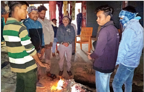
टिटुरन से राहत पाने को अलाव बना सहारा।