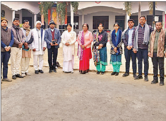
आरपीएस इंटर कॉलेज में प्रजापिता ब्रह्माकुमारी राजयोग मैडिटेशन आयोजन के दौरान मौजूद अतिथि व शिक्षक।