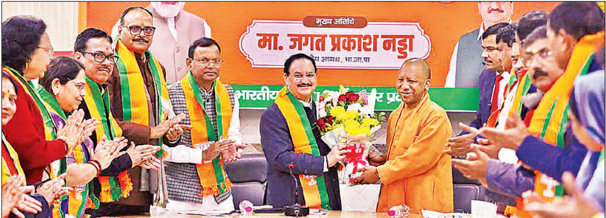
लखनऊ स्थित भाजपा प्रदेश मुख्यालय में आयोजित बैठक में केंद्रीय स्वास्थ्य मंत्री जेपी नड्डा को पुष्प गुच्छ देकर स्वागत करते मुख्यमंत्री योगी, साथ में अन्य पार्टी नेता।

जेपी नड्डा व योगी की मौजूदगी में संगठन और सरकार ने बनाया रोडमैप