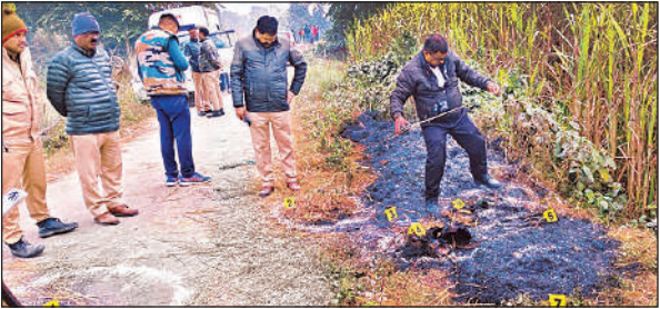
घटनास्थल की जांच करती फोरेंसिक टीम।