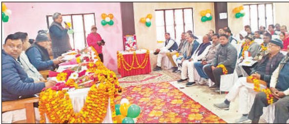
वजीरगंज ब्लॉक सभागार में बैठक करते प्रमुख व अधिकारी तथा प्रधान न सदस्य।