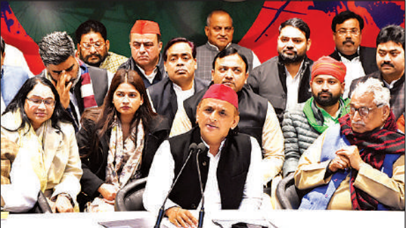
लखनऊ स्थित सपा मुख्यालय में पत्रकार वार्ता करते अखिलेश यादव।

राजधानी स्थित सपा मुख्यालय में प्रेस कॉन्फ्रेंस में उन्होंने कहा कि कफ सिरप मामले में आरोपियों और माफियाओं को मुख्यमंत्री और सरकार का संरक्षण प्राप्त है तथा सरकार कई अहम तथ्यों को छिपा