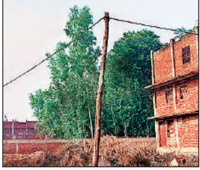
रुदौली के मवई में जर्जर बल्लियों के सहारे घरों में हो रही बिजली आपूर्ति।

अमृत विचार: विद्युत उपकेंद्र रायपुर के अन्तर्गत मवई चौराहा दुल्लापुर शाही नगर पैगम्बरनगर गांव और बीपी मवई के पास स्थित मोहल्लों व होटल-ढाबों में आज भी बिजली आपूर्ति स्थायी नहीं, बल्कि खतरनाक व्यवस्था के सहारे चल रही है। यहां विभाग ने न तो पक्के पोल लगाए और न सुरक्षित लाइन, बल्कि बांस-बल्लियों और पेड़ों पर तारों का पूरा जाल टांगकर बिजली सप्लाई छोड़ रखी है। ग्रामीणों का आरोप है कि कई बार संज्ञान में लाने के बावजूद विद्युत विभाग के लोग मुआयना कर