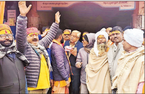
पदयात्रा में शामिल श्रद्धालु।