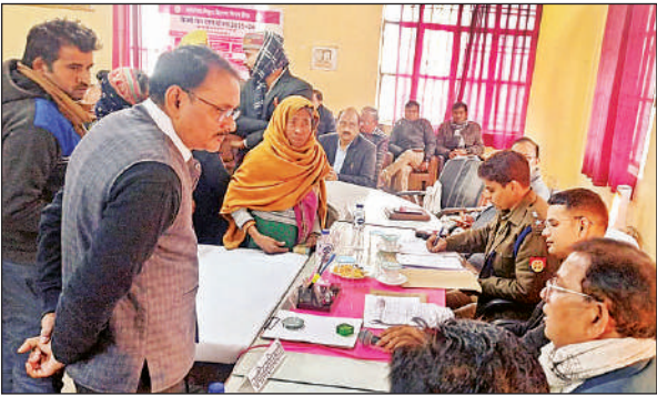
समाधान दिवस में लोगों की शिकायतें सुनते जिलाधिकारी व एसपी।