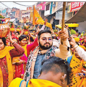
कलश यात्रा में शामिल श्रद्धालु।