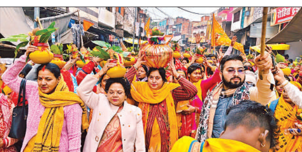
कलश यात्रा में शामिल श्रद्धालु।