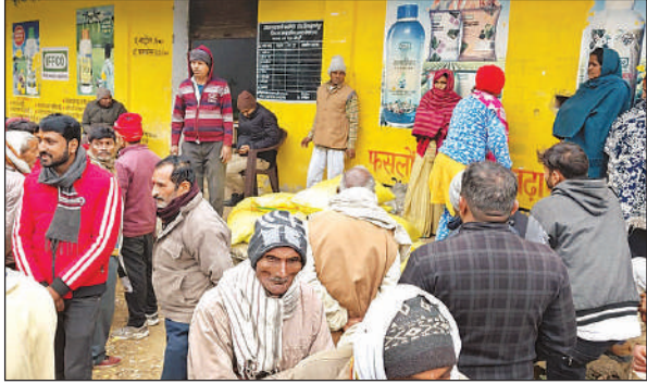
खाद लेने के लिए जुटी किसानों की भीड़।