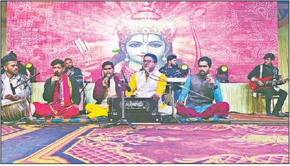
श्री अवध धाम महोत्सव में भजन प्रस्तुत करते कलाकार।