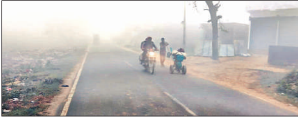
ठंड और घने कोहरे के चलते मार्ग पर लाइट जलाकर निकलते राहगीर।