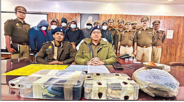
एसटीएफ बनकर जालसाजी करने वालों को पकड़ने के बाद जानकारी देते एसपी।

पर धमकाते हुए सिक्कों से भरा कलश अपने गाड़ी में रखकर चले गये। पुलिस अधीक्षक ने बताया कि मंदिर के पुजारी के तहरीर पर कोतवाली देहात में मुकदमा दर्ज किया गया था। कोतवाली देहात पुलिस ने घटना का खुलासा करते हुए 6