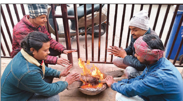
अयोध्या में आग के सहारे टंड से बचाव का प्रयास करते लोग।