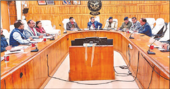
कलेक्ट्रेट में बैठक करते जिलाधिकारी अक्षय त्रिपाठी व मौजूद अन्य लोग।

हुए गरीब व पीड़ित व्यक्तियों को तत्काल न्याय दिलाएं। सीडीओ ने अधिकारियों को यह भी निर्देश दिया है कि जनसुनवाई में आने वाले सभी गरीब, जरूरतमन्द तथा असहाय लोगों की हर संभव मदद भी की जाय तथा उन्हें उनकी सभी के अनुसर योजनाओं से लाभान्वित भी किया जाए। इस