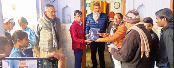
जरूरतमंद बच्चों को स्वेटर वितरित करते प्रबंध समिति के अध्यक्ष, प्रधानाचार्य व अन्य