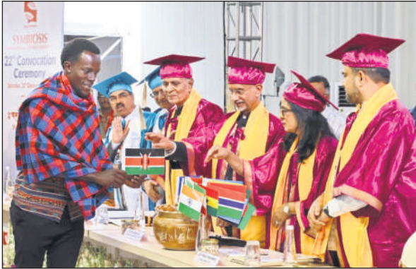
पुणे में सिम्बायोसिस इंटरनेशनल ( मानित विश्वविद्यालय ) के 22वें दीक्षांत समारोह में शामिल विदेश मंत्री एस जयशंकर।

विदेश मंत्री एस जयशंकर ने शनिवार को कहा कि आज दुनिया भारत को पहले की तुलना में कहीं अधिक सकारात्मक रूप में देखती है और देश की छवि में आया यह बदलाव एक निर्विवाद सच्चाई है। जयशंकर ने पुणे में सिम्बायोसिस इंटरनेशनल ( डीम्ड विश्वविद्यालय ) के 22वें दीक्षांत समारोह में कहा कि वैश्विक आर्थिक और राजनीतिक व्यवस्था में बड़ा बदलाव आया है। उन्होंने कहा कि शक्ति और प्रभाव के कई केंद्र उभर चुके हैं और अब कोई भी देश, चाहे वह कितना ही शक्तिशाली क्यों न हो, सभी मुद्दों पर अपनी मर्जी नहीं थोप सकता। ' जयशंकर ने कहा कि आज दुनिया हमें किस तरह से देखती है? इसका संक्षिप्त उत्तर यह है- पहले की तुलना में कहीं अधिक सकारात्मक और कहीं अधिक गंभीरता से। इसका कारण हमारा राष्ट्रीय ब्रांड और हमारी व्यक्तिगत प्रतिष्ठा दोनों हैं, जिनमें उल्लेखनीय सुधार हुआ है। विदेश मंत्री ने कहा कि आज दुनिया भारतीयों को मजबूत कार्य-नैतिकता वाले, प्रौद्योगिकी में