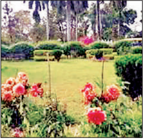
हरा भरा कंपनी गार्डन (फाइल फोटो)

अमृत विचार : सरयू के तट गुप्तार घाट पर उद्यान विभाग के कंपनी गार्डन को ईको टूरिज्म का हब बनाए जाने का प्रयास शुरू हो गया है। अब यहां शहर के लोग कृत्रिम झील का आनंद ले सकेंगे। कृत्रिम झील का निर्माण शुरू कर दिया गया है। गुप्तार घाट पहले से ही धार्मिक के साथ टूरिस्ट प्लेस हैं। यह स्थान पौराणिक हैं। सरयू तट पर ही राम जानकी का पौराणिक मंदिर है।