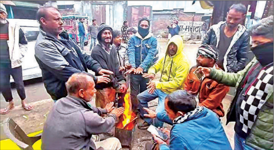
हल्द्वानी में शनिवार को कड़ाके की ठंड से बचने के लिए सड़क के किनारे अलाव सेकते लोग ।। ● अमृत विचार

हल्द्वानी समेत तराई के इलाकों में इस सीजन में पहली बार ऐसा रहा कि कोहरे की वजह से पूरे दिन धूप नहीं निकली। साथ ही कोहरे की छोटी बूँदें बरसती रही। लोग ठंड से बचने के लिए सड़क किनारे अलाव जला रहे थे वहीं, घरों में लोगों का सहारा हीटर बने। शनिवार को साप्ताहिक बंदी और ठंड की वजह से बाजार में पूरी तरह से सन्नाटा पसरा रहा। अधिकतम तापमान 14.3 डिग्री सेल्सियस रहा जो सामान्य से करीब 7.8 डिग्री कम है, साथ ही न्यूनतम तापमान 11.5 डिग्री दर्ज किया गया। उधर, तराई में शीतलहर के चलते ऊधमसिंह नगर जिले में सभी स्कूलों के संचालन के समय में परिवर्तन किया गया है। 22 दिसम्बर से अग्रिम आदेश तक प्रातः 09:30 बजे से अपराह्न 03:30 बजे के मध्य संचालित किए जाएंगे।