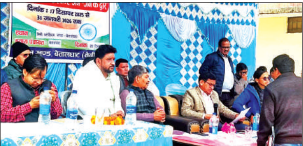
बेतालघाट विकासखंड में लगे बहुउद्देशीय शिविर में मौजूद अधिकारी एवं जनप्रतिनिधि