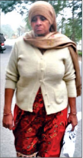
थैले में पेट्रोल की बोतल लेकर पुलिस कार्यालय जाती पीड़िता।

को ही मीडिया कर्मियों को फोन कर शनिवार की सुबह एसएसपी कार्यालय में आत्मदाह का ऐलान कर दिया। आरोप था कि स्टे होने के बाद भी पुलिस ने एकतरफा कार्रवाई की। सुसाइड की खबर मिलते ही पुलिस और एलआईयू भी अलर्ट हो गई और महिला की खोजबीन शुरू कर दी। शनिवार की दोपहर डेढ़ बजे अचानक महिला हाथ में पेट्रोल की बोतल लेकर पुलिस कार्यालय पहुंची।