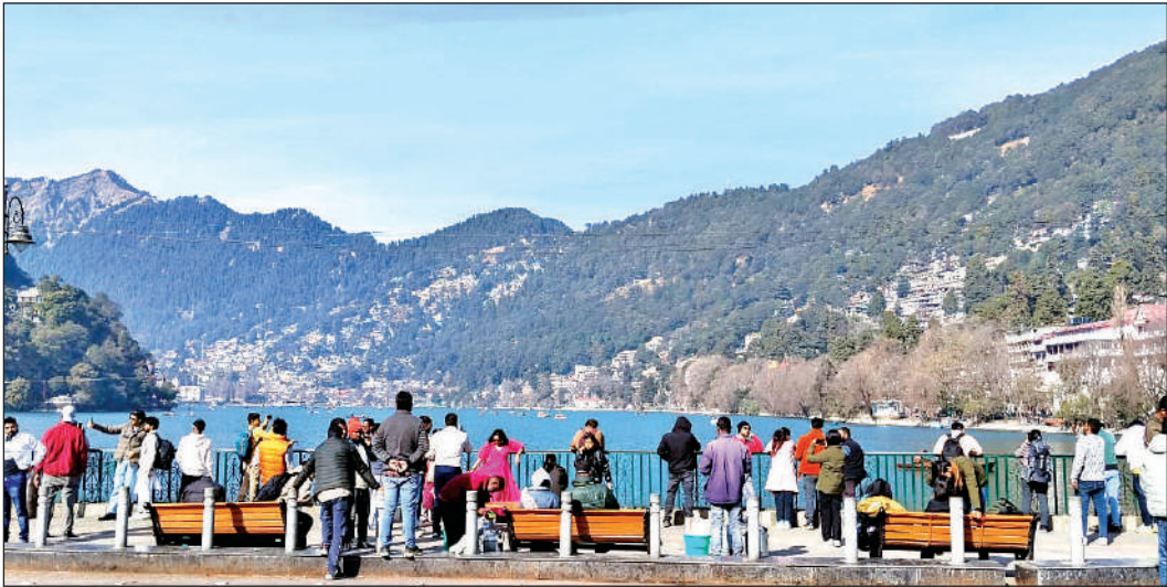
सरोवर नगरी में शनिवार को धूप खिली रही, पर्यटकों ने सुहावने मौसम के बीच नैनी झील और अन्य पर्यटन स्थलों का आनंद उठाया ।