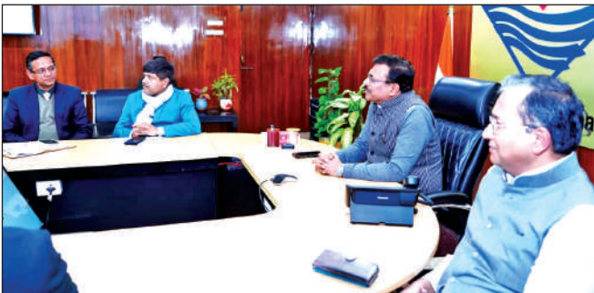
शासन के वरिष्ठ अधिकारियों के साथ समीक्षा बैठक करते मुख्य सचिव आनन्द बर्द्धन।

शनिवार को सचिवालय में देहरादून मोबिलिटी प्लान के सम्बन्ध में सम्बन्धित विभागों के साथ बैठक में सीएस ने कहा कि देहरादून शहर का यातायात संकुलन कम करने के लिए