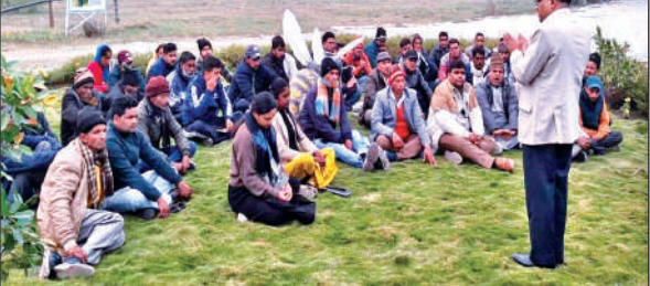
कृषकों को मौन पालन की जानकारी देते वैज्ञानिक।