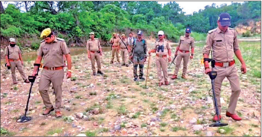
कॉर्बेट में सुरक्षा की दृष्टि से शनिवार को गश्त करते विभागीय अधिकारी और कर्मचारी।