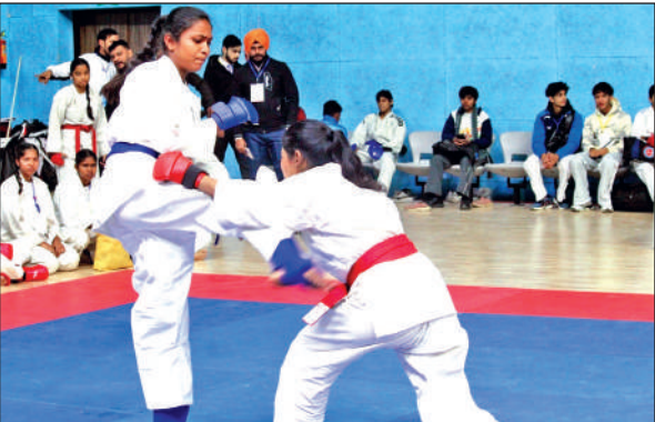
जू-जित्सु चैंपियनशिप में जीत के लिए संघर्ष करते खिलाड़ी।