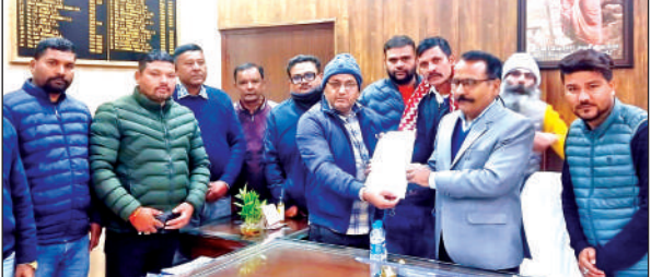
जिलाधिकारी को ज्ञापन देते जमरानी बांध क्षेत्र के प्रभावित ग्रामीण। ● अमृत विचार

अमृत विचार : जिलाधिकारी के निर्देशन पर तहसील सभागार में राजस्व प्रवर्तन समिति की बैठक हुई। उप जिलाधिकारी की अध्यक्षता में 7 भूमि विवादों की सुनवाई की गई। शनिवार को बैठक में सार्वजनिक परिसंपत्तियों पर अतिक्रमण, पैमाइश एवं सीमांकन, मेड़-विवाद, आपसी भूमि विवाद, खसरा-नक्शा त्रुटि, सरकारी भूमि पर कब्जा तथा मार्ग व जल प्रवाह से संबंधित कुल 7 भूमि संबंधी शिकायतों की विस्तार से सुनवाई की गई।प्रत्येक प्रकरण में नक्शा-खसरा अभिलेख, नपती-पैमाइश रिपोर्ट एवं मौके की वास्तविक स्थिति के आधार पर परीक्षण करते हुए संबंधित अधिकारियों को नियमों के