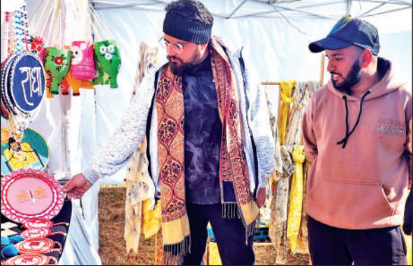
रिवर साइड रेंडेजवस में खरीददारी करते लोग।

लोक संस्कृति व कला को प्रोत्साहित करने की अनूठी पहल, मचान रिवर साइड फिएस्टा में हो रहा आयोजन