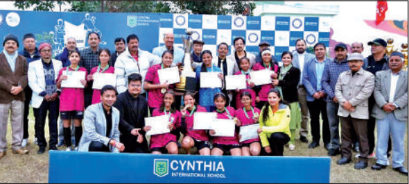
शील्ड व प्रमाण पत्र के साथ विजेता फुटबॉल टीम। ● अमृत विचार