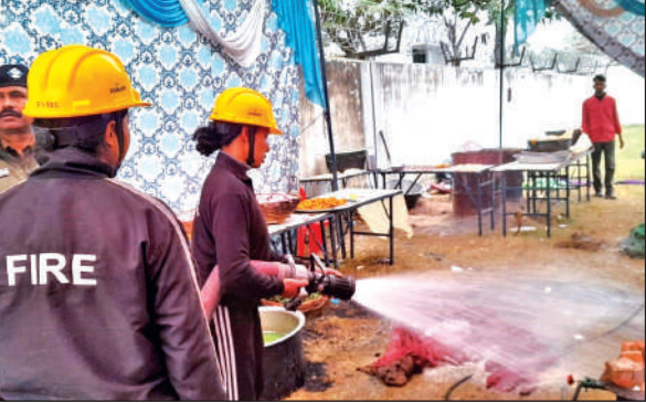
आग बुझाते दमकल कर्मी।