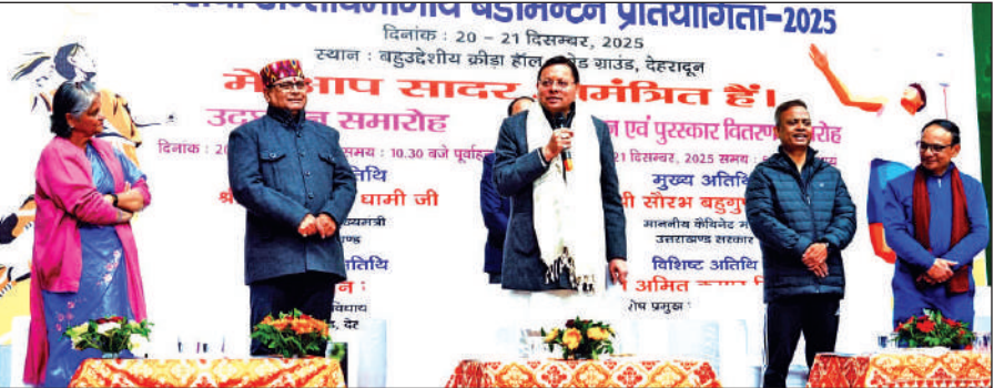
प्रतिभागियों को संबोधित करते मुख्यमंत्री पुष्कर सिंह धामी।

अमृत विचार: मुख्यमंत्री पुष्कर सिंह धामी ने कहा कि शासकीय कार्यों की व्यस्तता के बीच कार्मिकों द्वारा खेल गतिविधियों को अपनाना अत्यंत आवश्यक है क्योंकि खेल जीवन में अनुशासन लाने के साथ-साथ तनाव को दूर करता है और शरीर को स्वस्थ रखता है। मुख्यमंत्री ने शनिवार को बहुउद्देशीय क्रीड़ा हॉल, परेड ग्राउंड में उत्तराखंड सचिवालय बैडमिंटन क्लब द्वारा आयोजित 10वीं अन्तर्विभागीय बैडमिंटन प्रतियोगिता का शुभारम्भ किया। इस अवसर पर मुख्यमंत्री ने स्वयं बैडमिंटन खेलकर खिलाड़ियों का उत्साहवर्धन किया। प्रतियोगिता में राज्य के 42 विभागों के कर्मचारी एवं अधिकारी प्रतिभाग कर रहे हैं। मुख्यमंत्री ने कहा कि निरोगी रहना मनुष्य की सबसे बड़ी पूंजी है और खेल इस दिशा में सबसे प्रभावी माध्यम है। विश्वास व्यक्त किया कि अन्तर्विभागीय बैडमिंटन प्रतियोगिता भविष्य में भी अनवरत रूप से आगे