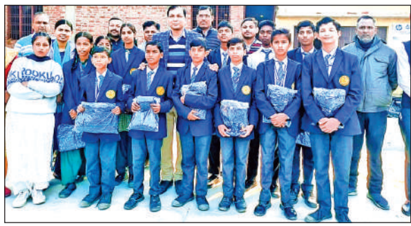
किच्छा में चयनित मेधावी विद्यार्थियों के साथ शिक्षक।