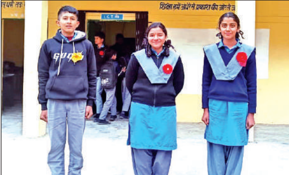
सीएम मेधावी छात्रवृत्ति हेतु चयनित जीआईसी महाकालेश्वर के विद्यार्थी।