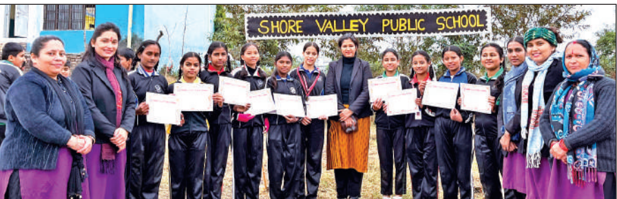
खटीमा के सोर वैली पब्लिक स्कूल में प्रमाणपत्र के साथ विजेता बच्चे और शिक्षक। ● अमृत विचार