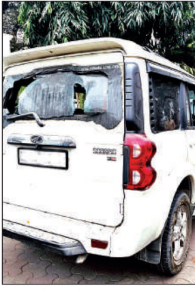
गुस्साई प्रेमिका ने पत्थर मारकर ऐसा किया स्कॉर्पियो का हाल । ● अमृत विचार

रुद्रपुर ऊधमसिंह नगर निवासी एक प्रेमी जोड़ा तकरीबन दो साल से लिब-इन रिलेशनशिप में रह रहा