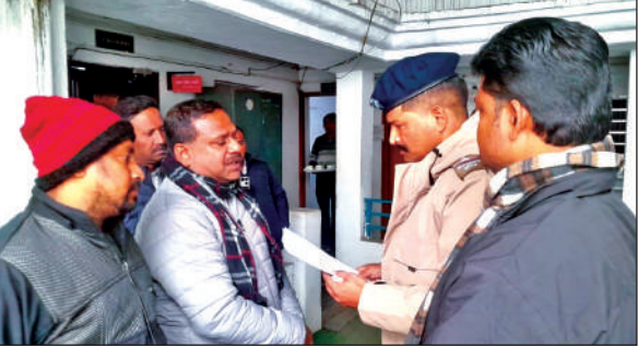
ट्रॉजिट कैप के दरोगा को ज्ञापन देते बंगाली नेता। ● अमृत विचार

अमृत विचार : थाना ट्रॉजिट कैप इलाके में दस वर्षीय नाबालिग के साथ दुष्कर्म किए जाने और परिवार को डरा धमकाकर तीन लाख में पंचायत कर मामला रफा दफा करने का मामला सामने आया है। जब इसकी भनक बंगाली समुदाय को हुई तो लोग भड़क गए। एसएसपी कार्यालय जाकर ट्रॉजिट कैप के दरोगा को शिकायती पत्र देकर कार्रवाई का मुद्दा उठाया। आगाह किया कि यदि जल्द ही पुलिस ने अभियुक्त और पंचायत करने वालों के खिलाफ कार्रवाई नहीं की तो उग्र आंदोलन होगा। शनिवार को शिकायती पत्र देते