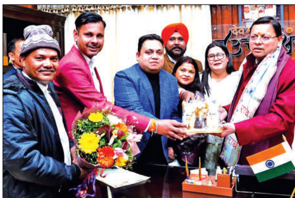
मुख्यमंत्री पुष्कर सिंह धामी से शिष्टाचार भेंट करते बाजपुर के जनप्रतिनिधि।