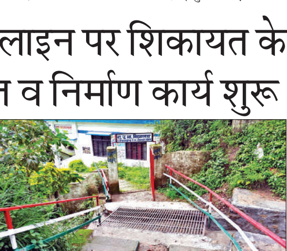
ओखलढूंगा क्षेत्र में किया जा रहा निर्माण कार्य