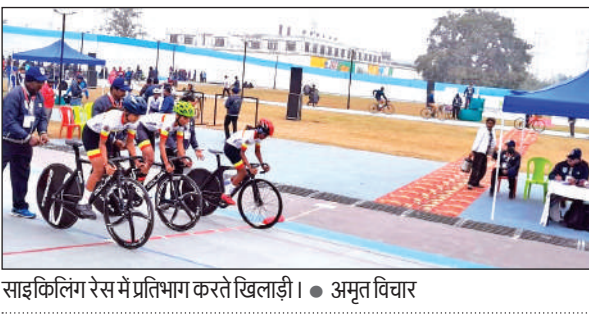
साइकिलिंग रेस में प्रतिभाग करते खिलाड़ी।

नई प्रतिमा स्थापित नहीं की गईं, तो वह सरकारी सहायता की प्रतीक्षा किए बिना स्वयं चंदा एकत्र कर प्रतिमा की स्थापना करेगा। समाज का आरोप है कि नई प्रतिमा तैयार होने के बावजूद विकास प्राधिकरण जानबूझकर स्थापना में टालमटोल