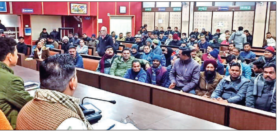
काशीपुर में नीलामी प्रक्रिया के दौरान मौजूद लोग।