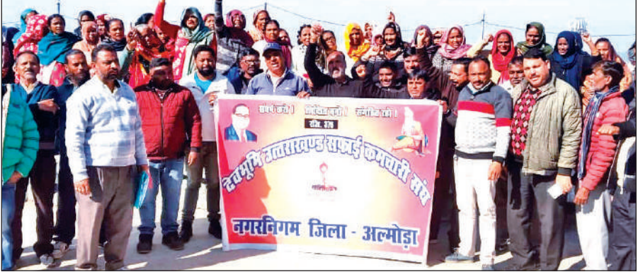
अल्मोड़ा में लंबित मांगों को लेकर पर्यावरण मित्रों ने नगर में जुलूस निकाला। ● अमृत विचार

देवभूमि सफाई कर्मचारी संघ के बैनर तले पर्यावरण मित्रों ने प्रदर्शन किया। इस दौरान