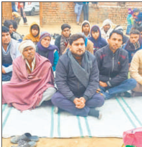
नैनो उर्वरक गोष्ठी में मौजूद किसान।