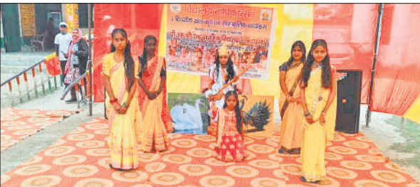
सांस्कृतिक कार्यक्रम पेश करती छात्राएं।