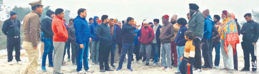
खनन पुल की जांच करती प्रशासनिक टीम।