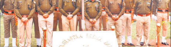
कार्यक्रम में मौजूद एसएसबी के अधिकारी और अन्य जवान।