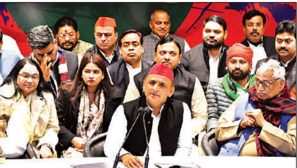
लखनऊ स्थित सपा मुख्यालय में पत्रकार वार्ता करते अखिलेश यादव।

राजधानी स्थित सपा मुख्यालय में प्रेस कॉन्फ्रेंस में उन्होंने कहा कि कफ सिरप मामले में आरोपियों और माफियाओं को मुख्यमंत्री और सरकार का संरक्षण प्राप्त है तथा सरकार कई अहम तथ्यों को छिपा