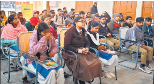
गोष्ठी में मौजूद विद्यार्थी।

कृशक समाज कॉलेज में हुई तहसील स्तरीय प्रतियोगिताओं में कई विद्यालयों के छात्र छात्राओं ने