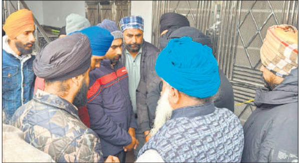
घटना के बाद मौके पर लगी भीड़।