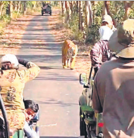
जंगल सफारी के दौरान बाघ देखते सैलानी।

बाघों की लगातार साइटिंग और सोशल मीडिया पर टाइगर साइटिंग की वायरल पोस्टों से यहां सैलानियों की संख्या में दिन प्रतिदिन बढ़ोत्तरी हो रही है। इधर क्रिसमस और नए साल पर भी सैलानियों की खासी तादाद बढ़ने का संभावना है।