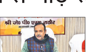
जानकारी देते मंत्री जेपीएस राठौर।

लखनऊ स्थित यूपी कोऑपरेटिव बैंक मुख्यालय में आयोजित प्रेसवार्ता में उन्होंने बताया कि 21 दिसंबर को लखनऊ के इंदिरा गांधी प्रतिष्ठान में आयोजित होने वाले इस कार्यक्रम की शुरुआत मुख्यमंत्री योगी आदित्यनाथ करेंगे। कार्यक्रम में पूर्व केंद्रीय मंत्री सुरेश प्रभु और जलशक्ति एवं सिंचाई मंत्री स्वतंत्र देव सिंह विशिष्ट अतिथि