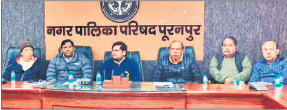
पूरनपुर नगरपालिका में बोर्ड बैठक में मौजूद चेयरमैन व अन्य।

जेल अस्पताल के निरीक्षण के दौरान बीमार बंदियों से बातचीत की गई। उनके स्वास्थ्य के बारे में जानकारी ली गई और वहां उपस्थित डॉक्टर को निर्देश दिए कि बीमार बंदियों की स्वास्थ्य सुविधाओं में किसी भी प्रकार की लापरवाही न बरती जाए।