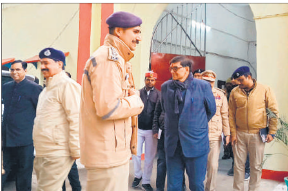
जेल का निरीक्षण करने पहुंचे अधिकारी।