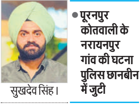
● मृतक के परिवार ने प्रेम प्रसंग के शक में हत्या बताया

जिले की चीनी मिलों में पेराई सत्र चल रहा है। जनपद में 193 क्रय केंद्रों के माध्यम से खरीद की जा रही है। पारदर्शिता पूर्ण गन्ना खरीद को लेकर जिला गन्ना अधिकारी समेत अन्य अधिकारी क्रय केंद्रों पर व्यवस्थाओं का जायजा ले रहे हैं, ताकि किसानों को कोई असुविधा न हो। इधर अब गन्ना विभाग ने गन्ने से जुड़ी समस्याओं के त्वरित निस्तारण के लिए गन्ना आयुक्त