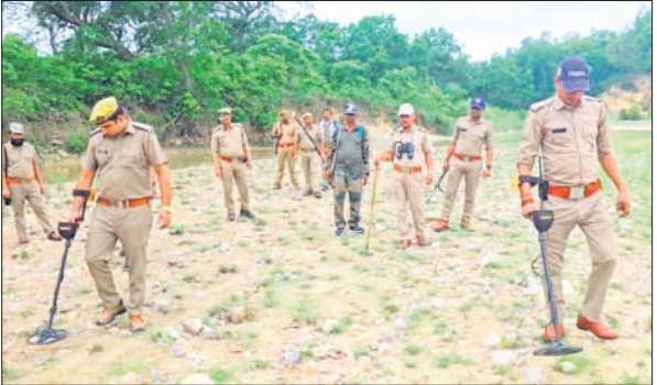
कॉर्बेट पार्क में शनिवार को गश्त करते विभागीय अधिकारी और कर्मचारी।

निदेशक ने बताया कि खासतौर पर कॉर्बेट पार्क की दक्षिणी सीमा, जो उत्तर प्रदेश से लगती है, वहां लगातार ई-सर्विलांस सिस्टम, ड्रोन कैमरों और आधुनिक उपकरणों