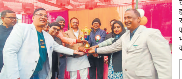
बालिका वर्ग विजेता को पुरस्कृत करते अतिथि।

मांझा से होकर बहने वाली जौराहा नदी राजस्व अभिलेखों में नाला के रूप में दर्ज है। उसमें खनन विभाग की ओर से बालू खनन का पट्टा आवंटित किया गया है। खनन कार्य के लिए ठेकेदार ने नदी पर ह्यूम पाइप डालकर एक अस्थायी पुल का निर्माण कर लिया, जिसे लेकर ग्रामीणों में रोष व्याप्त