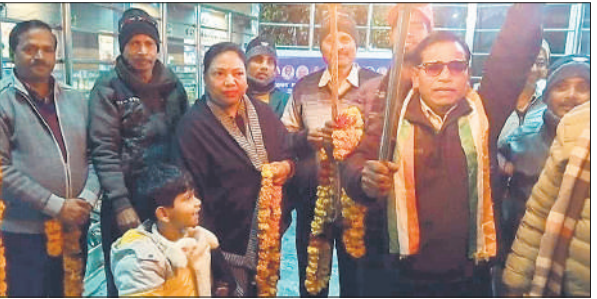
काकोरी कांड के नायकों की प्रतिमाओं पर माल्यार्पण करते कार्यकर्ता। ● अमृत विचार