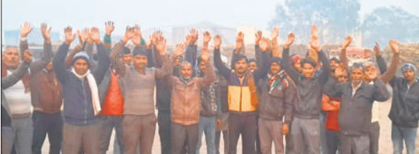
बीसलपुर चीनी मिल यार्ड में प्रदर्शन करते किसान।