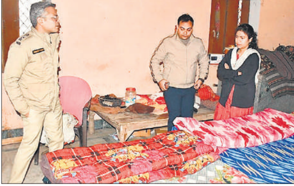
रैन बसेरा में कंबल- बिस्तर आदि की व्यवस्थाएं देखतीं डीएम और एसपी।