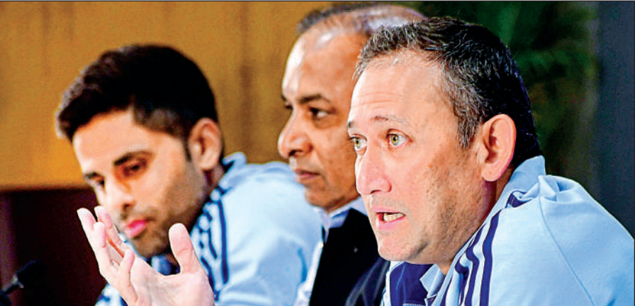
बीसीसीआई के सेक्रेटरी देवजीत सैकिया (बीच में), चयन समिति के चेयरमैन अजीत अगरकर और कप्तान सूर्यकुमार यादव।

मुंबई। भारतीय क्रिकेट टीम के मुख्य चयनकर्ता अजित अगरकर ने शनिवार को कहा कि हालिया मैचों में शुभमन गिल के रन न बना पाने और संयोजन की मजबूरियों के कारण उन्हें टी20 विश्व कप की टीम में शामिल नहीं किया गया। भारतीय टी-20 टीम के हाल ही में उपकप्तान नियुक्त किए गए गिल श्रीलंका के खिलाफ घरेलू श्रृंखला में प्रभावी प्रदर्शन नहीं कर सके। उन्होंने इस श्रृंखला में चार, शून्य और 28 रन बनाए जबकि चोट के कारण पांचवां मैच नहीं खेल पाए। अगरकर ने टीम की घोषणा के बाद संवाददाता सम्मेलन में कहा हमें पता है कि वह कितने शानदार खिलाड़ी हैं, लेकिन इस समय शायद उनके बल्ले से उतने रन नहीं निकल पा रहे हैं। उन्होंने कहा वह बदकिस्मती से पिछले विश्व कप से भी बाहर रह गए थे क्योंकि हमने अलग संयोजन के साथ खेलने का फैसला किया था। टीम चयन में संयोजन का ध्यान रखना होता है। जब आप 15 खिलाड़ियों की टीम चुनते हैं तो किसी न किसी को बाहर रहना पड़ता है और इस बार दुर्भाग्य से गिल को बाहर होना पड़ा। अगरकर ने कहा कि टीम प्रबंधन शीर्ष क्रम में एक अतिरिक्त विकेटकीपर रखना चाहता था, जिसके चलते एक बल्लेबाज की कुर्बानी देनी पड़ी।