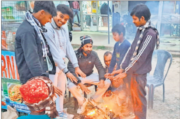
अलाव ताप कर कंपकंपी छुड़ते लोग।