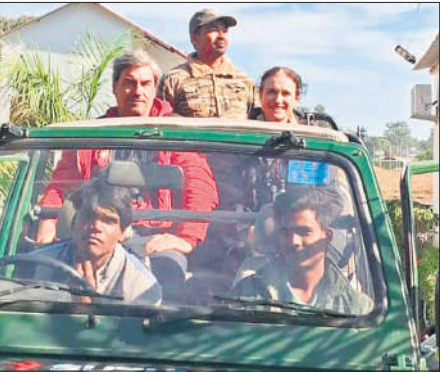
पीटीआर में जंगल सफारी के लिए जाते विदेशी सैलानी।

● क्रिसमस और नववर्ष के अवसर पर पीटीआर में सैलानियों की भीड़ बढ़ने की उम्मीद