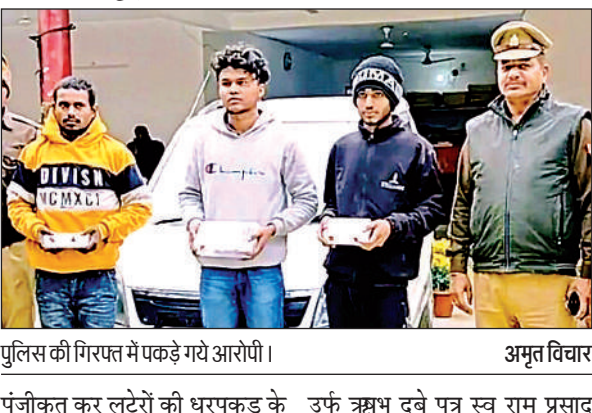
पुलिस की गिरफ्त में पकड़े गये आरोपी।

पंजीकृत कर लुटेरों की धरपकड़ के लिए टीमें गठित की थीं। रविवार सुबह मुखबिर द्वारा पुलिस को सूचना मिली कि क्षेत्र के पचौर गांव स्थित अंडरपास के नीचे एक सफेद रंग की कार खड़ी है और कार में तीन संदिग्ध लोग बैठे हैं। जिस पर पुलिस ने छापेमारी कर उक्त युवकों को पकड़ा।