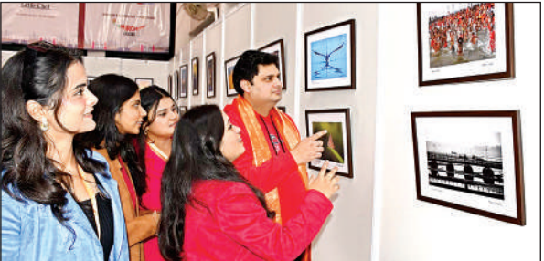
फोटो गैलरी देखते दर्शक।