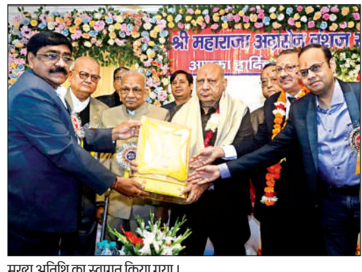
मुख्य अतिथि का स्वागत किया गया।

है। क्योंकि, लड़ाई देश के विकास को पीछे ढकेलती है। सन 1971 की लड़ाई के बाद कारगिल एक टकराव था, उसके बाद ऑपरेशन सिंदूर और छोटा हो गया। पाकिस्तान के साथ अग्रे क्या होगा यह नेशनल सिक्योरिटी गोलस और नेशनल इंटररेस्ट तय करेंगे। पाकिस्तान और भारत की लड़ाई में चीन कभी शामिल होगा, लेकिन यदि चीन के साथ भारत की लड़ाई हुई तो पाकिस्तान के शामिल होने की बड़ी संभावना है।