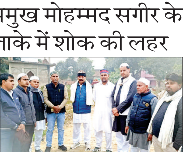
पूर्व ब्लॉक प्रमुख के इंतकाल पर पहुंचे सपा नेता।