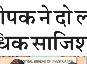
● तलाशी के बाद विवरण केंद्रीय जांच एजेंसी ने किया सार्वजनिक

दी है कि वहां महिला निर्माण श्रमिकों के लिए ‘क्रेच’ सुविधाएं उपलब्ध हैं, ऐसे में श्रम मंत्रालय से यह अनुरंसा की जाती है कि वह महिलाओं के लिए ‘क्रेच’ खोलने के सिलसिले में गैर-सरकारी संगठनों (एनजीओ) की सेवाएं लेने पर विचार करे।