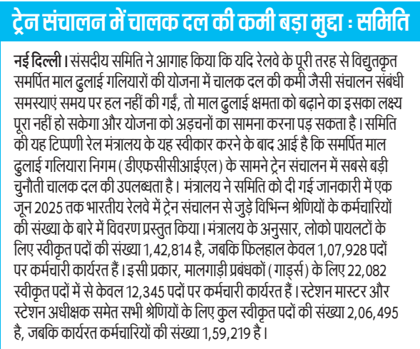
ट्रेन संचालन में चालक दल की कमी बड़ा मुद्दा : समिति

रिपोर्ट के अनुसार, भवन एवं अन्य निर्माण कर्मचारी (रोजगार नियमन एवं सेवा शर्तें) अधिनियम, 199 के तहत महिला निर्माण श्रमिकों के लिए समग्र कल्याण उपायों का प्रावधान किया गया है। इन उपायों में महिला