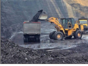
● भविष्य में वृद्धि के लिए जीवाश्म ईंधन का जिम्मेदारी से ओर संतुलित उपयोग बेहद जरूरी