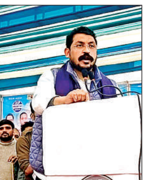
लोगों को संबोधित करते सांसद चंद्रशेखर आजाद।

घाटमपुर के पालपुर गांव में नगीना से सांसद आजाद समाज पार्टी के राष्ट्रीय अध्यक्ष चंद्रशेखर आजाद एक कार्यक्रम में पहुंचे। उनके मंच पर पहुंचते ही समर्थकों ने उनका जोरदार स्वागत किया। उन्होंने वहां पर उपस्थित जनसमूह को संबोधित करते हुए कहा कि सरकार पिछड़े और दलितों का वोट काटकर राज करना चाहती है। यूपी