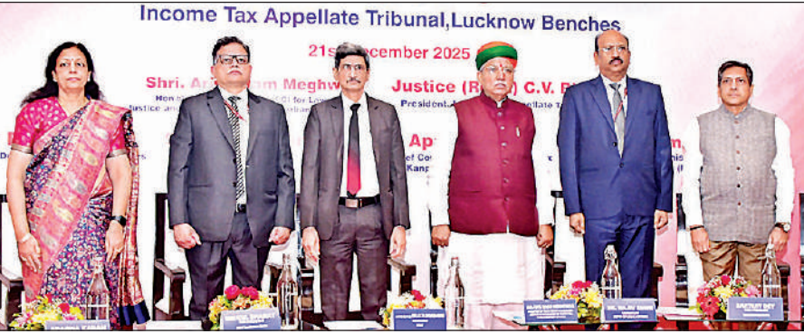
आयकर अपीलीय अधिकरण लखनऊ पीठ के रजत जयंती समारोह में उपस्थित केंद्रीय मंत्री अर्जुन राम मेघवाल व अन्य।

पीठ के रजत जयंती समारोह में संबोधित कर रहे थे। अंसल गोल्फ सिटी स्थित निजी होटल में आयोजित समारोह की अध्यक्षता करते हुए उन्होंने कहा कि इस संस्था ने तकनीकी जटिलताओं से मुक्त, कम खर्चीली और विशेषज्ञता आधारित न्यायिक प्रक्रिया ने लोकतंत्र में न्याय तक पहुंच को सरल बनाया है। केन्द्रीय विधि कार्य विभाग के सचिव डॉ. राजीव मणि और प्रधान मुख्य आयकर आयुक्त, कानपुर अपर्णा करण ने भी अधिकरण की न्यायिक भूमिका और योगदान की प्रशंसा की। कार्यक्रम में बताया गया कि आयकर अपीलीय अधिकरण