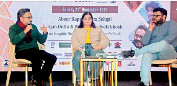
संवाद में हुए संवाद-जवाब।