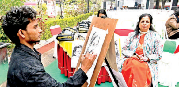
चित्र बनाता कलाकार।