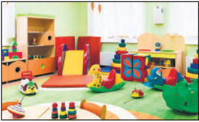
● असंगठित क्षेत्र में महिलाओं की सुरक्षा और संरक्षण शीर्षक वाली रिपोर्ट संसद में समिति ने की पेश

असंगठित क्षेत्र में महिलाओं की सुरक्षा और संरक्षण शीर्षक वाली संसद में पेश की गई रिपोर्ट में महिला सुरक्षीकरण से जुड़ी संसदीय समिति ने यह अनुरंसा भी की है कि क्रेच की कार्य समयवधि को महिलाओं के कामकाजी समय (आठ घंटे) के अनुरूप बढ़ाया जाए, ताकि काम के साथ-साथ बच्चों की देखभाल भी हो सके। संसदीय समिति की अध्यक्ष