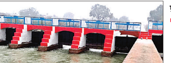
नहर में बनाया जाता पिकनिक स्पॉट।