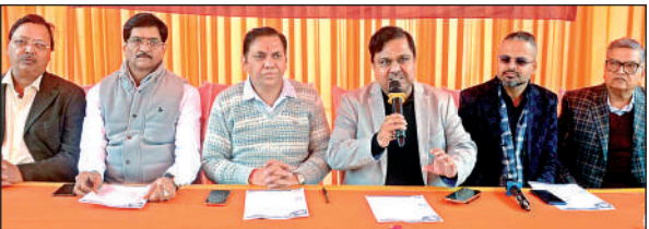
जानकारी देते आयोजक।