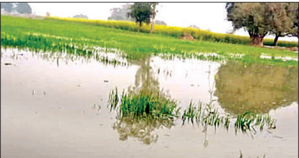
बंबी फटने के बाद खेतों में भरा पानी।