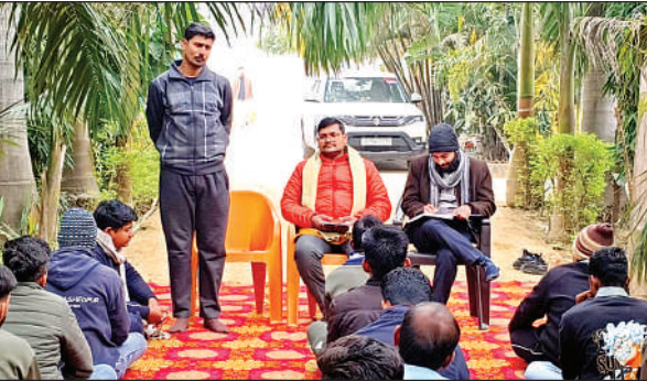
स्वयं सेवकों को संबोधित करते आरएसएस के पदाधिकारी।