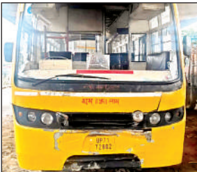
दुर्घटना करनेवाली बस।