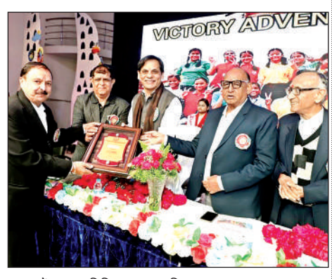
स्कूल में मुख्य अतिथि का स्वागत किया गया।