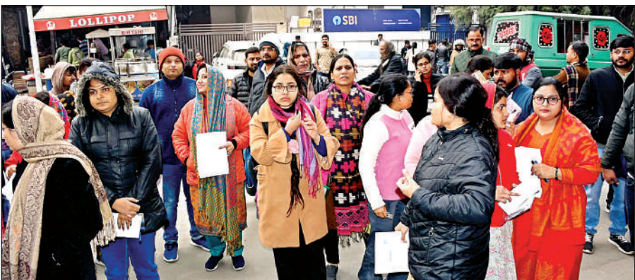
गुरुनानक स्कूल में परीक्षा देने जाती परीक्षार्थियों की भीड़।

कानपुर। सनातन धर्म में नारी को आदि शक्ति और सृष्टि की जन्मी माना गया है, जो सृजन, पोषण और पालन की अद्भुत शक्ति है। रित्त्राय समाज, परिवार और राष्ट्र के निर्माण का आधार है और जिसकी उन्नति में ही राष्ट्र की उन्नति निहित है। नारी ही परिवार की नींव है। नारी शक्ति का सम्मान सनातन संस्कृति, सामाजिक संरचना और परिवार की नींव है, उनके बिना सृष्टि की कल्पना भी असंभव है। यह बातें रविवार को वृन्दावन धर्माथ सेवा ट्रस्ट के संस्थापक चंद्रेश जी महाराज चंद्रदास ने कहीं। किवंदई नगर वाई ब्लाक स्थित एक आवास पर रविवार को वृन्दावन धर्माथ सेवा ट्रस्ट ने नारियों को सम्मानित किया।