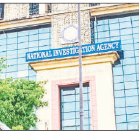
● एनआईए ने कहा- पीएफआई अपने सदस्यों को देना चाहता था हथियारों का प्रशिक्षण