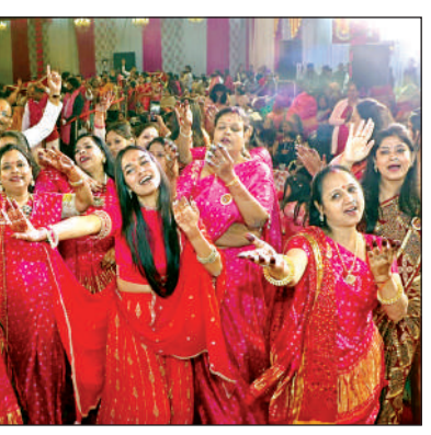
दादी मां के भजन गाती युवतियां।