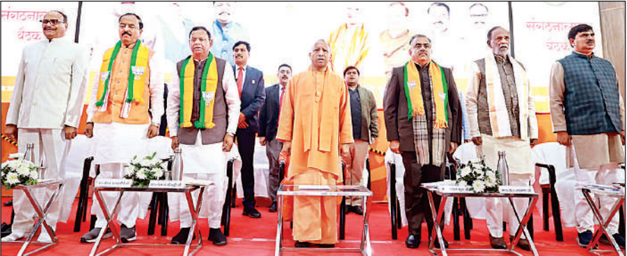
लखनऊ : भाजपा की संगठनात्मक कार्यशाला बैठक में मौजूद मुख्यमंत्री योगी आदित्यनाथ, साथ में अन्य पार्टी नेता।

अमृत विचार: मुख्यमंत्री योगी आदित्यनाथ ने मतदाता सूची के विशेष गहन पुनरीक्षण (एसआईआर) को लेकर रविवार को पार्टी संगठन और जनप्रतिनिधियों की कार्यशाला में सख्त संदेश दिए। उन्होंने स्पष्ट कहा कि जिन विधानसभा क्षेत्रों में मतदाताओं के नाम कटे या बड़ी संख्या में शिफ्टेड, मृत अथवा फर्जी नाम पाए गए, उसकी सीधी जिम्मेदारी स्थानीय संगठन और कार्यकर्ताओं की होगी। मुख्यमंत्री ने कहा कि यह केवल एक चुनावी प्रक्रिया नहीं, बल्कि आने वाले 20 वर्षों की राजनीति को प्रभावित करने वाला कार्य है। योगी ने चार दिन में पूरी ताकत से काम करने के निर्देश दिए। मुख्यमंत्री योगी भाजपा की एसआईआर को लेकर इंदिरा गांधी