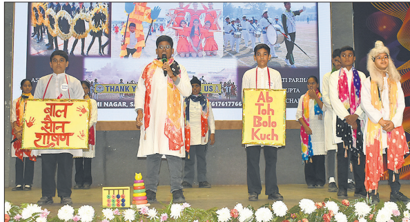
किशोर स्वास्थ्य शिक्षा कार्यक्रम में नुवकड़ नाटक प्रस्तुत करते स्कूली बच्चे।