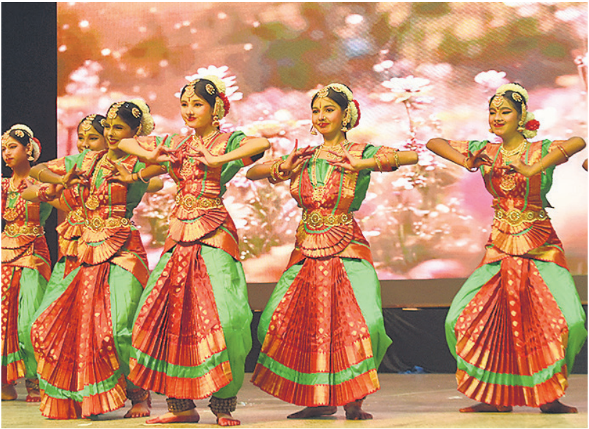
सेंट अल्फॉन्सस चर्च में दो दिवसीय क्रिसमस मेले में सांस्कृतिक कार्यक्रम प्रस्तुत करते बच्चे।