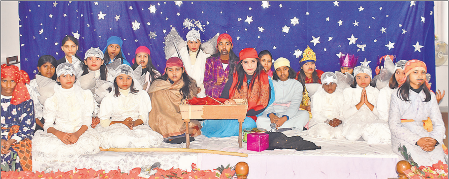
क्राइस्ट मेथोडिस्ट चर्च में क्रिसमस उत्सव में कार्यक्रम प्रस्तुत करते बच्चे।