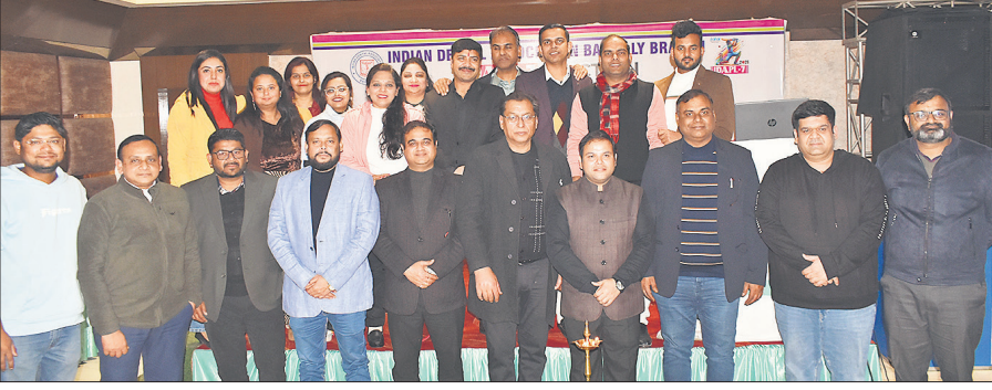
क्रिकेट प्रीमियर लीग को लेकर खिलाड़ियों की नीलामी प्रक्रिया के दौरान मौजूद पदाधिकारी।