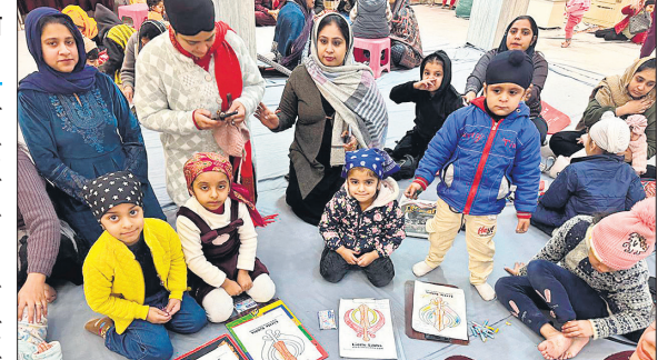
ड्राइंग प्रतियोगिता में बच्चों ने उत्साह के साथ भाग लिया।

प्रभात फेरी का समापन 10 बजे गुरुद्वारा साहिब पर हुआ। दोपहर में माता भाग कौर समूह की ओर से साहिबजादों की याद में एक साका सरहिंद एवं साका चमकौर साहिब से संबंधित ड्राइंग प्रतियोगिता का आयोजन हुआ। जिसमें 225 प्रतिभागियों ने भाग लिया। रात्रि के विशेष कीर्तन दरबार में पटियाला