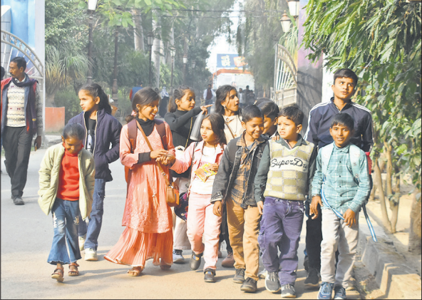
धूप खिलने पर गांधी उद्यान में घूमते बच्चे।

मौसम विभाग की वेबसाइट अनुसार जिले का न्यूनतम तापमान सामान्य से 4.1 डिग्री सेल्सियस कम 5.1 डिग्री सेल्सियस रहा। यह 24 घंटे में 5 डिग्री सेल्सियस तक गिर