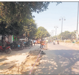
मरम्मत के लिए खोदी गई सड़क।

नगर निगम के जलकल विभाग की बियावानी कोठी से ईसाइयों की पुलिया की ओर से जाने वाली सीवर लाइन बीते दिनों लोक हो गई थी। स्थानीय लोगों की शिकायत पर जलकल विभाग ने सीवर लाइन की मरम्मत तो कर दी लेकिन सड़क को खोदकर ऐसे ही छोड़ दिया। इससे सड़क लगातार धंस रही है जो हादसे का खतब बन सकती है। इस सड़क का निर्माण स्मार्ट सिटी परियोजना