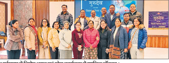
आईएमए में विशेष ध्यान एवं योग कार्यक्रम में शामिल डॉक्टर।