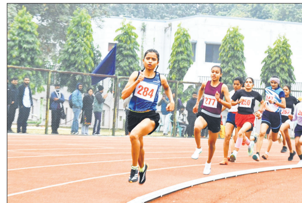
अंतर महाविद्यालयीय एथलेटिक्स प्रतियोगिता में दौड़ में भाग लेती प्रतिभागी।