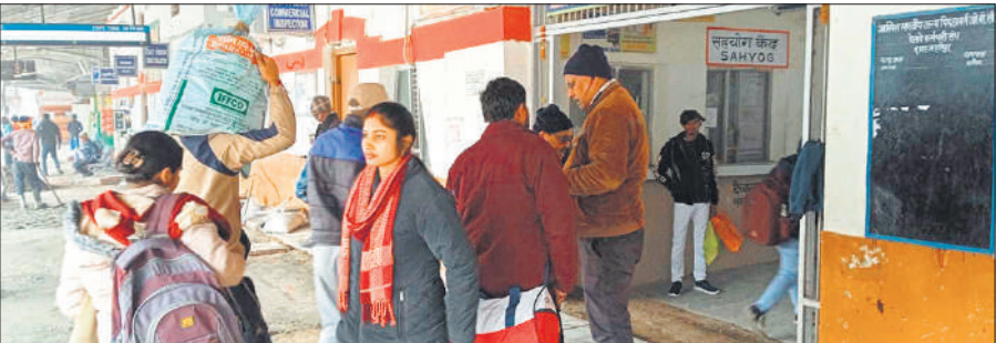
स्टेशन पर चेकिंग करता टीटीई स्टाफ।