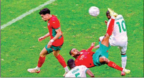
बाइसाइकिल किक लगाता मोरक्को का खिलाड़ी।

अयूब अल काबी के शानदार बाइसाइकिल किक से किये गोल की मदद से मोरक्को ने 35वें 'अफ्रीका कप ऑफ नेशंस' में अपने अभियान का आगाज रविवार को यहां कोमोरोस पर 2-0 की जीत के साथ किया। इस मैच के दौरान मोरक्को के युवराज (क्राउन प्रिंस) मौले हसन भी मौजूद थे। हसन ने मैच शुरू होने से पहले दोनों देशों के खिलाड़ियों से मुलाकात भी की। विश्व रैंकिंग में 108वें कोमोरोस ने टूर्नामेंट में जीत के प्रबल दावेदारों में से एक रैंकिंग में 11वें स्थान पर काबिज टीम को कड़ी टक्कर दी। कोमोरोस के गोलकीपर यानिक पंडो ने सोफियान रहमी के शुरुआती पेनल्टी शॉट को भी बचा लिया। ब्राह्मि डियाज ने हालांकि