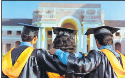
(42,997) का स्थान रहा।

उच्च शिक्षा के लिए भारतीय छात्र सबसे ज्यादा कनाडा, अमेरिका, ब्रिटेन, ऑस्ट्रेलिया और जर्मनी जाते हैं। नीति आयोग की सोमवार को जारी एक रिपोर्ट में यह जानकारी दी। भारत में उच्च शिक्षा का अंतर्राष्ट्रीयकरण शीर्षक से जारी रिपोर्ट में कहा गया है कि 2024 में, कनाडा 4,27,000 भारतीय छात्रों के साथ शीर्ष अंतर्राष्ट्रीय उच्च शिक्षा गंतव्य बना। इसके बाद अमेरिका (3,37,630), ब्रिटेन (1,85,000) ऑस्ट्रेलिया (1,22,202) और जर्मनी