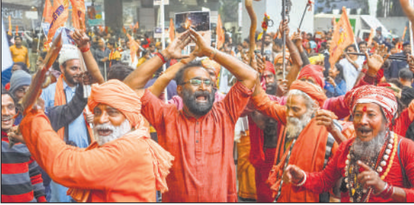
कोलकाता में बांग्लादेश के उप उच्चायोग के पास प्रदर्शन करते भाजपा कार्यकर्ता।