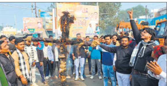
पुतला फूंकते कार्यकर्ता।

पुर्वांचल, अमृत विचार : बांग्लादेश में अल्पसंख्यक हिंदुओं पर हो रहे कथित हमलों और हत्याओं को लेकर आक्रोश व्यक्त करते हुए हिंदू युवा संगठन उत्तर प्रदेश (अ) के प्रेक्षीय आवाहन पर सोमवार को कार्यकर्ताओं ने नगर में प्रदर्शन किया। कार्यकर्ताओं ने बांग्लादेश के प्रधानमंत्री के पुतले की अर्धो निकालकर राजीव चौक पर पहुंचकर उसे फूँका और जमकर नारेबाजी की। प्रदर्शन के दौरान संगठन के पदाधिकारियों ने कहा कि बांग्लादेश में आए दिन अल्पसंख्यक हिंदुओं पर हमले और उनकी हत्याओं की घटनाएं सामने आ रही हैं, जो गंभीर चिंता का विषय हैं। उन्होंने भारत सरकार से मांग की कि वह बांग्लादेश सरकार से इस मुद्दे पर बातें कर वहां रह रहे हिंदुओं की सुरक्षा सुनिश्चित