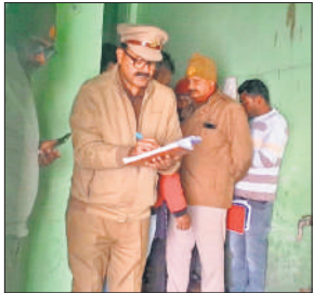
मृतक के घर जांच करती पुलिस।

जानकारी के अनुसार सैदनगली मनोटा मार्ग पर ज्ञानपुर और