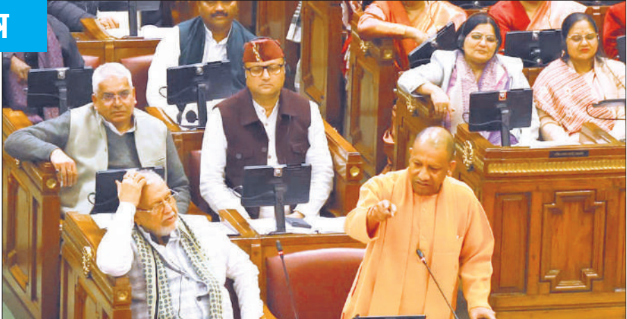
विधानसभा में बोलते मुख्यमंत्री योगी साथ में वित्त मंत्री सुरेश खन्ना ।

अमृत विचार : मुख्यमंत्री योगी आदित्यनाथ ने सोमवार को विधानसभा में कोडीनयुक्त कफ सिरप प्रकरण पर समाजवादी पार्टी को घेरते हुए आक्रामक रुख अपनाया। उन्होंने स्पष्ट कहा कि सरकार इस मामले में जीरो टॉलरेंस की नीति पर काम कर रही है और समय आने पर बुलडोजर कार्रवाई होगी, तब चिल्लाइएगा नहीं। मुख्यमंत्री ने सदन में आरोपियों के सपा से जुड़े होने के सबूत पेश करते हुए कहा कि अवैध डायवर्जन के इस नेटवर्क में कई चेहरे सीधे समाजवादी पार्टी (सपा) से जुड़े पाए गए हैं। उन्होंने कहा कि कोई भी बच नहीं जाएगा। मैं सपा की छटपटाहट समझ सकता हूं। जब सपा से जुड़े आरोपियों पर कार्रवाई होगी, तो वे लोग ही सबसे पहले फातिहा पढ़ने जाएंगे। लेकिन मैं उनको फातिहा पढ़ने लायक भी नहीं छोड़ूंगा। विपक्ष पर भ्रामक सूचना फैलाने का आरोप