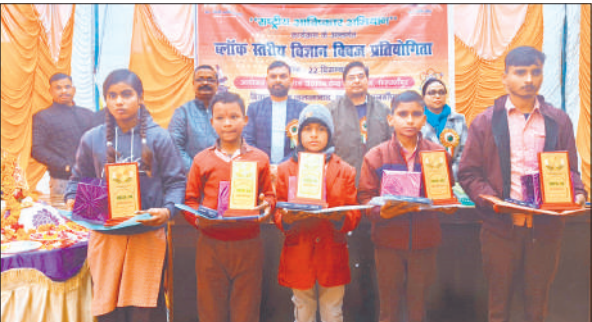
विजय प्रतियोगिता में भाग लेने वाले छात्र प्रतीक चिह्न के साथ।