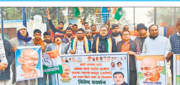
विरोध प्रदर्शन करते कांग्रेस कार्यकर्ता।

● बोले- मनरेगा खत्म करना ग्रामीणों के अधिकारों पर हमला