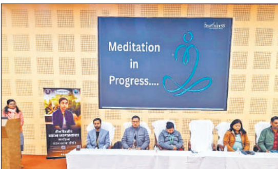
कार्यक्रम के दौरान मंचासीन प्रतिभागी।