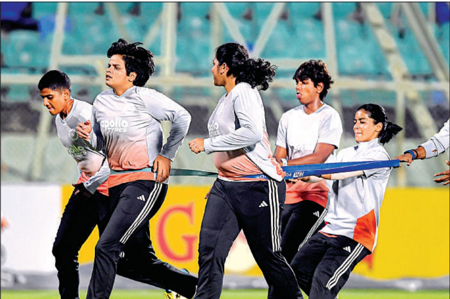
अभ्यास सत्र के दौरान भारतीय महिला खिलाड़ी।

कप्तान हरमनप्रीत कौर ने मैच के बाद कहा हम अपनी फील्डिंग पर काम कर रहे हैं। पता नहीं क्यों हम बार-बार कैच छोड़ रहे हैं। मैदान गीला था, लेकिन यह कोई बहाना नहीं है। यह एक ऐसी चीज है जिस पर हमें गंभीरता से विचार करने की जरूरत है। अगले मैच में हम बेहतर रणनीति के साथ उतरेंगे। विश्व कप की सफलता के बाद भारतीय टीम को छह सप्ताह का ब्रेक मिला। इसके बाद भारतीय टीम ने बेंगलुरु के सेंटर ऑफ एक्सीलेंस में एक सप्ताह के शिविर में भाग लिया था। फील्डिंग में थोड़ी बहुत कमी आना लगभग अपेक्षित था और कप्तान को लगता है कि टीम बहुत जल्द लय में आ जाएगी। हरमनप्रीत ने कहा हम एक महीने बाद खेल रहे हैं। हम खुद को बेवजह चुनौती नहीं देना चाहते।