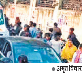
भीड़ में फंसी एंबुलेंस। ●अमृत विचार

टैपो चालक को भी हल्की चोटें आई हैं। टक्कर मारने वाला अज्ञात वाहन मौके से फरार हो गया। एम्बुलेंस अस्पताल के लिए रवाना हुई, तो मीना बाजार की भारी भीड़ के चलते लंबा जाम लग गया। एम्बुलेंस काफी देर तक फंसी रही, हालात गंभीर होने पर घायल को जिला अस्पताल रेफर किया गया है।