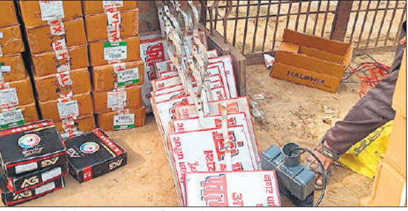
खंभों पर लगाने के लिए लाई गई स्ट्रीट लाइटें।