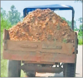
खनन कर मिट्टी ले जा रही ट्रैक्टर ट्रॉली

इससे आए दिन हादसे होते हैं। राजमार्ग पर फरटते भरते ये यमदूत आम जनता के लिए मुसीबत का सबब बने हुए हैं। सूरों के मुताबिक, खनन करने वालों का जाल सीमावर्ती जिला संभल तक फैला हुआ है। वह जिले की सीमा पर खनन कर रहे हैं। चर्चा है कि खनन करने वालों ने चंद ट्रॉलियों की परमिशन ले रखी है जिसकी आड़ में दिन-रात दर्जनों अवैध गाड़ियां बालू की ढुलाई कर रही हैं। कस्बे के मुख्य चौराहों और राजमार्गों पर पुलिस के सीसीटीवी कैमरे लगे हैं। पिकेट पर पुलिसकर्मी भी मुस्तैद रहते हैं। इसके बावजूद अवैध खनन का यह काला कारोबार फल-फूल रहा है।