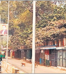
रोड पर लगाए गए खंभे।

जाएगी। पालिका प्रशासन का कहना है कि जिस तरह परशुराम चौक से महाराणा प्रताप चौक तक खंभे लगाए गए हैं उसी तरह अब महाराणा प्रताप चौक से एसएसपी कार्यालय की ओर जाने वाली सड़क पर भी स्ट्रीट लाइट लगाई जाएगी। जिससे उस ओर भी रात को आने जाने में किसी तरह की दिक्कत न हो। इस रोड पर प्रशासनिक और