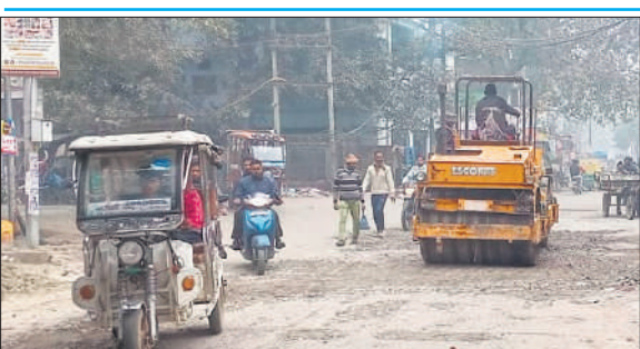
स्टेशन रोड पर गड्ढे भरते कर्मचारी।

● बारिश के दिनों में भर जाता है पानी, घंटों यातायात रहता है बाधित, हादसे की भी आशंका