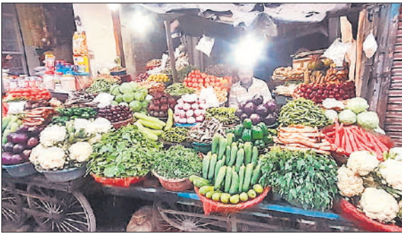
दुकान पर बिक्री के लिए रखी हरी सब्जियां।