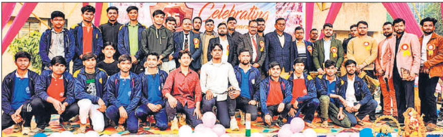
विद्यालय परिवार के साथ मौजूद पूर्व छात्र।