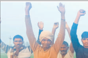
बिजली गुल रहने पर प्रदर्शन करते ग्रामीण।

ब्लॉक दहगवां के नाधा क्षेत्र के दानपुर फीडर से पिछले कई दिनों से किसानों को बिजली नहीं मिल रही है। परेशान किसानों ने सोमवार को