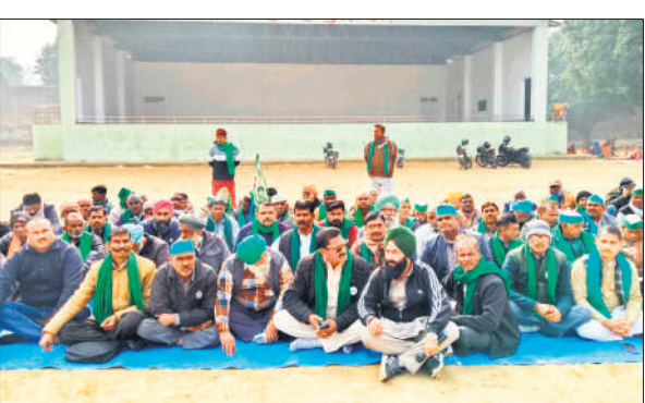
खिरनीबाग रामलीला मैदान में प्रदर्शन करते भारतीय किसान युनियन टिकैत के किसान।

जिलाध्यक्ष ने कहा कि बजाज हिन्दुस्तान लिमिटेड मकसूदापुर चीनी मिल से किसानों का गन्ना बकाया भुगतान शेष करारया जाए। उन्होंने आवाज पशुओं के बढ़ते आतंक का पुर मुहर लगेगी। इस संबंध में एसडीएम चित्रा निर्वाल ने बताया कि सोमवार दोपहर सभी बीएलओ की बैठक कर उन्हें निश्चरित समय सीमा के भीतर लापता पर सर्वे कार्य पूर्ण करने के निर्देश दिए गए हैं।