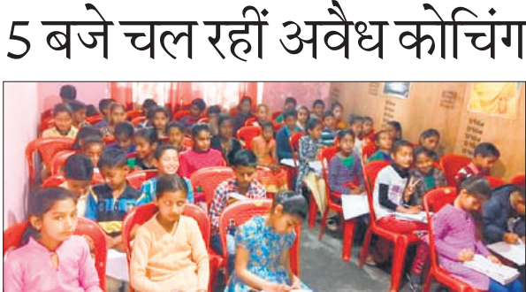
कस्बे में संचालित एक कोचिंग सेंटर में पढ़ रहे बच्चे।