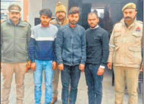
पुलिस हिरासत में आरोपी।