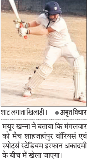
शाट लगाता खिलाड़ी।