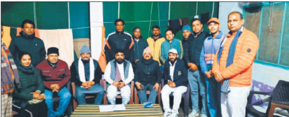
क्रीड़ा भारती की में उपस्थित पदाधिकारी।