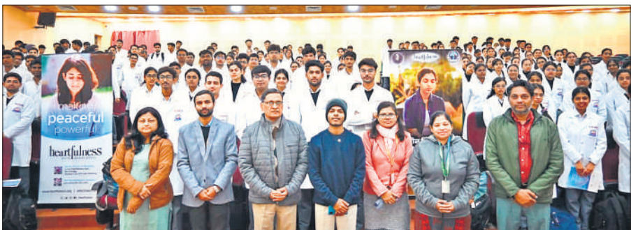
विश्व ध्यान दिवस पर मेडिकल कॉलेज के सभागार में आयोजित हार्टफुलनेस मेडिटेशन वर्कशॉप में विद्यार्थी।