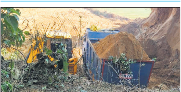
खनन कर जैसीबी से डंपर में भरी जा रही मिट्टी। ● अमृत विचार

● पुलिस और प्रशासन पर संरक्षण देना का आरोप