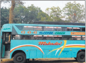
थाने में खड़ी स्लीपर बस।

●लोकल सवारियां बैठाने से मना करने पर हुआ था विवाद