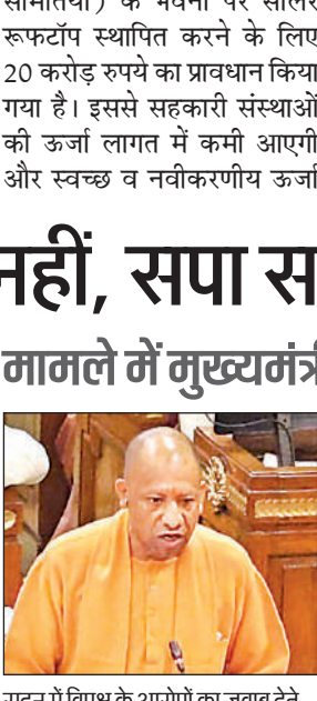
सदन में विपक्ष के आरोपों का जवाब देते मुख्यमंत्री योगी।

मुख्यमंत्री ने नेता प्रतिपक्ष और समाजवादी पार्टी पर निशाना साधते हुए कहा कि प्रश्न क्या है और मुद्दे क्या उठाए जा रहे हैं, इसका फर्क समझना चाहिए। सदन की गरिमा बनाए रखना विपक्ष की भी लेकर्म गिनानी है। उन्होंने 'चोच की दाढ़ी में तिनका' कहावत का जिक्र करते हुए कहा कि जिनके दामन पर दाग