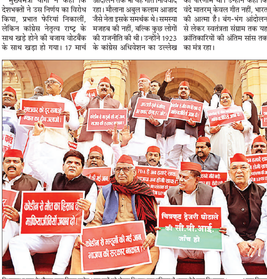
विधानसभा सत्र के दौरान कफ सिरप समेत अन्य मुद्दों को लेकर विधानभवन परिसर में धरना देते सपा विधायक।

तार : योगी ने कहा कि जांच में सामने आया है कि अवैध लेन-देन लोहिया वाहिनी के एक पदाधिकारी के खाते के माध्यम से हुआ। किंग पिन शुभम जायसवाल के सपा से संबंध रहे हैं। अमित यादव और दिखाते हुए कहा कि वह समाजवादी युवजन सभा से जुड़ा रहा है। अवैध लेन-देन और सपा के