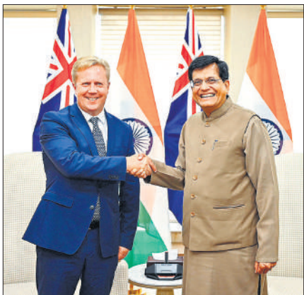
न्यूजीलैंड के मंत्री टॉड मैक्ले के साथ केंद्रीय मंत्री पीयूष गोयल ।

दूसरी ओर, न्यूजीलैंड को भेड़ के मांस, ऊन, कायला और वनों एवं लकड़ी से बनी 95 प्रतिशत से अधिक वस्तुओं पर शुल्क-मुक्त पहुंच मिलेगी। समझौते के तहत न्यूजीलैंड को कीवी फल, शराब, कुछ समुद्री खाद्य पदार्थ, चैरी, एवोकाडो, पर्सिमन, शिशु 'फोर्मूला', मनुका शहद और दूध 'एल्ब्यूमिन' जैसी कई अन्य वस्तुओं पर शुल्क छूट भी मिलेगी। घरेलू किसानों और एमएसएमई के हितों की सुरक्षा के लिए भारत राजनीतिक रूप से संवेदनशील दुग्ध क्षेत्र जैसे दूध, क्रीम, क्के, दही तथा पनीर में कोई शुल्क छूट नहीं देगा। इस समझौते के अंतर्गत शामिल न होने वाले अन्य उत्पाद वनस्पति उत्पाद ( प्याज, चना,