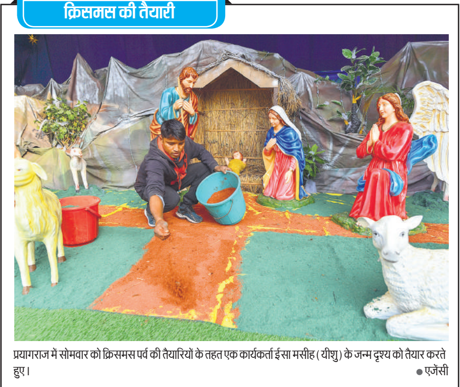
प्रयागराज में सोमवार को क्रिसमस पर्व की तैयारियों के तहत एक कार्यकर्ता ईसा मसीह (यीशु) के जन्म दृश्य को तैयार करते हुु।