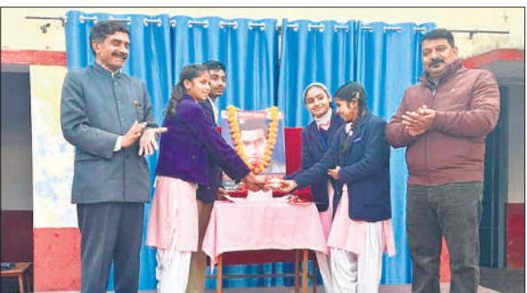
केसर इंटर कॉलेज में रामानुजन जयंती पर श्रद्धांजलि अर्पित की ।