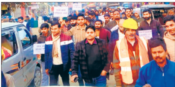
नवाबगंज में बिजली बिल राहत जागरूकता रैली निकालते एसडीओ । ● अमृत विचार

यात्रा के दौरान विद्युत विभाग के कर्मचारियों ने बताया कि यह योजना उन उपभोक्ताओं के लिए वरदान साबित हो सकती है, जो लंबे समय से बड़े हुए बिलों से परेशान हैं। लोगों को समझाया गया कि समय पर पंजीकरण कराने से न सिर्फ पुराने