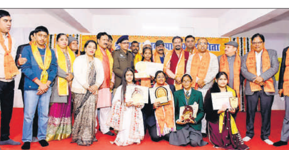
अतिथियों के साथ श्रीराम काव्यपाठ प्रतियोगिता के विजेता ।