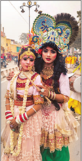
शोभायात्रा में राधेकृष्ण की अभिनव प्रस्तुति करते कलाकार।