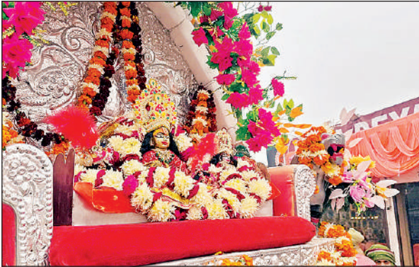
रथ पर विराजमान रामलला का प्रतीकात्मक मूर्ति।