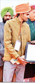
मुख्यमंत्री से ट्रैक्टर की चाबी लेते किसान।