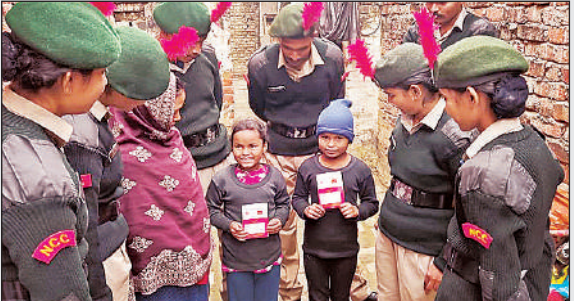
चांदपुर हरबंस में जागरूकता अभियान चलाते अवध विवि के एनसीसी कैडेट्स।