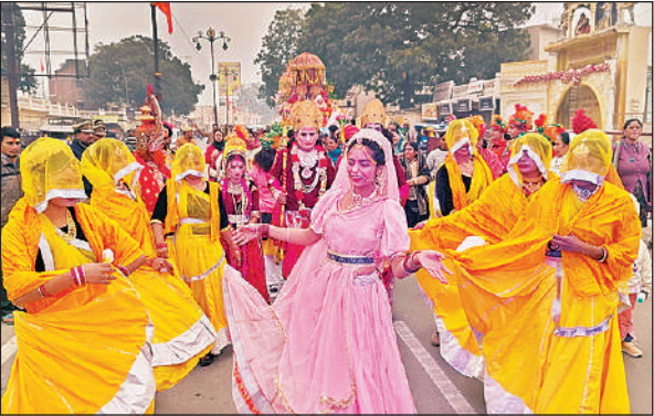
यात्रा में महिला कलाकारों द्वारा नृत्य प्रस्तुत करते हुए।

अमृत विचार: राम जन्मभूमि सेवा समिति के द्वारा भगवान श्री रामलला का 77वां प्राकट्य उत्सव बड़े ही धूमधाम से मनाया गया। राम मंदिर के गर्भगृह में स्थापित कलश के साथ गेट नंबर तीन से विशाल शोभायात्रा निकाली गई। बैंड बाजा और रथ के साथ सिद्ध पीठ हनुमान गढ़ी की निशानी और साधु संत व अयोध्यावासी भी शामिल हुए। जहां कड़ी सुरक्षा के बीच यह यात्रा रामकोट की परिक्रमा वापस उसी स्थान पर समापन हुआ। राम जन्मभूमि परिसर में वर्ष 1949 में पौष शुक्ल तृतीया को भगवान श्री रामलला का प्राकट्य