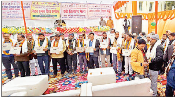
उत्कृष्ट प्रदर्शन करने वाले सम्मानित किसान।

व्यापारी कल्याण एवं सेवा समिति, सुलतानपुर द्वारा सुपर मार्केट क्षेत्र में अतिक्रमण, दुकानों की मरम्मत और सुरक्षा व्यवस्था से संबंधित समस्याएं रखीं। डीएम ने इन मुद्दों पर नगर पालिका को शीघ्र कार्रवाई सुनिश्चित करने के निर्देश दिए।