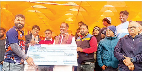
क्रिकेट प्रतियोगिता के विजेता खिलाड़ियों को 25 हजार रुपए का चेक देते चेयरमैन।

मंगलवार को फाइनल मैच अकबरपुर और जलालपुर के बीच खेला गया। अकबरपुर की घातक गेंदबाजी के चलते जलालपुर टीम