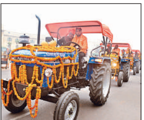
ट्रैक्टर लेकर जाते किसान।