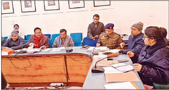
पसका मेले की तैयारी बैठक करतीं डीएम।

पसका संगम, जिसे महाकवि गोस्वामी तुलसीदास जी की जन्मस्थली होने का गौरव प्राप्त है, पौष पूर्णिमा के अवसर पर विशेष धार्मिक केंद्र बन जाता है। यहां साधु-संतों का जमावड़ा रहेगा और धर्म, भक्ति व संस्कृति की त्रिवेणी प्रवाहित होगी। एक माह से संगम