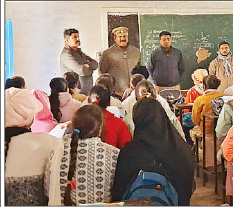
आदर्श इंटर कॉलेज जमुनहा में सुरक्षा की जानकारी देती पुलिस।