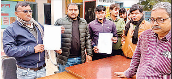
रानीमऊ में मतदाता सूची प्रकाशित करते बीएलओ व सुपरवाइजर।

आधा-अधूरा रहा मतदाता सूची का आलेख्य प्रकाशन, कई केंद्रों से बैरंग लौटे मतदाता