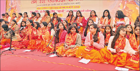
राम की पैड़ी भजन गायन करतीं 108 महिलाएं।