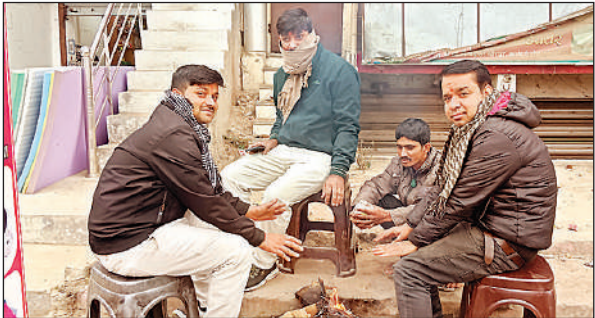
अंबेडकर चौराहे पर अलाव संकेत लोग।

अमृत विचार: मंगलवार को जिले में कोहरे के साथ धुंध छायी रही। पूरे दिन सूर्यदेव के दर्शन नहीं हुए, जिससे ठंड का असर और तेज हो गया। कड़ाके की ठंड में लोगों को भारी परेशानी का सामना करना पड़ा। मंगलवार को दिन का अधिकतम तापमान मात्र 15 डिग्री सेल्सियस दर्ज किया गया, जबकि न्यूनतम तापमान 8 डिग्री सेल्सियस रहा। ठंड और धुंध के कारण दृश्यता कम रही, जिससे वाहनों को दिन में भी हेडलाइट जलाकर चलना पड़ा। पिछले एक सप्ताह से जिले में लगातार ठंड का प्रकोप बढ़ता जा