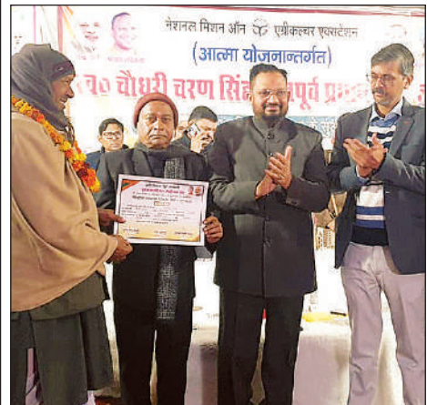
किसान को सम्मानित करते डीएम व मौजूद अन्य लोग।