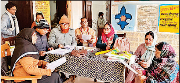
रौनाही में वोटर लिस्ट दिखाते मौजूद सभी बीएलओ।