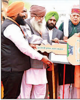
मुख्यमंत्री से ट्रैक्टर की चाबी लेते किसान।