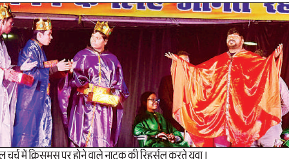
कैथेड्रल चर्च में क्रिसमस पर होने वाले नाटक की रिहर्सल करते युवा।

कैथेड्रल चर्च में क्रिसमस में होने वाले नाटक और बच्चों के अन्य कार्यक्रमों का रिहर्सल चल रहा है। बच्चे रंगबिरंगी पोशाकों में पूरे उत्साह के साथ रिहर्सल में शामिल हो रहे हैं। प्रभु के आगमन के लिए जागते रहो और प्रार्थना करते रहो की थीम पर चर्च में तैयारियां चल रही हैं।