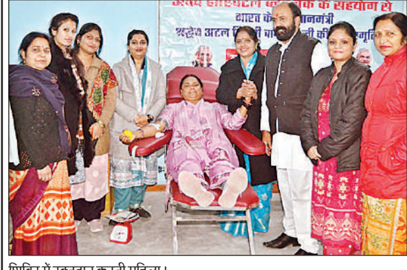
शिविर में रक्तदान करती महिला।