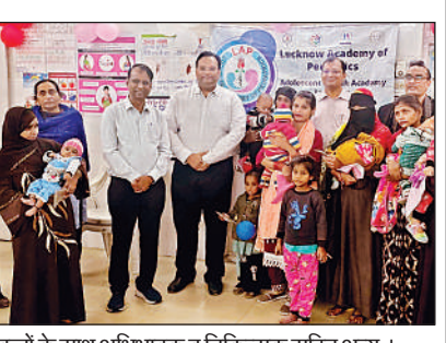
बच्चों के साथ अभिभावक व चिकित्सक सहित अन्य।