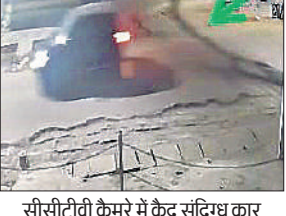
सीसीटीवी कैमरे में कैद संदिग्ध कार

में क्राइम ब्रांच, सर्विलांस सेल समेत पांच टीमें लगायी गयी हैं। अभी तक की जांच से यह साफ है कि वारदात में तीन से अधिक लोग शामिल थे। सीसीटीवी फुटेज से यह साफ है कि शनिवार रात करीब एक बजे से तीन बजे तक चोर दुकान के आसपास सक्रिय रहे, लेकिन न तो नजदीकी चौकी में तैनात पुलिसकर्मियों भनक लगी और न ही गश्त कर रही पुलिस को