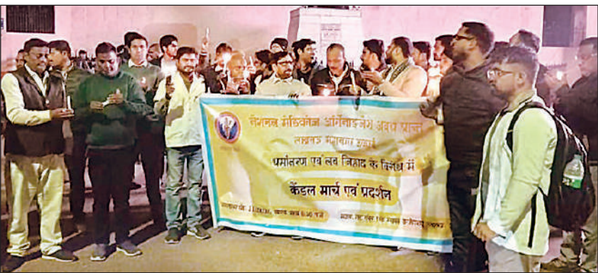
कैडल मार्च निकालते नेशनल मेडिकोज ऑर्गनाइजेशन के सदस्य।