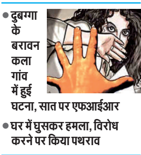
● दुबगा के बरावन कला गांव में हुई घटना, सात पर एफआईआर