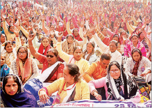
राजधानी में प्रदर्शन करती प्रदेश भर से आई आशा कार्यकर्ता।