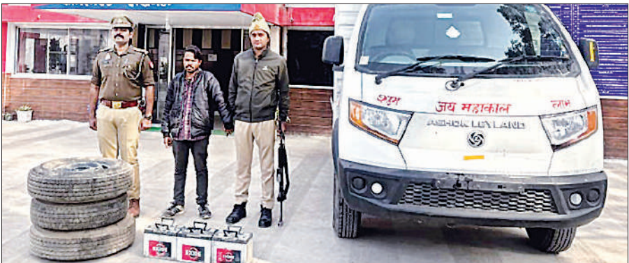
पुलिस की गिरफ्त में आरोपी व बरामद माल व लोडर।