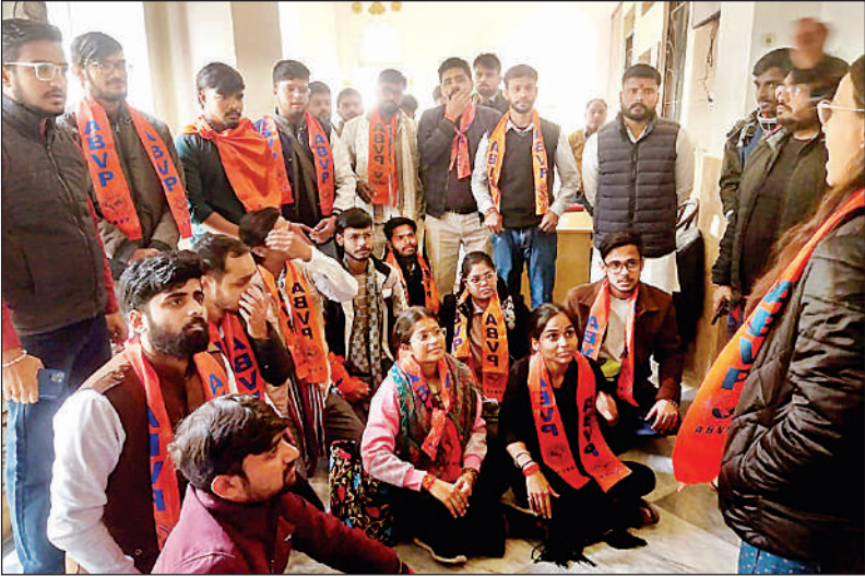
केजीएमयू में कुलपति कार्यालय के बाहर धरना प्रदर्शन करते एबीवीपी के कार्यकर्ता।