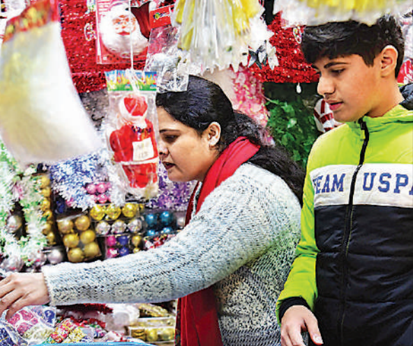
क्रिसमस पर घर में झांकी सजाने के लिए बाजार में सामान खरीदती महिला।