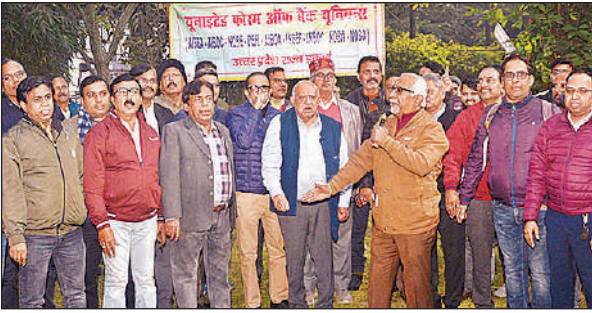
हरजतगंज इंडियन बैंक के बाहर प्रदर्शन करते बैंक कर्मचारी।

करते हुए उन्हें स्मृति-चिन्ह और पुष्पगुच्छ भेंट किया। चारबाग रेलवे स्टेडियम में आयोजित महाधिवेशन में हजारों रेलकर्मियों ने एकजुट होकर नए श्रम कानूनों के विरोध, आउटसोर्सिंग और निजीकरण के