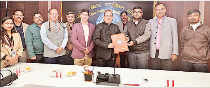
करार के दौरान संस्थान के निदेशक व निजी सेंटरों के संचालक।