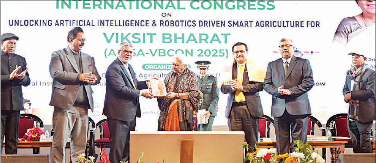
इंटीग्रल विश्वविद्यालय के संस्थापक को अपनी पुस्तकें भेंट करती राज्यपाल।

दो दिनों तक चलने वाली अंतरराष्ट्रीय कांग्रेस का समापन