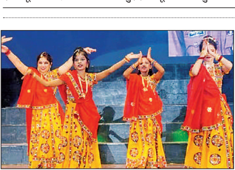
सांस्कृतिक प्रस्तुति देती छात्राएं।