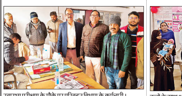
स्वास्थ्य परीक्षण के मौके पर परिवहन विभाग के कर्मचारी।