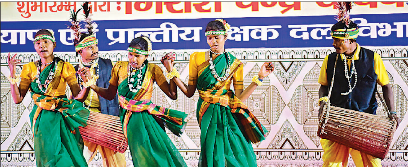
इंदिरा गांधी प्रतिष्ठान आयोजित युवा उत्सव में लोकनृत्य प्रस्तुत करते प्रतिभागी।