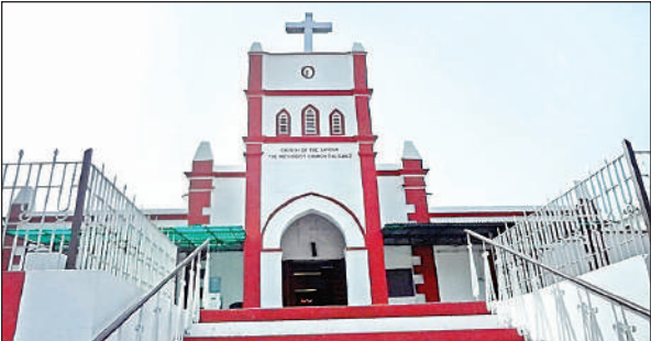
डालीगंज में स्थित मेथोडिस्ट चर्च।

डालीगंज चर्च की विशेषता यह है कि यहां पादरी का पद स्थानान्तरण