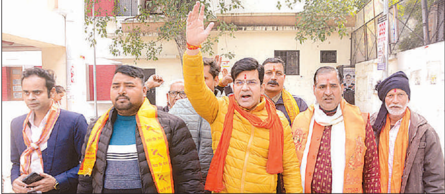
बांग्लादेश में हिंदुओं पर अत्याचार के विरोध में कलेक्ट्रेट में नारेबाजी करते अंतरराष्ट्रीय हिंदू परिषद परिषद व बजरंग दल के सदस्य।