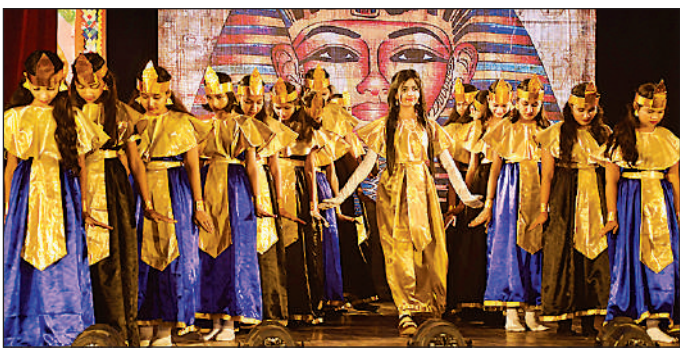
नवयुग सीनियर सेकेंडरी स्कूल के वार्षिक उत्सव में संस्कृतिक कार्यक्रम प्रस्तुत करती छात्राएं।