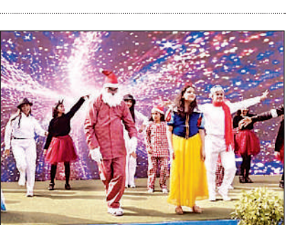
क्रिसमस पर्व मनाते सीएमएस छात्र-छात्राएं।