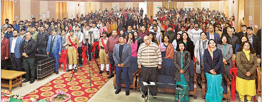
शोध प्रविधि कार्यशाला में मौजूद शोधार्थी व शिक्षक।