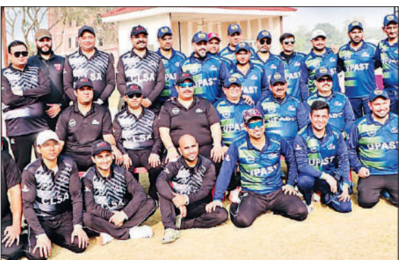
प्रतियोगिता में भाग लेने वाली हाईकोर्ट की टीमें।

एनएसयूआई के छात्रों ने बताया कि जब वे इस समस्या को लेकर वित्त अधिकारी से मुलाकात करने पहुंचे, तो वित्त अधिकारी कार्यालय में अनुपस्थित पाई गई। इससे खिलाड़ियों की परेशानियां और अधिक बढ़ गई हैं और उनके भविष्य को लेकर अनिश्चितता बनी हुई है। छात्रों की मांग है कि वेटलिफ्टिंग खिलाड़ियों का बजट तत्काल स्वीकृत किया जाए, ताकि वे बिना किसी मानसिक दबाव के प्रतियोगिता में भाग लेकर विश्वविद्यालय का नाम रोशन कर सकें।