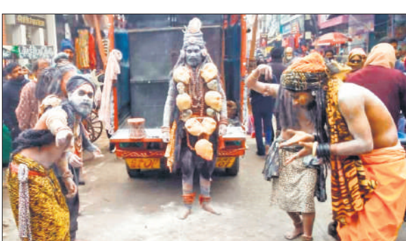
शहर में निकाली गई शोभायात्रा में शामिल झांकी।