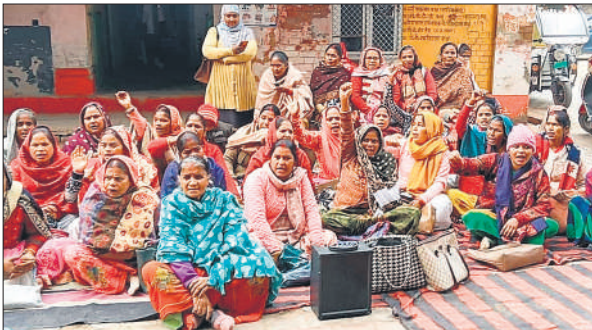
गोला सीएससी में घरने पर बैठी आशा कार्यकर्ता।

मुख्यमंत्री ने सदन में विपक्ष की ओर इशारा करते हुए कहा कि साफ सुन लीजिए... बांग्लादेश व पाकिस्तान में हिंदुओं के अत्याचार पर चुप्पी और गाजा पर आंसू बहाना, कैडल मार्च निकलना हमें बर्दाश्त नहीं