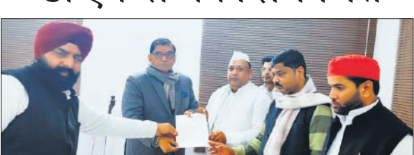
डीएम से शिकायत करते सपा नेता।