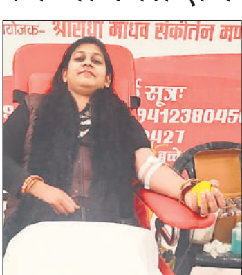
शिविर में रक्तदान करती महिला।