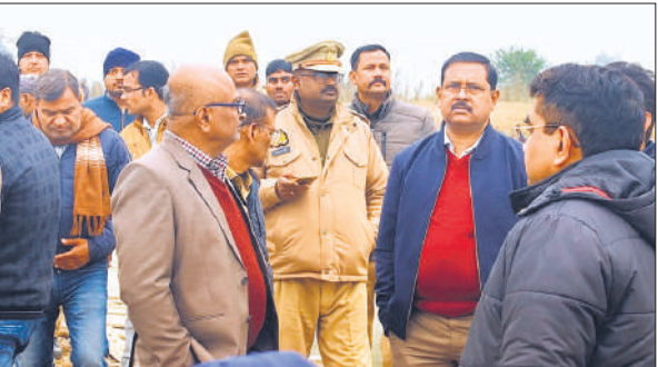
जौरहा नदी पर बनाए गए अवैध पुल की जांच करती टीम।

ग्रामीणों का कहना है कि क्षेत्र से गुजरने वाली जौराहा नदी अभिलेखों में नाला दर्ज है, इसके बावजूद खनन विभाग ने सांटगांट कर यहां खनन पट्टा जारी किया है, जिसका वे लगातार विरोध कर रहे हैं। इससे पहले लेने शुक्रवार को एसडीएम राजीव नीम के नेतृत्व में गठित