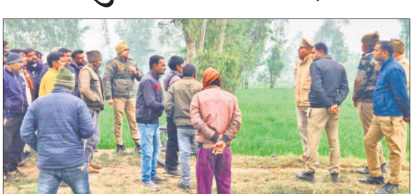
मौके पर लगी भीड़ व पुलिस।