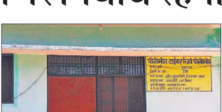
पीलीभीत टाइगर रिजर्व की वन चौकी।

जनपद में 73 हजार हेक्टेयर से अधिक क्षेत्रफल में फैले पीलीभीत के जंगल को जून 2014 में टाइगर रिजर्व का दर्जा दिया गया था। उस दौरान आनन-फानन में इसे