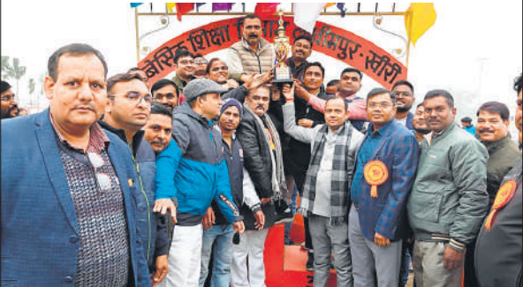
पलिया को चैंपियनशिप ट्रॉफी सौंपते बीएसए व डीपीओ।