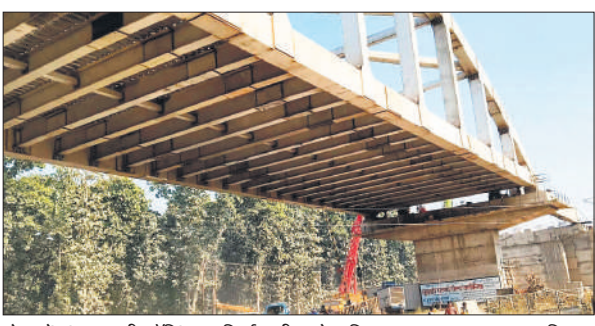
गोला में जंगल वाली क्रॉसिंग पर निर्माणाधीन ओवरब्रिज।

रहते जांच कर उन्हें सुरक्षित एवं स्वस्थ बनाए रखना है। इससे न केवल कर्मचारियों का स्वास्थ्य बेहतर रहता है, बल्कि यात्रियों को भी सुरक्षित और भरोसेमंद सेवाएं मिलती हैं। स्वास्थ्य शिविर में डॉ. पंकज, एनटीईपी स्टाफ, डीएसआरसी एवं आईसीटीसी काउंसलर, लैब टेक्नीशियन, जिला चिकित्सालय व ग्राम विकास सेवा समिति से जुड़े कर्मचारी मौजूद रहे।