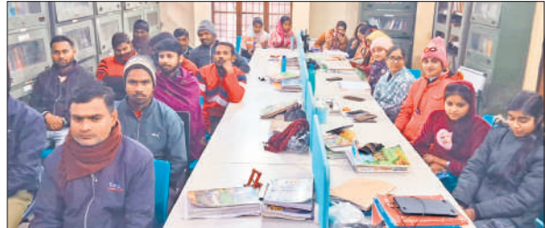
कार्यक्रम में मौजूद लोग।