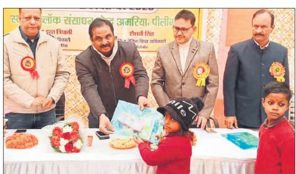
कार्यक्रम में पुरस्कृत किए जाते निपुण बच्चे।