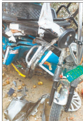
हादसे में ई-रिक्शा के उड़े परखच्चे।