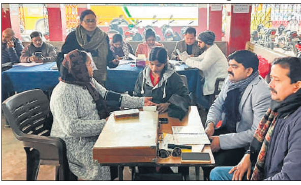
लखीमपुर रोडवेज बस स्टैंड पर जांच कराते कर्मचारी।