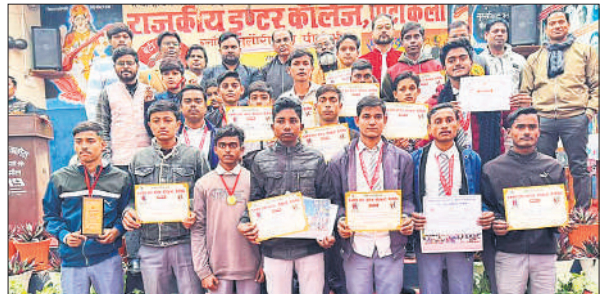
कार्यक्रम में पुरस्कृत किए गए विद्यार्थी।