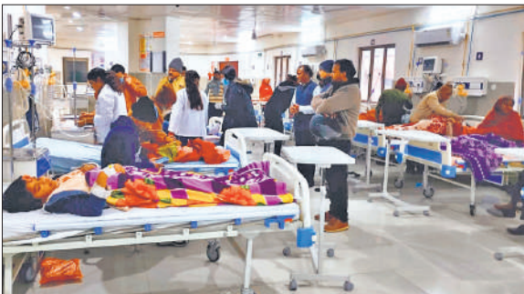
जिला अस्पताल की इमरजेंसी में भर्ती घायल।

हादसा बुधवार शाम करीब साढ़े चार बजे पीलीभीत-बरेली मार्ग पर देवहा नदी के निकट हुआ। जहानाबाद थाना क्षेत्र के ढकिया नत्था गांव निवासी सात लोग ई-रिक्शा से अपने गांव आ