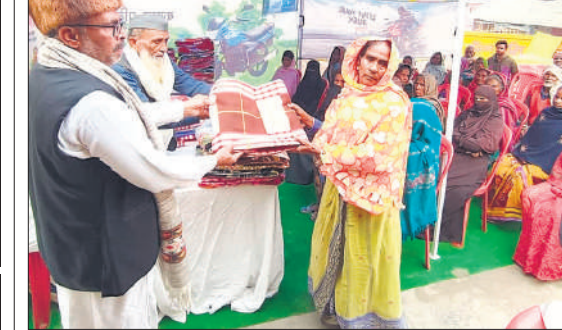
कुकरा में वृद्धा को कंबल देते पदाधिकारी।