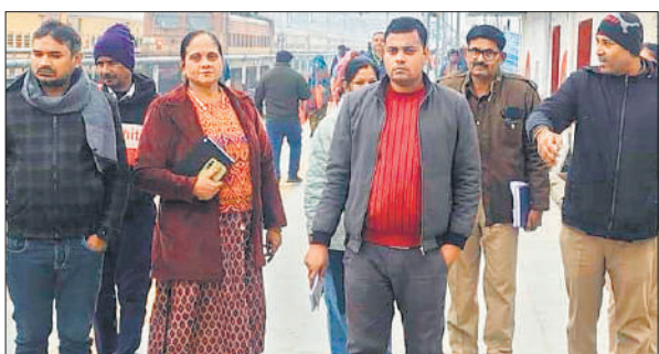
रेलवे स्टेशन पर निराश्रितों की खोजबीन करती रेस्क्यू टीम।