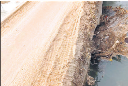
बड़ागांव के पास क्षतिग्रस्त नहर पुलिया।

जनपद के प्रमुख मार्गों समेत विभिन्न हाईवे पर सड़क दुर्घटनाओं का ग्राफ तेजी से बढ़ा है। इन सबके अलावा अब ग्रामीण क्षेत्रों में भी सड़क हादसों में लोगों की जाने जा रही है, वहीं बड़ी संख्या में लोग घायल हो रहे हैं। करीब दो माह पूर्व हुई मंडलीय सड़क सुरक्षा समिति की बैठक में ग्रामीण अंचलों में बढ़ रहे सड़क हादसों को संज्ञान लिया गया था। जिसके बाद हादसों की रोकथाम को लेकर जिला मार्ग, प्रधानमंत्री ग्राम सड़क योजना के