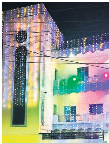
रंग बिरंगी झालरों से सजा फुल गॉस्पल पेंटी कॉस्टल चर्च।

क्रिसमस की पूर्व संध्या यानी बुधवार को शहर क्राइस्ट मेथोडिस्ट और सेंट एलार्थसिस चर्च में प्रवचन और सांस्कृतिक प्रस्तुतियों का दौर जारी रहा। जिसमें मसीह समाज के लोगों की भीड़ बनी रही। सभी ने प्रभु के आगमन पर उनका स्वागत करने के लिए कैरोल