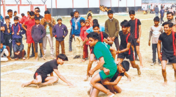
खेल स्टेडियम में कबड्डी में दांव दिखाते बच्चे।