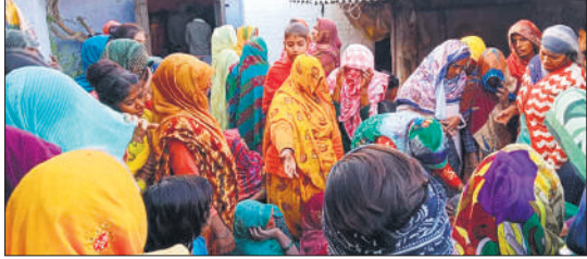
युवक की मौत पर विलाप करती परिजन।