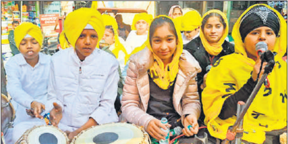
नगर कीर्तन में प्रस्तुति देती छात्राएं।