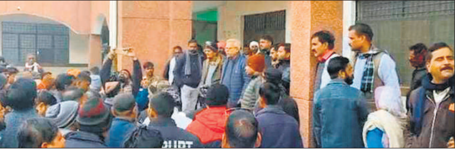
जलालाबाद तहसील परिसर में भ्रष्टाचार के विरोध में प्रदर्शन करते अधिवक्ता।