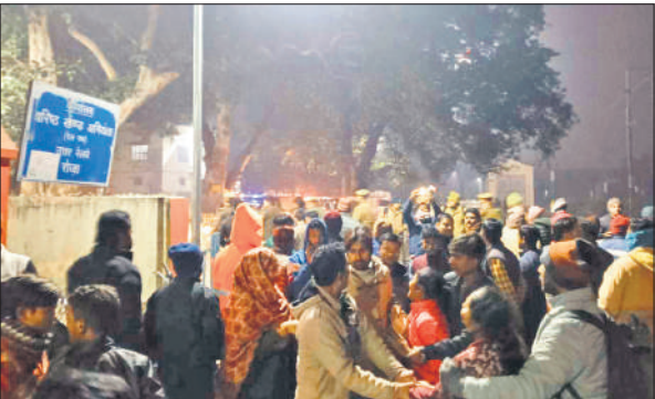
घटना के बाद मौके पर एकत्र लोग।

अब तक दुर्घटनाओं में हो चुकी हैं कई मौतें, फिर भी बेधड़क आवागमन जारी, आरपीएफ तैनाती और व्यवस्था सुधार की उठी मांग