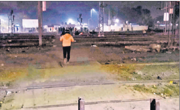
हादसे होने के बाद भी पाथ वे से गुजरता व्यक्ति।