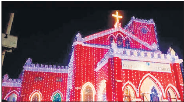
गोविंदगंज में रोशनी में जगमगाता सेंट्रल मैथोडिस्ट चर्च। ● अमृत विचार

लाख रुपये की मांग की। रोली ने ससुराल वालों ने कहा कि मायके वाले अब कुछ नहीं दे पाएंगे। ससुराल वालों ने उससे कहा कि बिना दहेज के नहीं रखेंगे। उसका आरोप है कि ससुराल वालों ने तीन माह पूर्व घर से निकाल दिया। वह मायके में रह रही है। महिला थाना प्रभारी ने बताया कि पीड़िता की तरफ से ससुराल वालों के खिलाफ रिपोर्ट दर्ज कर ली है। पुलिस मामले की विवेचना कर रही है।