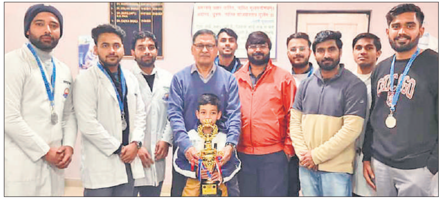
वरुण अर्जुन मेडिकल कॉलेज एंड रोहिलखंड हॉस्पिटल की टीमों के खिलाड़ियों का उत्साह वर्धन करते प्राचार्य।