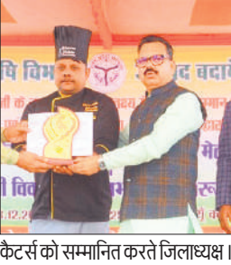
कैंटर्स को सम्मानित करते जिलाध्यक्ष।

कार्यक्रम को जिलाध्यक्ष भाजपा द्वारा फीता काटकर शुरू कराया गया। राजकीय कन्या इंटर कॉलेज, पार्वती कन्या इंटर कॉलेज, सिंगलर गर्ल्स इंटर कॉलेज, नगर पालिका कन्या इंटर कॉलेज व केदारनाथ महिला इंटर कॉलेज के विद्यार्थियों ने मिलेट्स रेसीपी के स्वादिष्ट व्यंजन तैयार कर मिलेट्स लोगों को जागरूक किया। कार्यक्रम में निजी तथा राजकीय स्टॉलों के मूल्यांकन उपरान्त भूमि संरक्षण अनुभाग प्रथम, बेसिक शिक्षा विभाग