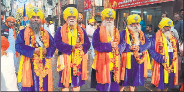
शहर में निकले नगर कीर्तन में शामिल पंच प्यारे।

अमृत विचार : सिख धर्म के दसवें गुरु गुरु गोविंद सिंह महाराज के प्रकाश पर्व पर श्री गुरुनानक सत्संग सभा की ओर से पंजाबी मोहल्ला से विशाल नगर कीर्तन निकाला गया, जो नगर के मुख्य मार्गों से होता हुआ गुरुद्वारा साहब पर समाप्त हुआ। शहर भर में लोगों ने जगह-जगह पुष्प वर्षा की। कलाकारों ने हेरतंगेज करतब दिखाए। खुराना टेंट हाउस पर द्वार बनाकर कीर्तन का स्वागत किया गया। शोभायात्रा टिकटगंज, पुराना बाजार, नेहरू चौक से होती हुई गोपी चौक से निकलकर गुरुद्वारा जोगीपुरा पहुंची। गुरु ग्रंथ साहिब महाराज की पालकी थी। आगे संगत सफाई, जल का छिड़काव व पुष्प वर्षा कर रही थी। साहिबजादा अजीत सिंह गतका अखाड़ा, पानीपत (हरियाणा) , मीरी पीरी खालसा गतका ग्रुप अलीगढ़, बाबा दीप सिंह गतका ग्रुप ने अपनी प्रतिभा का प्रदर्शन