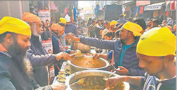
समापन के अवसर पर लंगर छकती संगत।