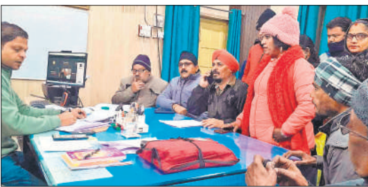
अधीक्षण अभियंता को ज्ञापन देते व्यापारी।