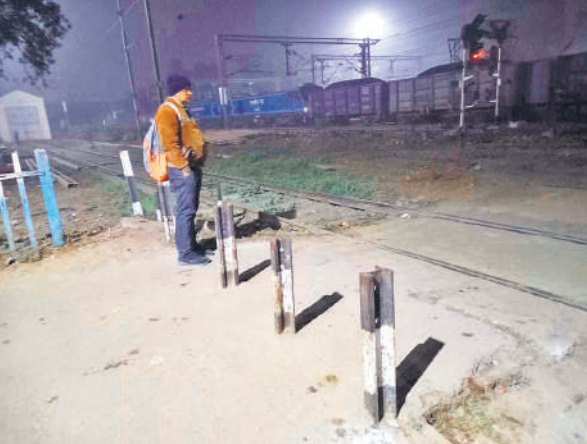
कई रेल पटरियों के बीच का वह खतरनाक रास्ता, जहां आवागमन बना रहता है।