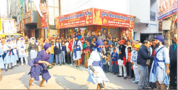
नगर कीर्तन में करतब करते कलाकार।

ग्रुप की धमक भी दर्शकों को लुभा गई। सबसे आगे मेरी पीढ़ी खालसा गतका ग्रुप अलीगढ़ के गतका पार्टी के द्वारा बहुत अच्छे करतब दिखाए जा रहे थे। श्री