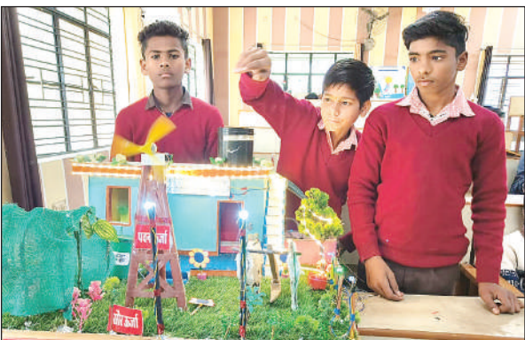
प्रदर्शनी में लगे मॉडल।

सेवायोगन कार्यालय में शुक्रवार को विज्ञान प्रदर्शनी में सिजहरी,