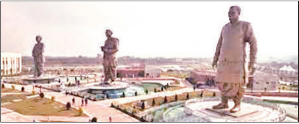
लखनऊ में बने राष्ट्र प्रेरणा स्थल में स्थापित प्रतिमाएं।

राजनीति की नजरों से देखें तो यह स्थल सक्रिय राजनीतिक दलों के लिए भी एक महत्वपूर्ण मंच है। जानकारों का मानना है कि जैसे रमाबाई मैदान बड़े राजनीतिक आयोजनों और जनसभाओं का केंद्र रहा है, इसे बसपा प्रमुख मायावती