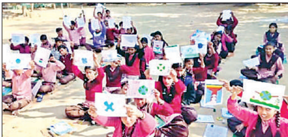
बनाई गई पेंटिंग दिखाते बच्चे।