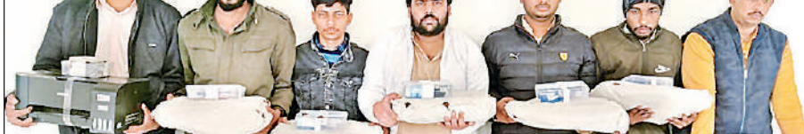
एसटीएफ की गिरफ्त में फर्जी आयुष्मान कार्ड बनवाकर सरकारी धन हड़पने के आरोपी।