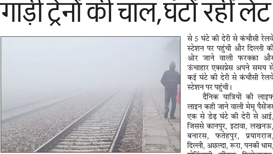
कोहरे की वजह से स्टेशन पर देर से आ रही ट्रेनें।

26 दिसम्बर 2025 से प्रारम्भ होकर एक माह तक चलेगा जिसमें जनपद का कुल लक्ष्य 171876 है। जिसमें 09-12 माह तक 19474 बच्चें, 1 वर्ष 2 वर्ष तक-37191 बच्चें एवं 2 से 5 वर्ष तक 115211 बच्चों को उक्त अभियान के तहत विटामिन ए की दवा पिलाये जाने का लक्ष्य है। जिन्हें बुधवार एवं शानिवार को आयोजित होने वाले नियमित टीकाकरण पर एएनएम के द्वारा आशा एवं आँगनवाड़ी के माध्यम से विटामिन ए की दवा पिलाये जाने के साथ-साथ कुपोषित एवं अतिकुपोषित बच्चों को चिन्हित कर उपचार हेतु संदर्भित किया जायेगा। इस अवसर पर स्वास्थ्य व अन्य विभागों के जनपदीय, ब्लाक स्तरीय अधिकारियों तथा सहयोगी संस्थाओं के प्रतिनिधि मौजूद रहे।