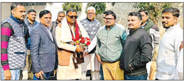
सदर विधायक का आभार जताते डीएलएड छात्र व शिक्षक। अमृत विचार

अमृत विचार। डीएलएड के छात्रों ने सदर विधायक से की गई मांगों के पूरे होने पर उनके आवास में पहुंच कर उन्हें सम्मानित करते हुए आभार व्यक्त किया। जनपद के डीएलएड (बीटीसी) की कक्षाओं के प्रशिक्षुओं की सेमेस्टर परीक्षाओं का परीक्षा केंद्र विगत कई वर्षों से महोबा जनपद में बनाया जाता था। जिससे प्रशिक्षुओं को परीक्षा देने के लिए लंबी दूरी तय करनी होती थी तथा अनेका अनेक समस्याओं का सामना करना पड़ता था। इस संबंध में ॐ हरिहर स्नातकोत्तर महाविद्यालय के प्रशिक्षुओं के साथ अन्य