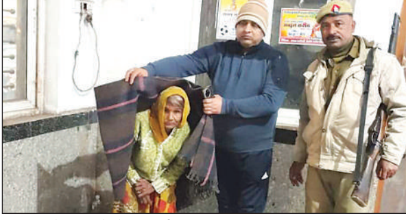
निराश्रित को कंबल आढ़ते अधिकारी।

जिलाधिकारी गजल भारद्वाज के निर्देश पर सभी तहसीलों में सार्वजनिक स्थलों पर कुल 85 अलाव जलाए जा रहे हैं। अलाव जलने से नागरिकों के अलावा पशु भी आसपास खड़े होकर आग से सिक रहे हैं। ठंड बढ़ने के साथ ही जिला प्रशासन ने अलाव जलवाने की व्यवस्था कर दी है। शहर के आल्हा चौक, उदल चौक, रोडवेज, प्राइवेट बस स्टैंड, जिला अस्पताल,