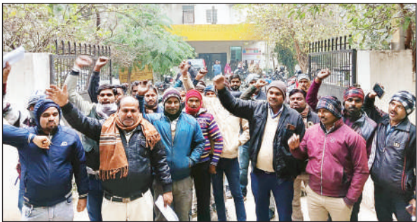
अधीक्षण अभियंता विद्युत के कार्यालय पर प्रदर्शन करते लाइनमैन।

तापमान एवं 75 प्रतिशत आद्रता पर फैलता हैं। इसके बचाव के लिए 2-2.5 ग्राम मैकोजैब/ली. पानी की दर प्रयोग करने से रोका जा सकता हैं। जब कि पिछेली झुलसा रोग तब फैलता हैं जब लगातार 2-3 दिन कोहरा छाया रहे, बारिश का मौसम होने व हल्की बारिश होने पर तापमान 10-12 डिग्री सेंटीग्रेट व सापेक्षित आद्रता 80 प्रतिशत से अधिक होने पर आलू मे रोग के फैलने की आशंका होती है। इसके नियंत्रण के लिए जब मौसम अनुकूल हो जाए।तब 2 से 2.5 ग्राम मैकोजेब प्रति ली पानी के साथ स्प्रे करें। जब रोग लग जाए तब मैकोजेब व मेटालेक्सल 2.5 से 3 ग्राम/ली पानी के साथ स्प्रे करें। साइमोक्सनिल व मैकोजेब 2.5 से 3 ग्राम/ली पानी से छिड़काव करें।