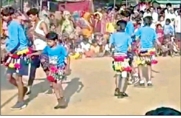
मेले में दिवारी नृत्य पेश करते कलाकार।

ब्लाक पनवाड़ी क्षेत्र के टोला पांतर गांव में मेले के दूसरे दिन ग्रामीणों की भारी उमड़ी। मेले में क्षेत्र के अलावा जिले व मध्यप्रेश