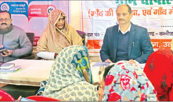
ग्राम पंचायत सहजापुर में चौपाल लगाए डीएम आशुतोष मोहन अग्निहोत्री।

हर शुक्रवार को जिले के आठों विकास खंडों की दो-दो कुल 16 ग्राम पंचायतों में चौपाल लगती है। इसमें विकसित भारत जी-राम-जी योजना एवं सड़क सुरक्षा से संबंधित विषयों पर ग्रामीणों से चर्चा हुई। डीएम ने कहा कि विकसित भारत जी-राम-जी योजना भारत सरकार की महत्वपूर्ण योजना है। इसका उद्देश्य 100 दिनों के स्थान पर 125 दिन की रोजगार गारंटी