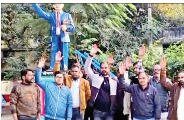
महोबा के अंबेडकर पार्क में एकत्र हुए बीएलओ।

● बोले, मतदाता सूची से नाम कटने पर बीएलओ को जिम्मेदार ठहरा रहे गांवों के लोग