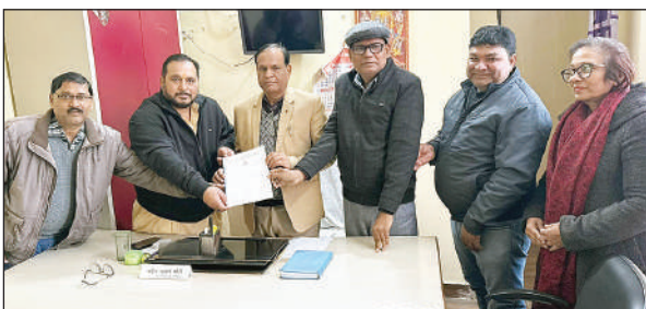
जिला विद्यालय निरीक्षक को ज्ञापन देते संगठन के पदाधिकारी।

इसमें उल्लेख किया गया है कि जनपद औरैया के तदर्थ प्रधानाचार्य सत्र 2023 -24 से अपने पद के कार्यों का सकुशल निर्वहन कर रहे हैं परंतु कार्यवाहक प्रधानाचार्यों को पद के अनुरूप वेतन प्राप्त नहीं हो रहा है जबकि माननीय उच्च