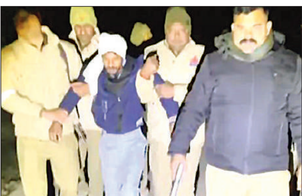
मुठभेड़ में घायल गैंगस्टर को ले जाती पुलिस।

● पुलिस अधीक्षक ने घोषित किया था 25 हजार रुपये का इनाम