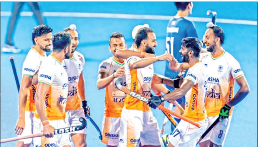
एशिया कप के दौरान भारतीय टीम।

इससे पहले एफआईएच प्रो लीग में प्रदर्शन निराशाजनक रहा। हरमनप्रीत सिंह की टीम नौ टीमों में आठवें स्थान पर रही और नीचे खिसकने से बाल बाल बची है। घरेलू चरण में भुवनेश्वर में पांच