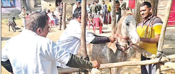
पशुओं की जांच करते डाक्टर।