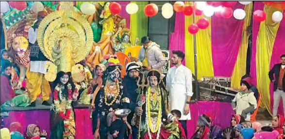
माता के जगराता में सजी झांकी।

फर्रुखाबाद। शुक्रवार को जिले में निजी कार्यक्रमों में शामिल होने आए उत्तर प्रदेश विधानसभा के अध्यक्ष सतीश महाना ने कहा आज बच्चों को संस्कारी बनाने की आवश्यकता है। मनुष्य के संस्कार ही उसके व्यवहार को प्रदर्शित करते हैं। फतेहगढ़ के एक विद्यालय में शुभारम्भ के अवसर पर पहुंचे सतीश महाना ने बच्चों के संस्कारों पर बल दिया। उन्होंने कहा कि वर्तमान समय के बच्चों में किसी भी बात को सुनने की क्षमता कम हो गयी। हमारा व्यवहार ही हमे दिये गये संस्कारों को प्रगट करते हैं। वर्तमान समय में महज कुछ ही सालों में टेकोलॉजी बदल जा रही है। लेकिन बचपन में दिये गये, संस्कार पूरे जीवन का आते हैं। इस मौके पर कई लोग मौजूद रहे।