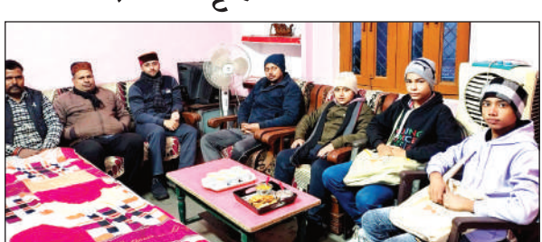
अभियान के दौरान मौजूद लोग।

निरीक्षण के दौरान सीएमओ ने रेन बसेरा में मरीजों के साथ आए तीमारदारों की व्यवस्थाओं का जायजा लिया। उन्होंने प्रभारी को निर्देश दिए कि लगातार पड़ रही ठंड को देखते हुए रेन बसेरा में हीटर, गद्दे और चादरों की उचित व्यवस्था सुनिश्चित की जाए। सीएमओ ने अस्पताल में साफ-सफाई बनाए रखने के भी सख्त निर्देश दिए। उन्होंने कहा कि मरीजों को बेहतर माहौल मिलना चाहिए।