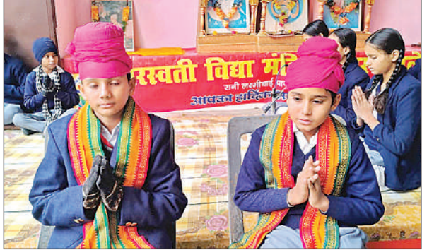
वीर बाल दिवस के कार्यक्रम में शामिल बच्चे।