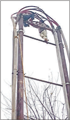
जीटी रोड आशा होटल के निकट फाल्ट ठीक करते बिजली विभाग के कर्मचारी।

मकरंदनगर ट्रांसमिशन सेंटर से मानपुर विद्युत उपकेंद्र के लिये 33000 केवी की अंडरग्राउंड लाइन डाली गई है। गुरुवार की रात करीब दो बजे लाइन में आशा होटल के निकट फाल्ट आ गया। इससे उपकेंद्र की बिजली सप्लाई बंद हो गई। रात व भीषण कोहरा होने के चलते फाल्ट खोजे नहीं मिला। सुबह सभी लाइनमैन को लाइन ब्रेक डाउन होने की जानकारी दी गई। इसके बाद