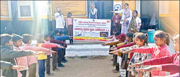
कन्या प्राथमिक विद्यालय धवरा में नशे से दूर रहने की शपथ लेते बच्चे।

कन्या प्राथमिक विद्यालय के बच्चों और शिक्षकों ने गांव में जागरूकता रैली निकाली। रैली गांव की हर गली व सड़कों से गुजरी और ग्रामीणों को तंबाकू व नशा न कराने के प्रति जागरूक किया। रैली में बच्चे हाथों में नशा से दूर रहने की स्लोगन लिखी तख्तियां लेकर चल रहे थे और देश को बचाना है तंबाकू