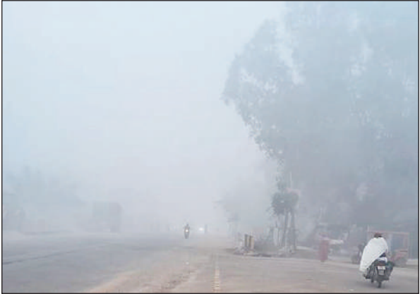
शनिवार की सुबह कोहरे के बीच रेंगते हुए चले वाहन।

कोहरे के बाद कड़ाके की ठंड और बर्फाली हवाओं ने आम आदमी का जीना दुश्वार कर दिया है। सुबह से धूप न निकलने और गलन भरी सर्दी से शनिवार को लोग घरों में दुबके रहे। कुछ लोगों ने घरों में ब्लोवर, रूमहीटर और अलाव जलाकर सर्दी से बचाव किया। इतना ही नहीं पालिका प्रशासन द्वारा तमाम चौराहो में अलाव के लिए लकड़ी की व्यवस्था न करने पर लोग कागज के गत्ते जलाकर