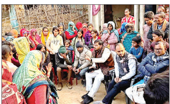
उमराहट गांव में पीड़ित परिवार के लोगों से मिलते बसपा नेता।