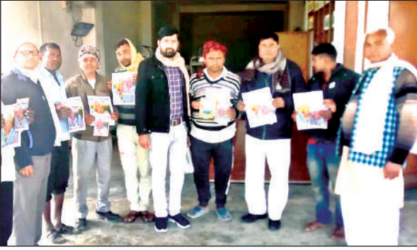
पत्रक बांटते संघ के पदाधिकारी।