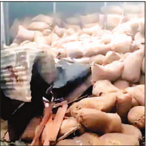
पलटा पड़ा धान से लदा ट्रक।

अमृत विचार। फर्रुखाबाद-बदायूं स्टेट हाईवे पर शनिवार सुबह अमृतपुर थाना क्षेत्र में लखनऊ से धान भरकर हरियाणा जा रहा एक ट्रक पलट गया। चपेट में आने से सात स्थानीय ठेली दुकानदारों के खोखे क्षतिग्रस्त हो गए।