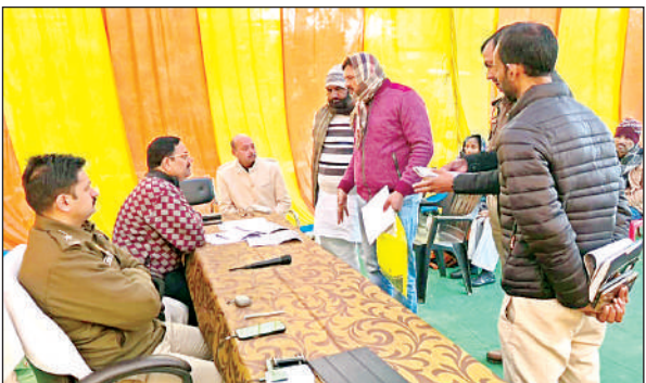
फरियादियों की शिकायतें सुनते डीएम व एसपी।