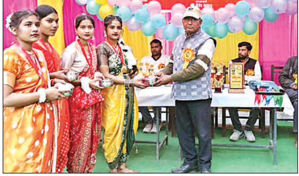
छात्राओं को हुनर का पुरस्कार देते प्रधानाचार्य।