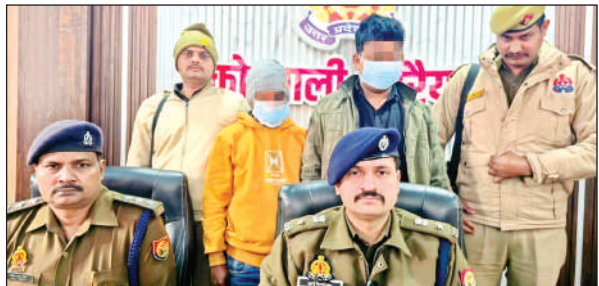
पुलिस गिरफ्त में हत्या के आरोपी ।