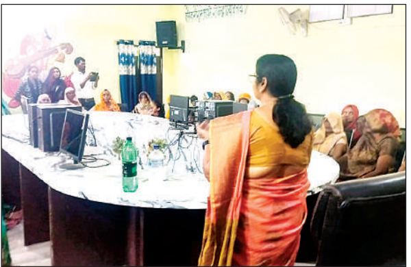
शिविर के दौरान जानकारी देती ग्राम प्रधान।

बताया कि बेल्ट बंधे होने से मवेशी की दूर से पहचान हो जाती है, इससे सड़क हादसों में काफी कमी आती है।