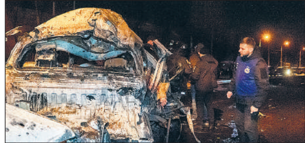
खाकिव में रूसी हवाई हमले में क्षतिग्रस्त वाहन का निरीक्षण करते पुलिसकर्मी।

स्थानीय अधिकारियों ने बताया कि बैलिस्टिक मिसाइल और ड्रोन के जरिये हमले से राजधानी में घंटों तक विस्फोट होते रहे। हमला शनिवार तड़के शुरू हुआ और दिन निकलने तक जारी रहा। यह हमला ऐसे समय हुआ है, जब यूक्रेन के राष्ट्रपति वोलोदिमिर