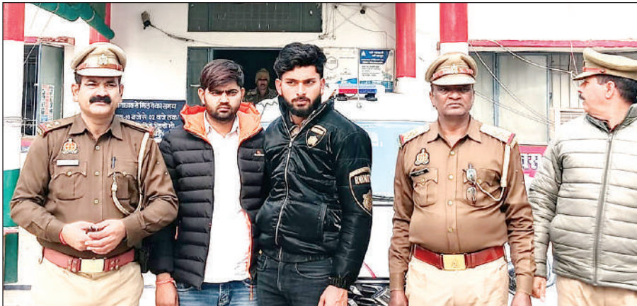
पुलिस की गिरफ्त में पकड़े गए आरोपी ।।