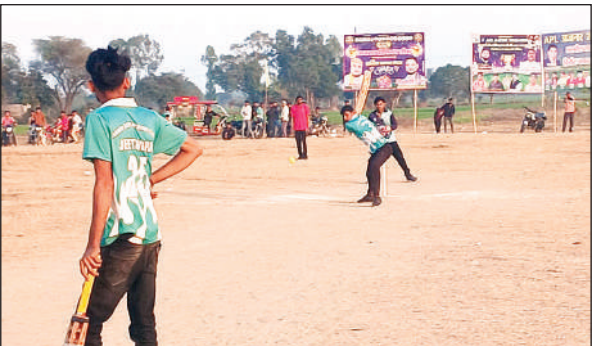
मैदान पर टीम को जीत दिलाने के लिए जुझते खिलाड़ी।