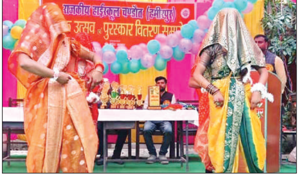
सांस्कृतिक कार्यक्रम प्रस्तुत करती छात्राएं।

कार्यक्रम में छात्राओं ने लोक नृत्य गायन, ढोलक बাদन, निबंध एवं वाद-विवाद प्रतियोगिता देशभक्ति गीतों में प्रस्तुतियां दीं। जिसमें मौजूद दर्शकों का मन मोह लिया। साथ ही खेलकूद प्रतियोगिता और बोर्ड