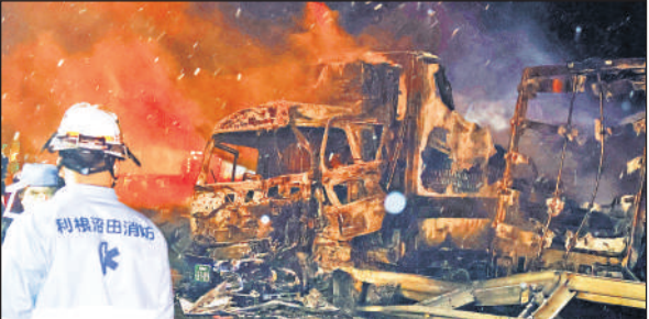
टोक्यो के उत्तर-पश्चिम में स्थित मिनाकामी में शनिवार की सुबह बर्फीले मौसम में एक्सप्रेसवे पर हुए भीषण हादसे के बाद जले हुए वाहन।

इस हादसे में लगभग 67 वाहन क्षतिग्रस्त हुए। मिनाकामी तोक्यो से करीब 160 किलोमीटर उत्तर-पश्चिम में है। पुलिस ने बताया कि हादसे में लोक्यों की 77 वर्षीय