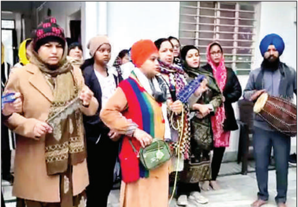
प्रभातफेरी में सबद-कीर्तन करते सिख समुदाय के लोग।

प्रभातफेरी आल्हा चौक, ऊदल चौक, जीजीआईसी तिराहा, बाजार होते हुए पुनः गुरुद्वारा पहुंचकर समाप्त हुई। प्रभातफेरी दौरान जो बोले सो निहाल, सत श्री अकाल, वाहे गुरु जी की खालसा, वाहे गुरु