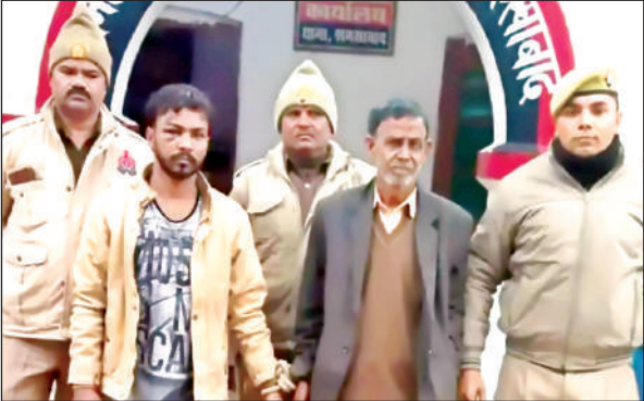
शमशाबाद पुलिस द्वारा गिरफ्तार किए गए आरोपी।