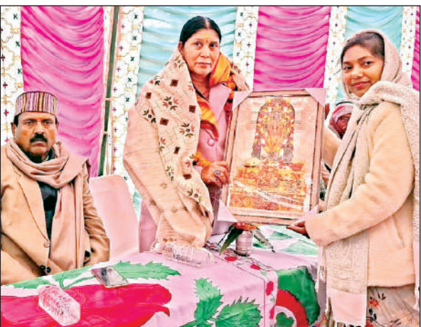
सांसद का स्वागत करतीं कालेज की प्रधानाचार्या।

में उर्वरक वितरण का अनुश्रवण कर टैगिंग, ओवर रेंटिंग या कालाबाजरी करने वाले विक्रेताओं के विरुद्ध उर्वरक नियंत्रण आदेश 1985 के अनुसार कार्रवाई करें। किसानों को विभागीय योजनाओं के बारे बताया जाए। इस समय जायद के लिए उर्द तथा मूंग की निशुल्क मिनीकिट की बुकिंग कृषि विभाग के पोर्टल से की जा रही है। इच्छुक किसान पोर्टल से बुकिंग कर लें कि उनको बीज