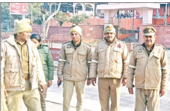
वाल्मीकी आश्रम के पास तैनात पुलिस अधिकारी और कर्मचारी।