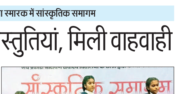
मुक्ताकाशीय मंच पर कार्यक्रम पेश करती छात्राएं।

आवासीय विद्यालयों के प्रबंधन की सराहना की। कहा कि आने वाले समय में ये बच्चे हर क्षेत्र में उल्लेखनीय उपलब्धियां हासिल