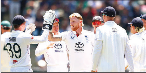
टीम के साथ जश्न मनाते इंग्लैंड के कप्तान बेन स्टोक्स।

इंग्लैंड की टीम ने ऑस्ट्रेलिया में इससे पहले आखिरी बार 2010-11 की श्रृंखला में मैच जीता था। उसने तब यह श्रृंखला 3-1 से अपने नाम की थी। इसके बाद इंग्लैंड ने ऑस्ट्रेलिया में खेले गए लगभग 15 वर्षों में 18 टेस्ट मैचों में से 16 मैच हारे थे जबकि बाकी दो मैच ड्रा रहे। पहली पारी में 152 रन बनाने वाली