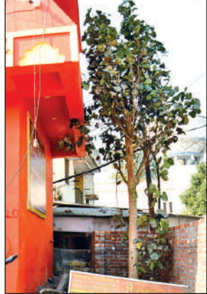
मंदिर के समीप लगाया गया पीपल का वृक्ष।