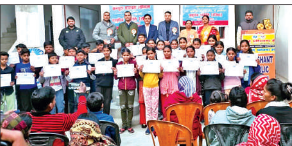
काशीपुर में प्रशिक्षण कार्यक्रम के बाद प्रमाण पत्र के साथ अभ्यर्थी।