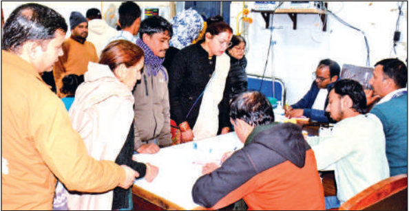
हल्द्वानी बेस अस्पताल में शनिवार को इमरजेंसी में उपचार को पहुंचे मरीज।