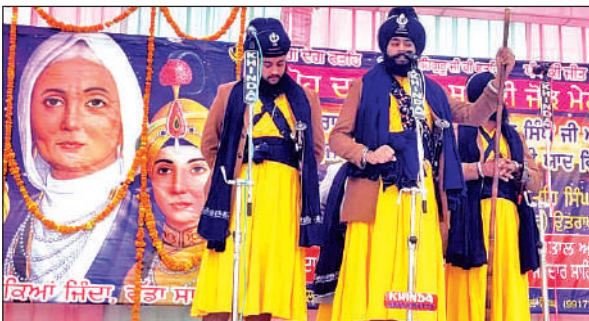
गुरुओं की महिमा का गुणगान करते धार्मिक जत्थे।