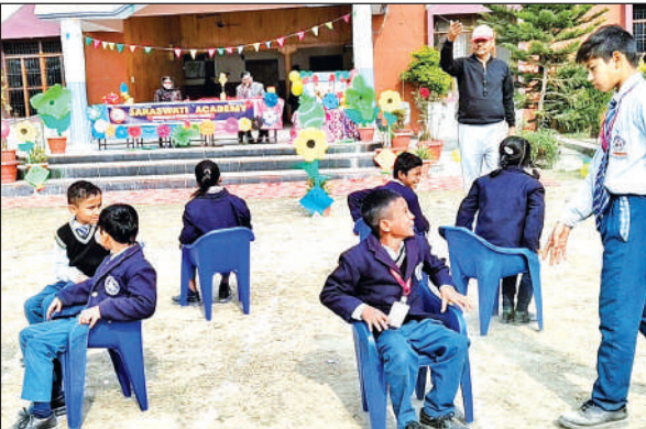
सरस्वती एकेडमी बिगराबाग में हुई म्यूजिकल चेयर रेस में प्रतिभाग करते बच्चे।