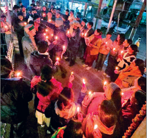
अल्मोड़ा में कैंडल मार्च निकालते कांग्रेस कार्यकर्ता। ● अमृत विचार

रानीखेत : नगर क्षेत्र में तेंदुओं का आतंक लगातार बढ़ता जा रहा है। सुभाष चौक पार्क के आसपास विगत कुछ दिनों में आधा दर्जन से अधिक पालतू कुत्तों के रहस्यमय तरीके से गायब होने की घटनाएं सामने आई हैं। रात्रि में तेंदुआ कुत्तों को अपना निवाला बन रहा है। हमले के डर से लोगों में दहशत है। केम्पू स्टेशन क्षेत्र के दुकानदारों और लोगों का कहना है कि रात में तेंदुओं द्वारा कुत्तों पर हमला करने की आवाजें साफ सुनाई देती हैं। सुबह पालतू कुत्ते गायब मिलते हैं। नगर में तेंदुओं के शिंहायशी इलाकों में घुसने की चर्चा आम है। हालात ऐसे हैं कि लोग रात में घरों से बाहर निकलने से डरने लगे हैं। लोगों ने वन विभाग से इलाके में गश्त बढ़ाने, पिंजरे लगाने की मांग की है।