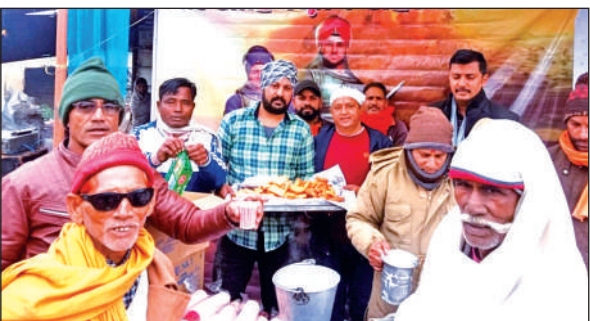
दिनेशपुर में गुरु साहिब के पुत्रों की शहादत की स्मृति में लगा दूध का लंगर।