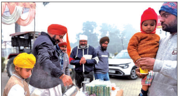
बाजपुर में रायल गार्डन के सामने दूध के लंगर की सेवा करते श्रद्धालु।