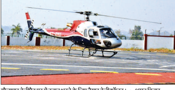
गौलापार हेलीपैड पर में उड़ान भरने के लिए तैयार हेलीकॉप्टर। ● अमृत विचार

हेली सेवा के तहत हल्द्वानी से चंपावत, पिथौरागढ़, अल्मोड़ा, मुनस्वारी और बागेश्वर के लिए नियमित उड़ानें संचालित की जा रही हैं। हल्द्वानी से चंपावत