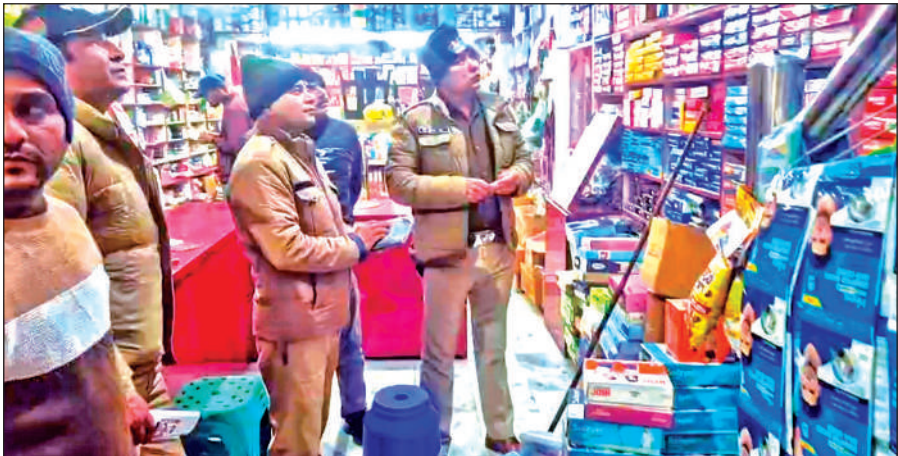
किच्छा में सीसीटीवी फुटेज की जांच करती पुलिस टीम।