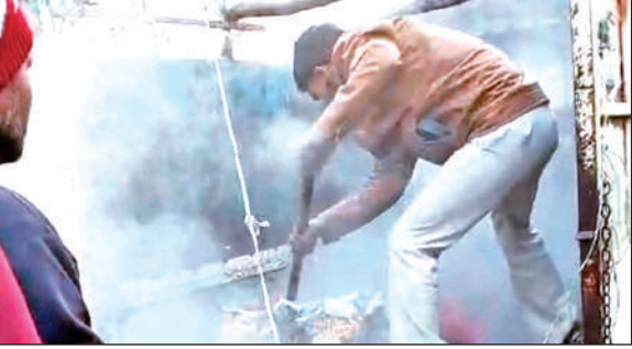
बाजपुर के बरहैनी में टाटा एस वाहन में सामान में लगी आग बुझाते ग्रामीण।

प्रत्यक्षदर्शियों के अनुसार वाहन हाईवे के किनारे खड़ा था। इसी दौरान अज्ञात कारणों से उसमें धुआं उठता दिखा और कुछ ही क्षणों में आग की लपटें तेज हो गईं। वाहन चालक और आसपास मौजूद लोग कुछ समझ पाते, इससे पहले ही आग ने सामान को अपनी चपेट में ले लिया। आग की सूचना