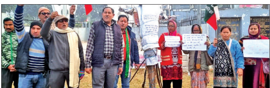
भाजपा सरकार का पुतला फूँकते यूकेडी कार्यकर्ता।