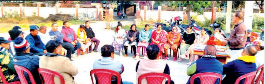
खटीमा में उत्तरायणी कौतिक को लेकर बैठक करते कुमाऊं सांस्कृतिक उत्थान समिति के पदाधिकारी।