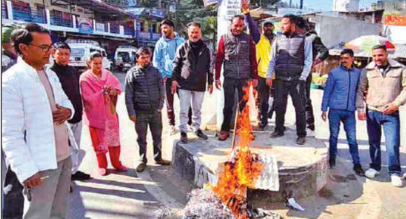
लोहाघाट में कांग्रेस का पुतला फूंकते भाजपा कार्यकर्ता। ● अमृत विचार

अल्मोड़ा: मेडिकल कॉलेज के अधीन बेस अस्पताल के इंएनटी विभाग में कार्यरत एक महिला प्रोफेसर साइबर ठगों के जाल में फंस्ने से समय रहते बच गईं। मामले को गंभीर मानते हुए उन्होंने वरिष्ठ पुलिस अधीक्षक को लिखित शिकायत देकर जांच और कार्रवाई की मांग की है। प्रोफेसर के अनुसार 24 दिसंबर को दोपहर के समय उन्हें एक कथित कोरियर कंपनी की ओर से फोन आया। कॉल करने वाले ने उनके पैतृक घर मुखानी, हल्द्वानी में पार्सल पहुंचाने की बात कही और किसी अन्य व्यक्ति से संपर्क करने को कहा। प्रोफेसर द्वारा स्वयं कॉल करने की बात कहने पर उसने बहाना बनाकर टाल दिया। इसके बाद एक संदेश भेजा गया और उसी नंबर पर संपर्क करने पर पैसों की मांग शुरू हो गई। क्राट्सएफ के जरिए 30 हजार रुपये भेजने का दबाव बनाया गया और किसी आपात स्थिति का हवाला दिया गया। संदेह होने पर प्रोफेसर ने तुरंत बातचीत बंद कर दी। इसके बावजूद उग ने उनके परिचितों को संदेश भेजकर रुपये मांगने की कोशिश जारी रखी। घटना के बाद इंएनटी विभाग की प्रोफेसर ने पुलिस को मामले की जानकारी देकर साइबर ठगों पर कार्रवाई की मांग की है। एसएसपी देवेन्द्र पीचा ने बताया कि मामले की जांच की जा रही है। उन्होंने लोगों से ऐसे ठगों से सतर्क रहने को कहा है।