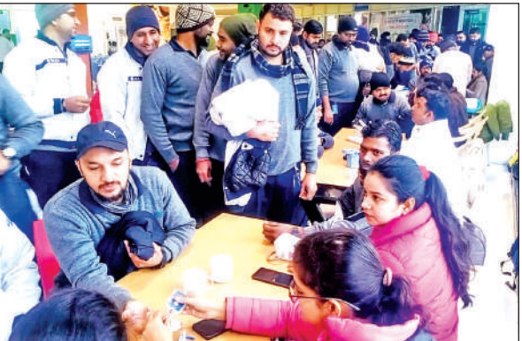
सिडकुल कंपनी कर्मियों की जांच करती स्वास्थ्य टीम। ● अमृत विचार

लाभार्थियों को टीबी स्क्रीनिंग के लिए काउंसलिंग हुई और स्वास्थ्य की विस्तारपूर्वक जानकारी ली। सभी लाभार्थियों का एक्सरे किया गया। स्वास्थ्य स्क्रीनिंग के लिए लाभार्थियों का एच आई वी-