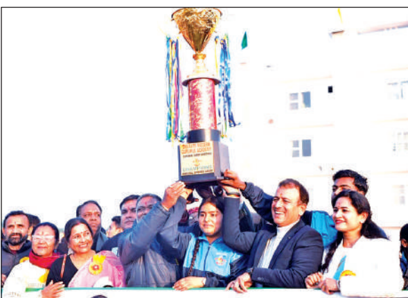
खटीमा में चैंपियन डिस्कवरी हाउस को ट्रॉफी भेंट करते अतिथि।