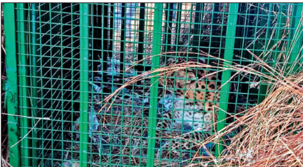
बाराकोट ब्लॉक के गांव में पिंजरे में कैद हुआ गुलदार । ● अमृत विचार

अमृत विचार: बाराकोट ब्लाक में ओखलंज गांव में आतंकी गुलदार पिंजरे में कैद कर लिया गया है। विकास खंड मे डेढ़ माह के भीतर तीन गुलदार कैद हो चुके हैं। दो गुलदार पिंजरे में जबकि एक को ट्रैकुलाइज कर पकड़ा गया है। ओखलंज में पकड़े गए गुलदार की उम्र चार से पांच वर्ष बताई जा रही है।