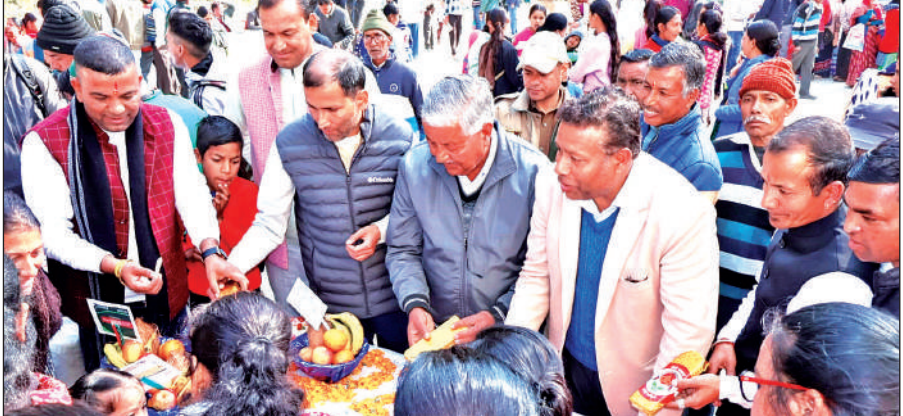
राइका अमोड़ी में आयोजित जन-जन की सरकार, जन-जन के द्वार कार्यक्रम का उद्घाटन करते अतिथि । ● अमृत विचार