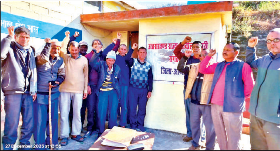
नगरखान में बैठक में भाग लेने पहुंचे राज्य आंदोलनकारी नारेबाजी करते हुए। ● अमृत विचार

वक्ताओं ने राज्य स्थापना के रजत जयंती वर्ष में पेंशन में की गई मामूली वृद्धि पर भी नाराजगी