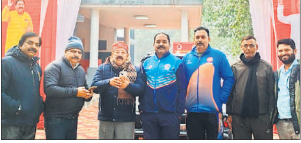
65 वां वार्षिक अधिवेशन की जानकारी देते संगठन के पदाधिकारी।