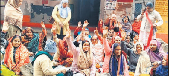
गोला सीएचसी में धरने पर बैठी आशा कार्यकर्त्री और सगिनी।