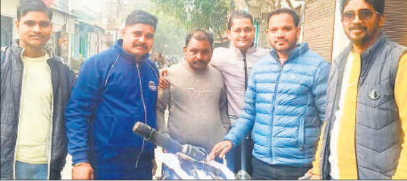
गोला में मतदान से चुनाव कराने के लिए हस्ताक्षर करते समाज के लोग।