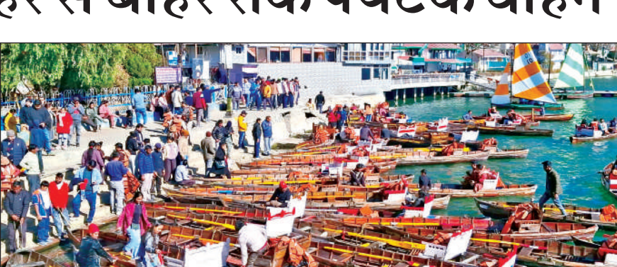
वीकेंड पर नैनीताल में उमड़ी पर्यटकों की भारी भीड़।