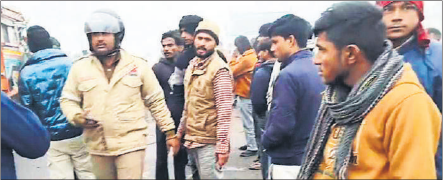
मौके पर राहत व बचाव कार्य कराती पुलिस।

हादसा शनिवार सुबह करीब आठ बजे जनपद संभल की तहसील गुनौर के थाना रजपुरा क्षेत्र अंतर्गत गांव सिरसा के पास हुआ। कोहरे के कारण सड़क पर दृश्यता बेहद कम थी। बताया गया कि दोनों वाहन तेज रफ्तार में थे। अचानक सामने आने पर चालकों को कुछ दिखाई नहीं दिया और पिकअप व ट्रक की आमने-सामने जोरदार टक्कर हो गई। टक्कर इतनी भीषण थी कि ट्रक का अगला हिस्सा बुरी तरह क्षतिग्रस्त हो गया,