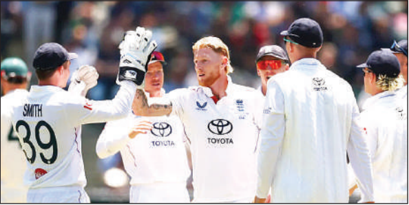
टीम के साथ जश्न मनाते इंग्लैंड के कप्तान बेन स्टोक्स।

इंग्लैंड की टीम ने ऑस्ट्रेलिया में इससे पहले आखिरी बार 2010-11 की श्रृंखला में मैच जीता था। उसने तब यह श्रृंखला 3-1 से अपने नाम की थी। इसके बाद इंग्लैंड ने ऑस्ट्रेलिया में खेले गए लगभग 15 वर्षों में 18 टेस्ट मैचों में से 16 मैच हारे थे जबकि बाकी दो मैच ड्रा रहे। पहली पारी में 152 रन बनाने वाली