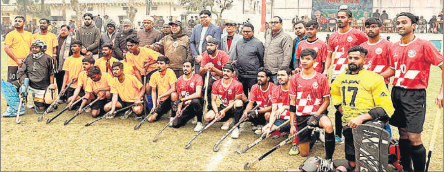
हॉकी टूर्नामेंट में विजयी टीम के साथ अतिथि और शिक्षक।