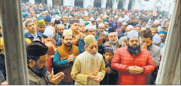
कुल की रस्म में अकीदतमंद।