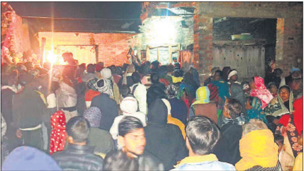
शव पहुंचने के बाद घर के बाहर लगी भीड़।

श्री गुरु गोबिंद सिंह जी का संपूर्ण जीवन अन्याय के विरुद्ध संघर्ष और कमजोर वर्ग के साथ खड़े रहने की प्रेरणा देता है। समाज के प्रति हमारी जिम्मेदारी है कि हम जरूरतमंदों की सहायता करें। भविष्य में भी ऐसे सेवा कार्य निरंतर जारी रहेंगे।