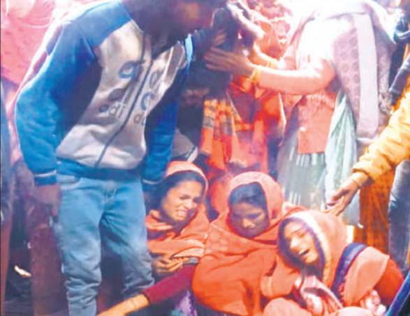
इमलिया गांव में रोती बिलखती परिवार की महिलाएं।

● पुलिस प्रशासन रहा मौजूद, अज्ञात डंपर की टक्कर से हुई थी दोनों की मौत देर शाम दोनों का पोस्टमार्टम होने के बाद शव गांव पहुंचे तो गांव में शोक की लहर दौड़ गई। शनिवार दोपहर दोनों भाइयों की अंतिम यात्रा साथ-साथ निकाली गई। दोनों शवों को इमलिया गांव में उनके ही बाग में दो चिताएं पास-