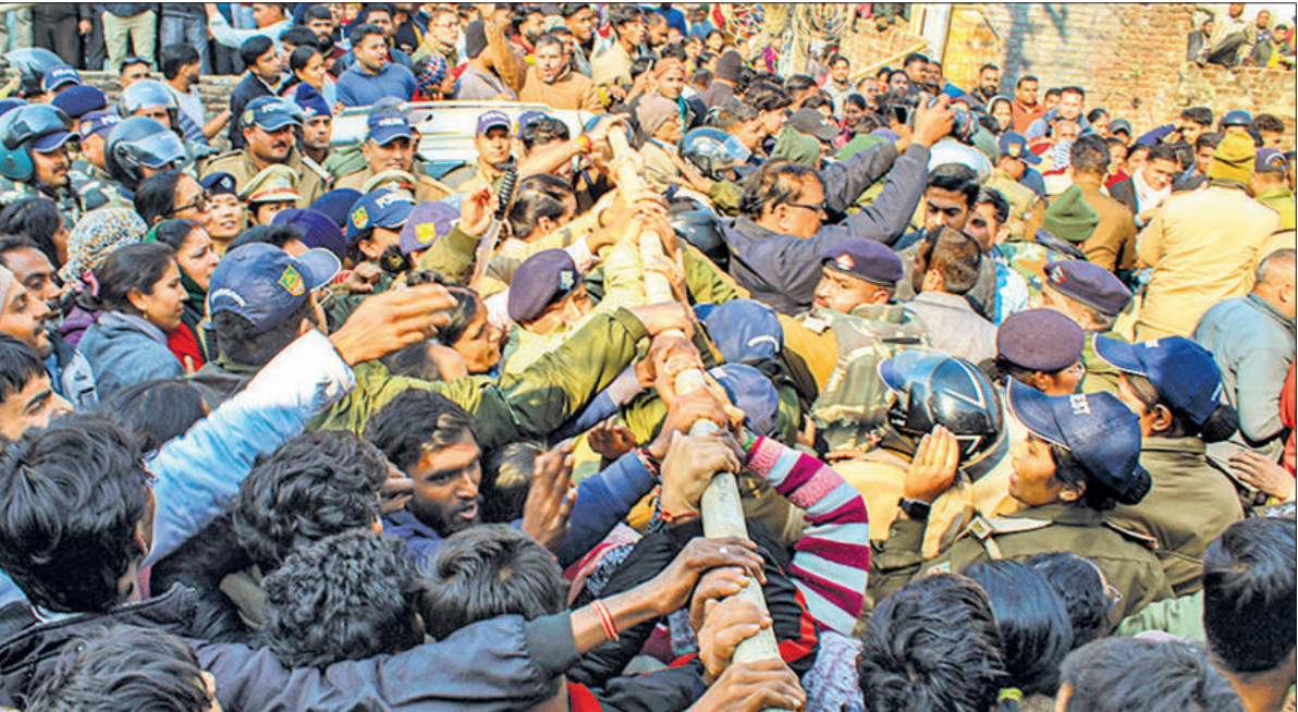
जोर आजमाइश सरकारी वन भूमि के पट्टे की जांच के लिए सर्वोच्च न्यायालय के आदेश के बाद ऋषिकेश में शनिवार को सर्वेक्षण दल के पहुंचने पर प्रदर्शन करते प्रदर्शनकारियों को रोकती पुलिस। कईयों को हिरासत में भी लिया गया।