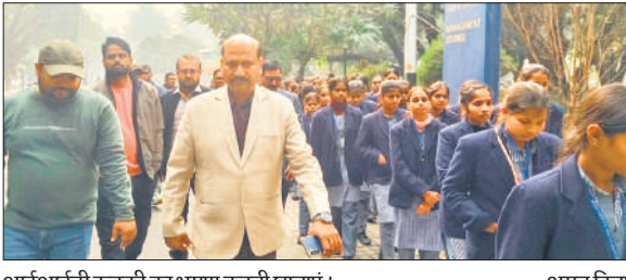
आईआईटी रुड़की का भ्रमण करती छात्राएं।