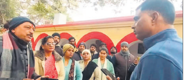
कोतवाली का घेराव करती महिलाओं को समझाती पुलिस।

उन्होंने अपनी कविताओं व भजनों के माध्यम से सिक्ख धर्म में बलिदान, साहस और आस्था के महत्व को अत्यंत सरल शब्दों में समझाकर संगत को निहाल