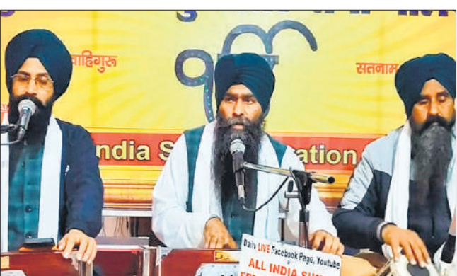
गुरुद्वारे में शबद-कीर्तन करते रागी जय्थे के सदस्य।