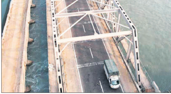
बनकर तैयार हुआ हरदोई ब्रांच नहर पुल।