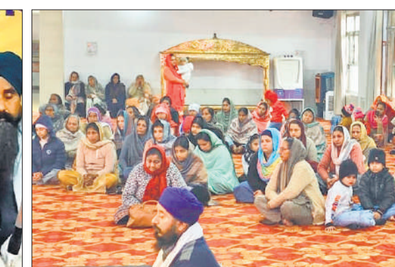
भावपूर्ण माहौल में सुनती संगत।

सूचना मिलते ही ग्रामीणों में दहशत फैल गई। किसान और मजदूर खेतों की तरफ जाने से कतरा रहे हैं। इससे गन्ने की छिलाई का कार्य भी प्रभावित हो रहा है। लगातार तेंदुए की मौजूदगी के बावजूद वन विभाग की ओर से अब तक कोई ठोस कार्रवाई न होने से लोगों में नाराजगी है।