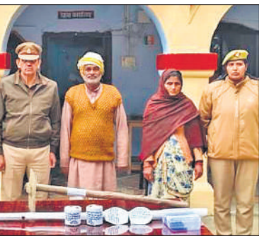
हत्यारोपी दंपती को जेल भेजती पुलिस।