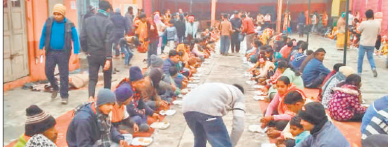
भंडारे का प्रसाद ग्रहण करते भ्रदालु।