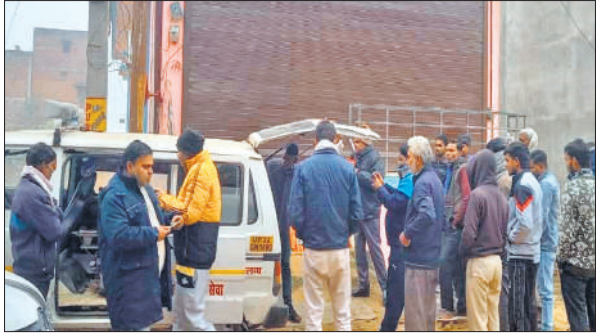
गोला में अस्पताल बंद, खड़ी एंबुलेंस, मौजूद लोग।

लेकर सीएचसी आए, जहां महिला डॉक्टर ने दवाई देने के बाद बताया कि नॉर्मल डिलीवरी नहीं हो पाएगी। इसके बाद उनके गांव की आशा ने भरोसा दिलाकर शुक्रवार की दोपहर रिकी को भुसीरिया रोड स्थित एक प्राइवेट अस्पताल में भर्ती कराया, जहां अस्पताल स्टाफ ने सुरक्षित डिलीवरी के नाम पर उनसे 28 हजार 500 रुपए जमा कराए। उन्होंने आरोप लगाया कि शाम को अस्पताल के