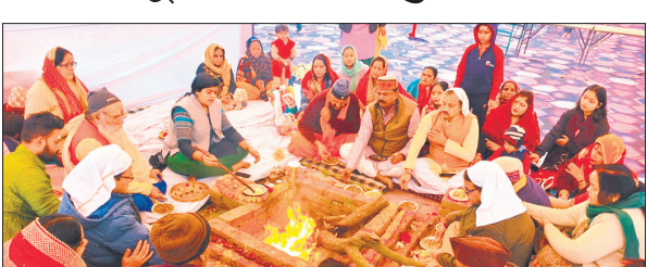
धोपेश्वरनाथ मंदिर में हवन पूजन में शामिल पुजारी व भक्त।