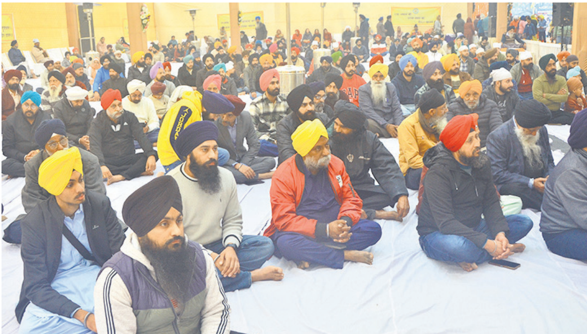
गुरु गोविंद सिंह के प्रकाश पर्व पर बरेली कॉलेज के हॉकी मैदान में सजे मुख्य दीवान में मौजूद संगत।