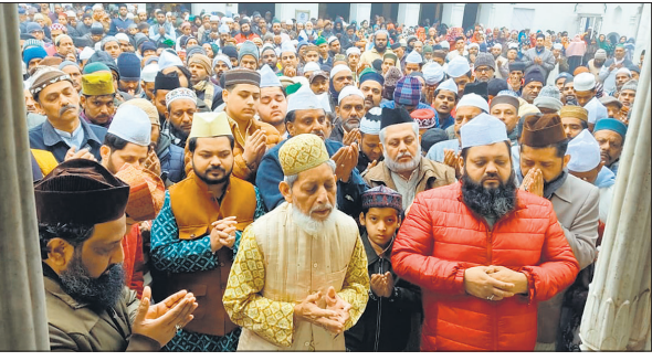
खानकाह नियाजिया में गरीब नवाज के कुल शरीफ की रस्म अदा करते हुए।