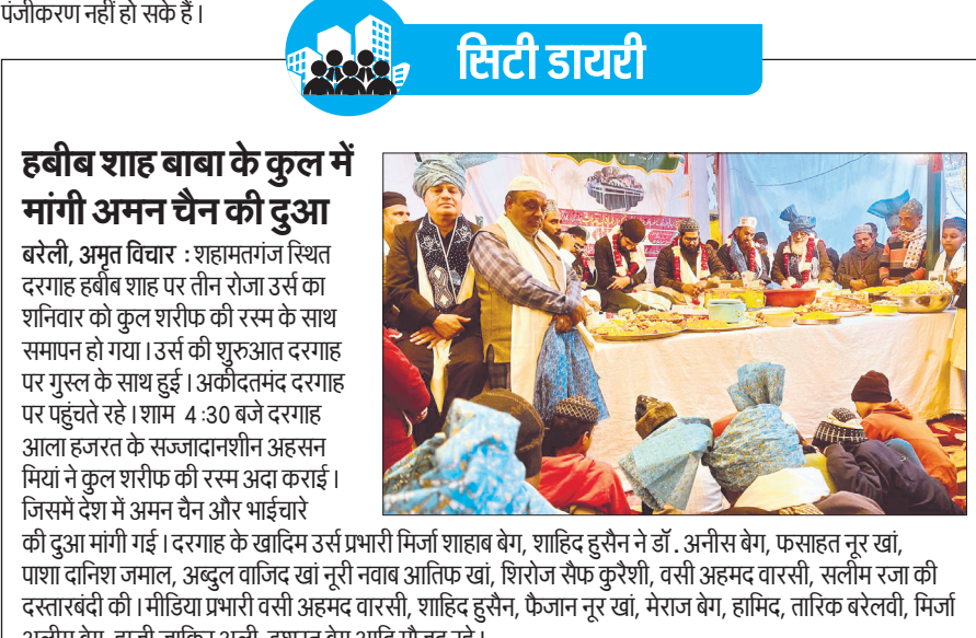
हबीब शाह बाबा के कुल में मांगी अमन चैन की दुआ