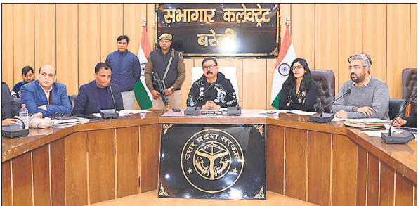
कलेक्ट्रेट सभागार में दशमोतर छात्रवृत्ति योजना की समीक्षा करते डीएम।

को अवगत कराएं। डीएम ने कहा कि छात्रवृत्ति योजना मुख्यमंत्री की प्राथमिकताओं में से एक है, इसमें किसी प्रकार की लापरवाही न बरतें। निर्देश दिए कि शिक्षण संस्थानों में शिफ्टवार ड्यूटी लगाते हुए छात्रवृत्ति का डाटा फॉरवर्ड कराने और फीडिंग की दिशा में कार्य कराएं। सुबह और देर रात में पोर्टल पर लोड कम होता है, इसलिए उस समय पर विशेष रूप से काम कराएं। डीएम ने सभी शिक्षण संस्थानों को समाज कल्याण विभाग, पिछड़ा वर्ग कल्याण विभाग,