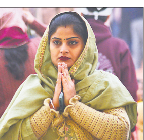
मथा टेकती संगत।