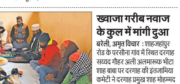
खाजा गरीब नवाज के कुल में मांगी दुआ