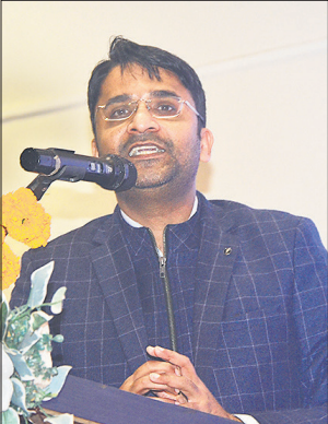
एगजीक्यूटिव क्लब में आयोजित सम्मेलन में बड़ी संख्या में चार्टर्ड अकाउंटेंट शामिल हुए।