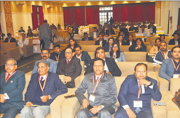
राष्ट्रीय सम्मेलन में उपस्थित चार्टर्ड अकाउंटेंट।