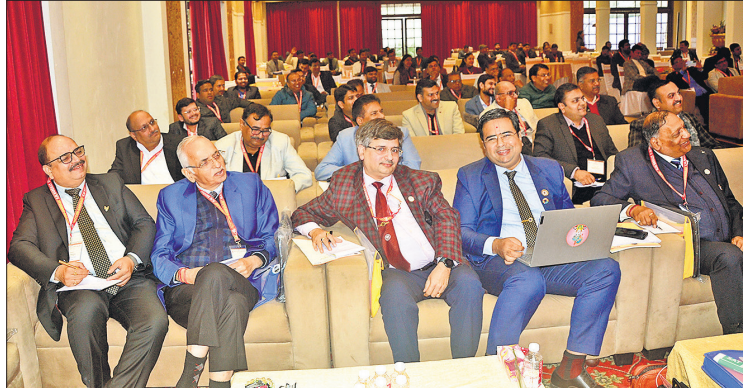
एगजीक्यूटिव क्लब में आयोजित सम्मेलन में बड़ी संख्या में चार्टर्ड अकाउंटेंट शामिल हुए।