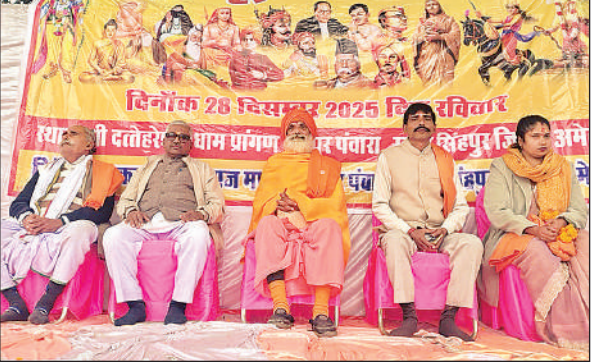
रामपुर पंवारा में आयोजित हिंदू सम्मेलन में मौजूद अतिथि।