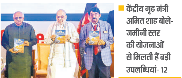
● केंद्रीय गृह मंत्री अमित शाह बोले- जमीनी स्तर की योजनाओं से मिलती हैं बड़ी उपलब्धियां- 12