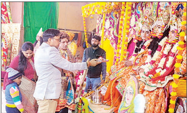
महोत्सव के दौरान आरती करते मुख्य अतिथि।

हर वर्ष की भांति इस बार भी महोत्सव में आसपास के गांवों से बड़ी संख्या में श्रद्धालु और दर्शक पहुंच रहे हैं। मंच पर कलाकारों द्वारा प्रस्तुत लीलाओं ने पौराणिक