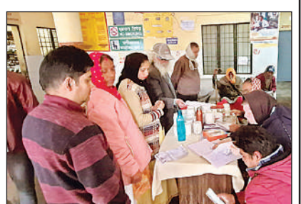
पीएचसी में स्वास्थ्य मेले में मौजूद मरीज।