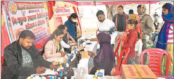
शिविर में मरीजों की जांच करते स्वास्थ्य कर्मी।