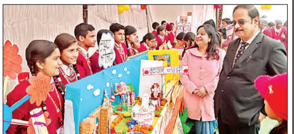
एग्जिबिशन के दौरान मॉडल का अवलोकन करते डायरेक्टर और प्रधानाचार्या।

शुक्लागंज। आनंद नगर स्थित शिवम कन्वेंट स्कूल द्वारा रविवार को 'चेरिश-25 एनुअल एग्जिबिशन एवं कार्निवल' कार्यक्रम का आयोजन किया गया। कार्यक्रम में विद्यालय के छात्र-छात्राओं ने विज्ञान, साहित्य और गणित विषयों पर आधारित आकर्षक प्रोजेक्ट प्रस्तुत किए। प्रदर्शनी में बच्चों की रचनात्मकता और बौद्धिक क्षमता देखने को मिली। कार्यक्रम के दौरान बच्चों के मनोरंजन के लिए विभिन्न खेलों का आयोजन किया गया। साथ ही फूड स्टॉल और मनोरंजन गतिविधियों ने कार्यक्रम को और भी आकर्षक बना दिया। विद्यालय प्रबंधन ने बताया कि इस आयोजन का