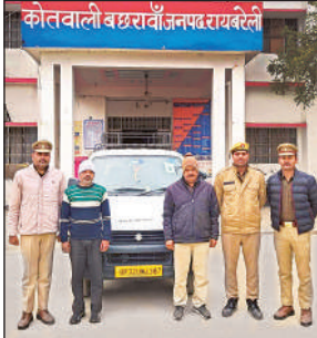
बछरावां पुलिस की गिरफ्त में आरोपी।

स्थित छोटकवा खेड़ा पुलिया के पास मिला। सूचना पर थाना बछरावां पुलिस टीम द्वारा मय फॉरेंसिक टीम मौके पर पहुंच कर घटनास्थल का निरीक्षण कर मृतक के शव को कब्जे में लेकर पोस्टमार्टम के लिए भेज था। पोस्टमार्टम रिपोर्ट में मृत्यु का कारण घातक चोटों से होना दर्शाया गया।