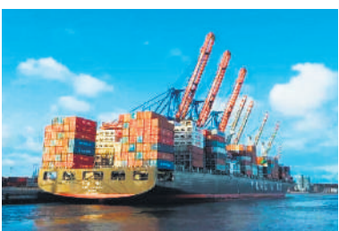
■ अमेरिकी शुल्क के बावजूद भारत का निर्यात स्थिर भारतीय बाजारों में विविधता से मिली मजबूती- 12