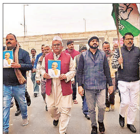
जगतपुर क्षेत्र में मनरेगा बचाओ मार्च निकालते लोग।