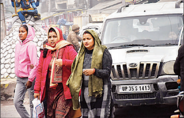
सर्दों से बचने के लिये ऊनी कपड़े पहनकर जाती महिलाएं।

ऊनी कपड़े पहनकर निकले लोग भी गलन से परेशान रहे। रात के समय नगर की सड़कों पर चहल-पहल कम हो गई। राहगीरों और विशेषकर दोपहिया वाहन चालकों की मुसीबतें बढ़ गई हैं। मौसम विभाग के अनुसार आने वाले दिनों में ठंड और बढ़ने की संभावना जताई जा रही है, जिससे लोगों की परेशानी और बढ़ सकती है।