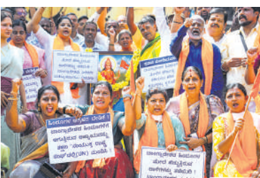
■ बांग्लादेश सरकार का दावा- उस्मान हादी के दो संदिग्ध हत्यारे भारत भागे - 13