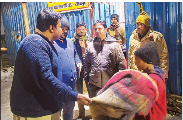
रैन बसेरा के निरीक्षण के दौरान बच्चे से बात करते डीएम।