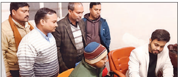
शिविर में मरीजों की जांच करते डॉक्टर।