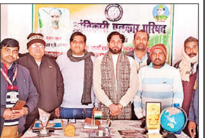
बैठक में मौजूद पत्रकार संघ।।