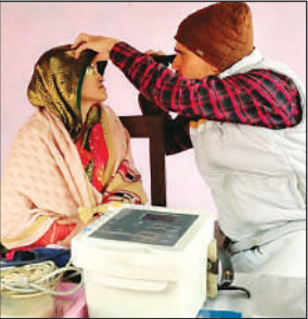
शिविर में मरीजों का नेत्र परीक्षण करते चिकित्सक ।

शिविर में 112 मरीजों की ओपीडी में देख कर मोतियाबिंद, सबलबाई, बीपी, शुगर आदि की जांच की गई। जिसमें 18 लोगों का मोतियाबिंद आपरेशन का चयन कर अस्पताल भेजा गया। 45 लोगों