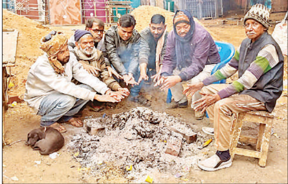
दोपहर के समय राजधानी मार्ग पर अलाव की आंच लेते लोग।

दिसंबर के अधिकांश दिनों में मौसम सामान्य रहा, लेकिन रविवार को अचानक मौसम ने करवट ली। सुबह से ही घना कोहरा छाया रहा, जिससे हाईवे, बैराज मार्ग, आजाद मार्ग और नवीन पुल पर वाहनों की रफ्तार थम सी गई। वाहन चालकों को बेहद धीमी गति से गुजरना पड़ा। दोपहिया वाहन सवारों को फॉग लाइट जलाकर निकलना पड़ा।