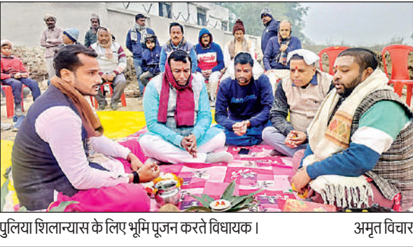
पुलिया शिलान्यास के लिए भूमि पूजन करते विधायक।