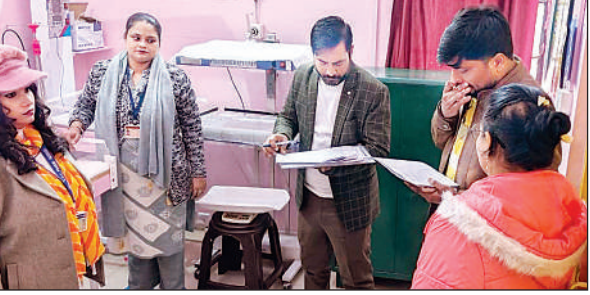
अभिलेखों की जांच करती दो सदस्यीय टीम ।

निरीक्षण के दौरान सीएचसी पिहानी के साथ-साथ पिहानी क्षेत्र के रैगांई, जहानीखेड़ा, कुंइया, भोगियापुर और सहादत नगर स्थित प्राथमिक स्वास्थ्य केंद्रों का भी जायजा लिया गया। टीम ने