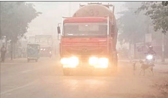
कोहरे की फुहारों से निकलते लोग ।