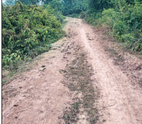
जमुर्वा बसकटा गांव का कच्चा रास्ता।