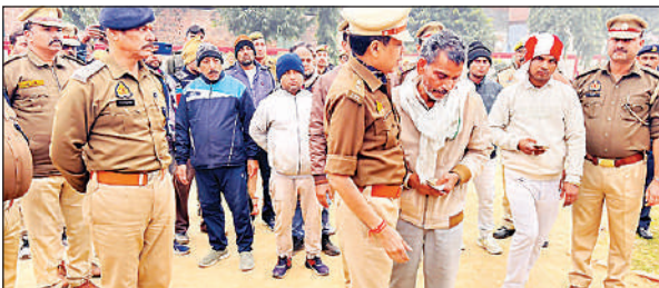
पिता को दांडस बंधाते एसपी।