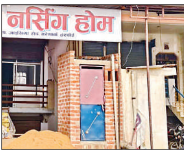
क्षेत्र में बोर्ड लटककर चलते मानकविहीन अस्पताल ।