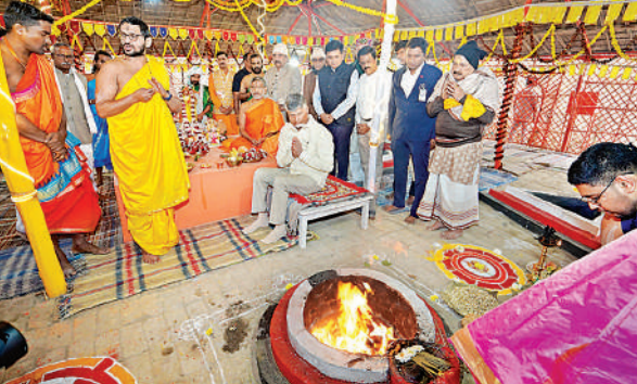
श्रीराम मंदिर में आयोजित अनुष्ठान में पूजन करते आंध्र प्रदेश के मुख्यमंत्री चंद्रबाबू नायडू।