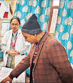
अस्पताल में निरीक्षण करती टीम।