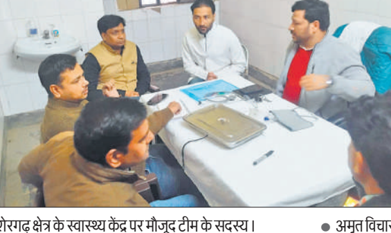
शेरगढ़ क्षेत्र के स्वास्थ्य केंद्र पर मौजूद टीम के सदस्य।

अमृत विचार : लखनऊ से आई टीमों ने रविवार को मीरगंज और शेरगढ़ क्षेत्र में जन आरोग्य मेला, आयुष्मान आरोग्य मंदिरों का निरीक्षण किया। इस दौरान सुकटिया आरोग्य मंदिर में दवाओं का अभाव मिला। टीम ने स्टाफ को व्यवस्थाओं को दुरुस्त रखने के निर्देश दिए। हालांकि, अन्य स्थानों पर व्यवस्थाएं चाक चौबंद मिलीं। शेरगढ़ : चार दिवसीय ब्लाक शेरगढ़ के दौरे पर निकली लखनऊ की टीम ने तीसरे दिन रविवार को प्राथमिक स्वास्थ्य केंद्रों पर मुख्यमंत्री आरोग्य मेले में चिकित्सकीय व्यवस्थाओं को परखा। टीम ने लैब, टीकाकरण आदि को देखा। टीकाकरण कराने पहुंची महिलाओं और सामान्य मरीजों से प्राथमिक स्वास्थ्य केंद्रों पर मिलने वाली स्वास्थ्य सेवाओं