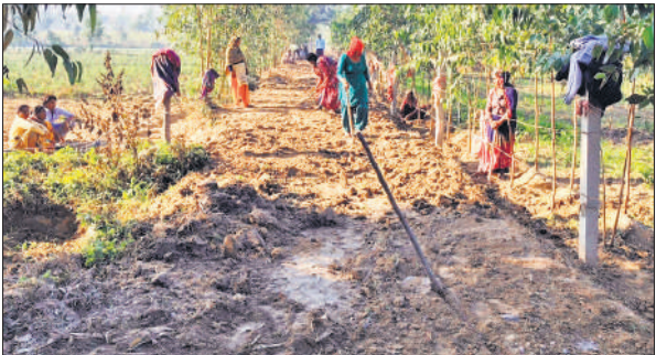
एक गांव में मनरेगा के तहत चल रहा कार्य। (फाइल फोटो)

आने वाले समय में आरक्षण की स्थिति साफ होने के बाद गांवों की सियासत और भी ज्यादा तेज होने की संभावना है। प्रधान पद से लेकर क्षेत्र पंचायत और जिला पंचायत सदस्य तक के लिए दावेदार सामने आने लगे हैं। हर कोई अपनी दावेदारी मजबूत करने में जुटा है। संभावित प्रत्याशी ग्रामीणों के सुख-दुख में शामिल