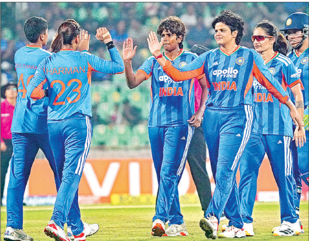
जीत का जश्न मनाती भारतीय महिला टीम।

ने इससे पहले वेस्टइंडीज के खिलाफ दिसंबर 2024 में चार विकेट पर 217 रन बनाए थे। ऋद्धा घोष (16 गेंद में नाबाद 40) और कप्तान हरमनप्रीत कौर (नाबाद 16) ने तीसरे विकेट के लिए 23