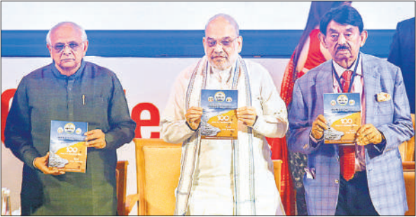
नेटकॉन में केंद्रीय गृह मंत्री अमित शाह और गुजरात के मुख्यमंत्री भूपेंद्र पटेल।

उन्होंने कहा कि आयुष्मान भारत और मिशन इंद्रधनुष जैसी विभिन्न स्वास्थ्य योजनाओं से मलेरिया में 97 प्रतिशत कमी आई है और हम जल्द मलेरिया से मुक्त होंगे। सरकार डेंगू से होने वाली मृत्यु दर को घटाकर एक प्रतिशत तक लाने में सफल रही है। मातृ मृत्यु दर में 25% की कमी आई है। केंद्र का स्वास्थ्य बजट 2014 के 37,000 करोड़ रुपये से बढ़कर प्रधानमंत्री मोदी के शासनकाल में अब 1.28 लाख करोड़