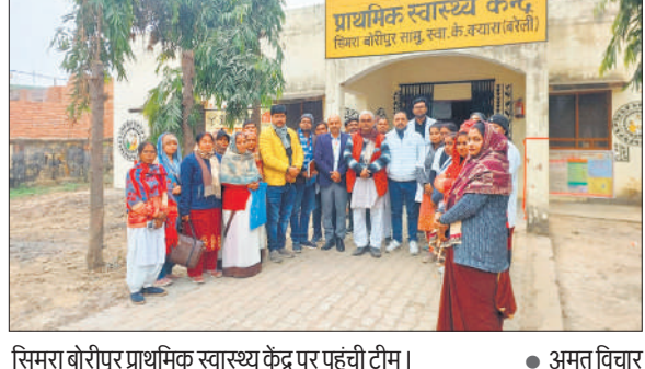
सिमरा बोरीपुर प्राथमिक स्वास्थ्य केंद्र पर पहुंची टीम।