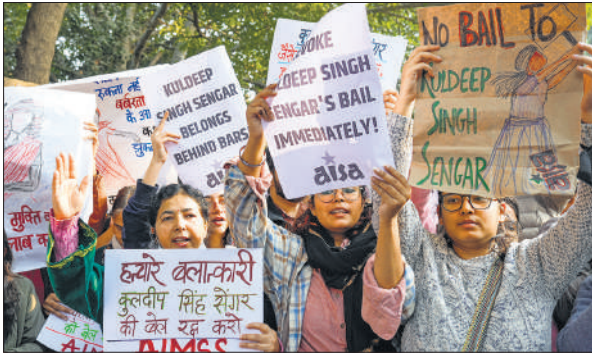
सेंगर की सजा निलंबित करने के विरोध में जंतर–मंतर पर प्रदर्शन करती महिलाएं।

दिल्ली हाईकोर्ट ने 23 दिसंबर को सेंगर की अपील लंबित रहने