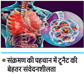
● संक्रमण की पहचान में टूनेट की बेहतर संवेदनशीलता

अमृत विचार : ट्यूबरकुलोसिस (टीबी) के लिए सबसे ज्यादा इस्तेमाल होने वाले डायग्नोस्टिक टेस्ट- स्मीयर माइक्रोस्कोपी की सीमित संवेदनशीलता के कारण बड़ी संख्या में टीबी के मामले बिना पता चले रह जाते हैं। इस बात का खुलासा ऑल इंडिया इंस्टीट्यूट ऑफ मेडिकल साइंसेज (एम्स), गोरखपुर द्वारा किए गए और इंटरनेशनल जर्नल ऑफ माइक्रोबैक्टीरियोलॉजी में प्रकाशित अध्ययन में हुआ है। अध्ययन के अनुसार, 4,249 पल्मोनरी और एक्स्ट्रा-पल्मोनरी