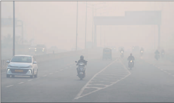
दिल्ली में रविवार को लगभग पूरे दिन वातावरण में घनी धुंध छाई रही।