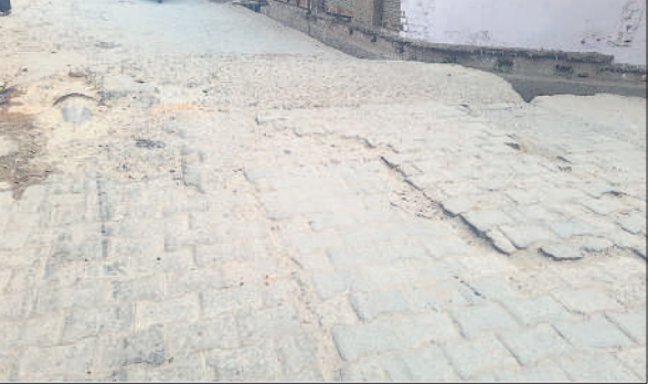
वार्ड 23 में टूटी सड़क, राहगीरों को चलने पर ठोकरें लगती हैं।

सपा सरकार में मंत्री रहे आजम खां ने इंटरलॉकिंग सड़कें बनवाई थीं नाले पर स्लैब डलवा दिए थे लेकिन, रख रखकर के अभाव में स्लैब टूट गए हैं। टूटी सड़कों के