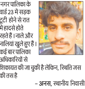
नगर पालिका के वार्ड 23 में सड़क टूटी होने से रात में हादसे होते रहते हैं। नाले और नालियां खुले हुए हैं। कई बार पालिका अधिकारियों से शिकायत की जा चुकी है लेकिन, स्थिति जस की तस है

टूटी सड़कों की वजह से स्थानीय लोगों को आवागमन में काफी परेशानी का सामना करना पड़ा रहा है। सबसे ज्यादा परेशान रात में होती है, जब अंधेरा होने की वजह से लोगों को गड्डे और सीवर के टूटे ढक्कन नहीं दिखाई देते लोग उनमें फंसकर गिर जाते हैं। इससे कई बार लोग घायल भी हो जाते हैं।