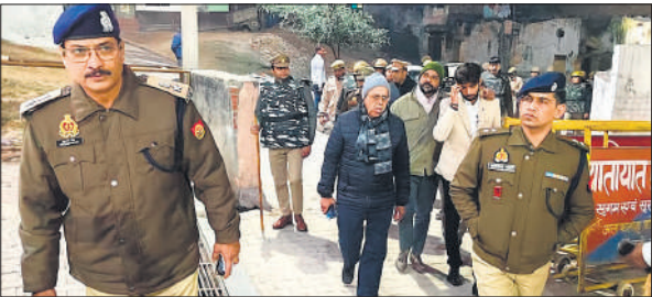
सुरक्षा इंतजामों का जायजा लेते एसएसी, सीओ व एसडीएम।

सोमवार की शाम साढ़े पांच बजे संभल कोतवाली क्षेत्र के मोहल्ला कोट पूर्वी स्थित जामा मस्जिद के सामने सत्यव्रत पुलिस चौकी पर