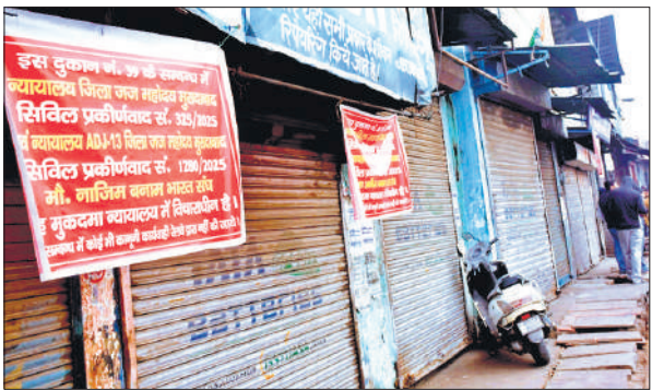
दुकानों के आगे लगाए कोर्ट में मामला होने के बैनर।