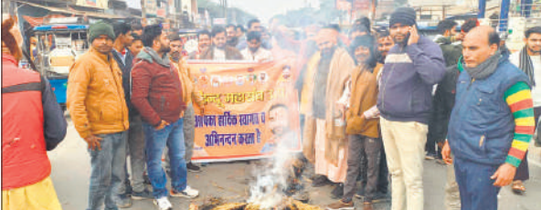
बांग्लादेश का पुतला दहन करते हिंदू महासंघ पदाधिकारी।