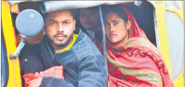
ठंड में दोपहर में आँटों में बैठकर जाते लोग।

सुबह की शुरुआत घने कोहरे के साथ हुई। दृश्यता इतनी कम थी कि सड़कों पर वाहन रंगते नजर आए। दफ्तर जाने वाले कर्मचारियों और सुबह टहलने निकलने वाले लोगों को खासा दिक्कतों का सामना करना पड़ा। हालांकि, ठंडी हवा चलने के कारण सुबह करीब साढ़े आठ बजे के बाद कोहरा धीरे-धीरे छंटने लगा,