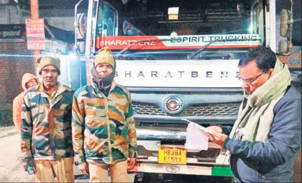
वाहन की चेंकिंग करते पुलिसकर्मी।