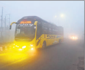
लाइट जलाकर गुजरती बस।

जता रहे हैं। कोहरा होने के कारण हाईवे पर वाहन धीमी रफ्तार से चले। शाम ढले लोगों ने घरों की राह पकड़ ली, जिससे बाजारों में सन्नाटा पसर गया। ज्यादा दिक्कत उन किसानों को उठानी पड़ी जो सुबह कोहरे में गन्ना कटाई करने खेतों पर पहुंचे। कुछ रोडवेज बसों में टूटे शीशे होने के कारण यात्रियों का सर्दी से बुरा हाल हो गया। शाम होते ही फिर से सर्दी बढ़ने के कारण लोग अपने-अपने घर में दुबक गए और सड़कों पर सन्नाटा पसर गया।