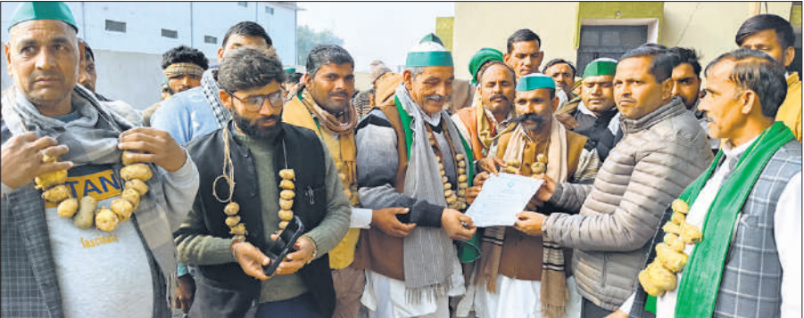
एसडीएम कार्यालय पर नायब तहसीलदार को ज्ञापन सौंपते किसान।

यह है कि 400 रुपये कुंतल में भी आलू के खरीदार नहीं मिल रहे हैं। उन्होंने मांग की कि सरकार आलू का न्यूनतम समर्थन मूल्य निर्धारित करे, ताकि किसानों को उनकी उपज का उचित मूल्य मिल सके। उन्होंने बिजली विभाग पर भी आरोप लगाते हुए कहा कि किसानों को दी जाने वाली छूट में अधिकारियों की मनमानी और धांधली की जा रही है। किसानों ने आवारा पशुओं की समस्या को भी गंभीर बताया। पदाधिकारियों ने कहा कि रात के समय आवारा पशु खेतों में घुसकर