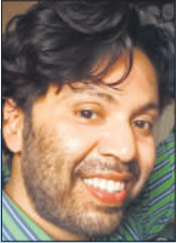
जिया इमियाज ब्लॉगर

खान शब्द का मूल तुर्की भाषा का शब्द ‘खाकान’ है जिसका अर्थ शासक या नेता होता है, यही शब्द बदलकर खान हुआ और उज्बेकी और मंगोलियाई शब्दकोश में राजा के संबोधन की