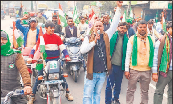
प्रदर्शन करते भारतीय किसान यूनियन अराजनीतिक से जुड़े किसान। ● अमृत विचार

भारतीय किसान यूनियन अराजनीतिक के कार्यकर्ताओं ने सोमवार को सुबह गवां मार्ग पर खिरनी चौराहे से बाइक रैली की शुरुआत की। इसके बाद नारेबाजी करते हुए बाइकों व अन्य वाहनों पर सवार किसान चौधरी सराय चौराहा, यशोदा तिराहा, चंदौसी चौराहा व बिजली घर होते हुए उपजिलाधिकारी कार्यालय पहुंचे। उप जिलाधिकारी कार्यालय परिसर में किसानों ने धरना देकर अपनी मांगों को लेकर नारेबाजी शुरू