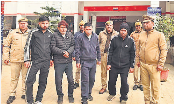
आरोपियों को जेल भेजती पुलिस।