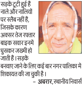
सड़के टूटी हुई हैं नाले और नालियों पर स्लैब नहीं है, जिसके कारण अक्सर तेज रफ्तार बाइक सवार इनमें घुसकर जखमी हो जाते हैं। सड़कें बनवाए जाने के लिए कई बार नगर पालिका में शिकायत की जा चुकी है।

लिए पालिका के अधिकारियों से कई बार शिकायत की है। अधिकारियों द्वारा लोगों को आश्वासन दे दिया जाता है लेकिन, काम नहीं होता है। मोहल्ले के लोगों ने बताया कि वार्ड के मोहल्ला छोपियान, मंगल की पैठ, घेर इनायत खां में सड़कों की हालत बदतर है।