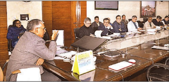
हाई पावर कमेटि की बैठक में अधिकारियों को निर्देश देते मुख्य सचिव एसपी गोयल।

मुख्य सचिव ने सभी विभागों एवं नाबार्ड को आपसी तालमेल बढ़ाकर