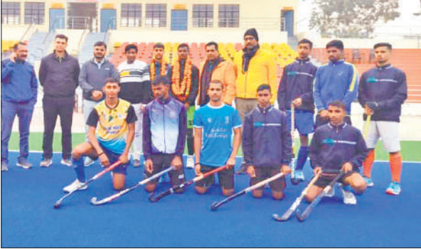
हॉकी छात्रावास रामपुर के दोनों खिलाड़ी टीम के साथ।