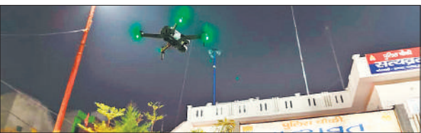
जामा मस्जिद के नजदीक ड्रोन से की जा रही निगरानी।