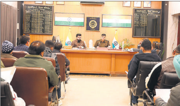
कलेक्ट्रेट सभागार में सड़क सुरक्षा बैठक में मौजूद डीएम व एसपी।

जिलाधिकारी ने दुर्घटना संभावित स्थलों पर टेबल-टॉप ब्रेकर एवं अन्य सुरक्षा उपाय तत्काल कराने के निर्देश दिए। इसके साथ ही चिन्हित ब्लैक स्पॉट्स पर अतिरिक्त प्रकाश