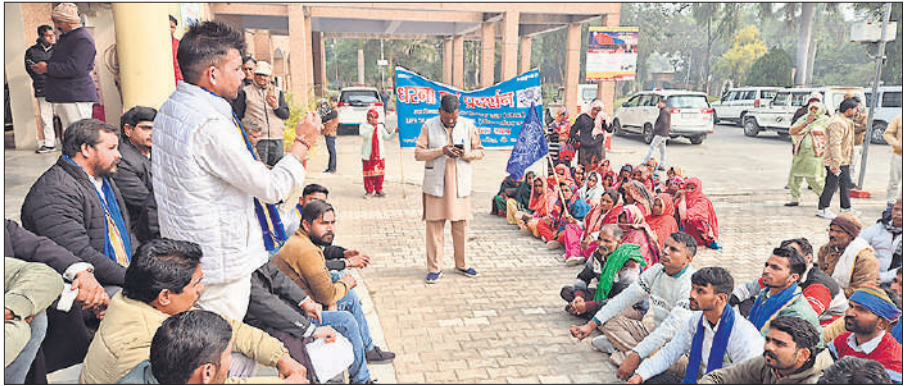
कलेक्ट्रेट पर धरना देते दलित संगठन के लोग।

अमरोहा में अवैध रूप से संचालित अस्पतालों में मौतों का सिलसिला थमने का नाम नहीं ले रहा। जिसके चलते अब स्वास्थ्य विभाग की कार्यप्रणाली पर भी सवाल खड़े होने लगे है। कुछ दिन पूर्व हुई धनौरा के गांव नवाबपुरा में माधव नर्सिंग होम में प्रसव के दौरान महिला की मौत ने स्वास्थ्य विभाग की कार्रवाई की पोल खोल दी। अस्पताल कागजों में सील था,