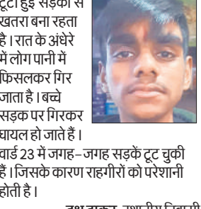
टूटी हुई सड़कों से खतरा बना रहता है। रात के अंधेरे में लोग पानी में फिसलकर गिर जाता है। बच्चे सड़क पर गिरकर घायल हो जाते हैं।

वार्ड 23 में जगह- जगह सड़कें टूट चुकी हैं। जिसके कारण राहगीरों को परेशानी होती है।