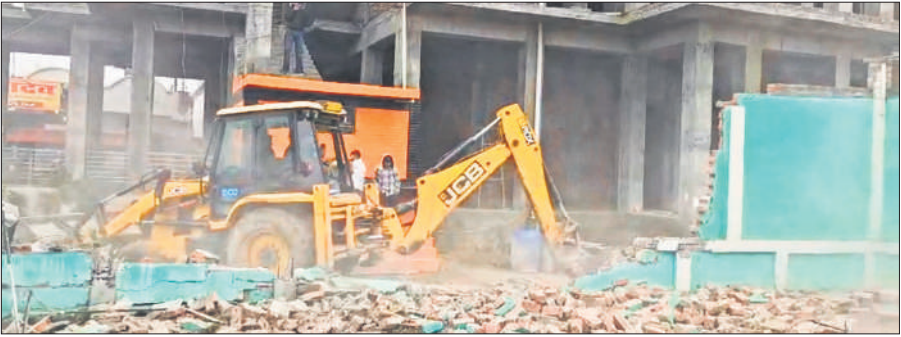
भमरौआ मंदिर के पास जगह को कब्जामुक्त करती जैसीबी।

भमरौआ गांव स्थित प्राचीन शिव मंदिर की जमीन पर किए गए कब्जे को राजस्व विभाग ने पुलिस बल के मौजूदगी में हटवा दिया है। यह कार्रवाई मंदिर के पुजारी की लिखित शिकायत के आधार पर जैसीबी से