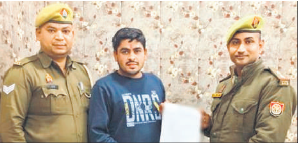
पीड़ित के साथ पुलिसकर्मी।

सुनिश्चित की जाए। जिले के सभी तहसीलों के अंतर्गत प्रमुख चौराहों पर कुल 9 चेक-प्वाइंट बनाकर रात 8 बजे से सुबह 7 बजे तक विशेष जांच अभियान चलाया गया। इस दौरान प्रशासन, पुलिस एवं परिवहन विभाग की संयुक्त टीमों द्वारा कुल 977 वाहनों की जांच की गई। इस दौरान नियमों के उल्लंघन के मामलों में एआरटीओ ने 3 वाहनों पर प्रति वाहन 5-5 हजार रुपये के चालान की कार्रवाई की गई।