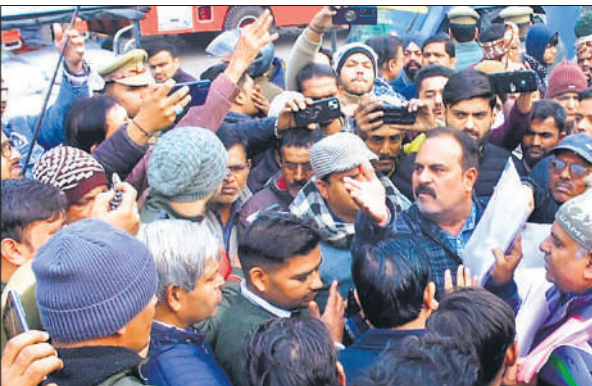
रोडवेज के सामने रेलवे अधिकारियों से वार्ता करते व्यापारी।

गहमा गहमी के बीच मौके पर नगर विधायक भी पहुंच गए। उन्होंने