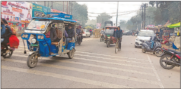
कडाके की ठंड में अंबेडकर चौराहे से गुजरते वाहन।

पछुआ हवा की रफ्तार ने गलन बढ़ा दी जिससे लोगों की मुश्किलें बढ़ गयीं। मजदूरी करने वाले श्रमिक व नौकरीपेशा वर्ग सुबह की गलन से परेशान रहे। अधिकतर लोग टंड से बचने के लिए घरों में दुबके रहे। जो लोग बाहर निकले वह भी अलाव का सहारा लेते नजर आए। सरकारी कार्यालय मे अलाव व हीटर के सहारे लोगों ने काम निपटया। पछुआ हवा व शीतलहर से पड़ रही कड़ाके की ठंड बच्चों व बुजुर्गों के लिए मुसीबत बनी है। भीषण ठंड में बुजुर्गों को सांस लेने में दिक्कत हो रही है और अस्पताल में सांस के मरीज बढ़ रहे हैं। सोमवार को जिले का न्यूनतम तापमान 7 डिग्री जबकि अधिकतम तापमान 17 डिग्री सेल्सियस के करीब रहा। तेज पछुआ हवा के चलते पारा लगातार गिर रहा है ,जिससे टंड में इजाफा