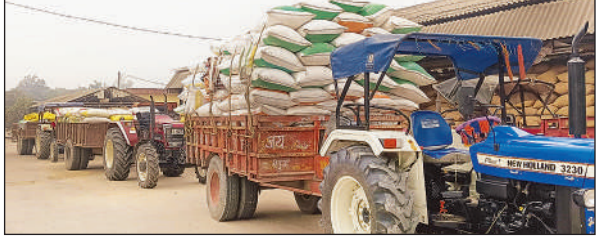
बहराइच रोड स्थित गल्ला मंडी में सरकारी केंद्र पर खड़ी धान लट्टी ट्रक्टर-ट्रॉली।

से की जा सकी है। शासन की ओर से पहले ही निर्देश जारी किए जा चुके हैं कि धान क्रय केंद्र पर पर्याप्त संसाधन और सुविधाएं उपलब्ध कराई जाएं। नियमों के अनुसार किसानों के बैठने की व्यवस्था, पीने का पानी, अलाव और बिजली