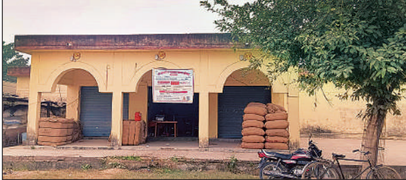
नवीन गल्ला मंडी में सूता पड़ा मक्का क्रय केंद्र।