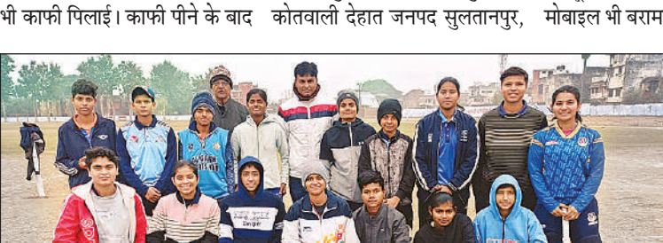
राष्ट्रीय शिविर में भाग लेने वाली उग्र बालिका सीके नायडू क्रिकेट टीम प्रशिक्षकों के साथ ।