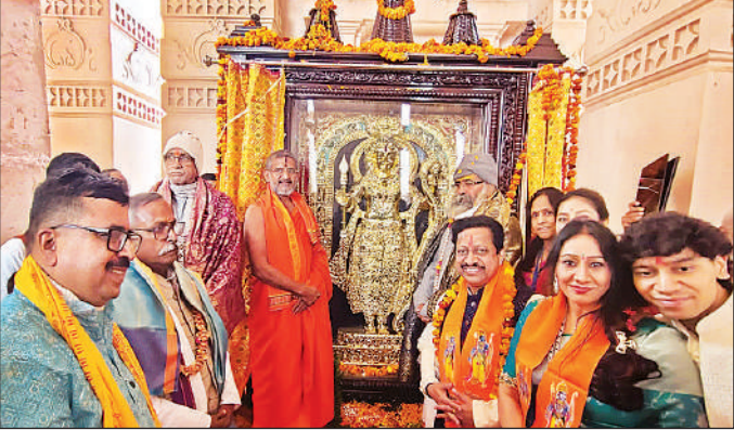
स्वर्ण जड़ित रामलला की प्रतिमा का अनावरण करते राम मंदिर के ट्रस्टी।