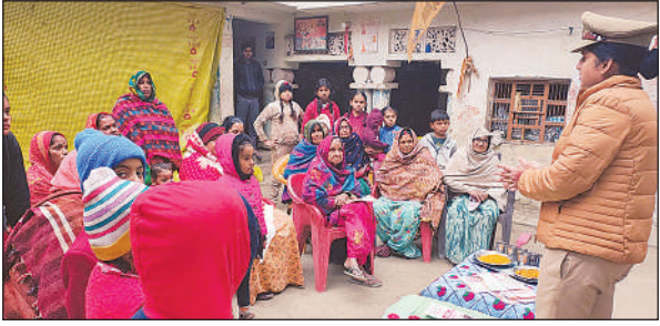
महिलाओं को जागरूक करती महिला पुलिसकर्मी।