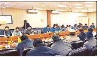
जेम कार्यशाला में मौजूद परियोजना निदेशक।

जिला संवाददाता, अंबेडकरनगर, अमृत विचार : शासकीय क्रय प्रक्रियाओं को पारदर्शी, सुगम एवं समर्थित बनाए जाने के उद्देश्य से सोमवार को कलेक्ट्रेट सभागार में गवर्नमेंट ई-मार्केटप्लेस पोर्टल के माध्यम से सुचारु रूप से शासकीय क्रय किए जाने के लिए क्रेता विभागों के प्रशिक्षण के लिए एक दिवसीय जेम कार्यशाला का आयोजन किया गया।