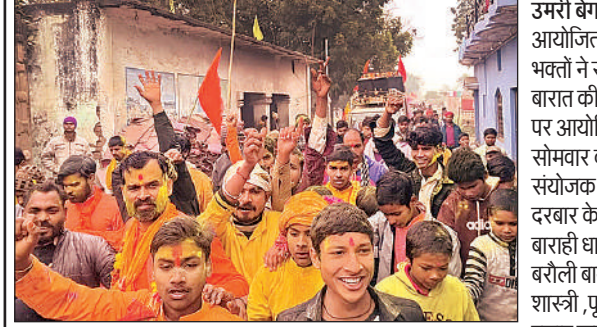
राम भारत की शोभायात्रा में शामिल श्रद्धालु।