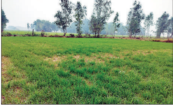
गेहूं की फसल के लिए ठंड व कोहरा फायदेमंद।

कृषि मौसम विज्ञान विभाग, आचार्य नरेंद्र देव कृषि एवं प्रौद्योगिक विश्वविद्यालय, कुमारगंज के वैज्ञानिक ने बताया कि सोमवार को अधिकतम तापमान