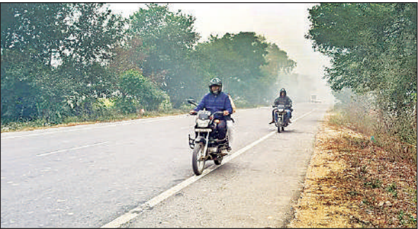
ठंड के चलते अकबरपुर-सुल्तानपुर हाईवे पर पसरा सन्नाटा।

बता दें कि दिसंबर के अंतिम सप्ताह में ठंड का प्रकोप बढ़ गया है। सोमवार सुबह से आसमान में बादल छाए रहे, जिससे ठंड और बढ़ है। जनपद का न्यूनतम तापमान 10 डिग्री सेल्सियस से