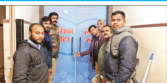
निर्मला हॉस्पिटल में ओटी व लेबर रूम सील करते स्वास्थ्य विभाग के अधिकारी व कर्मचारी ।