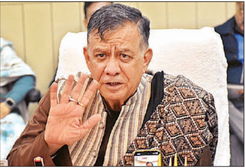
पत्रकारों को जानकारी देते विधानसभा अध्यक्ष सतीश महाना।

यह जानकारी विधानभवन में सोमवार को आयोजित एक पत्रकारवार्ता में विधानसभा अध्यक्ष सतीश महाना ने पत्रकारों को दी। उन्होंने बताया कि 19 जनवरी से पूर्व मीडियाकर्मियों के लिए संसदीय पत्रकारिता पर एक सत्र भी आयोजित होगा। विधानसभा अध्यक्ष के मुताबिक, शीतकालीन सत्र की कार्यवाही एक बार भी स्थगित नहीं हुई। शीतकालीन सत्र के दौरान उन्हें पहली बार विधानसभा में वंदेमातरम गीत पूरा गाने का अवसर मिला। सदन में बहुत से सदस्यों ने वंदेमातरम पर चर्चा की, जबकि बहुत से सदस्यों को शिकायत रह गई कि उन्हें इस पर बोलने का