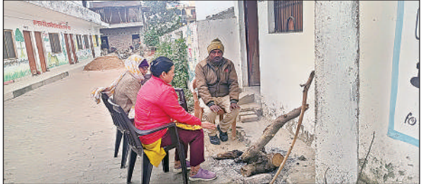
करनेलगंज स्थित कस्तूरबा विद्यालय में अलाव ताप रही शिक्षिकाएं व कर्मचारी।