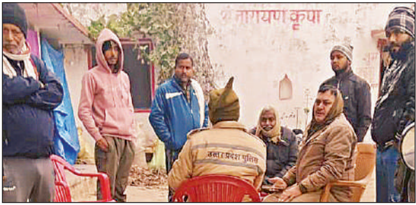
मृतक युवक के घर पहुंचकर जांच करती पुलिस टीम।