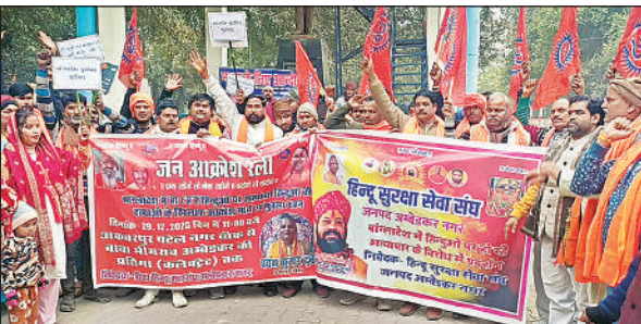
कलेक्ट्रेट स्थित आंबेडकर प्रतिमा प्रांगण में प्रदर्शन करते विश्व हिंदू महासंघ के लोग