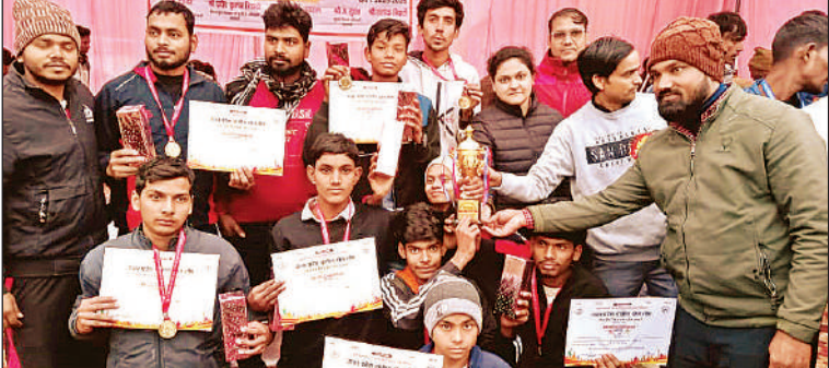
विधायक खेल स्पर्धा के विजेता खिलाड़ी।