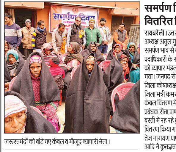
जरूरतमंदों को बांटे गए कंबल व मौजूद व्यापारी नेता।