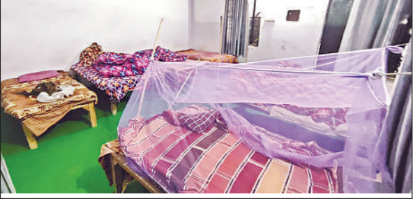
मुसाफिरों के न होने से खाली पड़ा रैन बसेरा।