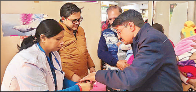
बच्चे को विटामिन-ए की खुराक पिलाते चिकित्सक ।

मुख्य चिकित्सा अधिकारी ने बताया कि विटामिन ए आंखों की रोशनी, बच्चों की शारीरिक वृद्धि और रोग प्रतिरोधक क्षमता के लिए अत्यंत आवश्यक है । यह हड्डियों की मजबूती और सही विकास में सहायक होता है तथा दस्त और