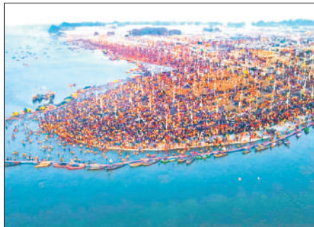
प्रयागराज में महाकुंभ में उमड़ी भीड़।

महाकुंभ के भव्य आयोजन में आए 66 करोड़ से अधिक लोग, 137 करोड़ से अधिक पर्यटकों के आगमन से बना देश में प्रथम