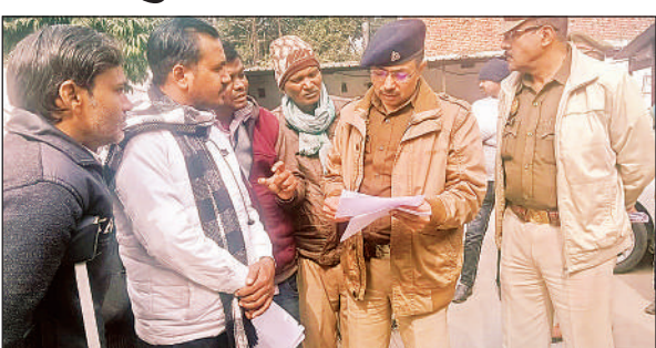
अपर पुलिस अधीक्षक को ज्ञापन सौंपते भारतीय जागृति मिशन के कार्यकर्ता।