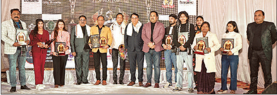
फिल्म फेस्टिवल के मंच पर सम्मानित हुए कलाकार।