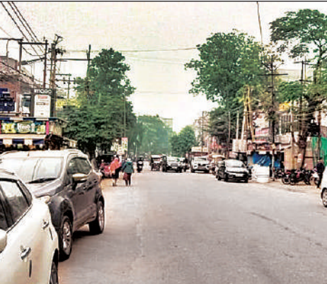
भीषण ठंड में सुपर मार्केट को जाने वाली सड़क पर रहा सन्नाटा।