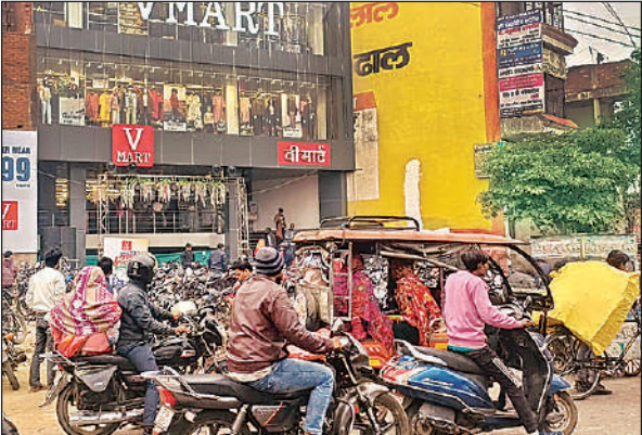
शॉपिंग मॉल के सामने लगा भीषण जाम।

ऐसे शॉपिंग मॉल भी हैं, जिनके बाहर चारपहिया वाहन खड़ा करने तक की जगह नहीं है, इसके बावजूद एक समय में 50 से अधिक लोग अंदर खरीदारी करते देखे जा सकते हैं। स्थानीय लोगों का आरोप है कि इन तमाम अव्यवस्थाओं के बावजूद प्रशासन लगातार ऐसे शॉपिंग मॉल और कॉम्प्लेक्स को संचालन के लिए एनओसी देता चला आ रहा है। इससे यह सवाल उठने लगे हैं