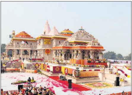
अयोध्या का राम मंदिर।

का विकास प्रमुख हैं। वहीं, मुरादाबाद के भगवानपुर मंदिर, शाहजहांपुर के अजीताश्रम योगकुंज ( जन्मस्थली ), वाल्मीकिनगर में लवकुश कुटी,