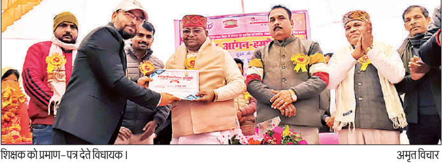
शिक्षक को प्रमाण-पत्र देते विधायक।

एडीएम ने तहसील का किया औचक निरीक्षण रामसनेहीघाट, बाराबंकी : सोमवार को एडीएम निरंकार सिंह ने तहसील रामसनेहीघाट का औचक निरीक्षण कर प्रशासनिक व्यवस्थाओं की समीक्षा की। इस दौरान उन्होंने तहसील परिसर, रेबबसेरा और अलाव की व्यवस्था का जांचा लिया और कड़कें की टंड में 100 से अधिक जरूरतमंदों को केबल वितरित किया। एडीएम ने कल्याणी नदी तट पर पहुंचकर वहां की साफ-सफाई और सुरक्षा व्यवस्था भी सुनिश्चित करने के निर्देश दिए। उन्होंने अभिलेखों की जांच की और निर्देश दिए कि जनता को समयबद्ध और पारदर्शी सेवा मिले। इस अवसर पर एसडीएम रामसनेहीघाट अनुराग सिंह, तहसीलदार शाशंक उपाध्याय और अन्य अधिकारी मौजूद रहे।