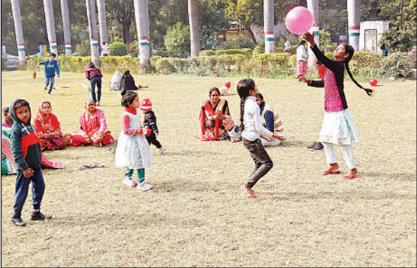
धूप निकलने के बाद निराला पार्क में मस्ती करते बच्चे।

अमृत विचार । मैदानी इलाकों में पहाड़ों से आ रही बर्फ़ीली हवाओं ने जनजीवन अस्त-व्यस्त कर दिया है। जिले में भी बीते तीन दिनों से कड़ाके की ठंड व शीतलहर के चलते बच्चों को कड़कड़ाती ठंड से बचाने के लिए बीएसए व डीआईओएस ने जिले के कक्षा एक से 12 तक के सभी शिक्षण संस्थानों में एक जनवरी तक अवकाश की घोषणा कर दी है। बता दें कि बीते तीन दिनों से जिले में पारा लगातार गिर रहा है। गलन व बर्फ़ीली हवाओं के कारण सुबह के समय सड़कों पर सन्नाटा पसर रहा है। कोहरे व कम दृश्यता के कारण न केवल वाहन चालक परेशान हैं बल्कि आम आदमी का दैनिक कामकाज भी बुरी तरह प्रभावित है। ठंड की इसी गंभीरता को देखते हुए शिक्षा विभाग ने स्कूल बंद रखने