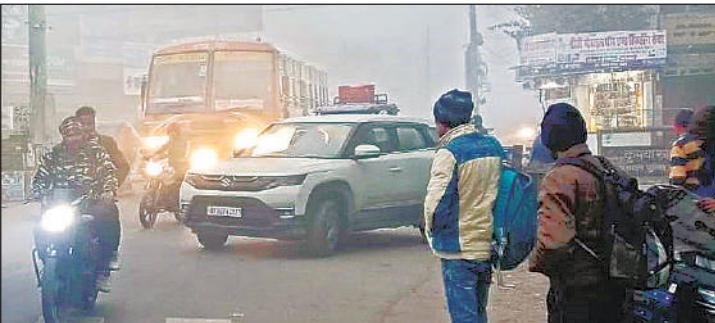
घने कोहरे के चलते दिन में लाइट जलाकर गुजरते वाहन चालक ।