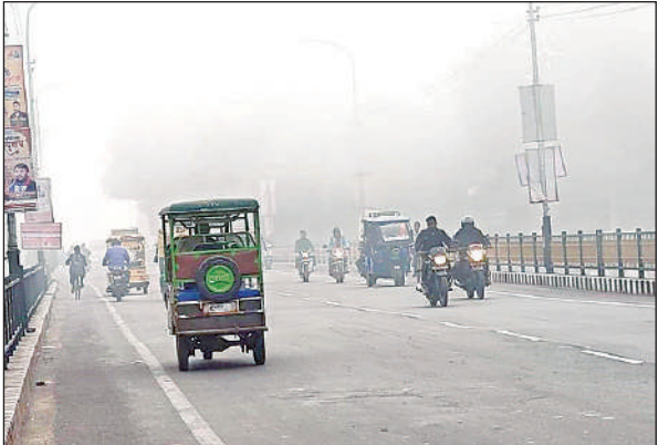
भीषण कोहरे के बीच सिविल लाइन ओवरब्रिज से गुजरते वाहन।

► कोहरा और धुंध की चादर में लिपटा शहर, गांव व कस्बा ► टंड में उड़ती गर्मागर्म भाप के साथ चाय की चुस्कियों का लोगों ने उठारा आनंद