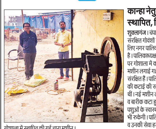
गोशाला में स्थापित की गई चारा मशीन।