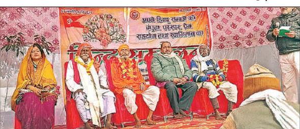
कार्यक्रम में मौजूद संघ के लोग।