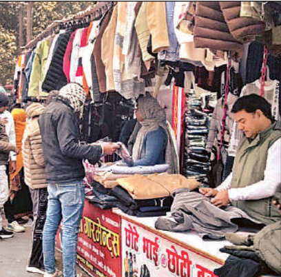
गर्म कपड़े की खरीदारी करते लोग।