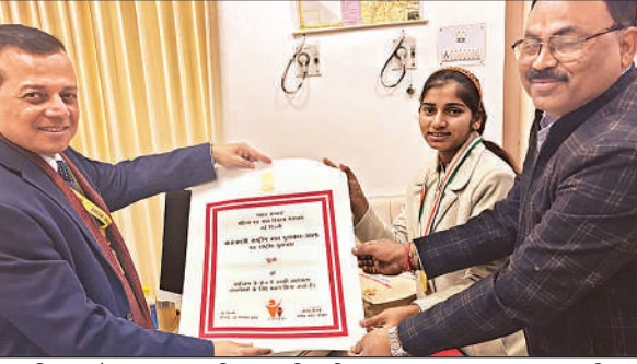
सम्मानित करते अपर मुख्य सचिव माध्यमिक शिक्षा।