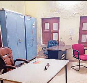
ब्लॉक परिसर में खाली पड़ी कुर्सी।