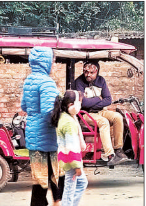
गर्म कपड़े पहनकर निकली महिला व बच्ची।

जरूरतमंदों को मिली मदद ऊंट के मुंह में जीरा: गर्म कपड़े इस समय शहरवासियों का सबसे बड़ा सहारा बन गए हैं। बिना स्वेटर, जैकेट या शॉल के बाहर निकलना मुश्किल हो गया है। स्कूल जाने वाले बच्चे पूरी तरह ऊनी कपड़ों में लिपटे दिखाई देते हैं। बुजुर्गों की हालत और भी खराब है। ठंड का असर उनके स्वास्थ्य पर साफ दिख रहा है। अस्पतालों में सर्दी, खांसी, बुखार और सांस से जुड़ी बीमारियों के मरीजों की संख्या लगातार बढ़ रही है। सबसे दुखद पहलू यह है कि अब तक इस भीषण ठंड में प्रशासन भी सुस्त नजर आया। स्थानीय लोगों में इस बात को लेकर नाराजगी है। उनका कहना है कि ठंड रोज बढ़ रही है, लेकिन प्रशासन की उदासीनता जस की तस बनी हुई है। कुछ सामाजिक संगठन और समाजसेवी अपने स्तर पर कंबल