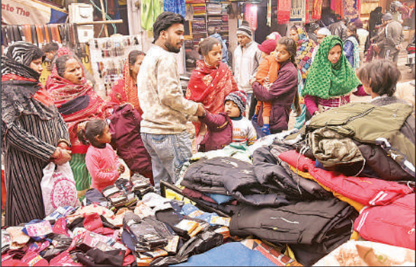
बाजार में ऊनी कपड़े खरीदते लोग।

शहर के निराला पार्क व पन्नालाल पार्क में लोगों की भीड़ देखी गई। लोग सपरिवार धूप सेकने पहुंचे। स्कूल बंद होने से बच्चों ने सुनहरी धूप का भरपूर लाभ उठाया। पार्कों में बच्चे