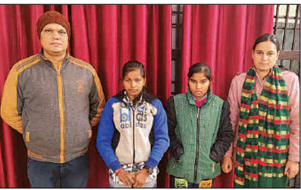
दो बालिकाओं को परिजनों को सौंपी जीआरपी पुलिस ।

प्रत्यक्षदर्शियों के अनुसार रात के समय आग लगी इसलिए किसी को