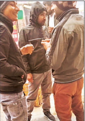
टंडी में चाय का आनंद लेते युवा।

की सर्दी का सबसे क्रूर असर गरीब, मजदूर और बेसहारा लोगों पर पड़ रहा है। ठंड से कांपते ये लोग हर गुजरती रात के साथ अगली सुबह देखने की जद्दोजहद कर रहे हैं। शहर के अधिकांश प्रमुख चौराहों पर नगर पालिका की ओर से अलाव जरूर जलवाए गए हैं। सुबह और देर रात इन अलावों के आसपास समूह में लोग जमा हो जाते हैं। रिक्षा चालक, मजदूर, ठेले वाले और राहगीर अलाव के पास खड़े होकर ठंड से कंपकपाती शरीर में थोड़ी जान फूंकने की कोशिश करते नजर आते हैं। वहीं चाय की दुकानों पर ग्राहकों की भीड़ नजर आई। कुल्हड़ में उड़ती भाप और गर्मागर्म चाय को पीकर लोगों ने ठंड से राहत पाने का प्रयास करते देखे गए हैं। हालांकि यह भी हकीकत है कि अलाव हर जगह नहीं हैं और जहां हैं, वहां जरूरत से कम हैं।