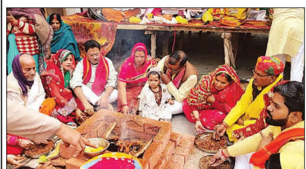
कथा के समापन के बाद होता हवन-पूजन।