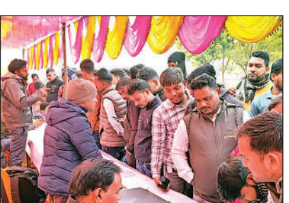
रोजगार मेले में उपस्थित अभ्यर्थी व मौजूद लोग।