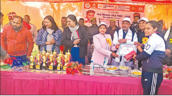
छात्रा को पुरस्कृत करती ब्लॉक प्रमुख।