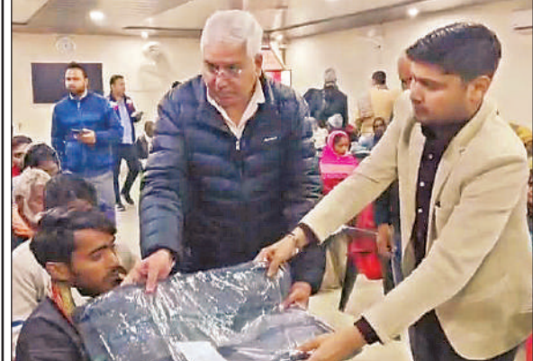
जरूरतमंदों को कंबल वितरित करते राज्यमंत्री व तहसीलदार।