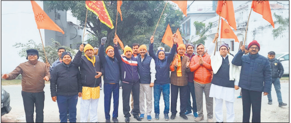
ग्रेटर ग्रीन पार्क में संकीर्तन यात्रा निकालते पदाधिकारी।

यात्रा का शुभारंभ सुबह शंखनाद, वैदिक मंत्रोच्चार, पूजन एवं आरती के साथ हुआ। यात्रा ने ग्रेटर ग्रीन पार्क कॉलनी के निर्धारित मार्ग पर भ्रमण किया। यात्रा का पुष्प-मालाओं से स्वागत किया गया। श्रद्धालुओं ने घरों की छतों से पुष्प-वर्षा कर यात्रा का अभिनंदन किया। यात्रा के दौरान भजन-कीर्तन और भगवान श्री राम की जय-जयकार से समूचा क्षेत्र