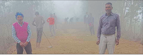
मिर्जापुर जागीर में मनरेगा के तहत होता सड़क निर्माण कार्य।

अमृत विचार : प्रदेश में मनरेगा योजना के तहत कराए गए निर्माण कार्यों का दो साल का 3683 करोड़ रुपये का भुगतान लंबित है। प्रधानों का कहना है कि केंद्र सरकार ने हाल ही में योजना का नाम बदलकर वीबी-जी राम जी कर दिया है। मगर, नए नाम और नए दावों के बीच पुरानी भुगतान व्यवस्था की खामियां जस की तस बनी हैं। हालात यह हैं कि अकेले बरेली मंडल में ही करीब 150 करोड़ रुपये का बकाया फंसा हुआ है। शासन से समय पर ग्रांट न आने के कारण न तो पुराने भुगतान हो पा रहे हैं और न ही नए कार्यों को आगे बढ़ाया जा पा रहा है। मनरेगा के तहत संपर्क मार्ग, इंटर लॉकिंग, पंचायत भवन, एमडीएम शेड, आंगनवाड़ी केंद्रों, अन्नपूर्णा भवनों, पार्क का निर्माण कराया जाता है। इसमें मजदूरी का सौ फीसदी भुगतान केंद्र सरकार करती है, जबकि सामग्री में 75 फीसदी हिस्सा