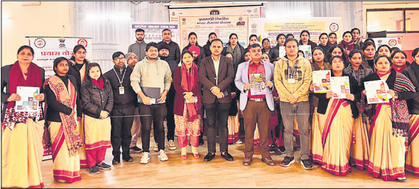
कार्यक्रम में मौजूद ईपीएफओ के अधिकारी व अन्य।

इसके अतिरिक्त उपस्थित नियोक्ताओं और श्रमिकों को प्रधानमंत्री विकसित भारत रोजगार