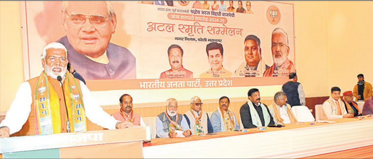
अर्बन हाट ऑडिटोरियम में आयोजित कार्यक्रम में बोले मंत्री स्वतंत्र देव सिंह।

अमृत विचार: सिंचाई एवं जल संसाधन मंत्री स्वतंत्र देव सिंह ने सोमवार को कहा कि पूर्व प्रधानमंत्री अटल बिहारी वाजपेयी का विराट व्यक्तित्व देशवासियों को नई प्रेरणा प्रदान कर रहा है। राजनेता से राष्ट्रनेता तक उनकी यशस्वी यात्रा अभिनंदनीय है। उनकी नीति में दूरदृष्टि, नेतृत्व में सेवा भाव और निर्णयों में राजनीतिक कुशलता थी। ये हमारे प्रदेश की राजधानी का सौभाग्य है कि इसका प्रतिनिधित्व