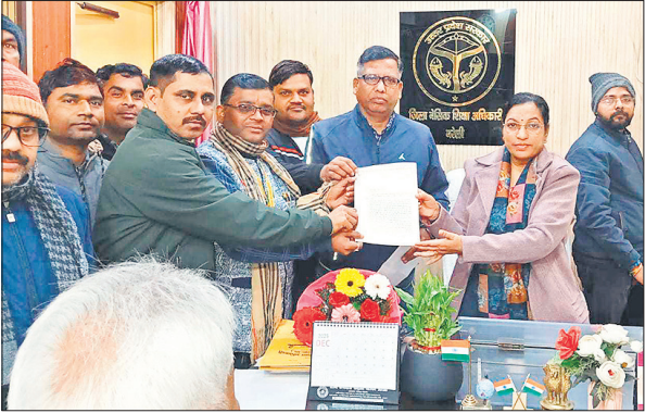
बीएसए को ज्ञापन सौंपते बेसिक शिक्षा कल्याण समिति के पदाधिकारी।