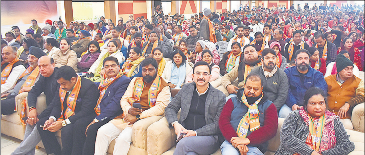
अटल बिहारी वाजपेयी की जन्म शताब्दी समारोह पर आयोजित कार्यक्रम में मौजूद भाजपा नेता और कार्यकर्ता।