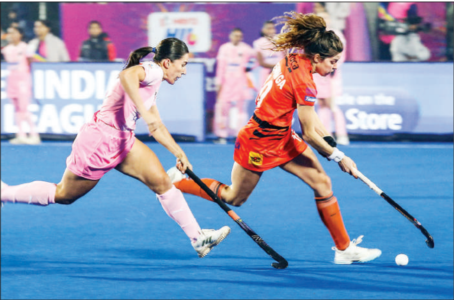
रांची में महिला हॉकी इंडिया लीग के दौरान श्राची बंगाल टाइगर्स और सोरमा हॉकी क्लब की खिलाड़ी मुकाबला करते हुईं।