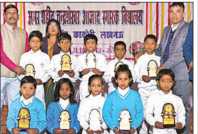
वार्षिकोत्सव में पुरस्कार किए गए बच्चे।