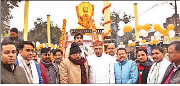
स्थापना दिवस समारोह के दौरान मौजूद जनप्रतिनिधि।

अमृत विचार। जनपद स्थापना दिवस 29 दिसम्बर 37वें वर्षगांठ के अवसर पर सुबह साड़ी तिराहा पर बुद्ध की प्रतिमा के चरणो पर मुख्य अतिथि सांसद डुमरियागंज जगदम्बिका पाल, जिलाध्यक्ष