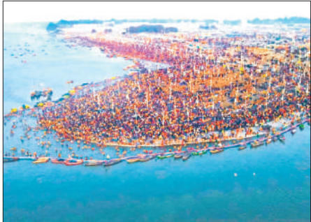
प्रयागराज में महाकुंभ में उमड़ी भीड़।

महाकुंभ के भव्य आयोजन में आए 66 करोड़ लोग, 137 करोड़ से अधिक पर्यटकों के आगमन से बना देश में प्रथम