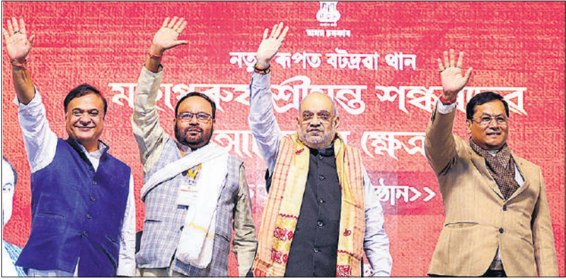
असम में आयोजित कार्यक्रम में शामिल केंद्रीय गृह मंत्री अमित शाह, मुख्यमंत्री हिमंता बिस्वा सरमा व अन्य।

नई दिल्ली, एजेंसी संसदीय समिति ने मनरेगा के विभिन्न पहलुओं पर चर्चा के साथ इस पर भी विचार किया कि नरेन्द्र मोदी सरकार द्वारा बनाए विकसित भारत-जी राम जी अधिनियम के सुचारू क्रियान्वयन के लिए छह महीनों में कैसे आगे बढ़ना है। सूत्रों ने बताया कि ग्रामीण विकास और पंचायती राज संबंधी संसद की स्थायी समिति के अधिकतर सदस्य इस बात को लेकर चिंतित थे कि अगले छह महीनों में परिवर्तन