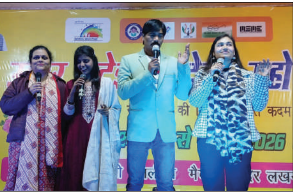
उत्तर प्रदेश स्वदेशी महोत्सव में प्रस्तुति देते कलाकार।