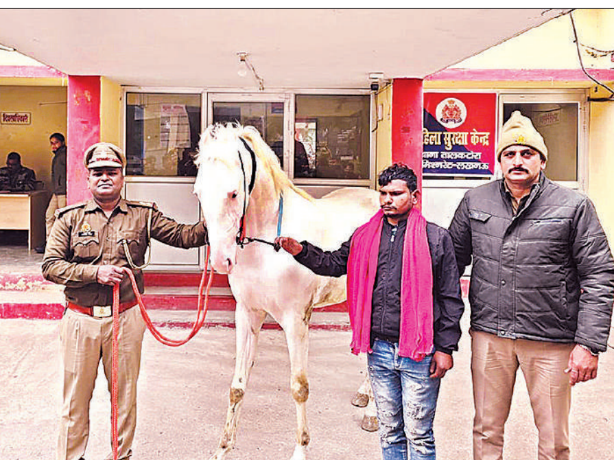
पुलिस की गिरफ्त में आरोपी व बरामद घोड़ा।