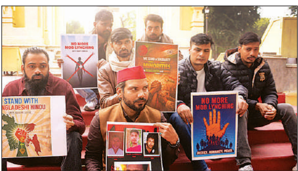
हजरतगंज स्थित गांधी प्रतिमा पर धरना प्रदर्शन करते सपा कार्यकर्ता।