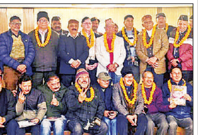
उत्तराखंड महापरिषद की बैठक में पदाधिकारी।