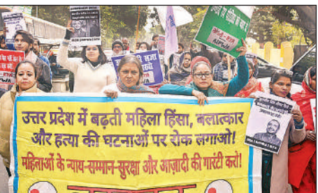
मार्च में शामिल एपवा व अन्य संगठन के कार्यकर्ता।