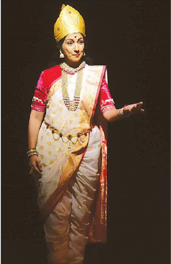
गंगा के तीन भागीरथ नाटक में गंगा के स्वरूप में कलाकार।