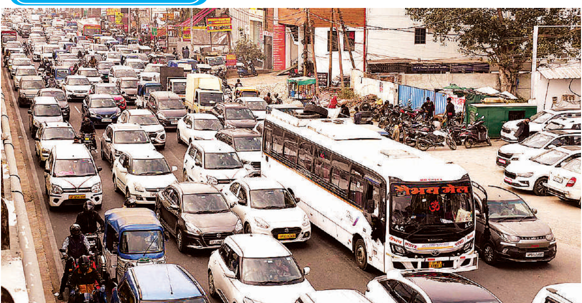
अयोध्या रोड स्थित कमता तिराहे पर लगा जाम।