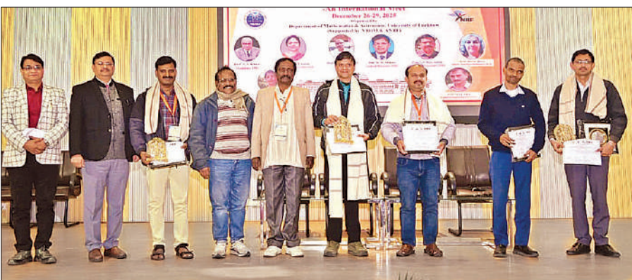
लखनऊ विश्वविद्यालय में आयोजित भारतीय गणितीय सोसाइटी के सम्मेलन में मौजूद अतिथि।