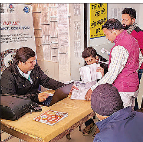
कर्मचारियों की समस्याओं को सुनते नोडल अधिकारी।