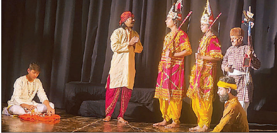
अंतरराष्ट्रीय बौद्ध शोध संस्थान के सभागार में रामलीला का मंचन करते कलाकार।

अमृत विचार: सवेरा फाउंडेशन की ओर से अंतरराष्ट्रीय बौद्ध शोध संस्थान के गोमतीनगर सभागार में सोमवार को लोकनाट्य धनुष भंग रामलीला का मंचन किया गया। मंचन की शुरुआत मारीच के दरबार से हुई, जहां से राक्षसों द्वारा विश्वामित्र के आश्रम में किए गए उपद्रव को दर्शाया गया। इसके बाद विश्वामित्र का अयोध्या आगमन, राजा दशरथ से राम-लक्ष्मण को आश्रम रक्षा के लिए ले जाना और राक्षसों का वध दिखाया गया। आश्रम की रक्षा के उपरांत कथा मिथिला पहुंची, जहां सीता स्वयंवर और धनुष भंग का भव्य दृश्य दर्शकों के लिए विशेष आकर्षण रहा। धनुष भंग के बाद परशुराम का आगमन, लक्ष्मण से संवाद और अंत