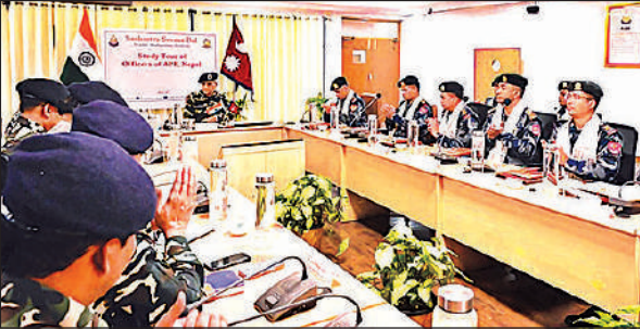
सीमांत मुख्यालय में सोमवार को नेपाल के प्रशिक्षु दल के साथ बैठक करते महानिरीक्षक।