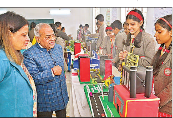
छात्राओं की प्रदर्शनी को देखते शिक्षक।