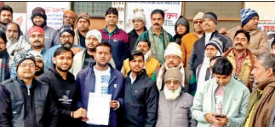
एसडीएम को ज्ञापन सौंपते व्यापारी।