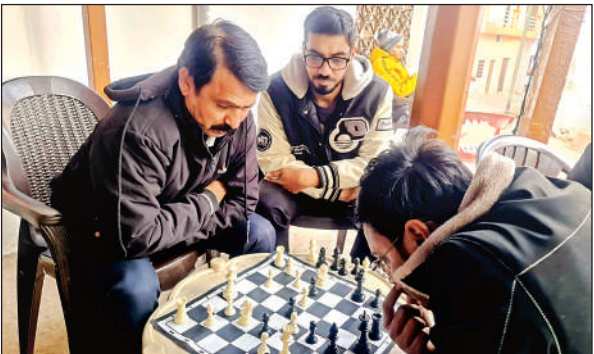
शतरंज प्रतियोगिता में दिमागी कसरत करते खिलाड़ी ।