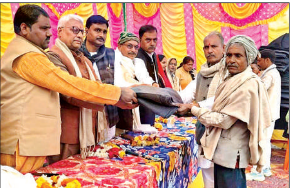
कंबल वितरण करते एसडीएम व ब्लॉक प्रमुख ।