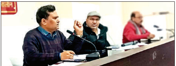
बैठक में मौजूद अधिकारी ।