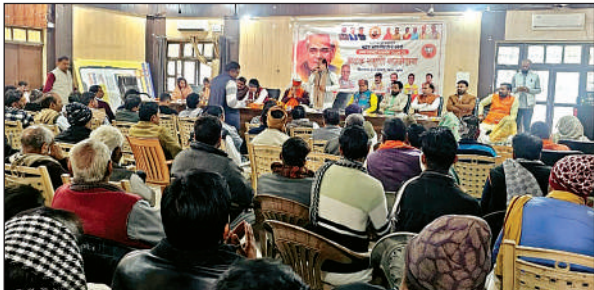
अटल स्मृति सम्मेलन में भाग लेते भाजपाई।