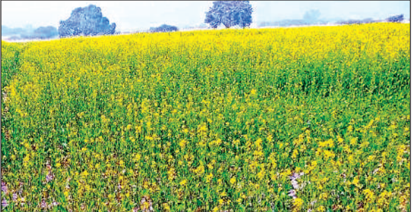
खेतों पर खड़ी सरसों की फसल मुश्काने लगी।

मंगलवार के पूरे दिन सूर्य देव नजर नहीं आए। ठंड भी पिछले दिनों से मंगलवार को कुछ ज्यादा ही रही। लोग ठंड से बचाव के लिए पूरे दिन अलाव से चिपके रहे। ठंड से पशु पक्षी बेहाल नजर आए बगैर बरसात के कहर बरपा रहा कोहरा फसलों को सर्वाधिक नुकसान पहुंचा रहा है। गोहूँ को छोड़कर अन्य सभी फसलें कोहरे से प्रभावित हो रही