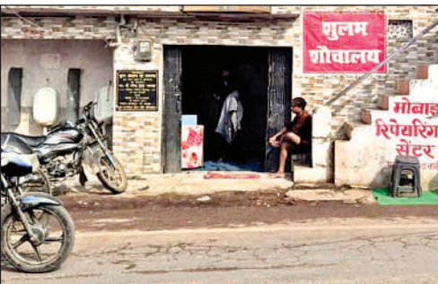
ढहा दिया जाएगा यह सार्वजनिक शौचालय।

प्रभारी अधिकारी स्थानीय निकाय ने नगर पालिका परिषद के तहत आने वाले विभिन्न स्थलों का निरीक्षण किया। इस दौरान उन्होंने पुराने बस अड्डे के पास स्थित सार्वजनिक शौचालय को हटाने के निर्देश संबंधित अधिकारियों को दिए। निरीक्षण के दौरान बस स्टैंड के पास पुलिया किनारे बने यूरिनल को भी ध्वस्त कराने का निर्णय लिया गया। माना जा रहा है कि पुलिया के चौड़ीकरण से जाम की स्थिति से निजात मिलेगी और भविष्य में रोड बनने पर भी दिक्कत