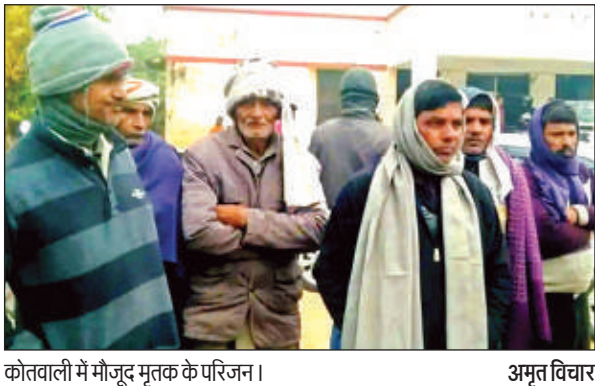
कोतवाली में मौजूद मृतक के परिजन।

कार्यालय संवाददाता, औरैया अमृत विचार। शहर के नगर पालिका इंटर कॉलेज परिसर में कार्यरत संविदा कर्मी की सोमवार की देर रात संदिग्ध परिस्थितियों में मौत हो गई। संविदाकर्मी की मौत की खबर जब परिजनों को लगी तो वह मौके पर पहुंचे और पुलिस को सूचना दी। सूचना पर पहुंची पुलिस ने जांच-पड़ताल करते हुए शव को पोस्टमार्टम के लिए भेजा है। मृतक के शरीर पर गंभीर चोटों के निशान मिलने के बाद पुलिस ने मामले को हत्या मानते हुए नगर पालिका अध्यक्ष के एक रिश्तेदार समेत कुछ अज्ञात लोगों के खिलाफ मुकदमा दर्ज किया है।