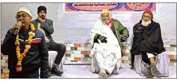
मुशायरे में अपना कलाम पेश करते शायर ।