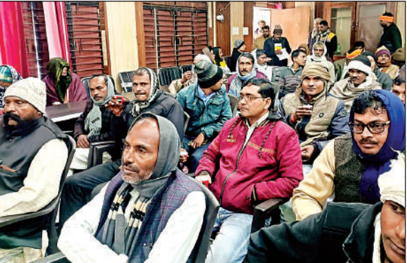
क्षेत्र पंचायत की बैठक में मौजूद प्रधान व बीडीसी सदस्य ।