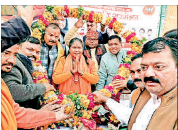
पूर्व केंद्रीय राज्य मंत्री साध्वी निरंजन ज्योति का स्वागत करते भाजपाई।

पूर्व जिलाध्यक्ष कानपुर देहात ने अपने संबोधन में अटल जी को याद करते हुए कहा कि अटल जी की सरलता, सौम्यता और वाकपटुता के सभी मुरीद हुआ करते थे। उन्होंने