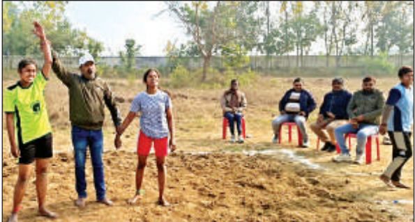
प्रतियोगिता के दौरान प्रतिभाग करते खिलाड़ी।