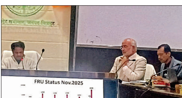
जिला स्वास्थ्य समिति की बैठक में निर्देश देते जिलाधिकारी पुलकित गर्ग। अमृत विचार

अमृत विचार। जिलाधिकारी पुलकित गर्ग ने कहा कि जो एएनएम (आक्सिलियरी नर्सिंग मिडवाइफरी) काम में लापरवाही बरत रही हैं, उनको नोटिस दी जाए। प्रत्येक ब्लॉक स्तर पर अच्छा कार्य करने वाली एएनएम को सम्मानित करें। डीएम ने जिला स्वास्थ्य समिति की बैठक में राष्ट्रीय फाइलरिया उन्मूलन कार्यक्रम के संबंध में निर्देश दिए। जिला मलेरिया अधिकारी ने बताया कि दो फरवरी से 28 फरवरी तक एमडीएम/आईडीए कार्यक्रम संचालित किया जाएगा। फाइलरिया (हाथीपांव) रोग के उन्मूलन हेतु राष्ट्रीय फाइलरिया उन्मूलन कार्यक्रम के अंतर्गत विशेष अभियान चलाया जाएगा। जिलाधिकारी ने मुख्य विकास अधिकारी देवी प्रसाद पाल को निर्देशित किया कि