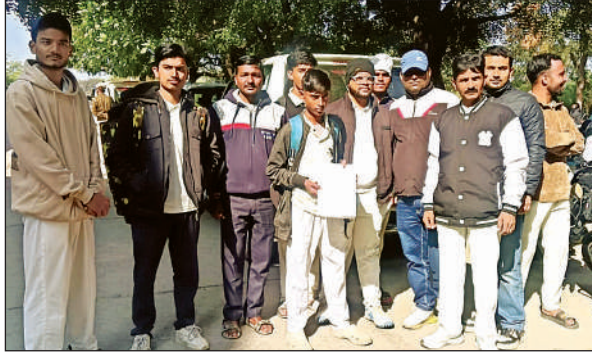
जिलाधिकारी से शिकायत करने पहुंचे खिलाड़ी।

अमृत विचार। एक तरफ शहर में खेल मैदानों में अवैध कब्जा और सरकारी इमारते बन जाने से मैदानों में कमी हुई है, जिससे यहां के खिलाड़ियों को अपने खेल को निखारने के लिए मैदान नहीं मिल रहा है वहीं दूसरी तरफ अब जिला स्पोर्ट्स स्टेडिम में जूनियर व सीनियर क्रिकेट खिलाड़ियों को कोच और जिला क्रीड़ा अधिकारी मैदान में खेलने से रोक रहे हैं साथ ही खेलने के बदले पैसे की मांग की जा रही है, जिससे उन्हें बिना खेल अभ्यास के वापस लौटने को मजबूर होना पड़ रहा है। मंगलवार को शहर के तमाम खिलाड़ियों ने जिलाधिकारी को शिकायती पत्र देकर जिला स्टेडियम में खिलाड़ियों को खेले जाने की मांग की है। जिलाधिकारी को दिए शिकायती पत्र में बताया गया कि शहर में मैदानों की कमी के चलते जूनियर व सीनियर क्रिकेट खिलाड़ी जिला स्टेडियम में अपने खेले का अभ्यास और मैच खेलते हैं, जिसमें कुछ सीनियर खिलाड़ी जूनियर खिलाड़ियों को खेल प्रतिभा देखने के लिए यदाकदा मैच भी खेलते हैं