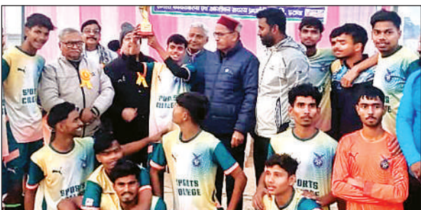
आयोजकों के साथ विजेता टीम के खिलाड़ी ।

प्रतियोगिता के प्रथम मैच में माउंट लिट्द्रा ने फाइनल ब्लेज़ क्लब को 3-0 से पराजित किया। द्वितीय मैच में फ्रेंड्स क्लब व केंद्रीय विद्यालय के मध्य खेला गया। जिसमें फ्रेंड्स क्लब 3-0 से विजयी रही। तीसरे मैच में सेवन हिल्स ने स्टेडियम बी की टीम को 1-0 से पराजित किया। चौथे मैच में सेंट