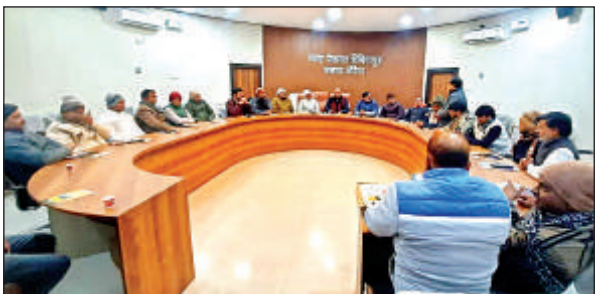
कार्यक्रम के दौरान मौजूद अतिथि।

● विद्वानों ने सेक्युलर शब्द के गलत प्रयोग पर भी चिंता जताई