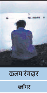
कलम रंगदार ब्लॉगर

वह न तो कोई भिखारिन हैं और न ही कोई ऐसी शरणार्थी, जिसकी ज़िंदगी पूरी तरह बिखर चुकी हो। वह तार्था हालोनेन हैं- फिनलैंड की राष्ट्रपति, जिन्होंने 2000 से 2012 तक देश का नेतृत्व किया।