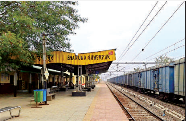
ठंड और कोहरे के चलते सुमेरपुर स्टेशन में पसरा सन्नाटा ।