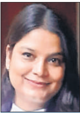
नुरत जहां एजीए हार्कोर्ट लखनऊ बैच

एक ओर राष्ट्रीय प्रतीक का चिन्ह और दूसरी ओर भारत माता का चित्र अंकित किए हुए सिक्के और डाक टिकट भारत के प्रधानमंत्री की ओर से स्मारक के तौर पर राष्ट्रीय स्वयंसेवक संघ की सामाजिक स्थापना के सौ वर्ष पूरे हो जाने के उपलक्ष्य में जारी किया गया। इसका अर्थ है कि राष्ट्रीय स्वयंसेवक संघ, भारत मां के प्रति समर्पित है। भारत की सांस्कृतिक और सामाजिक परंपराओं का संरक्षण व संवर्धन करने, राष्ट्र निर्माण के लिए अनुशासन, देशभक्ति तथा सेवाभाव से निरंतर कार्य करते हुए यह देश ही नहीं, बल्कि विदेशों में भी तेजी से अपनी समृद्धता को विस्तार दे रहा है।