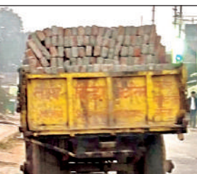
टैक्टर में ले जाई जाती पुरानी ईंटें।

● पुरानी ईंटों की हेराफेरी और मानकों की अनदेखी से जनता में आक्रोश