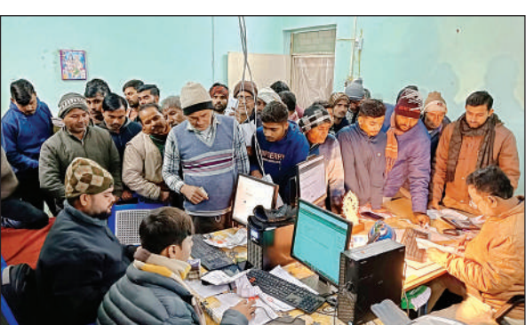
बिजली कार्यालय में बकाया बिल छटवाने के लिये खड़े उपभोक्ता।