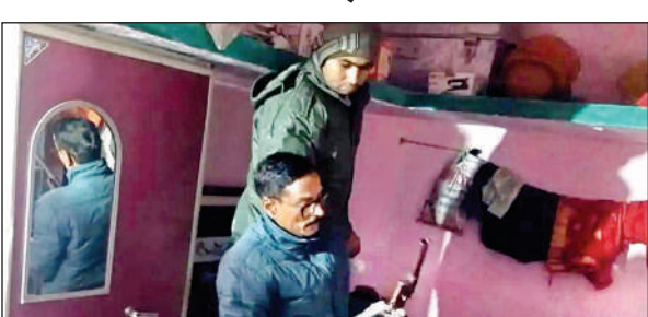
मौके पर जांच-पड़ताल करती पुलिस।