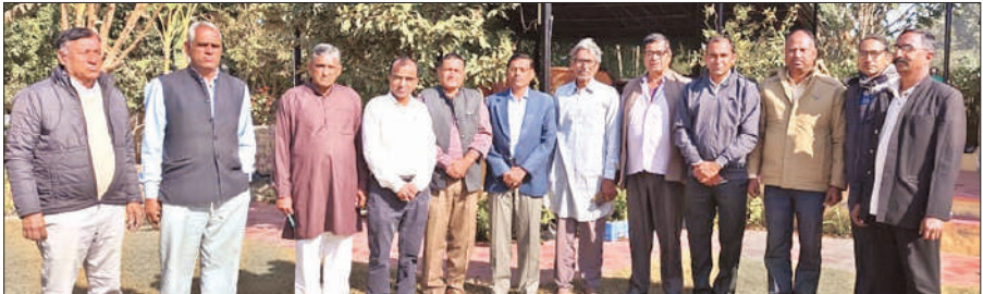
सीएसआईआर सीमैप की टीम के साथ राजस्थान के किसान।