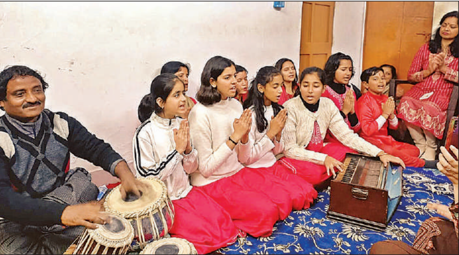
विवेक खंड स्थित संगीत भवन में शास्त्रीय संगीत की सशक्त प्रस्तुति देते नई पीढ़ी के कलाकार।

आलमबाग, विभूतिखंड समिट बिल्डिंग के आस पास समेत प्रमुख 50 स्थलों पर बड़ी संख्या में पुलिस बल तैनात किया जाएगा। ब्रीथ एनेलाइजर से जगह-जगह पुलिस नशे में वाहन चलाने वालों की चेकिंग करेगी। नशे में मिलने पर वाहन चालकों के खिलाफ कार्रवाई की जाएगी। डीसीपी ने बताया कि हुड़दंग रोकने के लिए सभी थानों को अलर्ट कर दिया गया है। करीब 1200 अतिरिक्त पुलिस बल भी सुरक्षा की दृष्टि से लगाया गया है। शॉपिंग मॉल और समिट बिल्डिंग व प्लासियो मॉल के पास सुरक्षा के विशेष इंतजाम किए गए हैं।