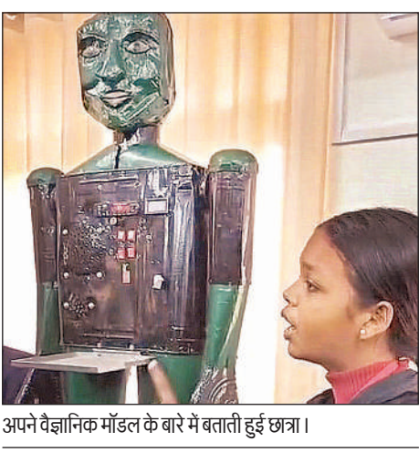
अपने वैज्ञानिक मॉडल के बारे में बताती हुई छात्रा।

डेवलपमेंट प्रोग्राम भी आयोजित किए जाएंगे। एकेटीयू द्वारा नेशनल फॉरेंसिक साइंस यूनिवर्सिटी को इन्वेषेशन, इनक्वैरेशन और उद्यमिता के क्षेत्र में सहयोग दिया जाएगा।