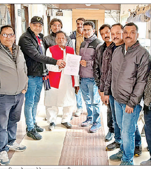
नगर निगम में ज्ञापन देते शराब व्यवसायी।