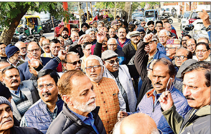
गोमती नगर में यूनाइटेड फोरम ऑफ बैंक यूनियंस के बैनर तले सार्वजनिक क्षेत्र के बैंककर्मियों ने किया प्रदर्शन।