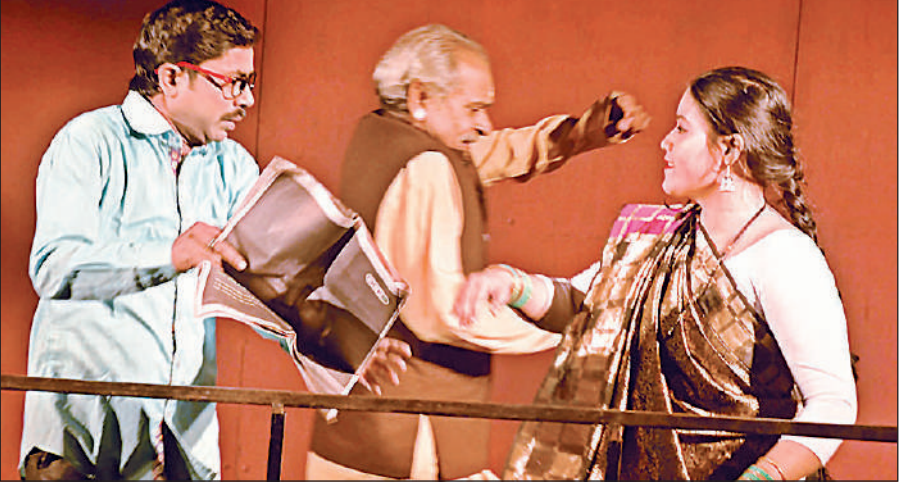
अंतरराष्ट्रीय बौद्ध शोध संस्थान में नाटक अरे शरीफ लोग का मंचन करते कलाकार।