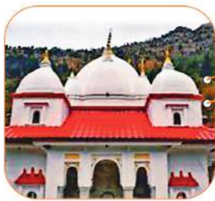
गंगा मंदिर, उत्तरकाशी

— पुष्कर सिंह धामी मुख्यमंत्री, उत्तराखंड