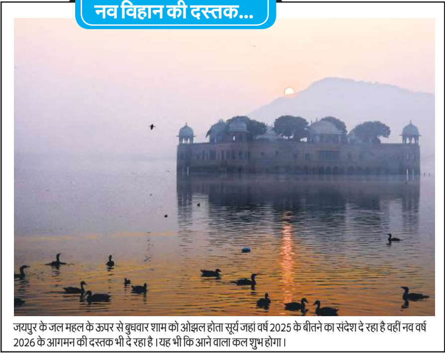
जयपुर के जल महल के ऊपर से बुधवार शाम को ओझल होता सूर्य जहां वर्ष 2025 के बीतने का संदेश दे रहा है वहीं नव वर्ष 2026 के आगमन की दस्तक भी दे रहा है। यह भी कि आने वाला कल शुभ होगा।

बर्लिन। जर्मनी के एक बैंक की छुड़ियों में उस समय खलल पड़ गई जब कुछ चोरों ने एक बड़ी ड्रिल की मदद से बैंक के वॉल्ट में घुसकर तीन करोड़ यूरो (3.5 करोड़ डॉलर) की नकदी, सोना और गहने चुरा लिए। पुलिस और बैंक ने बताया कि पश्चिमी शहर गैल्सकिर्चन में हुई इस घटना में गैंग ने 3,000 से ज्यादा डिपॉजिट बॉक्स तोड़ दिए और लूट का सामान लेकर भाग निकले और अभी भी फरार हैं। मंगलवार को सैकड़ों बैंक ग्राहक ब्रांच के बाहर जमा हो गए और जानकारी की मांग करने लगे।