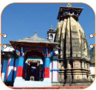
ओंकारेश्वर मंदिर, उखीमठ