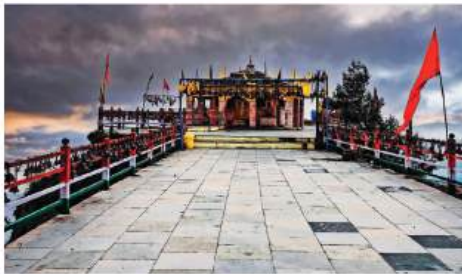
कार्तिक स्वामी मंदिर, भगवान कार्तिक को समर्पित, जिन्हें देश के कुछ हिस्सों में भगवान मुकुंगा / मुसुंग के नाम से जाना जाता है।

इसी तरह, त्रिगुनीनारायण मंदिर, जो रुद्रप्रयाग में स्थित है, भी अत्यंत महत्वपूर्ण है। पौराणिक कथाओं में लिखे यह मंदिर भगवान शिव और माता पार्वती के विवाह स्थल के रूप में जाना जाता है। मंदिर परिसर में लगातार जलती रहने वाली अमृत ज्योति उस दिव्य मिलन का जीवित प्रतीक मानी जाती है, जो पुरे वर्ष भक्तों को आकर्षित करती है।