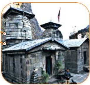
योगेश्वर बड़ी मंदिर, पांडुकेसवर

उत्तराखंड का शीतकालीन चारधाम सर्किट पारंपरिक ग्रीष्मकालीन तीर्थयात्रा को एक सालभर उपलब्ध आध्यात्मिक और पर्यटन अवसर में परिवर्तित करता है। गंगोत्री, यमुनोत्री, केदारनाथ और बदरीनाथ के मुख्य मंदिर जब शीतऋतु के दौरान बंद हो जाते हैं, तो उनके देवताओं की मूर्तियां शीतकालीन गद्दीस्थलों या वैकल्पिक स्थानों पर स्थापित की जाती हैं, जिससे भक्त पूजा-अर्चना जारी रख सकें। हाल के महीनों में, इस सर्किट को नई पहचान तब मिली जब गंगा की शीतकालीन निवासस्थली मुखबा में एक उच्च-स्तरीय यात्रा हुई।