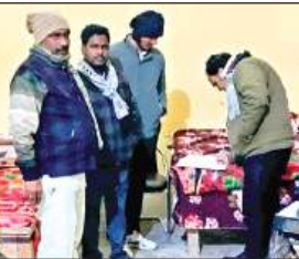
सिकंदरा के रैन बसेरा का निरीक्षण करते तहसीलदार।

कार्यालय संवाददाता, कानपुर देहात: जिलाधिकारी कपिल सिंह के निर्देश पर जनपद में पड़ रही अत्यधिक ठंड एवं शीतलहर को दृष्टिगत रखते हुए तहसीलदार सिकंदरा द्वारा तहसील क्षेत्र अंतर्गत अलाव व्यवस्था एवं रैन बसेरों का निरीक्षण किया गया। निरीक्षण के दौरान तहसीलदार द्वारा रैन बसेरों में उपलब्ध सुविधाओं, साफ-सफाई, प्रकाश, पेयजल एवं ठहरने की व्यवस्थाओं का जायजा लिया गया तथा अलाव जलाए जाने की स्थिति का भी निरीक्षण किया