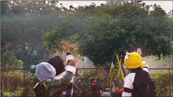
वर्ष 2025 के अंतिम दिन डूबते सूर्य को बाय-बाय करते बच्चे।

अमृत विचार: बीते वर्ष के अंतिम दिन नए साल के स्वागत को लेकर जिले में जबरदस्त उत्साह व उल्लास देखा गया। वर्ष 2025 को विदाई देने और नव वर्ष 2026 की अगवानी के लिए शहर में दिन भर तैयारियों का दौर चलता रहा। रात के 12 बजते ही पूरा शहर 'हैप्पी न्यू ईयर' की धुन से गूंज उठा और लोगों ने एक-दूसरे को बधाई दी। बुधवार को शहर के मुख्य बाजारों व बीडी मार्केट में सुबह से ही रौनक रही। उपहारों (गिफ्ट्स) की दुकानों पर युवाओं व बच्चों की भारी भीड़ रही। शाम ढलते ही शहर के पार्क व पर्यटन स्थल गुलजार हो गए। पार्कों में बच्चों का उत्साह देखते ही बनता था। सूर्यास्त के समय बच्चों ने डूबते सूरज को हाथ हिलाकर अपने अंदाज में वर्ष 2025 को अलविदा कहा। परिवारों के साथ पहुंचे लोगों ने पार्कों में सेल्फी लेकर यादों को संजोया।