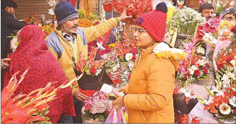
फूल की दुकान पर गुलदस्ता खरीदती युवती।