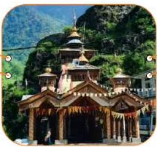
यमुना मंदिर, खरसाली