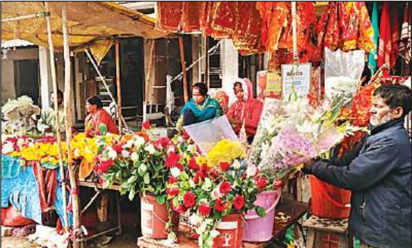
नववर्ष के उपलक्ष्य में फोरलेन पर सजी फूलों की दुकान।