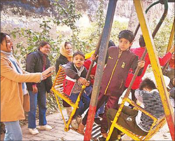
पार्क में बच्चों को झूला झुलाती युवतियां।