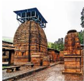
जगेश्वर धाम, 125 से ज्यादा प्राचीन मंदिरों का समूह, जो भगवान शिव को समर्पित है।

प्रधानमंत्री नरेन्द्र मोदी का 9 नवंबर 2025 को देहरादून में दिया गया संबोधन राज्य की आध्यात्मिक संभावनाओं को और मजबूत करता है। उन्होंने उत्तराखंड की प्राकृतिक और सांस्कृतिक शक्ति पर बल देते हुए कहा, 'यदि उत्तराखंड इसे ठान ले, तो कुछ ही वर्षों में यह विश्व की आध्यात्मिक राजधानी के रूप में स्थापित हो सकता है'—उनकी यह टिप्पणी राज्य की बदलती पहचान की संभूतिता को दर्शाती है, जो