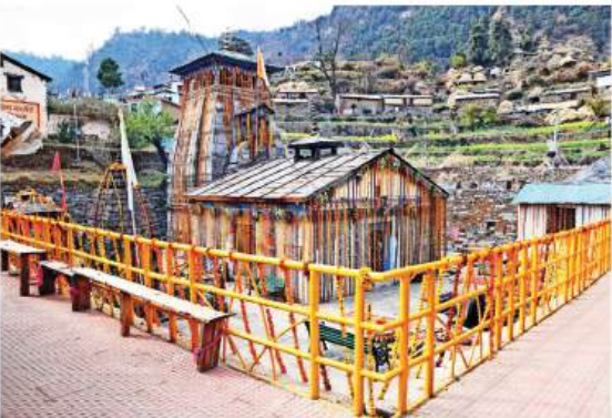
प्रसिद्ध त्रिगुनीनारायण मंदिर, भगवान शिव और पार्वती के विवाह के लिए जाना जाता है और अटूट आस्था और आध्यात्मिक बंधन का प्रतीक है।

प्रधानमंत्री नरेन्द्र मोदी की पहल के बाद उत्तराखंड धीरे-धीरे शादी पर्यटन के लिए एक प्रत्याशित गंतव्य के रूप में उभर रहा है। पीएम मोदी ने राज्य स्थापना दिवस समारोह, 9 नवंबर 2025 को अपने संबोधन में राज्य के प्राकृतिक दृश्य, आध्यात्मिक वातावरण और बढ़ती पर्यटन अवसरचना की क्षमता पर जोर देते हुए कहा कि ये सभी कारक देश और विदेश से वेडिंग पर्यटन को आकर्षित करने में सहायक हैं। प्रधानमंत्री ने उल्लेख किया कि उत्तराखंड पहले ही एक वेडिंग डेस्टिनेशन के रूप में विकसित हो रहा है, जो अपनी पर्वतीय भव्यता, नदियों और शांत घाटियों के प्राकृतिक सौंदर्य पर आधारित है। उन्होंने 'वेड इन इंडिया' पहल के अंतर्गत राज्य की एक विशिष्ट पहचान बनाने का महत्व रेखांकित किया और सुझाव दिया कि उत्तराखंड 5-7 प्रमुख वेडिंग स्थल विकसित