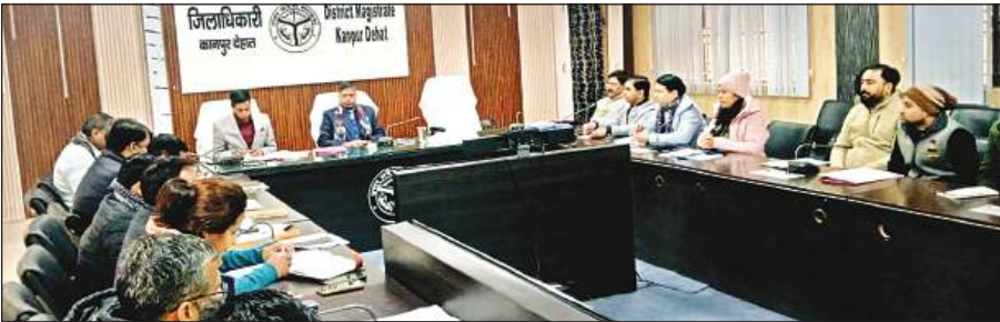
मां मुक्तेश्वरी देवी सभागार में डीएम की अध्यक्षता में हुई बैठक।

बैठक में उपायुक्त स्वतः रोजगार द्वारा विभिन्न विभागों से सहयोग हेतु अपेक्षा की गई। बताया गया कि विभिन्न विभागों में महिलाओं के सशक्तिकरण हेतु जो भी योजनाये संचालित है। उनका लाभ समूह की चिन्हित इन संभावित लखपति दीदियों को प्राथमिकता पर दिए जाने की जरूरत पर जोर दिया गया। उपायुक्त स्वतः रोजगार द्वारा आगामी