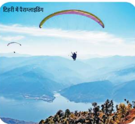
टिहरी में पैराग्लाइडिंग

शीतकालीन चारधाम सर्किट देवप्रतिमाओं को शीतकालीन मंदिरों में स्थापित कर सालभर तीर्थयात्रा को संभव बनाता है, जहां आस्था हिमालयी यात्रा अनुभवों के साथ सुगमता से जुड़ती है। प्रधानमंत्री नरेन्द्र मोदी की मुखबा यात्रा ने शीतकालीन पर्यटन की विशाल संभावनाओं को उजागर किया, जिससे अवसरचना विकास और पर्यटन प्रोत्साहन को नई दिशा मिली। औली, चकराता और दयारा बुग्याल जैसे नजदीकी गंतव्य आध्यात्मिकता, रोमांच और प्रकृति-आधारित अनुभवों को और समृद्ध बनाते हैं।