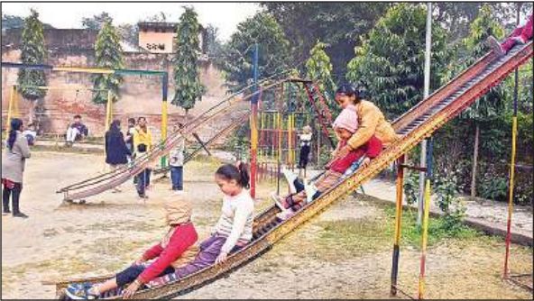
पार्क में झूलों पर मस्ती करते बच्चे।

शुक्लागंज उन्नाव, अमृत विचार: नववर्ष सभी के लिए मंगलमय हो, यह सभी के लिए खुशियां लेकर आये, इन्हीं के मद्देनजर नगर में कई दुकानों को सजाया गया। जिसमें केक व गिफ्ट आइटमों की दुकानों पर भारी भीड़ रही। लोगों को गिफ्ट आइटम की खरीददारी करते हुए देखा गया, जिससे बच्चों व युवाओं ने बंद-बंद कर हिस्सा लिया। मैसेज कार्ड, मोबाइल, प्लावर, ग्रीटिंग कार्ड्स, चाकलेट, केक व गिफ्ट खूब बिके। वहीं दूसरी तरफ बियर शाप व अंग्रेजी शराब की दुकानों पर भी लम्बी कतारें देखी गयीं। लोगों ने समय रहते अपनी तैयारियां पूरी कर ली, ताकि रात्रि 12 बजे से एक दूसरे को बधाईयां व संदेश आदि भेजे जा सकें। वहीं दूसरी तरफ युवाओं ने देर रात तक पार्टी करने का मन बनाया है। जहां बारह बजते ही लोग घरों और दुकानों में झूमते हुये नये वर्ष का स्वागत करने के लिये डेढ़ रहे। वहीं लोग घरों में ही नये वर्ष को धूमधाम से मनाने के लिये परिवार के साथ केक काटा।