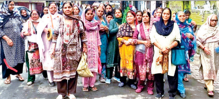
दसवें गुरु गोविंद सिंह के प्रकाश पर्व के अवसर पर हल्द्वानी में प्रभात फेरी के दौरान मौजूद संगत।