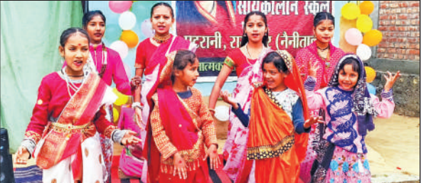
वार्षिकोत्सव में सांस्कृतिक कार्यक्रम प्रस्तुत करते स्कूली बच्चे ।

अमृत विचार: रचनात्मक शिक्षक मंडल की पहल पर पटरानी में चल रहे सावित्रीबाई फुले सायंकालीन स्कूल के वार्षिकोत्सव में बच्चों ने रंगारंग कार्यक्रम प्रस्तुत किए। इस दौरान खेलकूद प्रतियोगिताएं भी हुईं। कार्यक्रम की शुरुआत वरिष्ठ रंगकर्मी सफ्दर को उनके शहादत दिवस पर उनके लिखे गीत पढ़ना लिखना सीखो ओ मेहनत करने वालों के सामूहिक वाचन के साथ हुई। बता दें कि इस विद्यालय में अत्यंत निर्धन परिवारों के बच्चे शिक्षा ग्रहण करते हैं। देश की पहली महिला शिक्षिका के रूप में जानी जाने वाली सावित्रीबाई