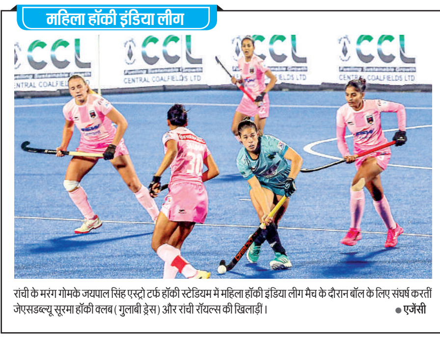
रांची के मरंग गोमक जयपाल सिंह पस्ट्रो टर्फ हॉकी स्टेडियम में महिला हॉकी इंडिया लीग मैच के दौरान बॉल के लिए संघर्ष करती जेएसडब्ल्यू सूरमा हॉकी क्लब (गुलाबी ड्रेस) और रांची रॉयल्स की खिलाड़ी।

वाराणसी। काशी अब खेल की दुनिया में नया इतिहास रचने को तैयार है। सिगरा स्थित नवनिर्मित डॉ संपूर्णानंद स्पोर्ट्स स्टेडियम में चार जनवरी से 11 जनवरी तक 72वीं सीनियर नेशनल वॉलीबॉल चैंपियनशिप का भव्य आयोजन होने जा रहा है। काशी के इतिहास में यह पहली बार है जब इतने बड़े स्तर की नेशनल चैंपियनशिप आयोजित हो रही है। इस ऐतिहासिक प्रतियोगिता का वर्चुअल उद्घाटन प्रधानमंत्री नरेंद्र मोदी करेंगे, जबकि मुख्यमंत्री योगी आदित्यनाथ भौतिक रूप से उपस्थित रहकर खिलाड़ियों का उत्साहवर्धन करेंगे।