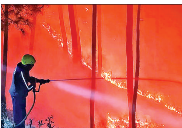
अल्मोड़ा के जंगलों में धधकी आग को बुझाते फायर कर्मी।

दरअसल, लंबे समय से बारिश नहीं होने से जंगलों में भी नमी समाप्त हो गई है। इस कारण इन दिनों वनाग्नि की घटनाएं लगातार बढ़ रही हैं। शुक्रवार को अल्मोड़ा नगर से सटे बख, सरसों समेत क्वारब और बिनसर के जंगल आग से धधक उठे। देखते ही देखते आग की लपटों ने विकराल रूप धारण कर लिया। स्थानीय ग्रामीणों वनाग्नि की सूचना फायर सर्विस को दी। जिसके बाद मौके पर पहुंची फायर सर्विस की टीम ने आग पर काबू पाना शुरू किया।