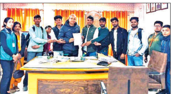
खटीमा में प्राचार्य को ज्ञापन सौंपते छात्रसंघ के पदाधिकारी।