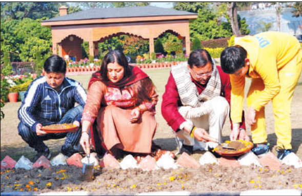
शासकीय आवास में सपरिवार ट्यूलिप के बल्ब रोपने मुख्यमंत्री पुष्कर सिंह धामी।