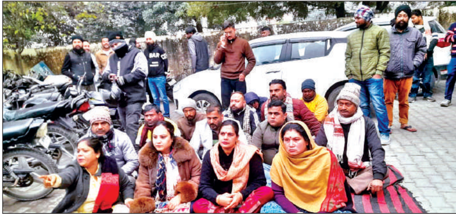
आवास विकास चौकी में धरना देते कांग्रेस कार्यकर्ता।