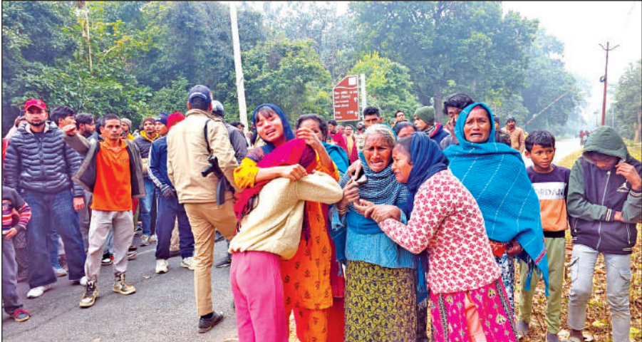
रामनगर में बाघ के हमले की शिकार महिला के बिलखते परिजन और मौके पर मौजूद अन्य ग्रामीण ।