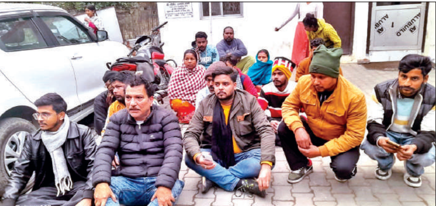
आवास विकास चौकी में धरना देते भाजपा नेता।