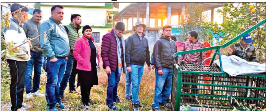
अल्मोड़ा के मल्ला जोशीखोला में वन विभाग ने पिंजरा लगाया। ● अमृत विचार

गुरुवार को देर शाम शहर के मल्ला जोशीखोला की गलियों में एक साथ दो गुलदार बेखौफ चहलकदमी करते हुए सीसीटीवी में कैद हो गए। गुलदार की चहलकदमी देख लोगों में दहशत का माहौल है।