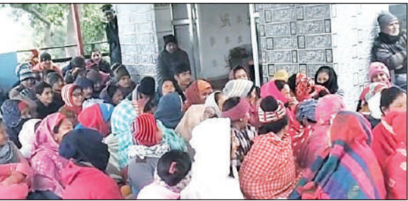
नशाखोरी के खिलाफ शीशम भुजिया गांव में बैठक करते ग्रामीण।