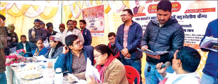
ओखलकांडा में आयोजित किए गए बहुउद्देशीय शिविर में जनता की समस्याओं को सुनते अधिकारी व जनप्रतिनिधि।