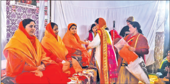
सत्संग के दौरान साध्वियों की आरती करती महिला ।