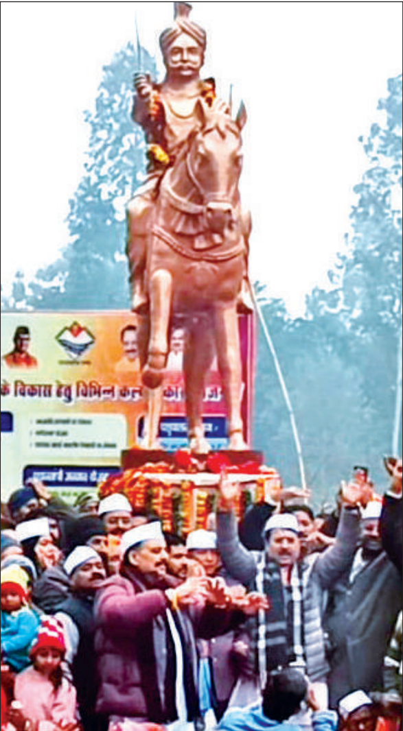
राजा जगत देव की प्रतिमा का अनावरण करते जनप्रतिनिधि।