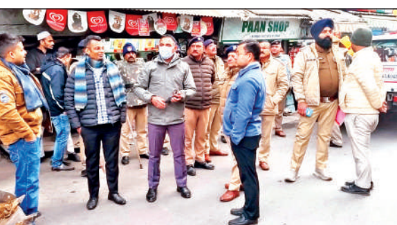
ताज चौराहे के पास वनभूलपुरा क्षेत्र में किए गए अतिक्रमण को तुड़वाते सिटी मजिस्ट्रेट और नगर आयुक्त साथ खड़ी पुलिस फोर्स। ● अमृत विचार

14 हजार का चालान, तीन गाड़ी सामान जब्त हल्द्वानी, अमृत विचार : नगर निगम, जिला प्रशासन और पुलिस ने शुक्रवार को संयुक्त रूप से अतिक्रमण के विरुद्ध कार्यवाही की। अभियान के तहत ताज चौराहा से लाइन नंबर 1 में अतिक्रमण के खिलाफ अभियान चलाया गया। जिस दौरान गंदगी पर 14 हजार की चालानी कार्यवाही की गई। साथ ही 3 गाड़ी सामान जब्त किया गया। इस दौरान निगम की टीम ने नाली पर किए गए अतिक्रमण कर बनाई गए सात निर्माण ध्वस्त किए। अभियान में नगर आयुक्त परितोष वर्मा के साथ एसपी सिटी मनोज कात्याल, सिटी मजिस्ट्रेट गोपाल सिंह चौहान, एसडीएम राहुल शाह और अन्य मौजूद रहे। नगर आयुक्त ने बताया कि शहर में किसी भी तरह का अतिक्रमण नहीं होने दिया जाएगा। उन्होंने कहा कि अतिक्रमण के विरुद्ध आगे भी कार्यवाई जारी रहेगी।