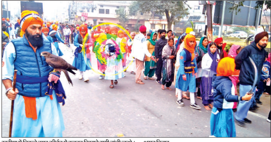
खटीमा में निकले नगर कीर्तन में करतब दिखाते रागी ढांडी जत्थे।

अमृत विचार: गुरु गोविंद सिंह के प्रकाश पर्व पर पंज प्यारों की अगुआई में नगर के मुख्य मार्गों से नगर कीर्तन निकला। इस दौरान “ वाहे गुरुजी का खालसा, वाहे गुरुजी की फतह...” से वातावरण गुंज उठा। नगर कीर्तन में रागी ढांडी जत्थे हैरत अंग्रेज करतब दिखा रहे थे। वहीं स्कूली बच्चे अपनी प्रस्तुतियां दे रहे थे। गुरु गोविंद सिंह के प्रकाश पर्व को लेकर सुबह से ही गुरुद्वारे में संगत जुटनी शुरू हो गई थी। गुरुद्वारे में आयोजित अखंड पाठ के भोग के उपरांत विशाल लंगर का आयोजन किया गया। बाद में