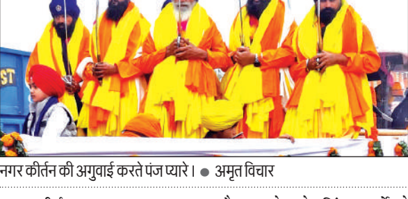
नगर कीर्तन की अगुवाई करते पंज प्यारे।

अमृत विचार: आओ नगर कीर्तन दे दर्शन पाइए...। जो बोले सो निहाल, सतश्री अकाल के जयकारों के बीच 10वें गुरु श्री गुरु गोविंद सिंह के प्रकाशोत्सव पर मैनाझुण्डी और आसपास के गांवों समेत यूपी में नगर कीर्तन निकाला गया। गुरुग्रंथ साहिब की छत्र छाया में पंज प्यारों की अगुवाई में नगर कीर्तन का संगत ने पुष्प वर्षा कर स्वागत किया। संगत ने गुरुग्रंथ साहिब को मत्था टेककर सुख, समृद्धि की कामना की। श्री गुरु गोविंद सिंह के प्रकाशपर्व के उपलक्ष्य में शुक्रवार को गुरुद्वारा सिंह सभा मैनाझुंडी से नगर कीर्तन निकाला गया। इससे पहले बुधवार को रखे गे श्री अखण्ड पाठ साहिब का भोग पड़ा। यहां अरदास के बाद