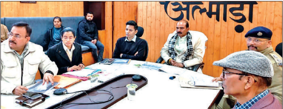
अल्मोड़ा में शुक्रवार को केंद्रीय राज्य मंत्री टट्टा ने सड़क सुरक्षा समिति की बैठक ली।

कलेक्ट्रेट में आयोजित बैठक में केंद्रीय राज्य मंत्री टट्टा ने कहा कि सड़क दुर्घटनाओं में कमी लाना सरकार की प्राथमिकता है। इसके लिए सड़क के डिजाइन व आवश्यक कार्यों के लिए जरूरी दिशा निर्देश दी। कहा कि सड़क सुरक्षा केवल प्रशासन की जिम्मेदारी नहीं है, बल्कि इसके लिए जनसहभागिता भी अत्यंत आवश्यक है। उन्होंने अधिकारियों को निर्देश दिए कि सड़क निर्माण से संबंधित जो भी आगणन बनाए जाते हैं, उन्हें दीर्घकाल के लिए तैयार करें। उन्होंने कहा भारत सरकार राज्य में सड़कों के निर्माण के लिए प्रतिबद्ध है। बैठक में जिले में घटित सड़क