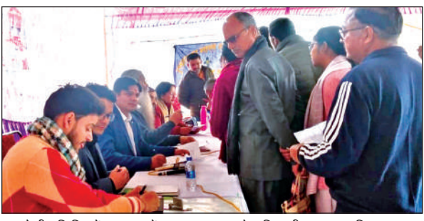
बहुउद्देशीय शिविर में समस्याओं का समाधान करते अधिकारी।

विभागीय सेवाओं एवं योजनाओं से लाभान्वित हुए। इसके साथ ही 24 लोगों के आधार कार्ड संशोधन एवं यूसीसी पंजीकरण से संबंधित प्रकरणों पर भी कार्यवाही की गई। कैंप के दौरान विभिन्न प्रकार के प्रमाण पत्र बनाने के लिए 180 लोगों ने आवेदन किए।