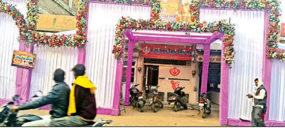
प्रकाश उत्सव पर सजाया गया गुरुद्वारा।

प्रकाश उत्सव को लेकर प्रतिदिन सुबह साढ़े छह बजे प्रभात फेरी निकल रही है। गुरुद्वारा में प्रतिदिन सबद-कीर्तन चल रहा है। गुरुद्वारा में पंजाब से आया जत्था सबद-कीर्तन कर रहा है, जहां पर सिख समुदाय के लोग पहुंच रहे हैं। गुरुद्वारा में भी बिजली की आकर्षक