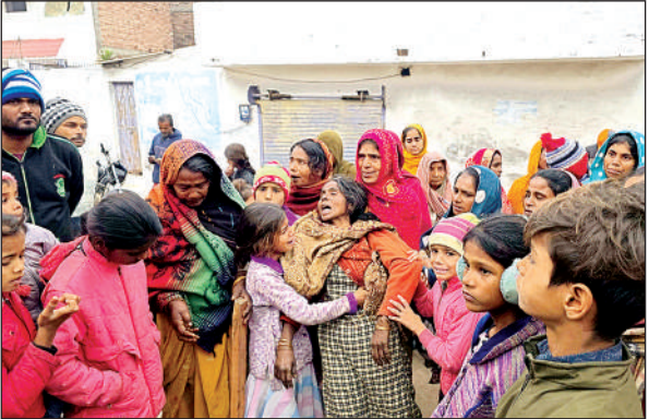
युवक की मौत पर रोते-बिलखते परिजन ।

इंटर कॉलेज में कक्षा ग्यारह का छात्र था, मृतक चार भाईयों में सबसे छोटा था। मौदहा कोतवाली पुलिस ने शव का पंचनामा भरकर पोस्टमार्टम के लिए भेजा है।