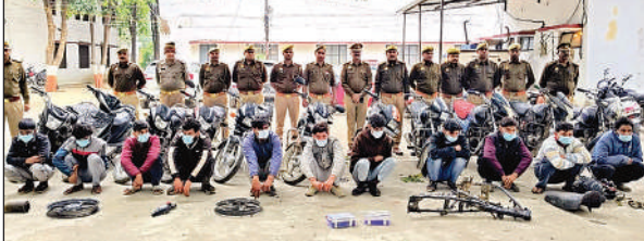
पुलिस गिरफ्त में पकड़े गए वाहन चोरी के आरोपी।