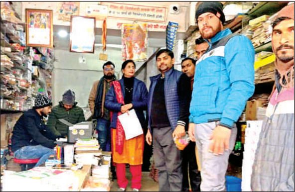
बाल विवाह के प्रति लोगों को जागरूक करते टीम के सदस्य ।

भारत में 100 दिवसीय ‘बाल विवाह मुक्त भारत’ अभियान प्रस्तावित है, जिसके अंतर्गत द्वितीय चरण में 01 से 31 तक प्रस्तावित है। जिसके अंतर्गत धार्मिक स्थल, विवाह संबंधी सेवाप्रदाताओं जागरूक किया जाना है। शुक्रवार को जनपद मुख्यालय में हब फॉर इम्प्लायमेंट ऑफ वूमेन टीम, जिला सेवा विधिक प्राधिकरण एवं कोतवाली द्वारा समन्वय स्थापित करते हुए जिला मुख्यालय के मुख धार्मिक स्थल/विवाह संबंधी सेवा प्रदाता को बाल विवाह निषेध