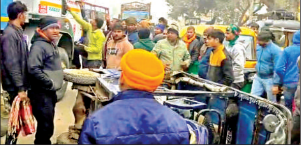
हादसे के बाद पलटा पड़ा ई रिक्शा और लगी भीड़ ।