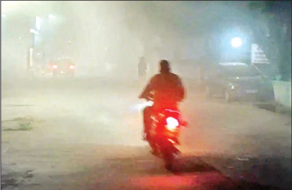
कोहरे के दौरान वाहनों से पुंजुरते लोग।

पिछले एक सप्ताह से कड़ाके की सर्दी पड़ रही है। खासकर बीते दो दिनों से गलन और अधिक बढ़ गई है। गुरुवार से शुक्रवार तक घने कोहरे की चादर ने पूरे जिले को अपने आगोश में ले लिया। कोहरे के कारण हाईवे और ग्रामीण सड़कों पर वाहन ककों को भारी परेशानी