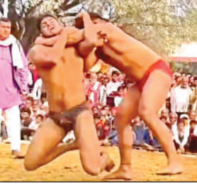
दंगल में दांव दिखाते पहलवान।

दंगल में प्रदेश के साथ अन्य राज्यों के पहलवानों ने भी हिस्सा लिया और अपनी कुश्ती कला का आनंद लिया। दंगल देखने के लिए ग्रामीणों की खासी भीड़ जुटी। दंगल में पहलवानों ने अपने दांव-पेंच से विरोधियों को धूल चटाई।