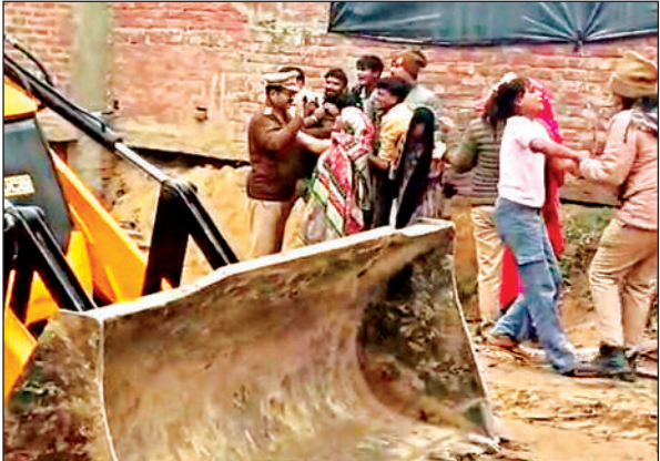
जमीन को कराया जाता कब्जा मुक्त।