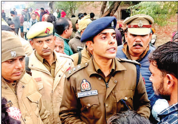
मौके पर जांच पड़ताल करते सीओ।