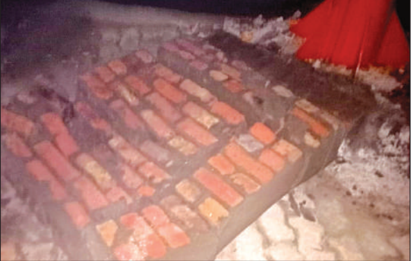
क्षतिग्रस्त किया गया शिलालेख।

जिलाधिकारी ने किसान सम्मान निधि से लाभान्वित होने वाले कृषक बन्धुओ के सत्यापन पर जोर देते हुए निर्देश दिए कि शासन द्वारा निर्धारित