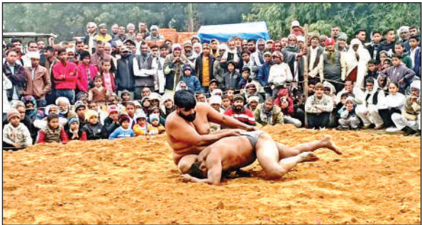
दंगल में प्रतिद्वंद्वी को चित करने का प्रयास करता पहलवान ।