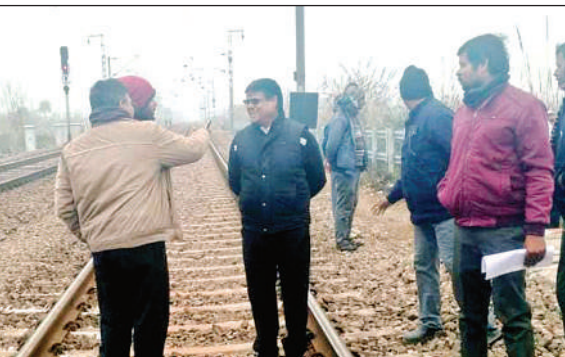
सर्वे करते अधिकारी।

अमृत विचार। कानपुर-इटवा रेल सेक्शन पर स्थित अछल्दा में प्रस्तावित बाईपास ओवरब्रिज के निर्माण को लेकर शुक्रवार दोपहर करीब एक बजे विभिन्न विभागों की संयुक्त टीम ने विस्तृत स्थल सर्वे किया। इस टीम में रेलवे और सेतु निगम के अधिकारी शामिल थे। संयुक्त टीम ने फफूंद सड़क से आदर्श इंटर कॉलेज के पीछे, इनायतपुर गांव के बगल से गुजरते हुए निचली गंग नहर पुल तक प्रस्तावित मार्ग का निरीक्षण किया। अधिकारियों ने रेलवे खंबा संख्या 1116 से 1117 के बीच ओवरब्रिज की एलाइनमेंट तय करने के लिए नक्शे के अनुसार मौके पर तकनीकी बिंदुओं का परीक्षण किया। प्रस्तावित बाईपास ओवरब्रिज की कुल लंबाई लगभग 1.8 किलोमीटर होगी। यह ओवरब्रिज आदर्श इंटर कॉलेज