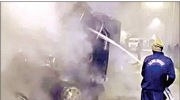
कंटेनर की आग बुझाते दमकल कर्मी।