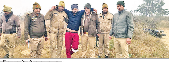
पुलिस मुठभेड़ में घायल बदमाश।