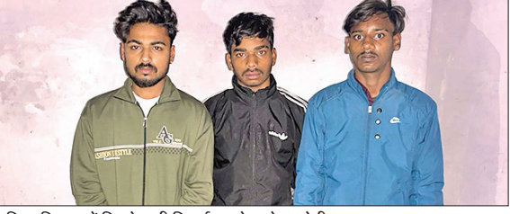
पुलिस गिरफ्त में किशोर की पिटाई करने वाले आरोपी।