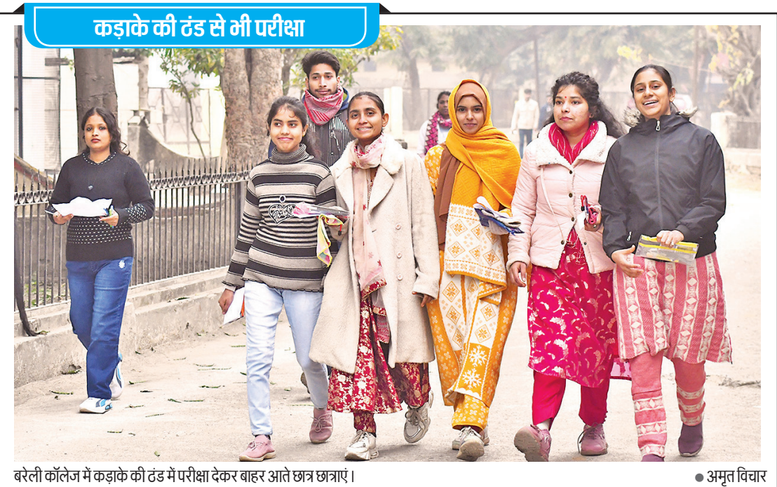
बरेली कॉलेज में कड़ाके की ठंड में परीक्षा देकर बाहर आते छात्र छात्राएं।