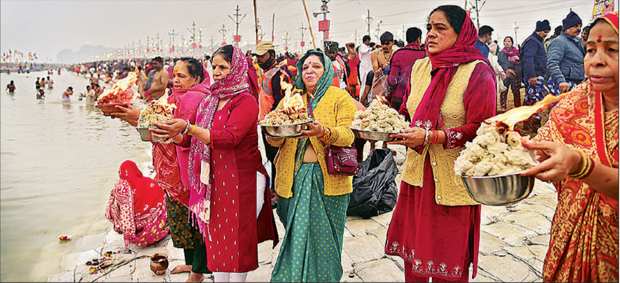
पौष पूर्णिमा पर प्रयागराज में संगम तट पर कड़ाके की ठंड और गलन के बावजूद पवित्र स्नान के बाद पूजा-अर्चना करते श्रद्धालु।