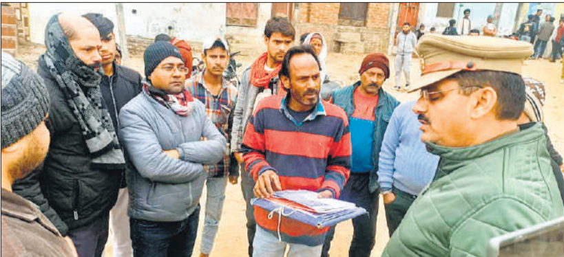
पुलिस के सामने जमीन पर अपना दावा जताते लोग ।