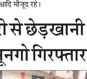
आरोपी को गिरफ्तार कर ले जाती पुलिस।