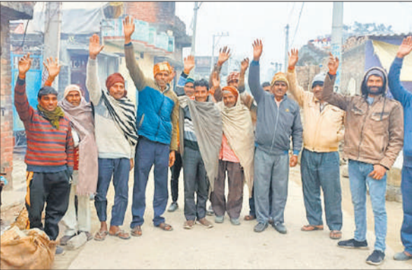
मसवासी के कुंदनपुर गांव में प्रदर्शन करते ग्रामीण ।

ग्रामीणों का आरोप है कि मुख्य मार्गों पर प्रशासन की सख्ती के बाद खनन माफिया ने गांव के अंदरूनी कच्चे रास्तों को अपना सुरक्षित कॉरिडोर बना लिया है। रहमतगंज की ओर से तेज रफ्तार से गुजरते भारी वाहन न सिर्फ सड़कों को तहस-नहस कर रहे हैं, बल्कि ग्रामीणों की जान को भी खतरे में