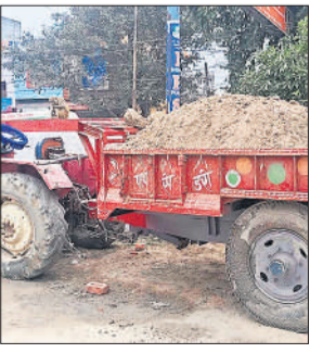
कोतवाली में खड़ी ट्रैक्टर-ट्रॉली।

यह अवैध कारोबार थमने का नाम नहीं ले रहा है। ग्रामीणों का कहना है कि भारी वाहनों के चलने से रास्ते खराब हो रहे हैं। पुलिस ने पकड़े गए वाहनों को कोतवाली में खड़ा किया है।