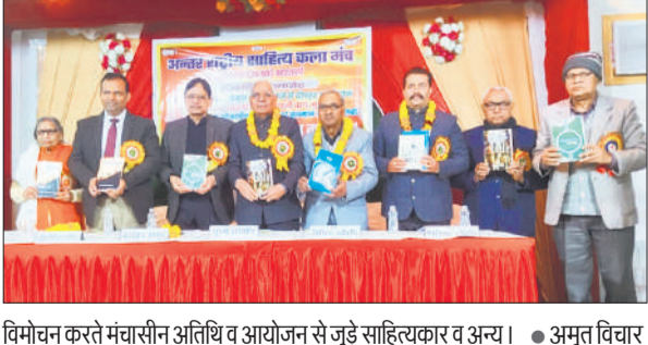
विमोचन करते मंचासीन अतिथि व आयोजन से जुड़े साहित्यकार व अन्य।