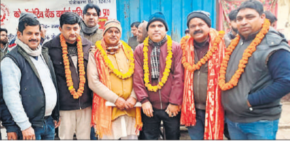
वृद्धाश्रम में स्थापना दिवस के मौके पर संगठन के पदाधिकारी ।