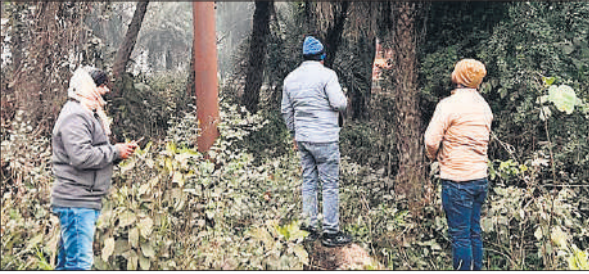
टांडा बाजपुर मार्ग के किनारे पेड़ों में हाईटेंशन लाइन में फाल्ट ढूंढते बिजली कर्मी ।