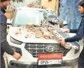
कार के ऊपर गिरा छज्जा का मलबा ।

शनिवार सुबह सिविल जज अपनी गाड़ी से न्यायालय पहुंचे थे। वाहन से उतरकर वह कोर्ट में बैठ गए, जबकि चालक ने गाड़ी जज साहब के चैंबर के आगे खड़ी कर दी। कुछ ही देर बाद अचानक बिल्डिंग का छज्जा भरभराकर सीधे गाड़ी के ऊपर आ गिरा। सिविल कोर्ट और सीओ कार्यालय एक ही बिल्डिंग में हैं। पूरी इमारत जर्जर और गिरताऊ हालत में है। जर्जर बिल्डिंग की छत पर बंदर भी उछल कूद करते रहते हैं जिससे हर समय