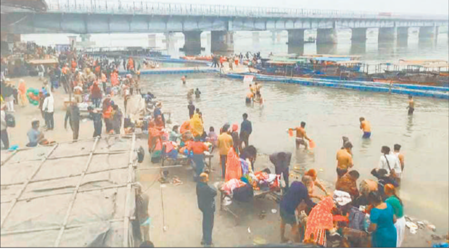
पूर्णिमा पर गंगा में स्नान करते श्रद्धालु।

कड़ाके की ठंड में शनिवार सुबह से ही निजी वाहन, रोडवेज बसों आदि साधनों से श्रद्धालु वृजघाट व तिगरी धाम पहुंचने लगे। गंगा घाटों पर श्रद्धालुओं की भीड़ जुटनी शुरू हो गई। हर-हर गंगे के उद्घोष के साथ गंगा स्नान किया। स्नान के बाद श्रद्धालुओं ने सूर्य को अर्घ्य देकर पूजा की। अमरोहा के साथ ही मुरादाबाद, संभल, बिजनौर, मेरठ, बुलंदशहर, गाजियाबाद, रामपुर आदि जिलों से