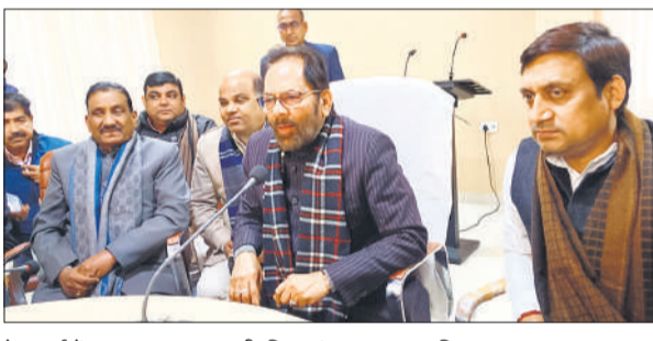
प्रेसवार्ता में मुख्तार अब्बास नकवी, जिला पंचायत अध्यक्ष, जिलाध्यक्ष व अन्य।

अमृत विचार : तीन दिन के रामपुर प्रवास के दौरान शनिवार को पूर्व केंद्रीय कैबिनेट मंत्री व वरिष्ठ भाजपा नेता मुख्तार अब्बास नकवी संत शिरोमणि रविदास सर्किट हाउस पहुंचे। जहां उन्होंने मीडिया से बात करते हुए कहा कि भाजपा के जीत की गिनती विपक्ष के हार का गणित बनता जा रहा है। आज देश में चुनावी मशीनरी को किक मारकर चुनाव मैदान नहीं जीता जा सकता है। उन्होंने कहा कि सत्तालोलुप सुलतानों की संवैधानिक संस्थानों की सामन्ती लिंचिंग की सनक-साजिश उनका सियासी सूपड़ा साफ कर रही है। भाजपा के जीत की गिनती विपक्ष के हार का गणित बनता जा रहा है। कहा कि बांग्लादेश में जुल्म का जर्मीदोज होना मुल्क, मानवता और किसी भी मजहब को महफूज और मजबूत रखने के लिए जरूरी है। बांग्लादेश में चल रही अल्पसंख्यकों के साथ अराजकता और अपराध मानवीय मूल्यों के कत्लेआम की