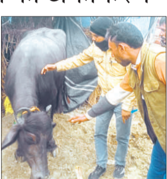
गौहत गांव में पशुओं का टीकाकरण करती टीम ।