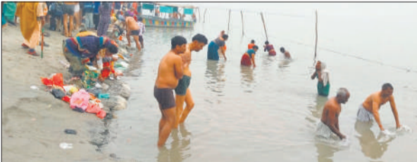
राजघाट गंगा तट पर गंगा स्नान करते श्रद्धालु ।

बबराला,अमृत विचार: पौष पूर्णिमा पर राजघाट सहित साधु मढ़ी आश्रम, सिसौना डांडा, ईसमपुर डांडा और असदपुर गंगा घाटों पर श्रद्धालुओं का सैलाब उमड़ पड़ा। आसपास से आए हजारों श्रद्धालुओं ने हाड़ कंपाती ठंड के बावजूद गंगा में स्नान किया।