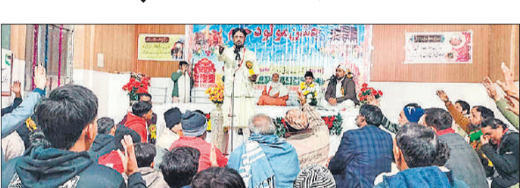
सिरसी में महफिल में कलाम पेश करते शायर ।