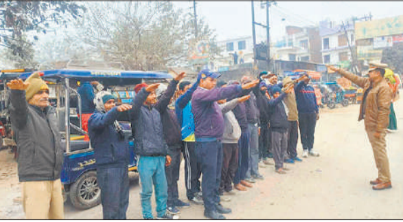
यातायात नियमों की शपथ दिलाते उपनिरीक्षक।