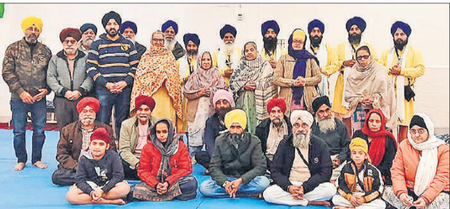
गुरुद्वारा गुरु नानक दरबार में अमृत छकने के बाद मौजूद संगत।