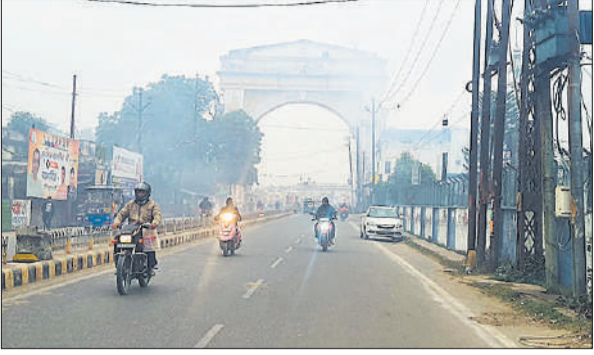
कोहरे के बीच हेड लाइट जलाकर जाते बाइक सवार ।

सर्वोच्च प्राथमिकता देते हुए जनपद रामपुर के समस्त थाना क्षेत्रों में मिशन शक्ति केंद्र की टीमों एवं जनपद स्तरीय टीम द्वारा व्यापक जागरुकता अभियान चलाया गया। थाना-स्तरीय टीमों घरेलू थाना क्षेत्रानर्गत बाजारों, शॉपिंग मॉल, पार्क एवं सार्वजनिक स्थलों पर जाकर महिलाओं एवं बालिकाओं को सुरक्षा से जुड़े विभिन्न महत्वपूर्ण विषयों पर जागरूक किया। महिला सुरक्षा एवं आत्मरक्षा से जुड़े उपाय, अधिकार, नारी सम्मान से संबंधित प्रावधान एवं हेल्पलाइन सेवाओं 1090, 181, 112, 1098 चाइल्ड हेल्पलाइन की कार्यप्रणाली एवं उपयोगिता तथा घरेलू हिंसा, ऑनलाइन उत्पीड़न तथा इनके खिलाफ कार्रवाई की प्रक्रिया बताई। मिशन शक्ति टीम द्वारा महिलाओं व बालिकाओं को पंपलेट, कॉमिक्स एवं जागरुकता सामग्री वितरित की।