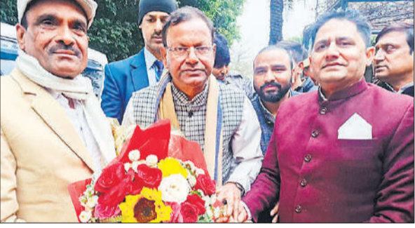
प्रदेश अध्यक्ष का स्वागत करते लोग।