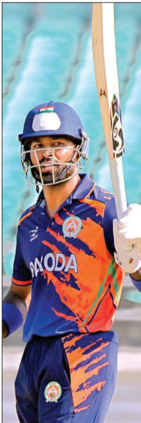
हार्दिक पंड्या।