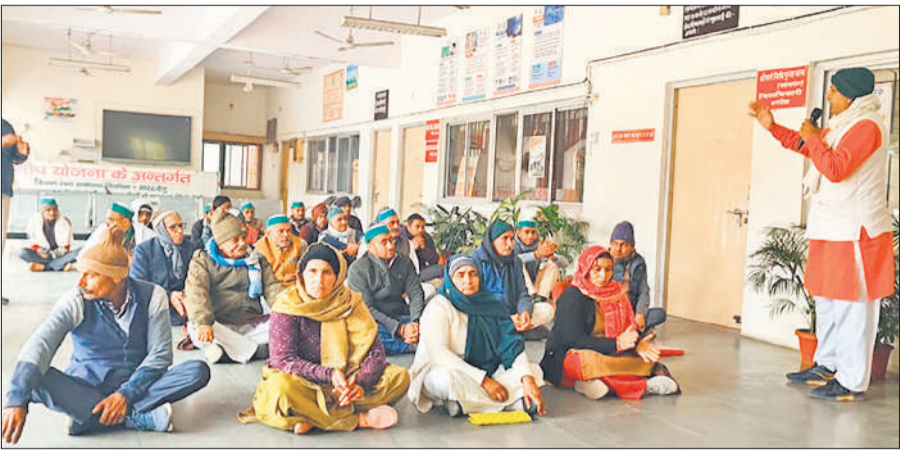
कलेक्ट्रेट पर धरना प्रदर्शन करते भाकियू शंकर के सदस्य।