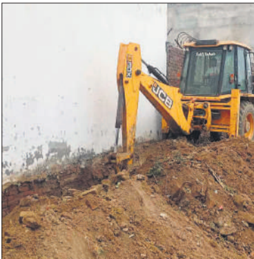
ट्रस्ट की भूमि पर नींव खोदती जेसीबी ।