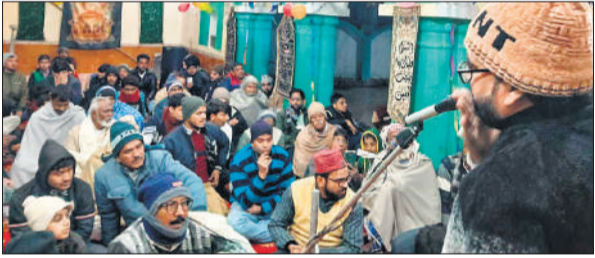
कलामपेश करते शायर।