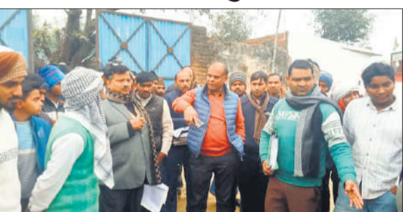
मातीपुर गांव में ग्राम प्रधान पर लगे आरोपों की जांच करते अधिकारी । ● अमृत विचार

दावा किया कि यह उनके बुजुर्गों की भूमि है इस पर बेवजह कब्जा किया जा रहा है।