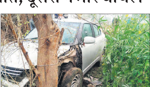
रजपुरा में पेड़ से टकराई कार ।